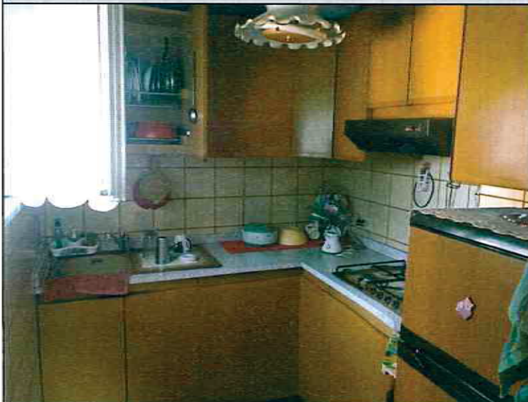
Vista della cucina