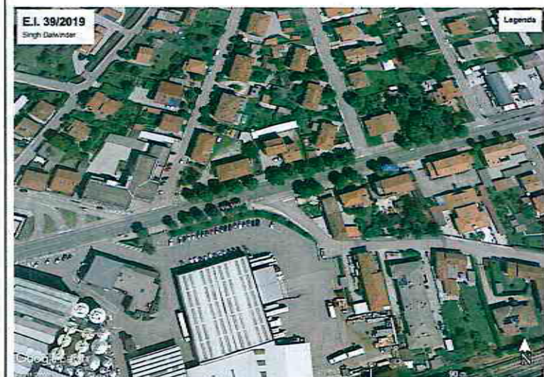
Vista dell'immobile in corrispondenza della strada