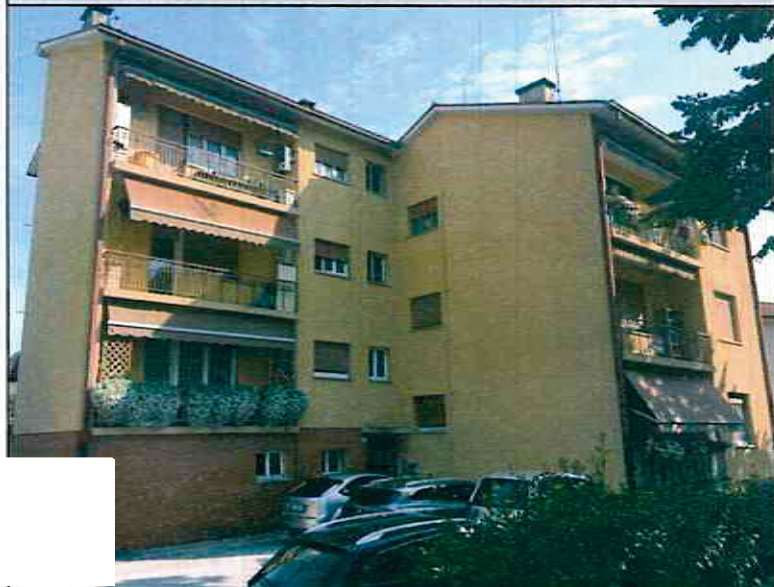
Vista dell'immobile in corrispondenza della strada