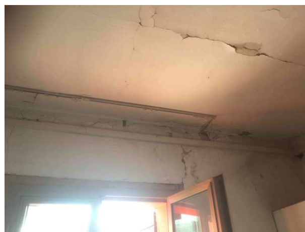
Particolare traccia umidità