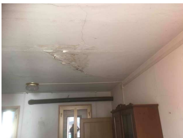
Particolare traccia umidità