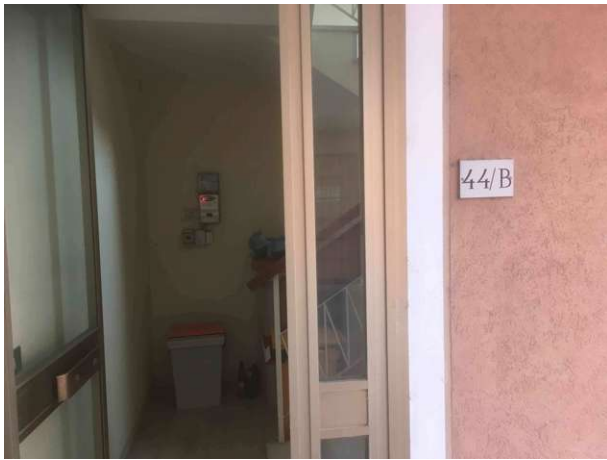
Veduta esterna accesso