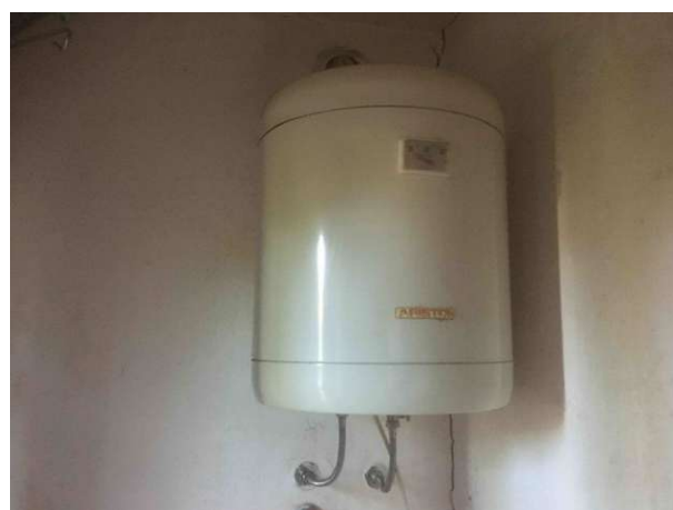
Particolare boiler in bagno