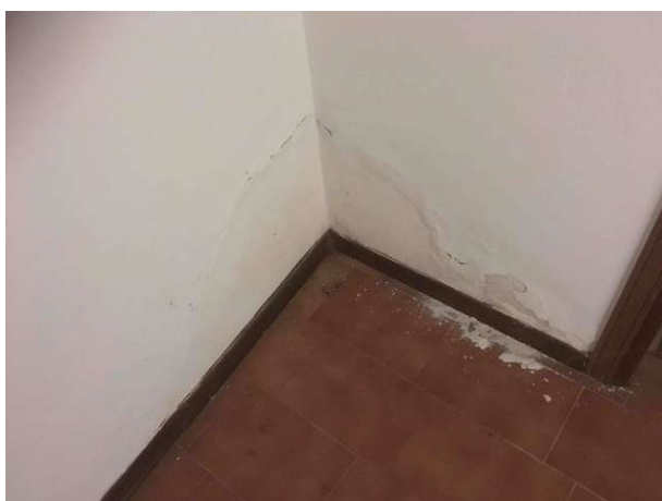
Particolare traccia umidità