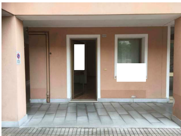
Veduta esterna accesso