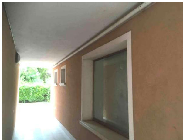
Veduta esterna laterale