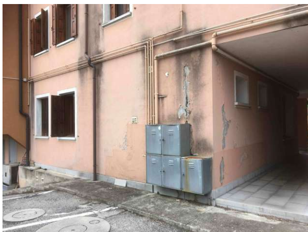
Veduta esterna lato retro