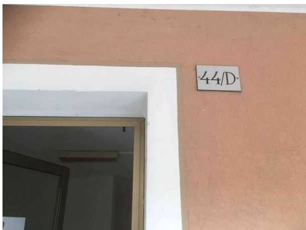
Veduta esterna accesso