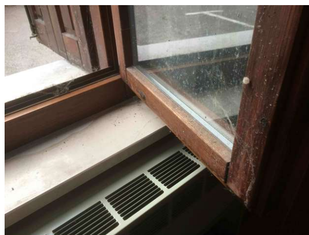
Particolare serramento esterno