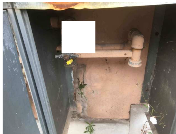
Veduta nicchia contatore rete gas