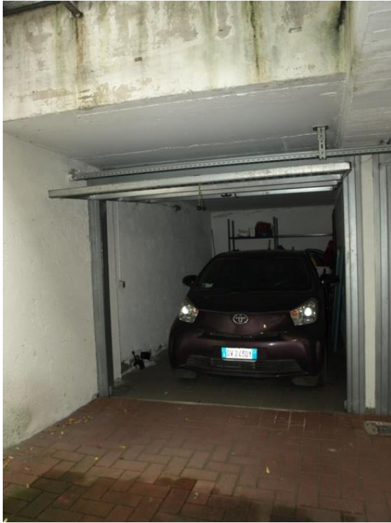
BOX AUTORIMESSA SUB 713

Via Ambrogio Figino n°2 Appartamento piano T + locale cantina S1 + box autorimessa pertinenziale + box autorimessa