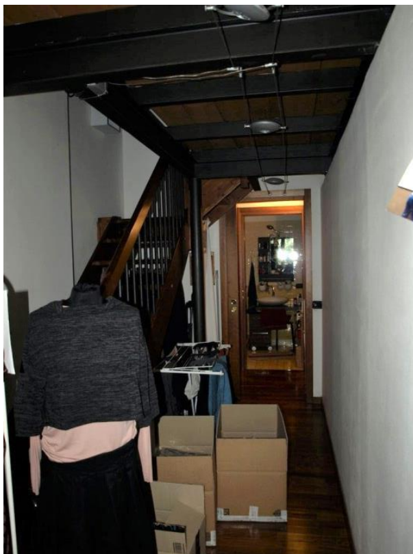
DISIMPEGNO E BAGNO (abusivo)