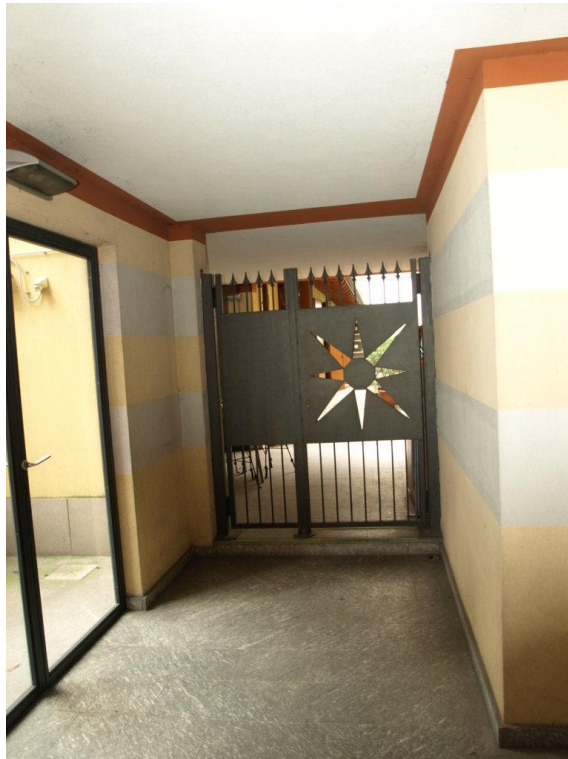
INGRESSO UNITA' IMMOBILIARE

Via Ambrogio Figino n°2 Appartamento piano T + locale cantina S1 + box autorimessa pertinenziale + box autorimessa