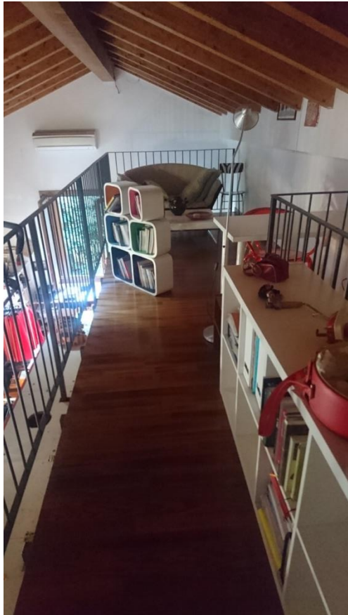
AREA SOPPALCO CON OPERE ABUSIVE

Via Ambrogio Figino n°2 Appartamento piano T + locale cantina S1 + box autorimessa pertinenziale + box autorimessa