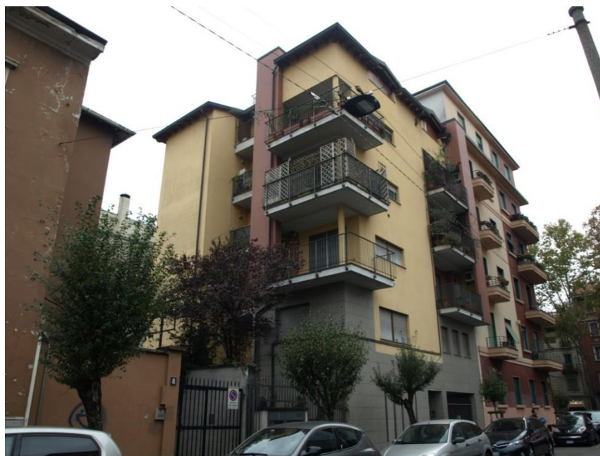
Via Ambrogio Figino 2 - Esterno fabbricato