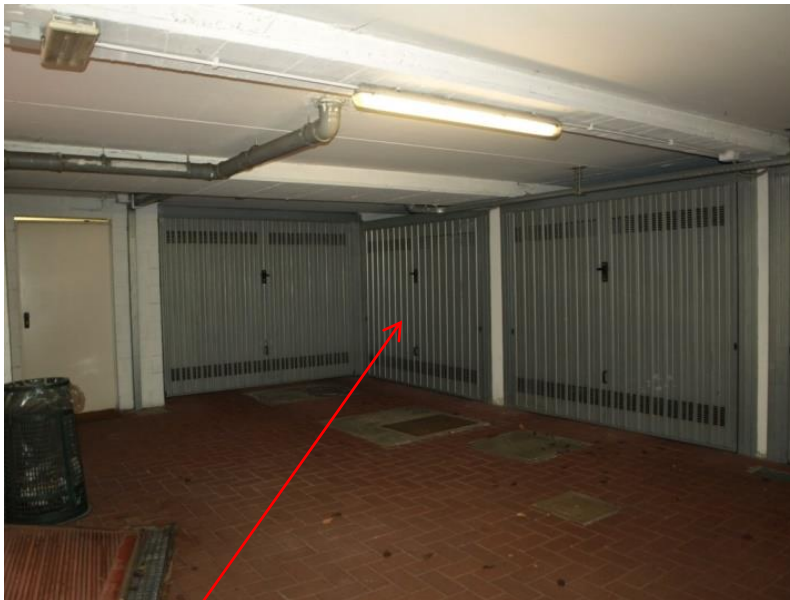
BOX AUTORIMESSA SUB 719