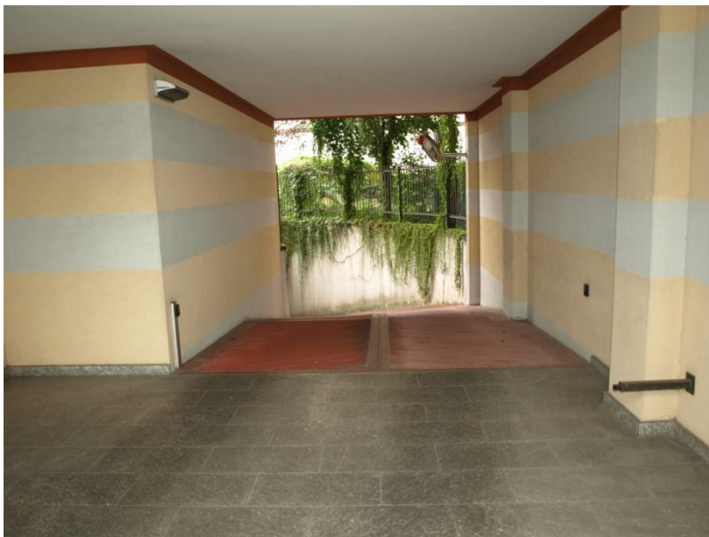
INGRESSO BOX AUTORIMESSE PIANO INTERRATO