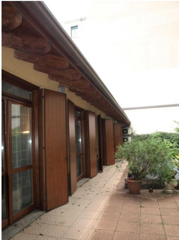
INTERNO CORTILE CON GIARDINO PRIVATO

Via Ambrogio Figino n°2 Appartamento piano T + locale cantina S1 + box autorimessa pertinenziale + box autorimessa