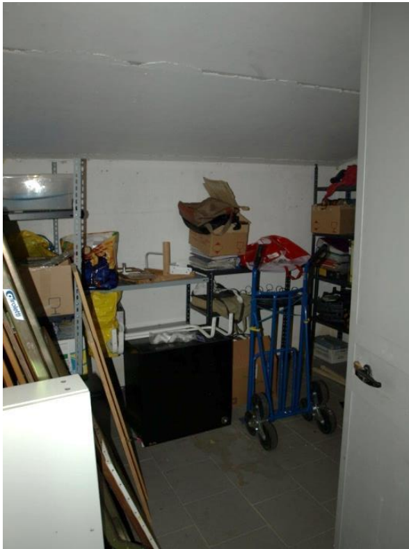
LOCALE CANTINA SUB 729

Via Ambrogio Figino n°2 Appartamento piano T + locale cantina S1 + box autorimessa pertinenziale + box autorimessa