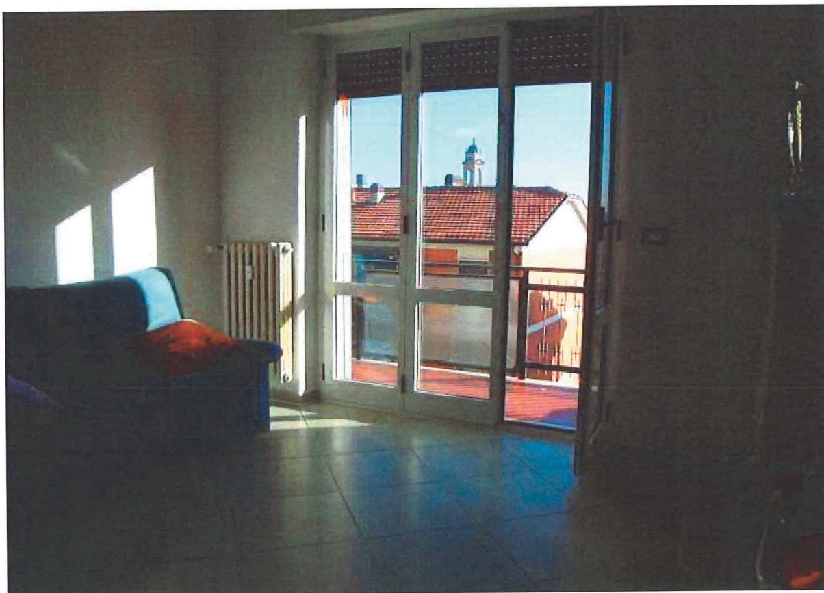
R.G.E. 145/2018 G. E. Dott. Ssa C. Trentini Immobile in Gessate , Viale Europa n.° 41, Foglio 7, mapp. 259, sub 12, piano 4°-S1 Prospetti interni: le due camere da letto