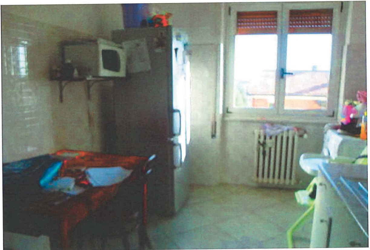
R.G.E. 145/2018 G. E. Dott. Ssa C. Trentini Immobile in Gessate , Viale Europa n.° 41, Foglio 7, mapp. 259, sub 12, piano 4°-S1 Prospetti interni: la cucina