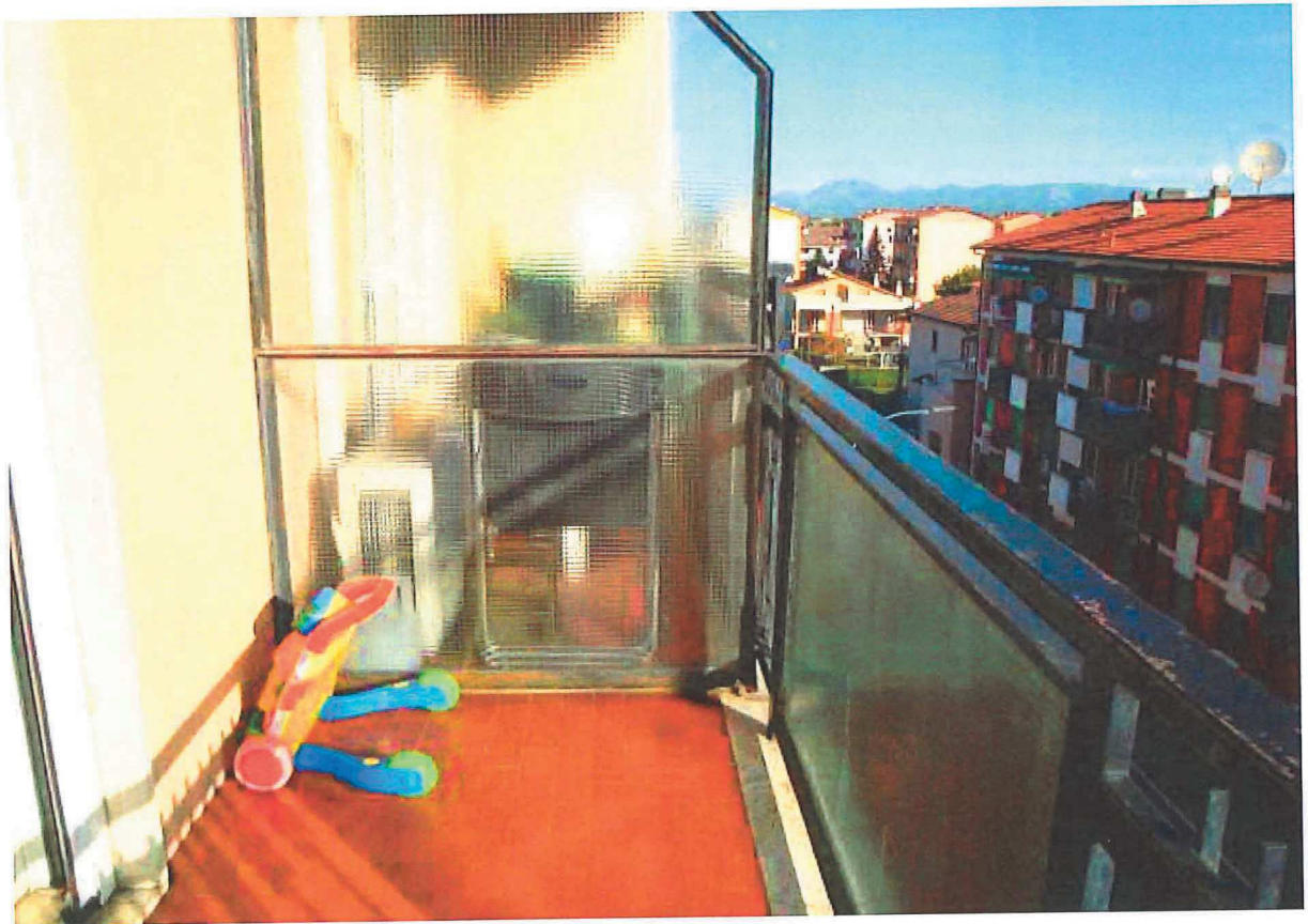
R.G.E. 145/2018 G. E. Dott. Ssa C. Trentini Immobile in Gessate , Viale Europa n.° 41, Foglio 7, mapp. 259, sub 12, piano 4°-S1 Prospetti interni: i due balconi