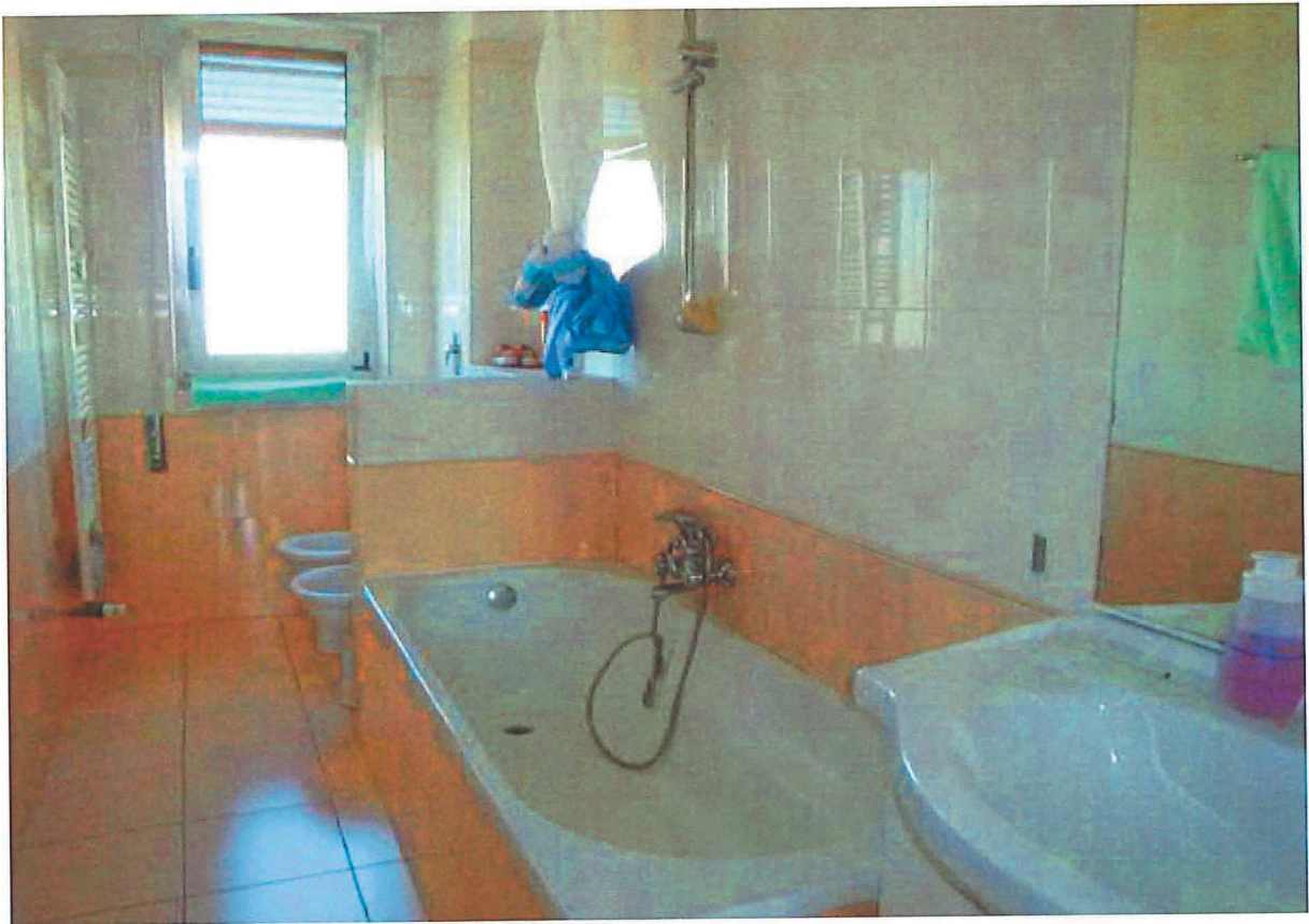
R.G.E. 145/2018 G. E. Dott. Ssa C. Trentini Immobile in Gessate , Viale Europa n.° 41, Foglio 7, mapp. 259, sub 12, piano 4°-S1 Prospetti interni: l'ingresso e il bagno