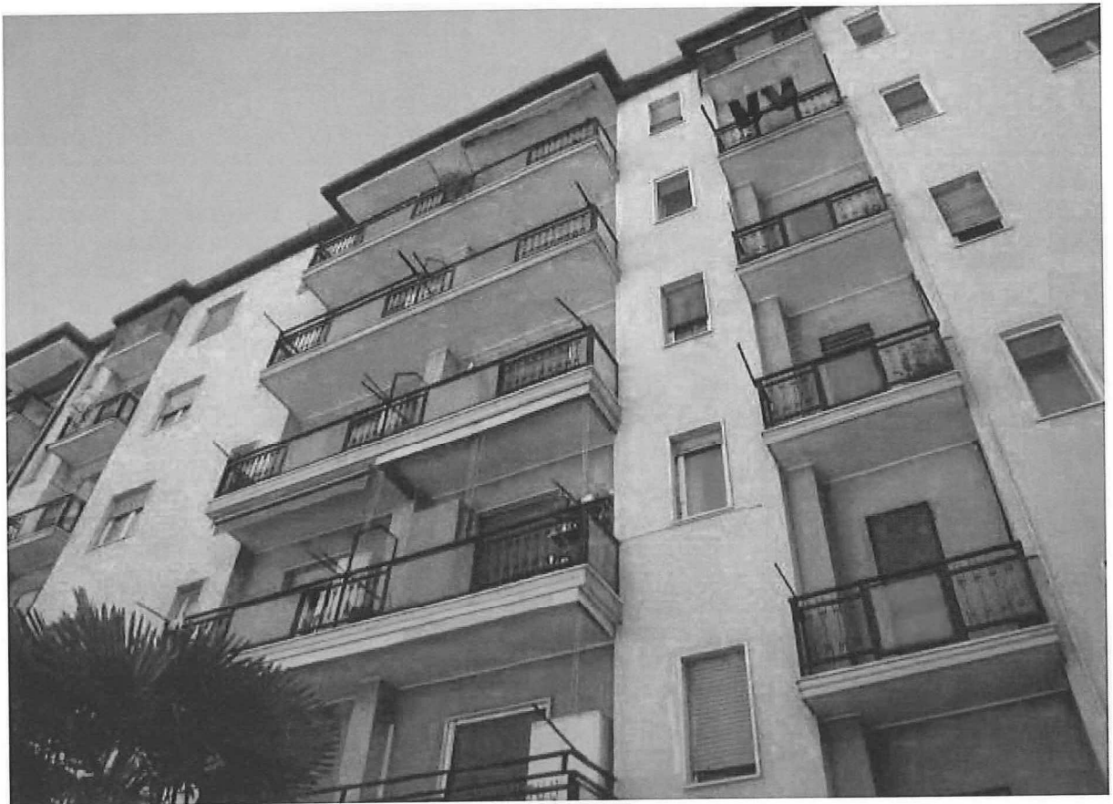
R.G.E. 145/2018 G. E. Dott. Ssa C. Trentini Immobile in Gessate , Viale Europa n.° 41, Foglio 7, mapp. 259, sub 12, piano 4°-S1 Prospetti esterni: il prospetto su Viale Europa e sul cortile interno