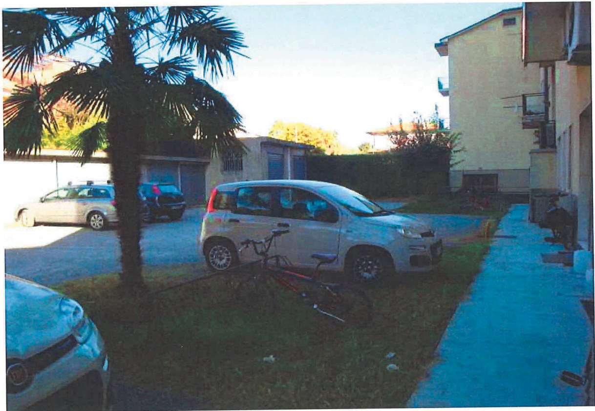
R.G.E. 145/2018 G. E. Dott. Ssa C. Trentini Immobile in Gessate , Viale Europa n.° 41, Foglio 7, mapp. 259, sub 12, piano 4°-S1 Prospetti interni e esterni: le scale condominiali e il cortile comune