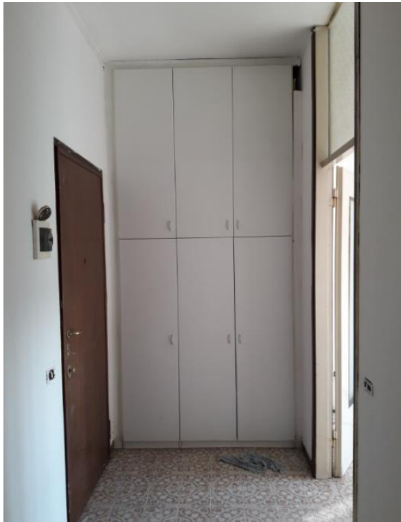
Foto 05. Ingresso appartamento