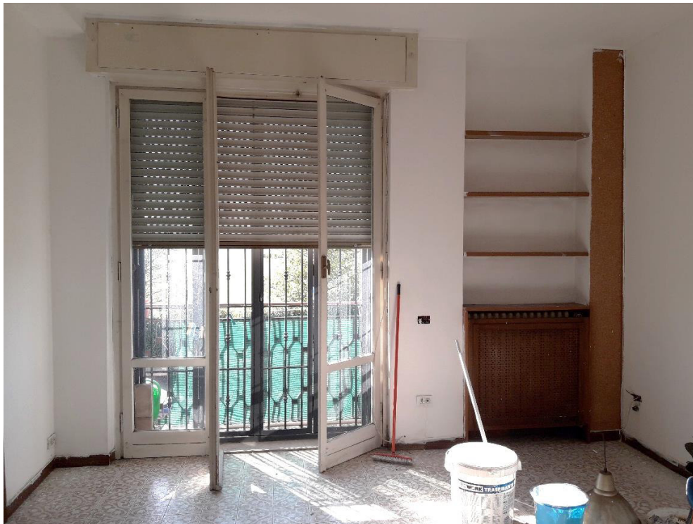
Foto 07. Soggiorno