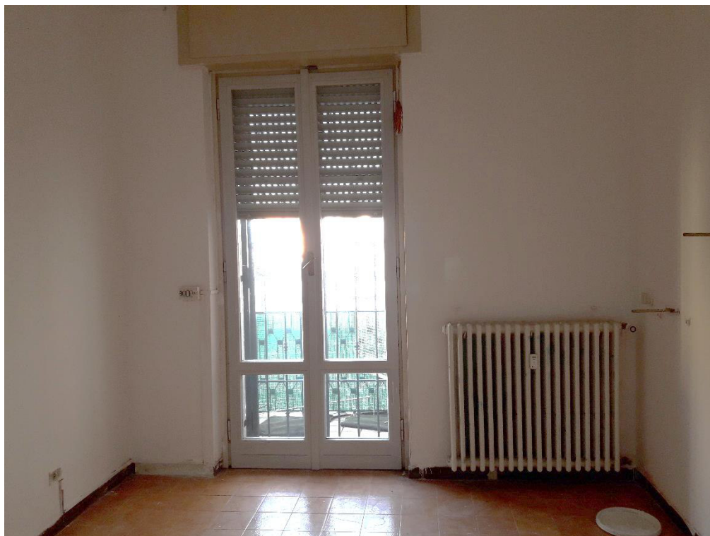
Foto 09. Camera 2