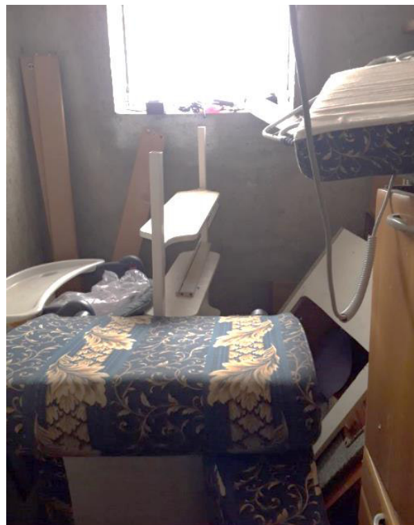
Foto 12. Cantina