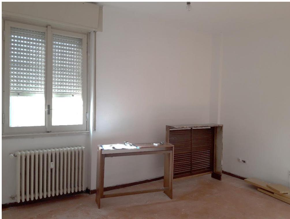
Foto 08. Camera 1