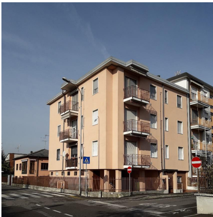
Foto 01. Condominio Via Caccianiga 1 angolo Via Guglielmo Oberdan