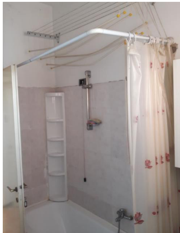
Foto 11. Bagno