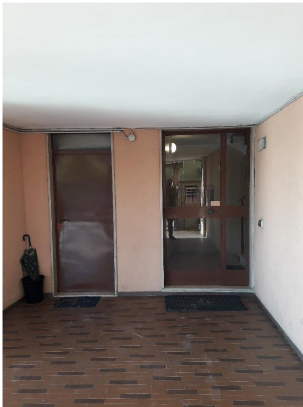
Foto 03. Ingresso condominiale coperto