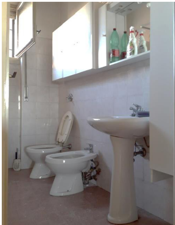
Foto 10. Bagno