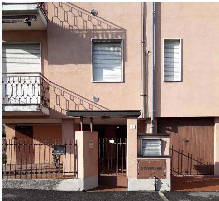
Foto 02. Ingresso pedonale Via Caccianiga 1