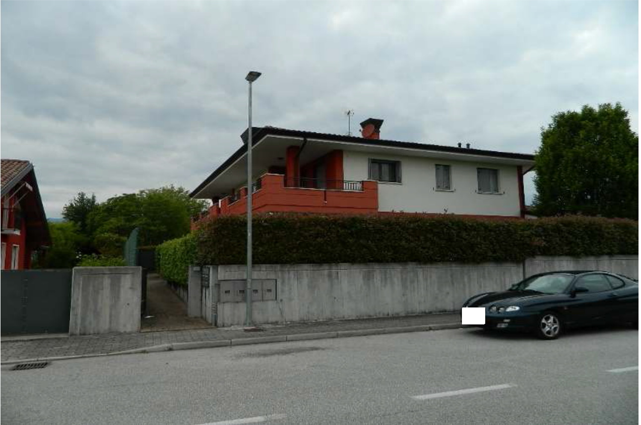
Foto n. 1 – Palazzina con vista da via Martin Luther King 35 (lato Sud - Est).

DOC. FOTOGRAFICA – Beni in Roveredo in Piano (PN) – via M. L. King n. 35/1