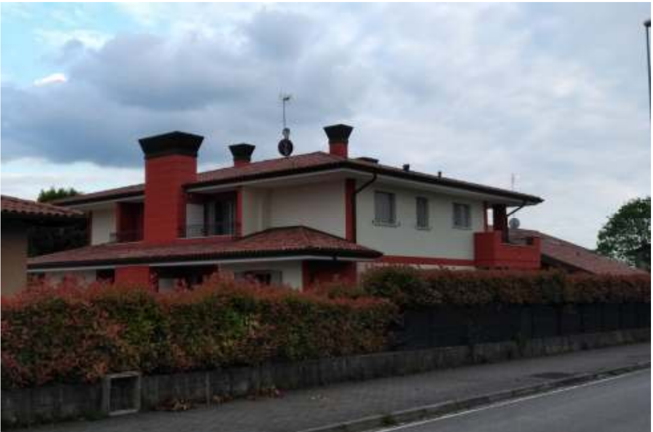
Foto n. 4 – Palazzina vista da via Cristoforo Colombo (lato Nord - Ovest).