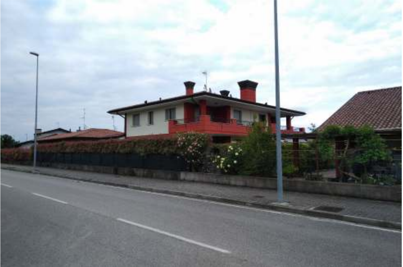
Foto n. 3 – Palazzina vista da via Cristoforo Colombo (lato Sud - Ovest).

DOC. FOTOGRAFICA – Beni in Roveredo in Piano (PN) – via M. L. King n. 35/1.