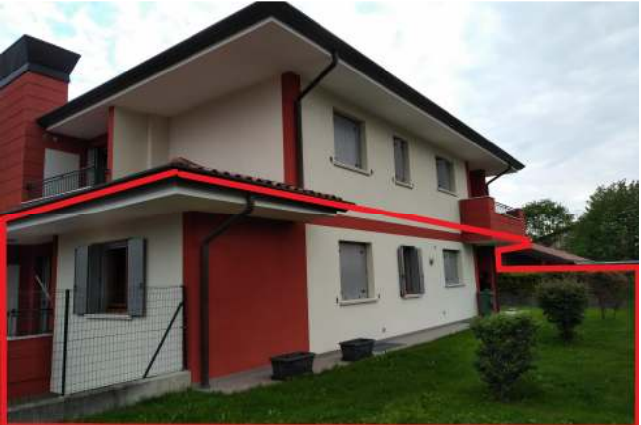
Foto n. 8 – Unità eseguita bordata in rosso. Vista dall'area scoperta.