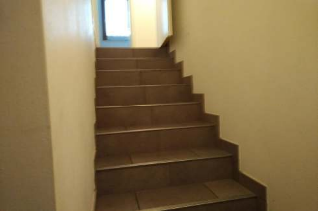
Foto n. 25 – Scala interna che collega il piano terra a quello interrato.

DOC. FOTOGRAFICA – Beni in Roveredo in Piano (PN) – via M. L. King n. 35/1