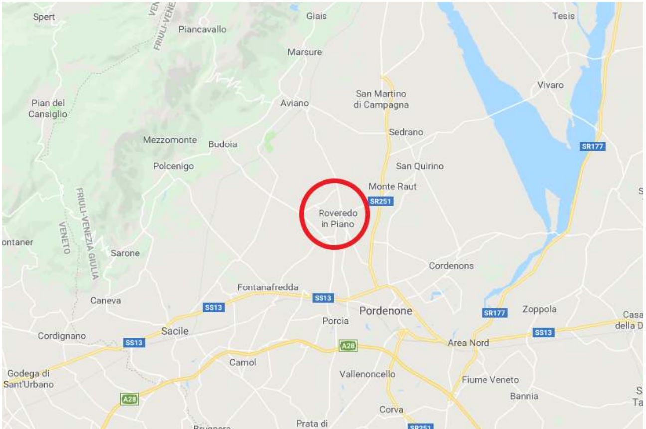
Foto n. I – Il contesto territoriale nel quale è inserito il bene eseguito – cerchiato in rosso e segnato.

DOC. FOTOGRAFICA – Beni in Roveredo in Piano (PN) – via M. L. King n. 35/1