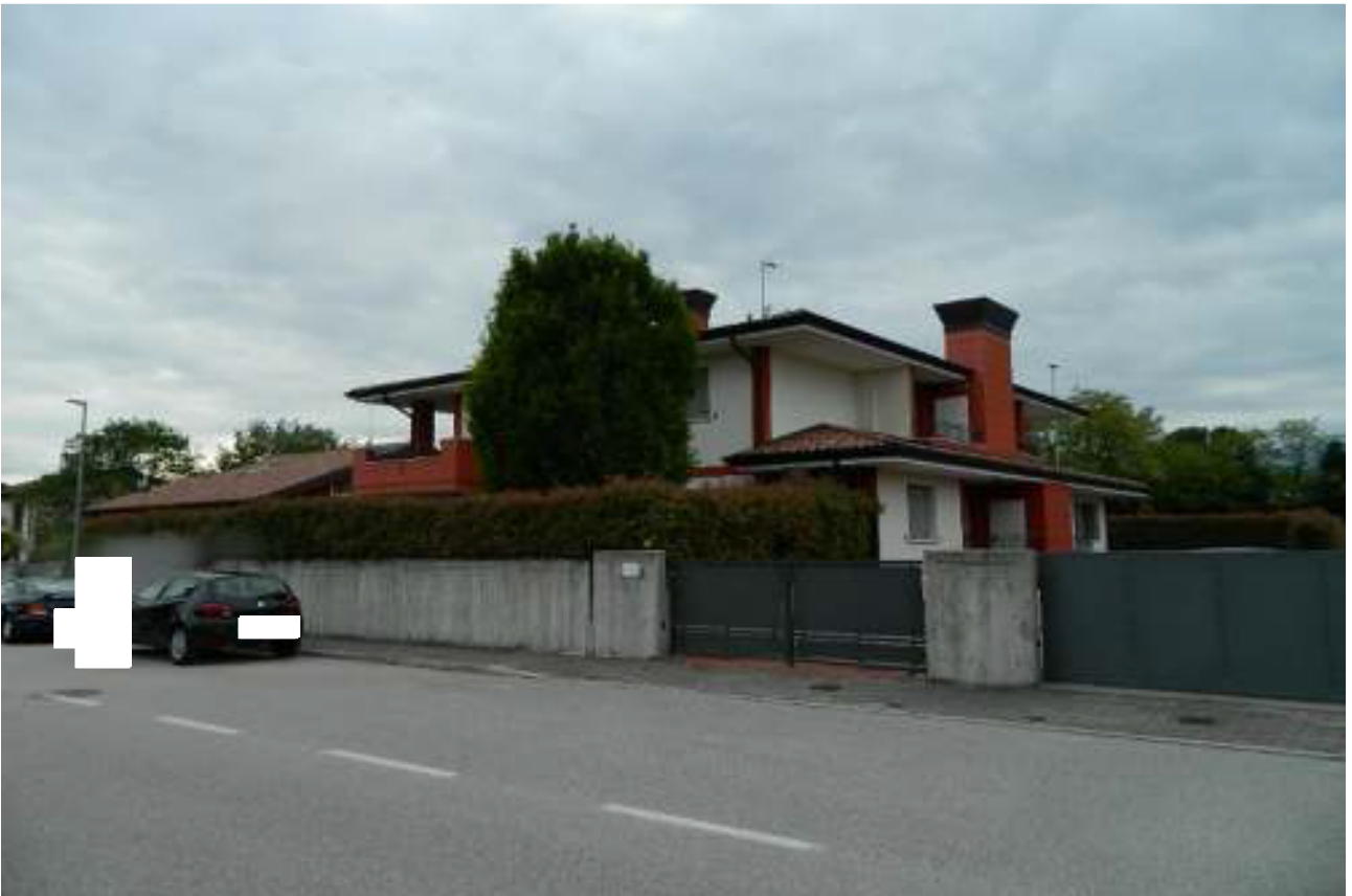
Foto n. 2 – Palazzina vista da via Martin Luther King n. 35 (lato Nord -Est).