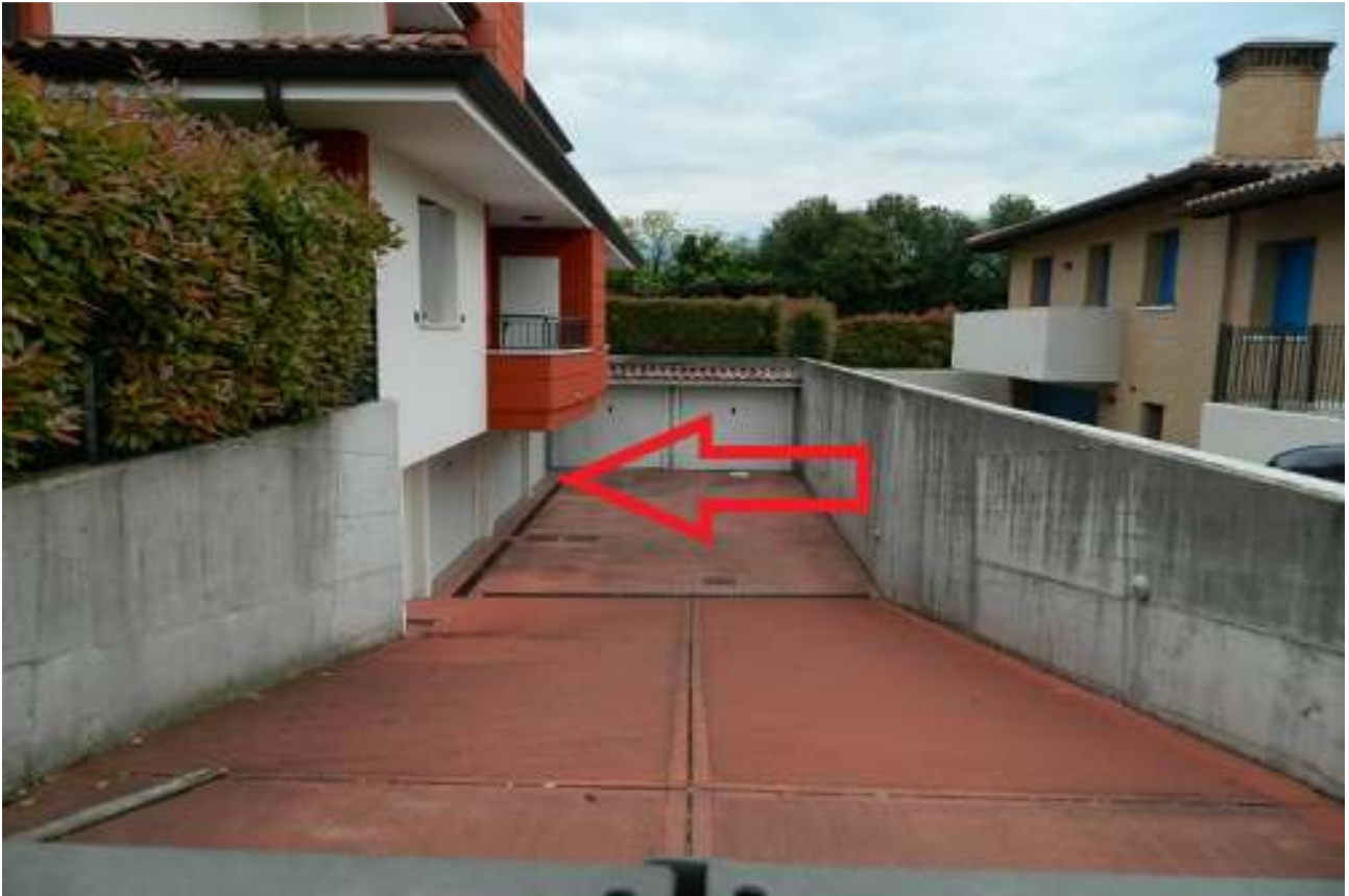
Foto n. 33 – Accesso condominiale alle autorimesse. Indicati (freccia rossa) i due basculanti d'accesso.

DOC. FOTOGRAFICA – Beni in Roveredo in Piano (PN) – via M. L. King n. 35/1