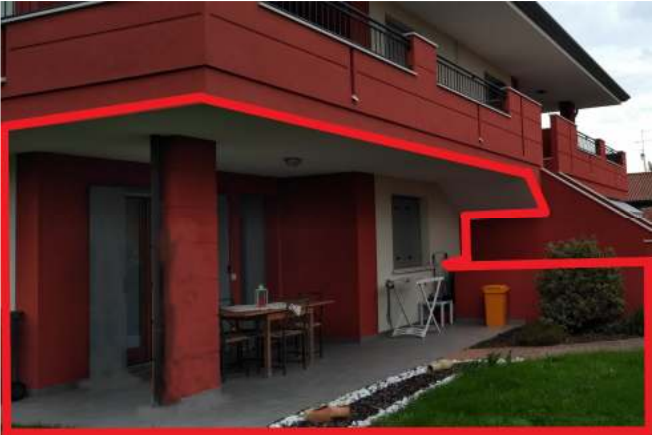
Foto n. 7 – Unità eseguita bordata in rosso. In evidenza il porticato lato sud, visto dall'area scoperta.

DOC. FOTOGRAFICA – Beni in Roveredo in Piano (PN) – via M. L. King n. 35/1