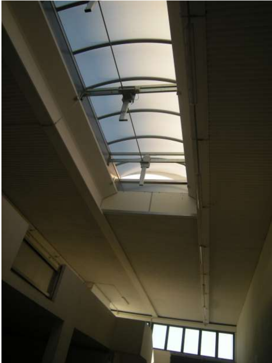
Concordia Sagittaria, foglio 5 particella 930, sub. 10 - L'interno del capannone.