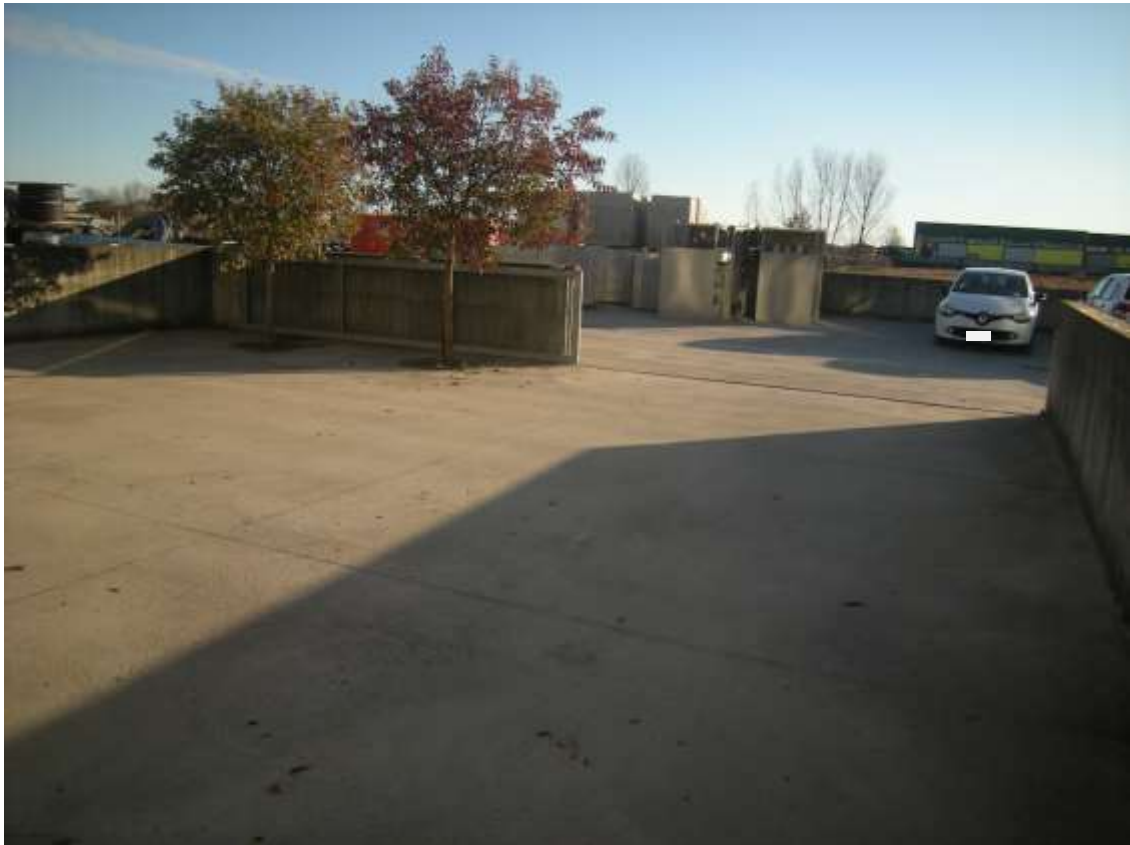
Concordia Sagittaria, foglio 5 particella 930, sub. 10 - Scoperto esclusivo.