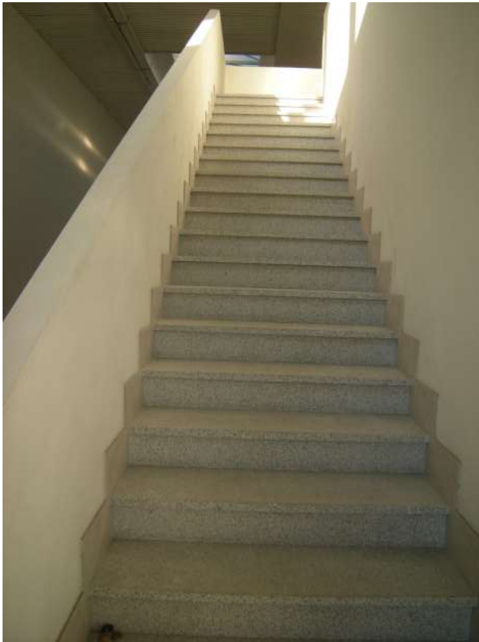
Concordia Sagittaria, foglio 5 particella 930, sub. 10 - Il corpo scala.