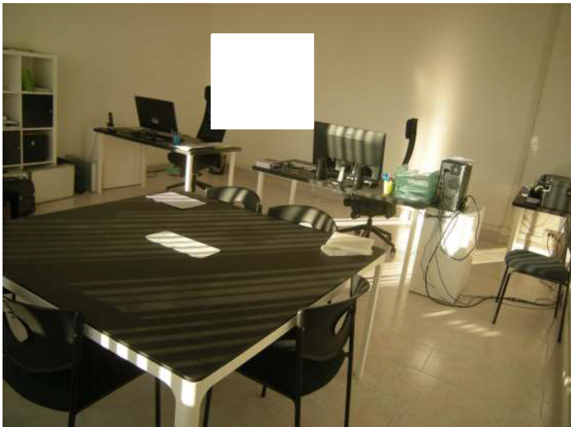
Concordia Sagittaria, foglio 5 particella 930, sub. 10, piano terra - Il locale con destinazione ufficio.