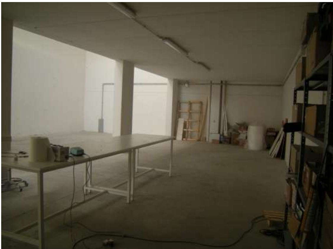
Concordia Sagittaria, foglio 5 particella 930, sub. 10 - L'interno del capannone.