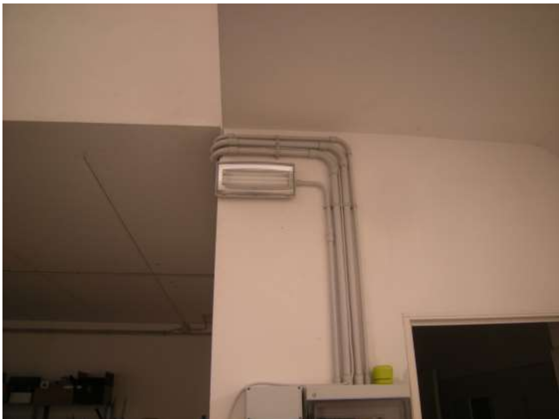
Concordia Sagittaria, foglio 5 particella 930, sub. 10 - Particolari dell'impianto elettrico.