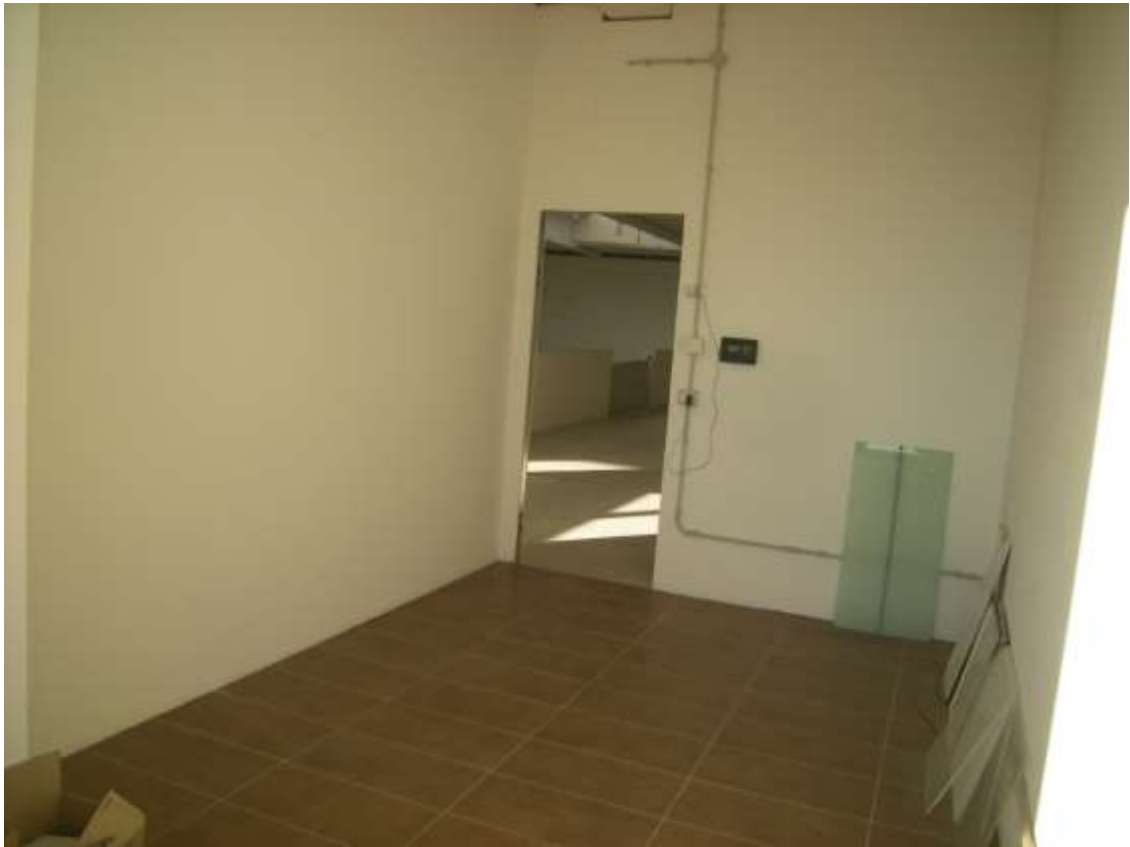
Concordia Sagittaria, foglio 5 particella 930, sub. 10, soppalco - Lo spogliatoio.