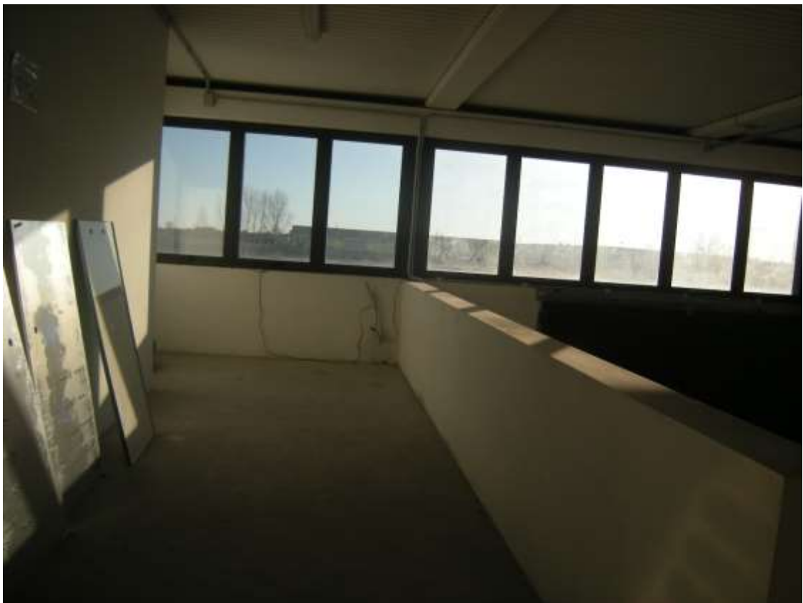
Concordia Sagittaria, foglio 5 particella 930, sub. 10 - Il soppalco.