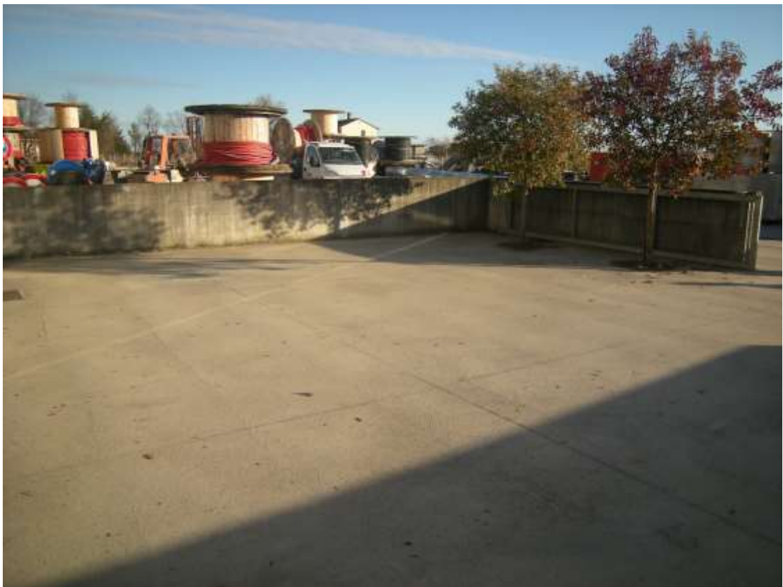
Concordia Sagittaria, foglio 5 particella 930, sub. 10 - Scoperto esclusivo.