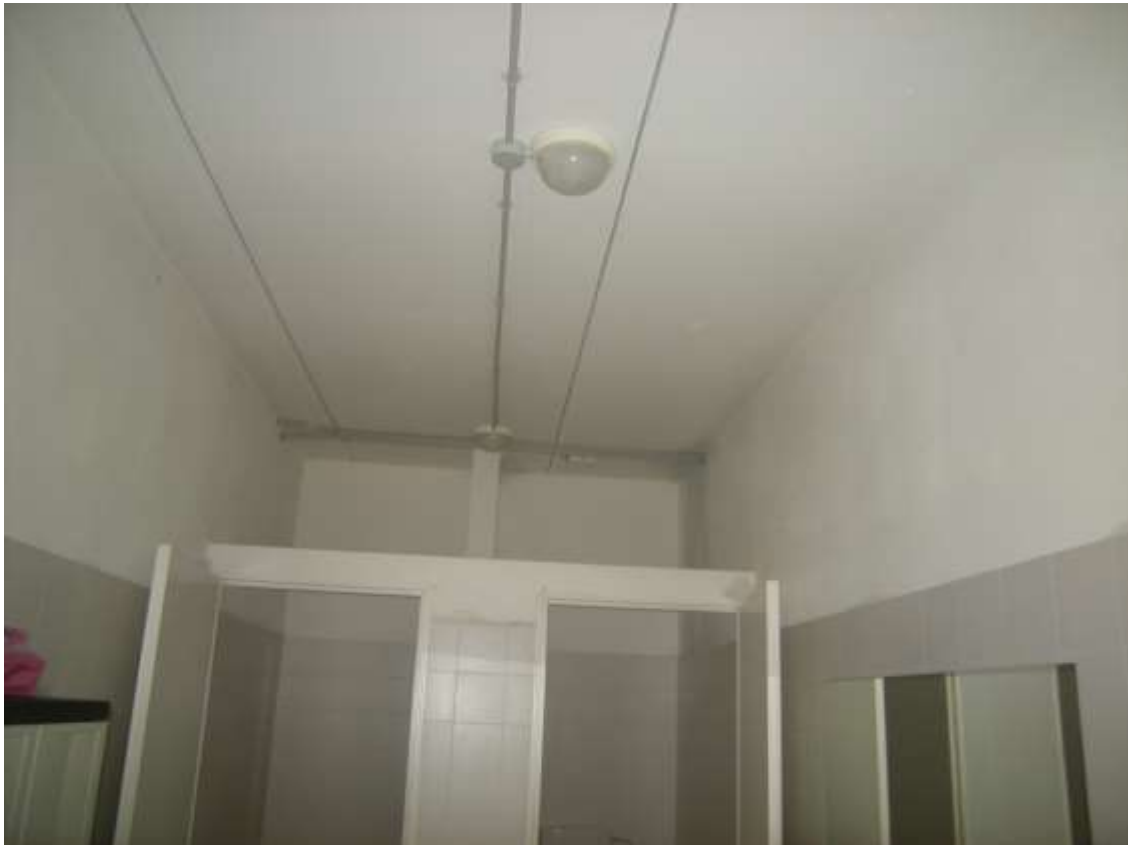
Concordia Sagittaria, foglio 5 particella 930, sub. 10, piano terra - I locali wc e l'anti bagno.