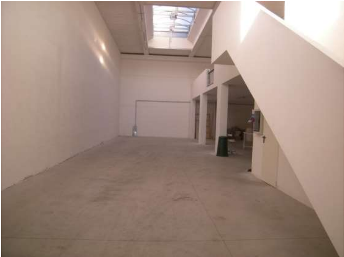
Concordia Sagittaria, foglio 5 particella 930, sub. 10 – L'interno del capannone.