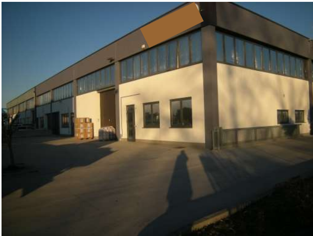
Concordia Sagittaria, foglio 5 particella 930 - Sopra vista dall'alto del fabbricato artigianale, sotto il prospetto ovest del fabbricato in via dell'Artigianato.