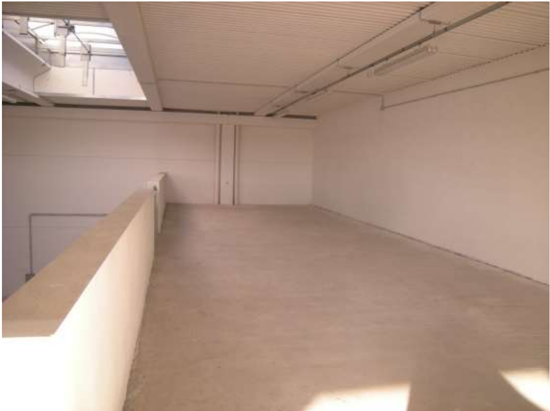
Concordia Sagittaria, foglio 5 particella 930, sub. 10 – Il soppalco.