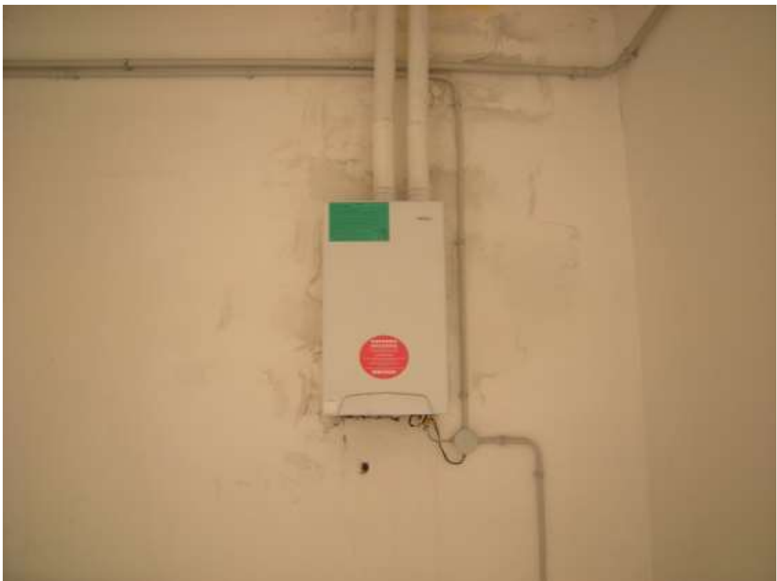
Concordia Sagittaria, foglio 5 particella 930, sub. 10 - Particolari dell'impianto di riscaldamento