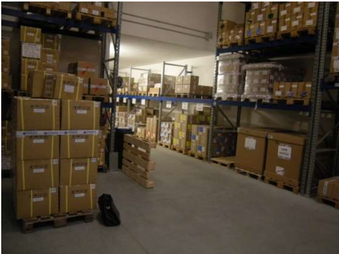
Concordia Sagittaria, foglio 5 particella 930, sub. 6 - L'interno del capannone.