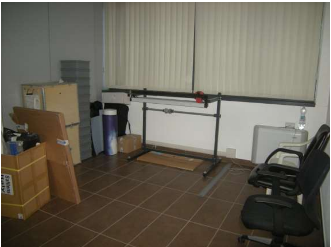
Concordia Sagittaria, foglio 5 particella 930, sub. 6, piano primo - L'ufficio 2.