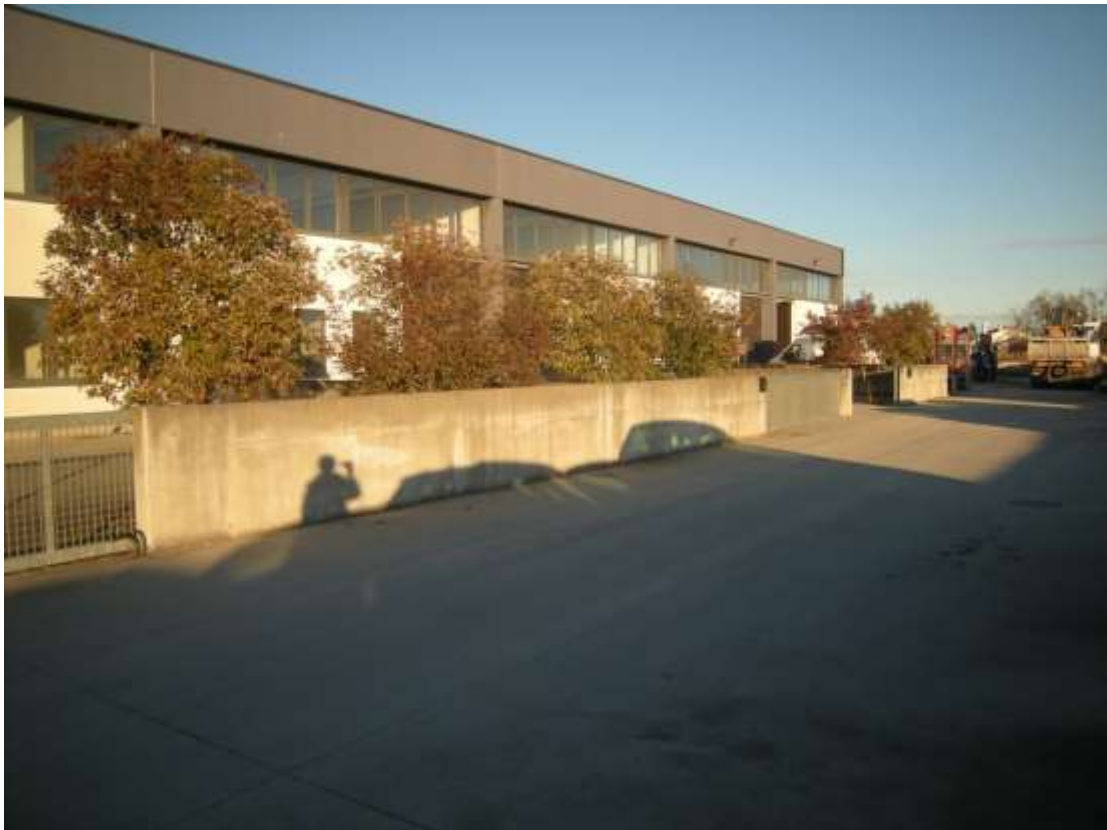
Concordia Sagittaria, foglio 5 particella 930 – Il prospetto sud del fabbricato artigianale e lo scoperto - area di manovra comune ai sub. 3, 5, 6, 7, 8, 9, 10, 11.