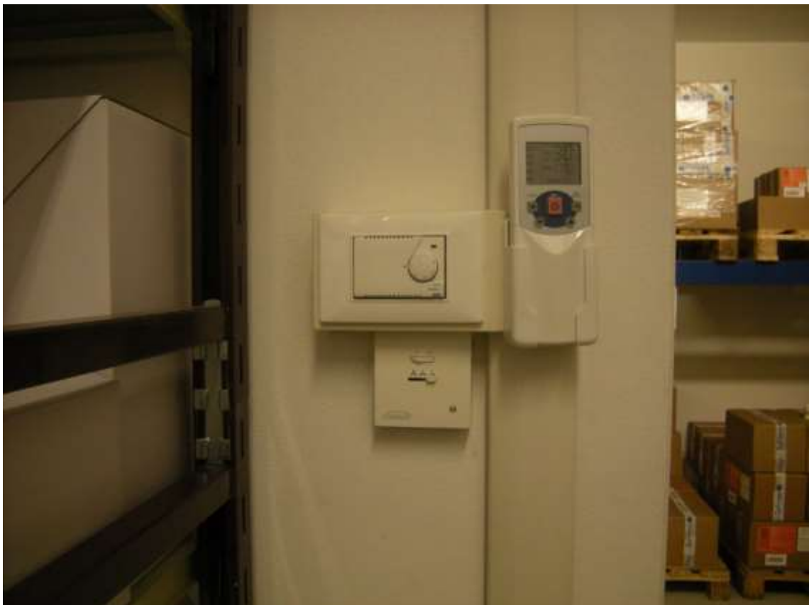
Concordia Sagittaria, foglio 5 particella 930, sub. 6 - Particolari dell'impianto di riscaldamento.