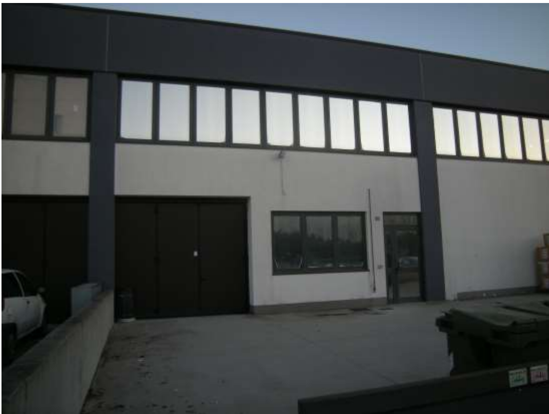
Concordia Sagittaria, foglio 5 particella 930, sub. 6 - L'ingresso all'immobile.