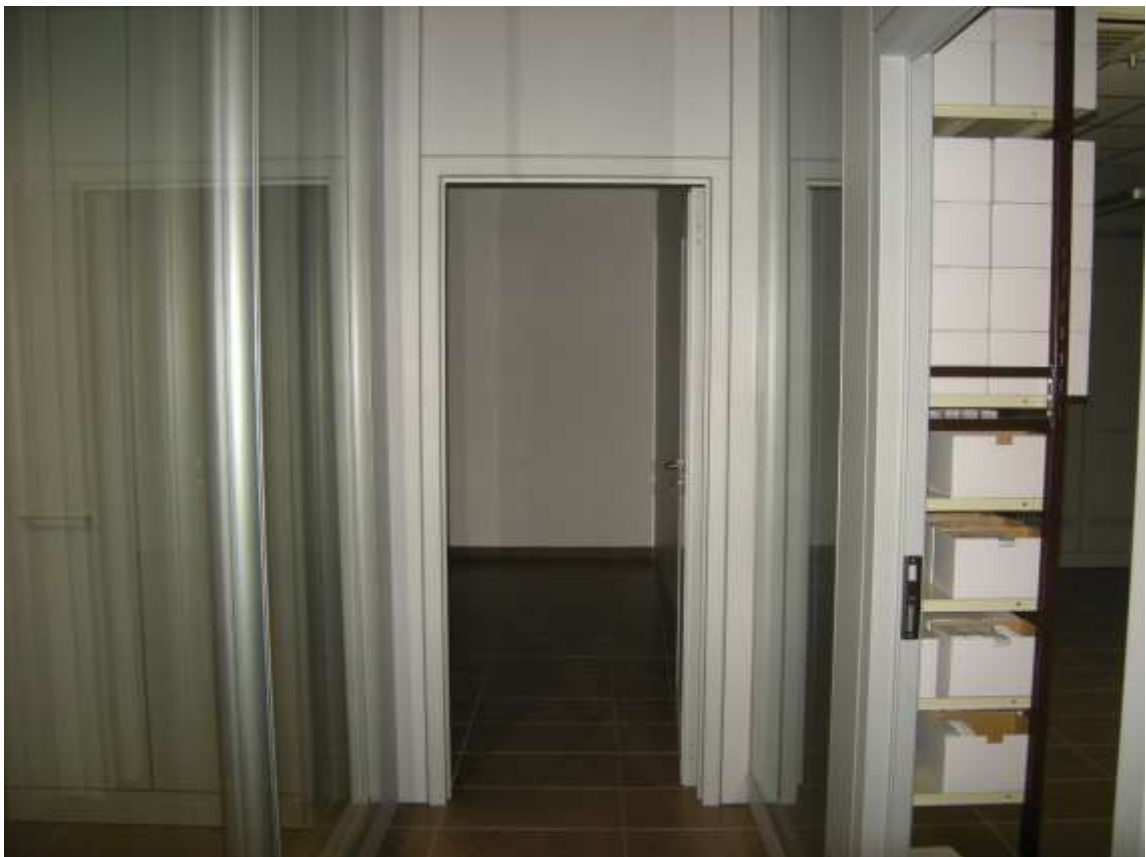
Concordia Sagittaria, foglio 5 particella 930, sub. 6, piano primo - Il corridoio.