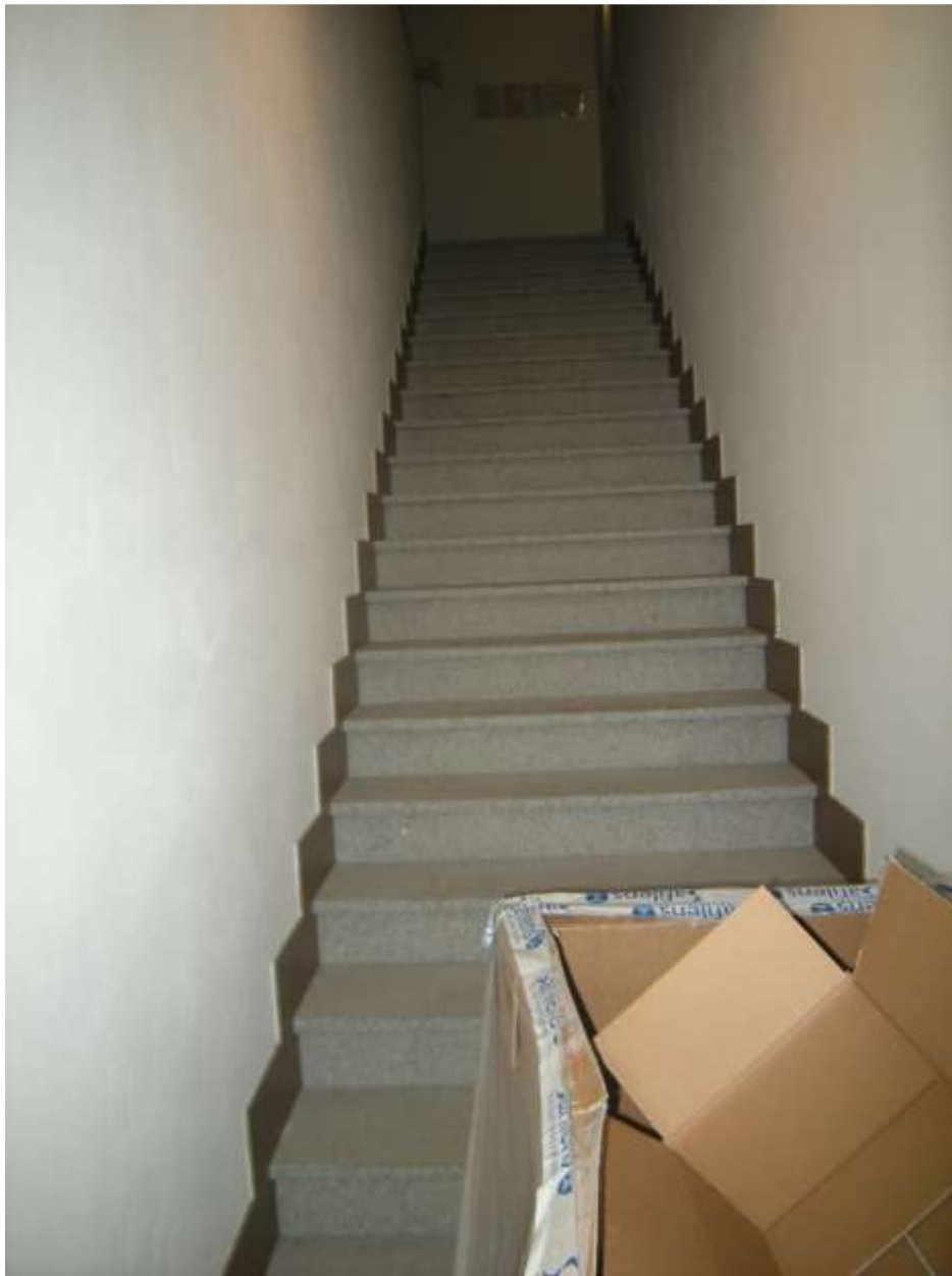
Concordia Sagittaria, foglio 5 particella 930, sub. 6 - Il vano scala.