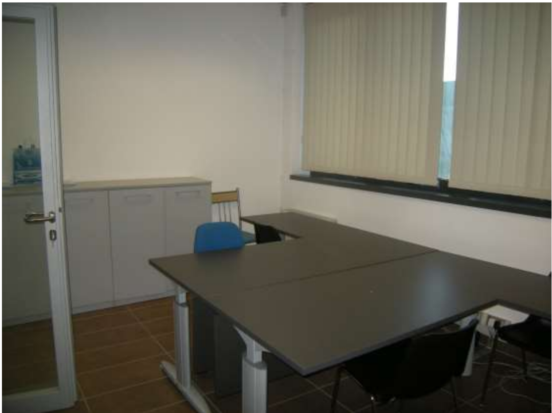
Concordia Sagittaria, foglio 5 particella 930, sub. 6, piano primo - L'ufficio 1.