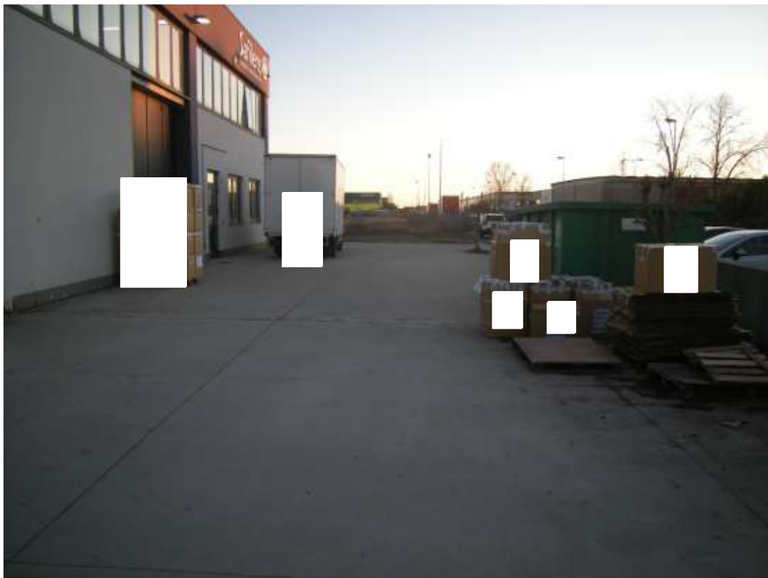
Concordia Sagittaria, foglio 5 particella 930, sub. 6 - Scoperto esclusivo.