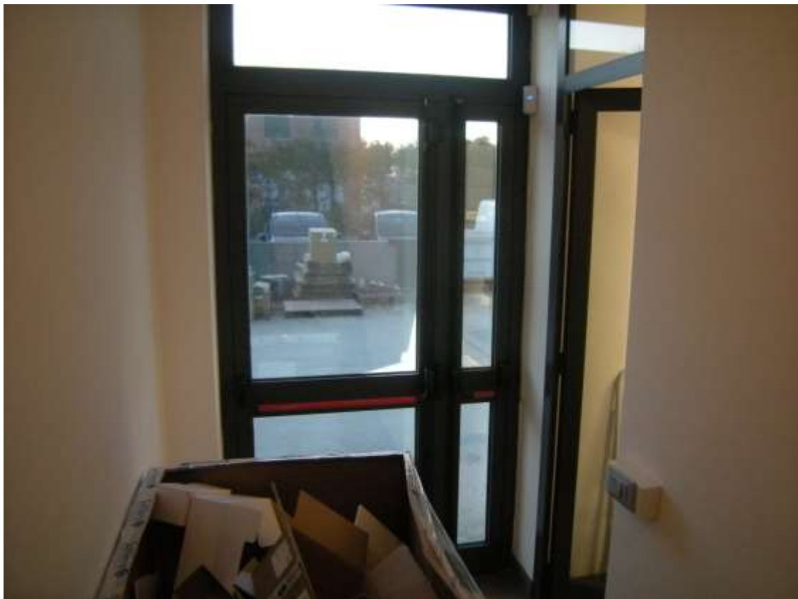
Concordia Sagittaria, foglio 5 particella 930, sub. 6, piano terra - Il locale con destinazione ufficio - ingresso e l'ingresso pedonale.