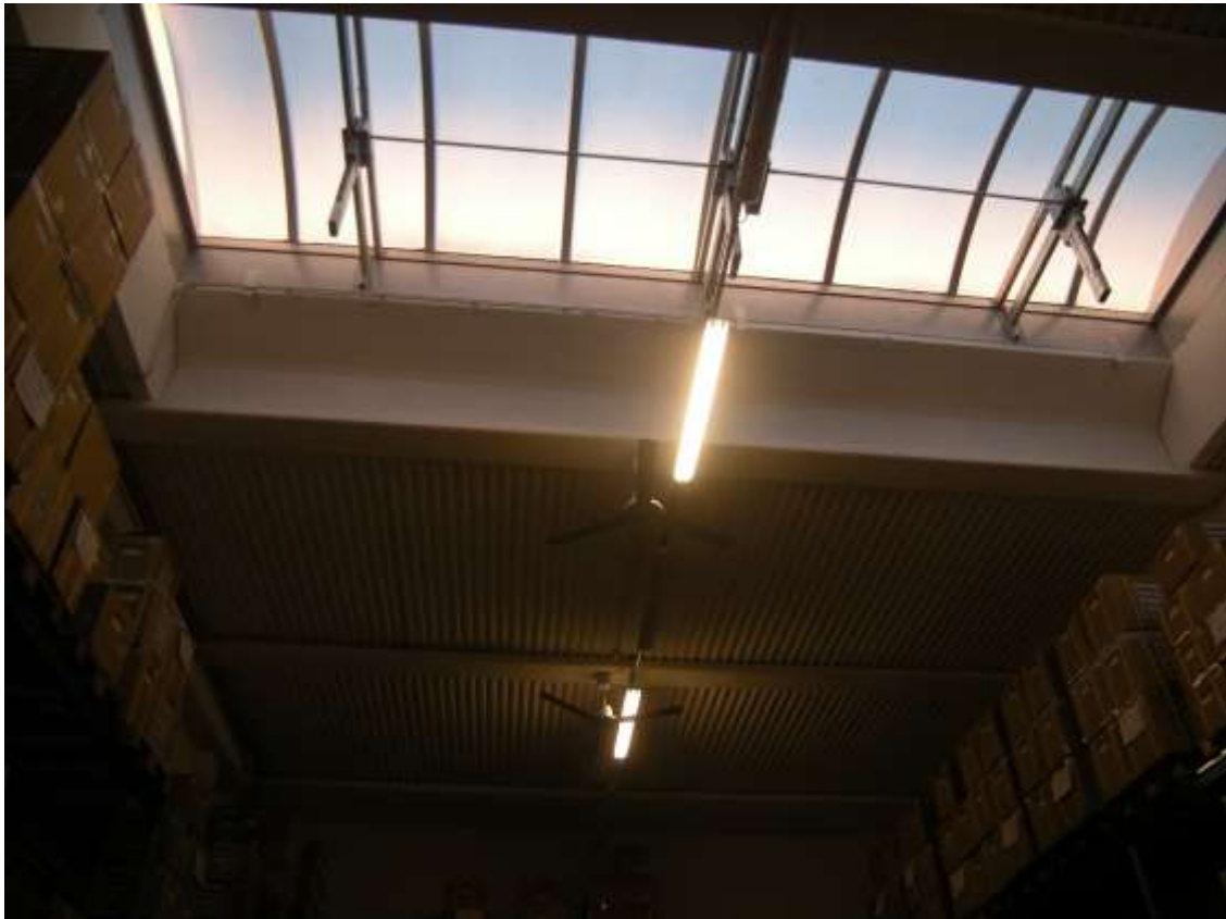
Concordia Sagittaria, foglio 5 particella 930, sub. 6 - L'interno del capannone.