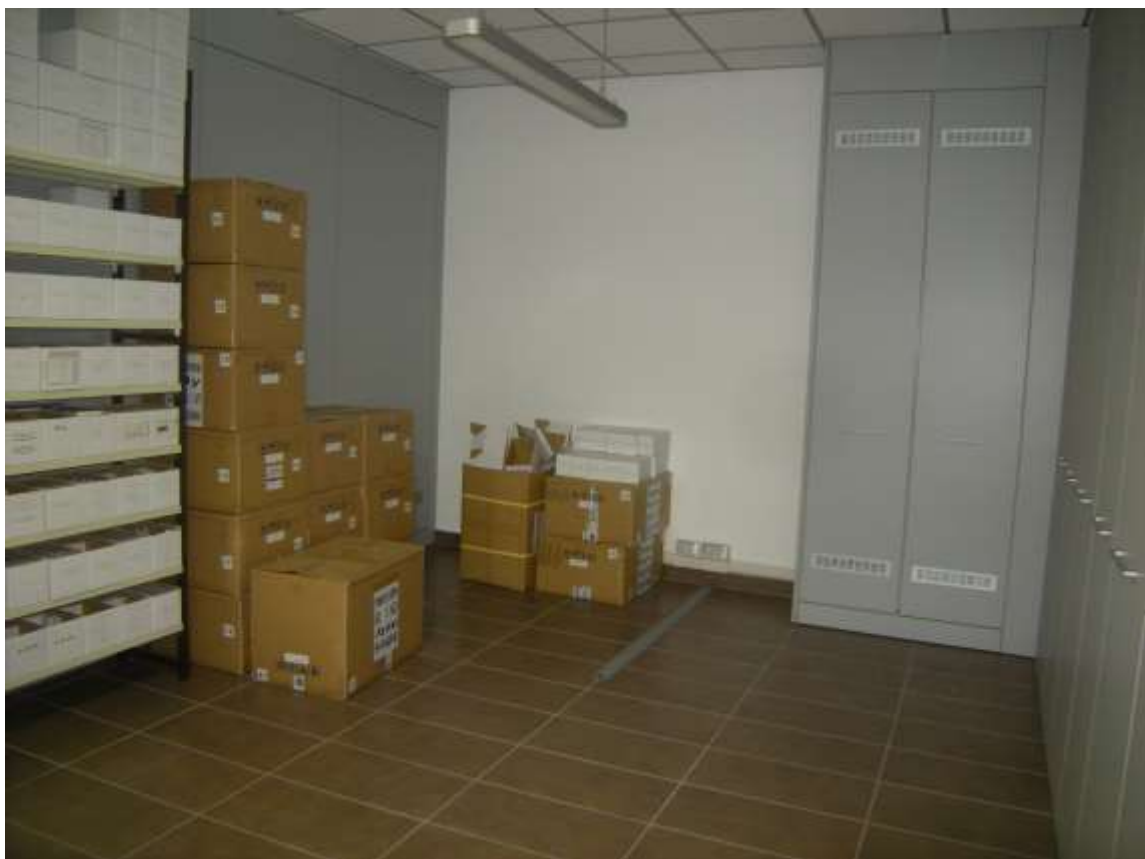
Concordia Sagittaria, foglio 5 particella 930, sub. 6, piano primo - L'archivio.