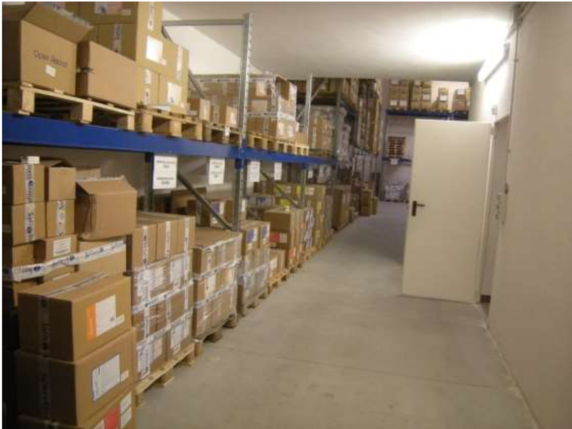
Concordia Sagittaria, foglio 5 particella 930, sub. 6 - L'interno del capannone.