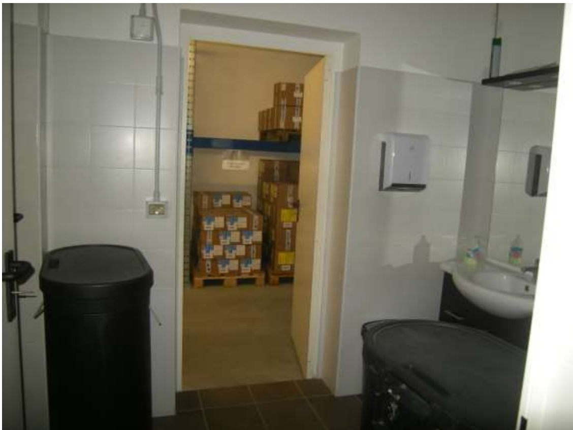
Concordia Sagittaria, foglio 5 particella 930, sub. 6, piano terra - I locali wc e l'anti bagno.