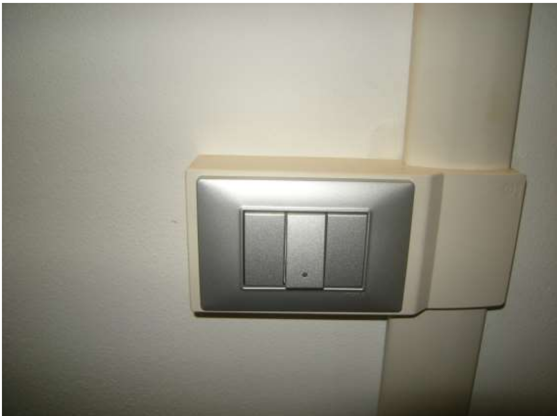
Concordia Sagittaria, foglio 5 particella 930, sub. 6 - Particolari dell'impianto di elettrico.