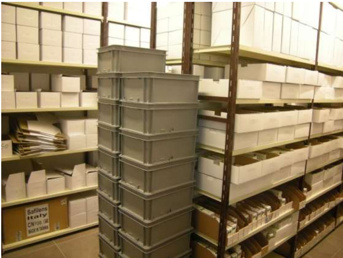
Concordia Sagittaria, foglio 5 particella 930, sub. 6, piano terra - Il locale con destinazione ufficio- ingresso.