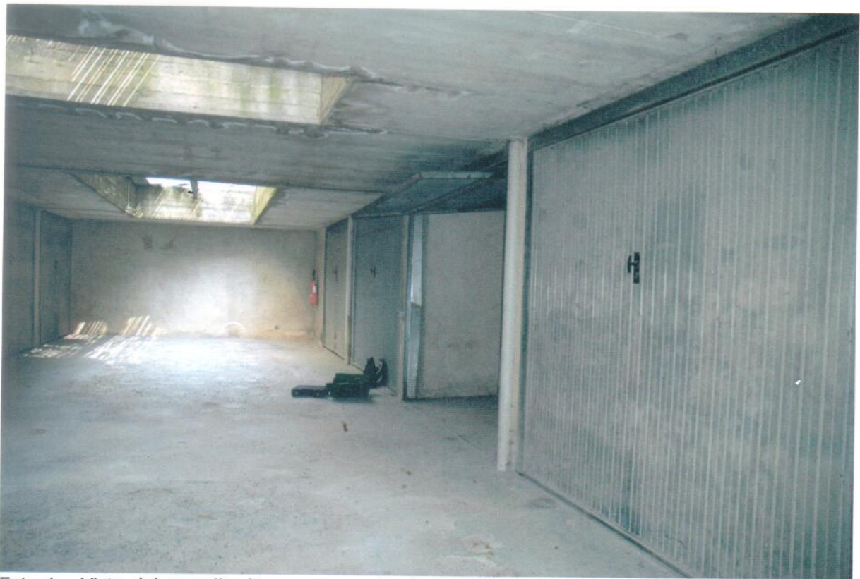
Foto 1 – Vista del corsello di manovra; sulla destra il box in esame.