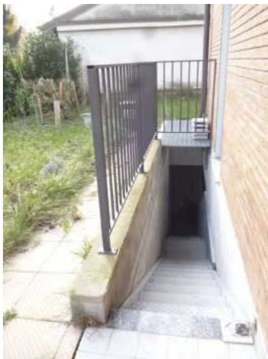
FOTO 12 - Scala di accesso al vano cantina dal giardino di pertinenza