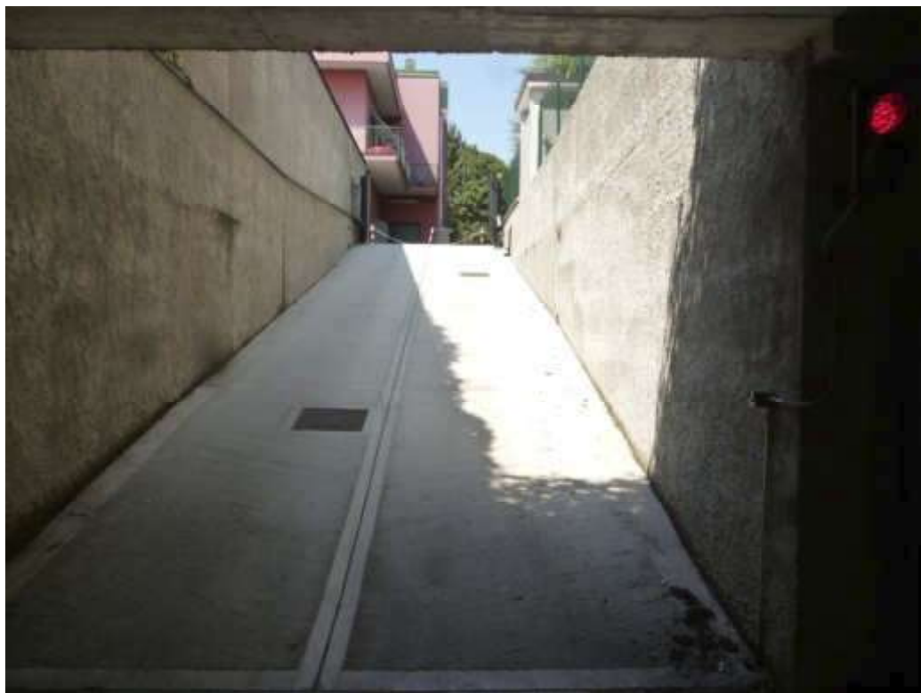
FOTO 3 - Rampa di ingresso ai box