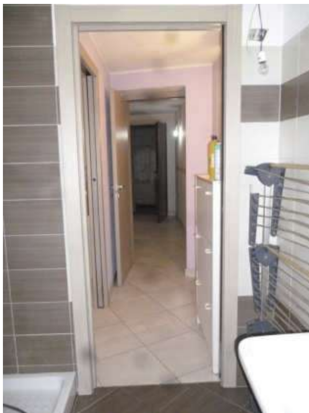
FOTO 17 - Box (!) Sub. 24 con attuale unico accesso da vano cantina Sub. 8