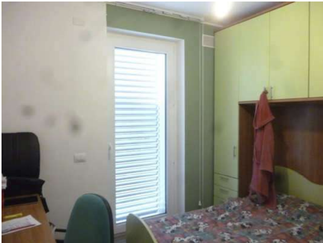
FOTO 9 - Ripostiglio, attualmente utilizzato come camera da letto