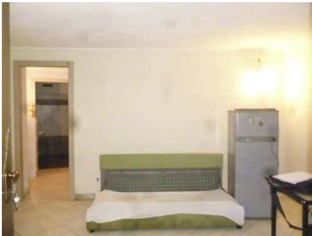
FOTO 15 - Vano cantina Sub. 8, in evidenza porta di collegamento al Sub. 24