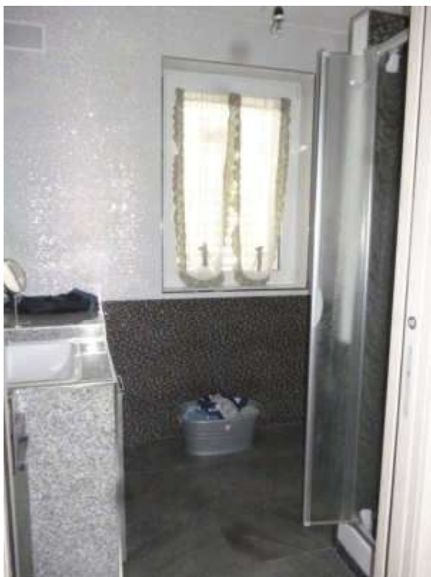
FOTO 10 - Bagno con doccia