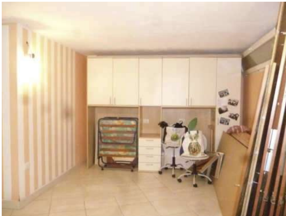
FOTO 18 - Box (!) Sub. 24. Al posto della basculante un tamponamento con finestrella