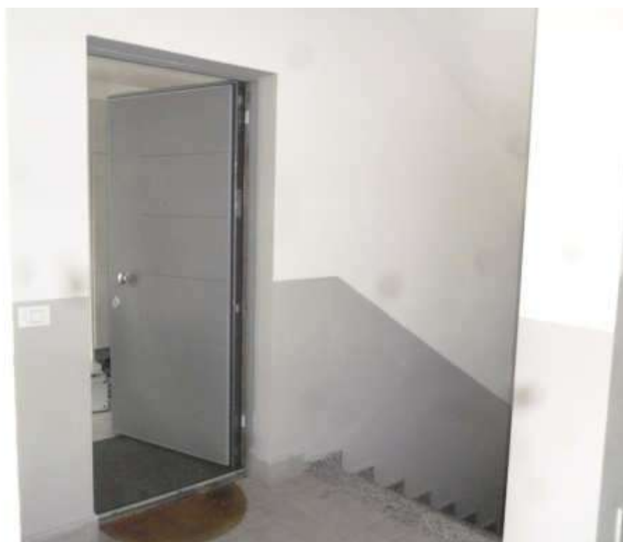
FOTO 4 - Ingresso all'abitazione Sub. 8