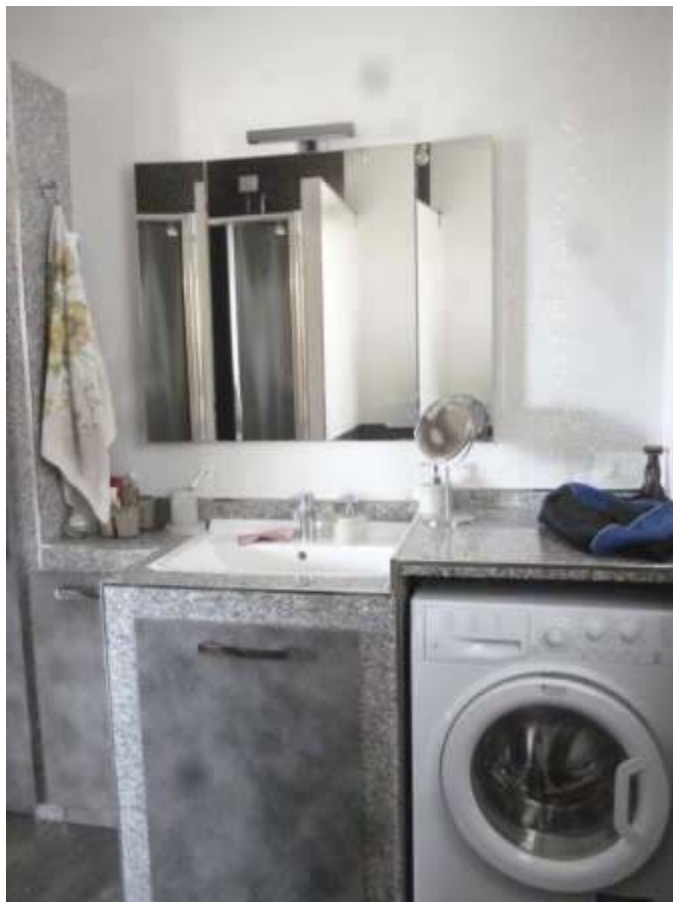
FOTO 11 - Bagno con doccia