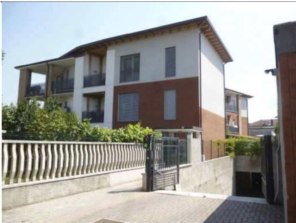
FOTO 1 - Ingresso carraio e pedonale da Via G. Verdi n° 58 in CESATE