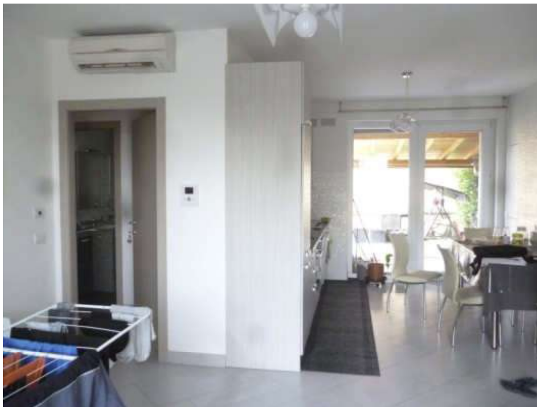
FOTO 7 - Cucina e soggiorno