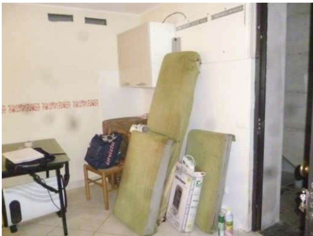
FOTO 14 - Vano cantina attrezzato a cucina