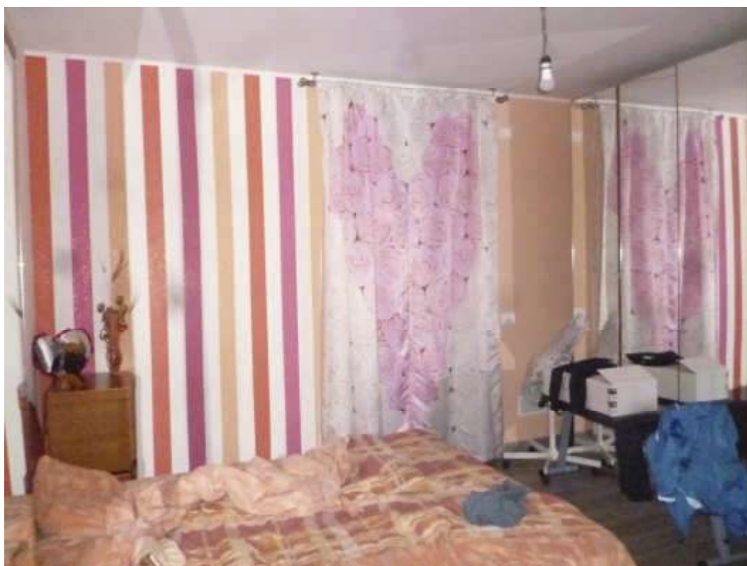
FOTO 8 - Camera da letto