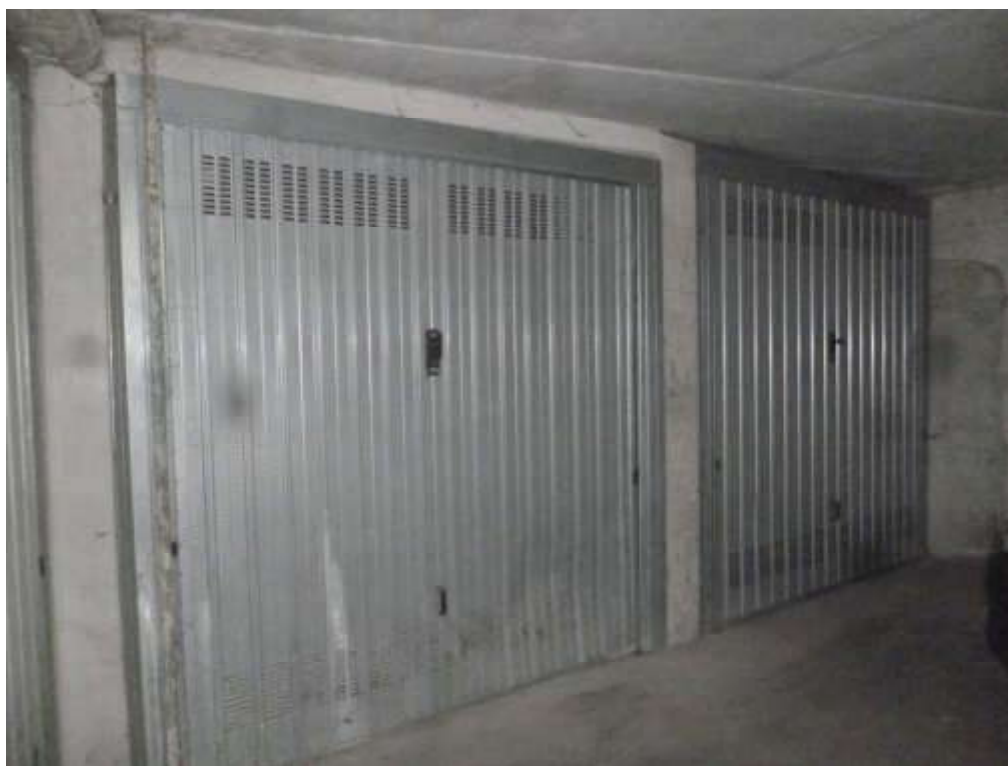
FOTO 16 - Box Sub. 24 a sinistra e Box Sub. 25 a destra. La basculante del Sub. 24 è bloccata dal tamponamento interno.