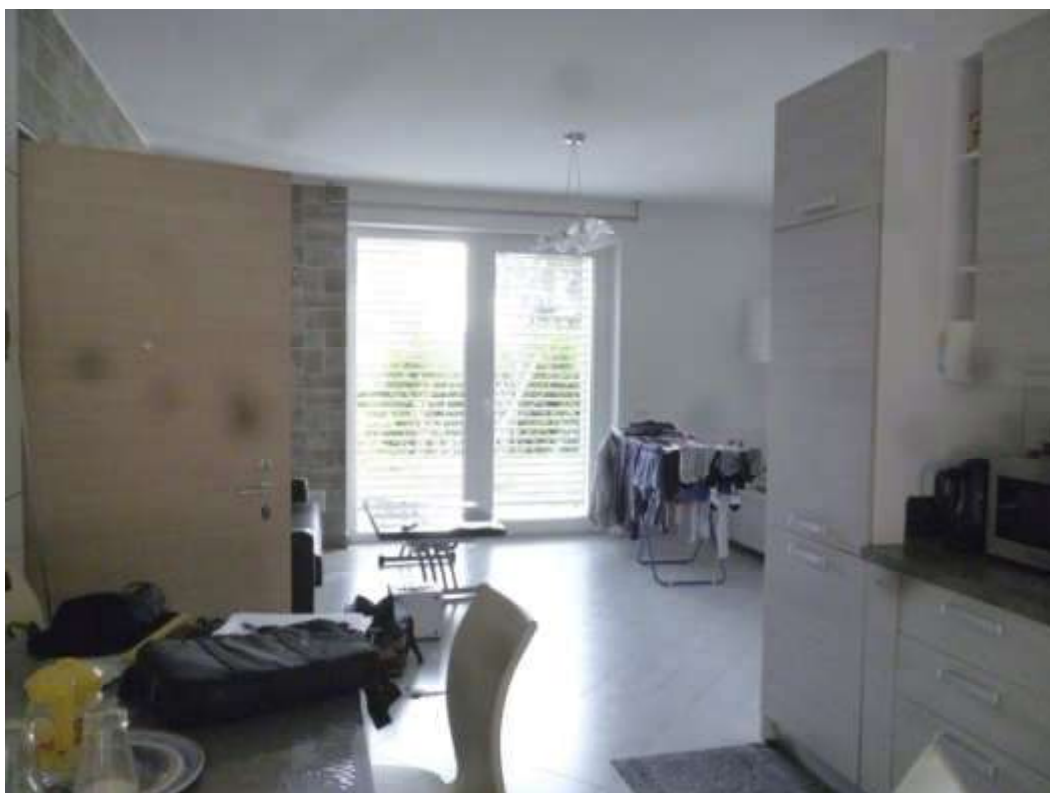
FOTO 6 - Soggiorno