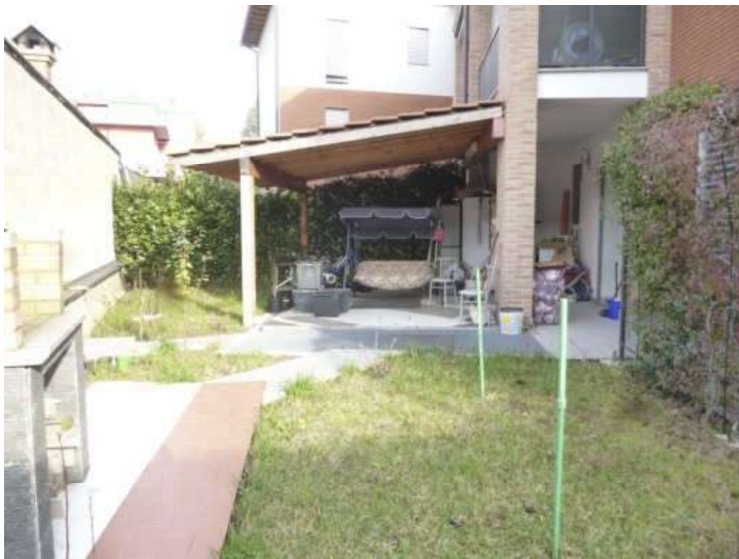
FOTO 13 - Tettoia realizzata su giardino di pertinenza lato porticato cucina