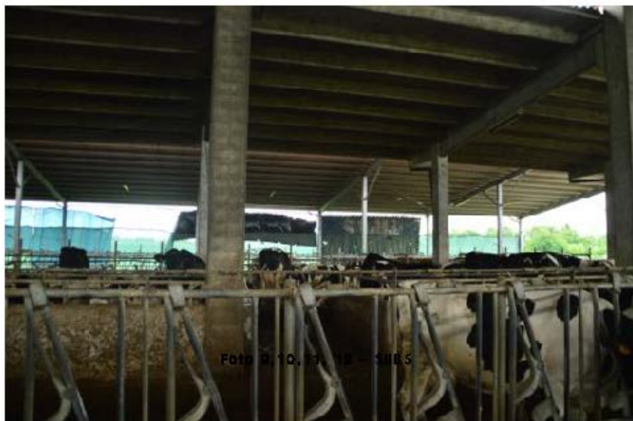
Foto 9, 10, 11, 12 - SIB 5