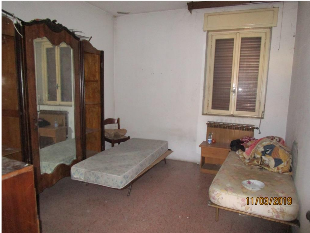
Foto 15 - Vista della seconda camera da letto al piano primo