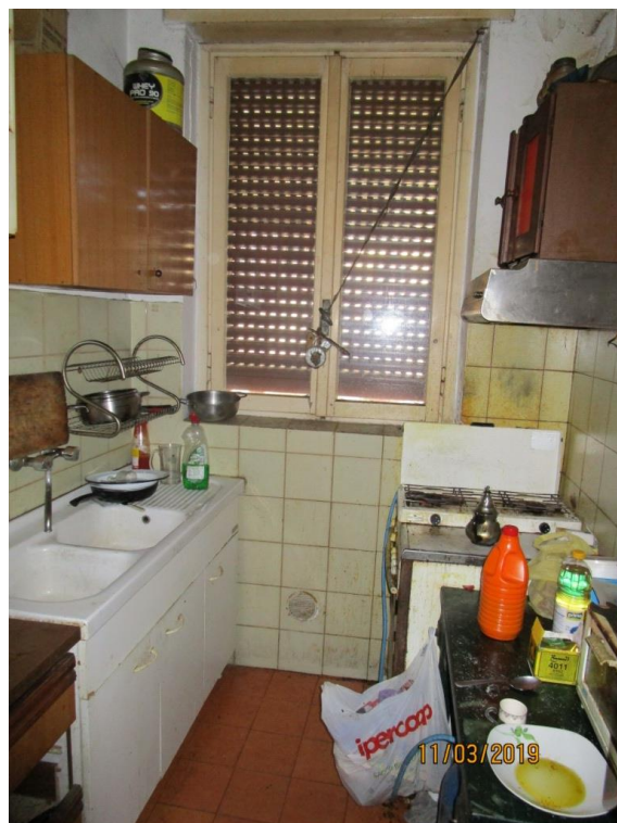
Foto 6 - Cucina