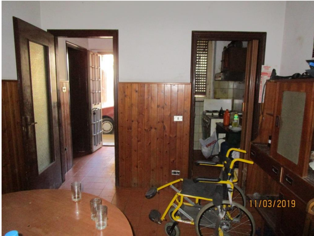
Foto 5 - Vista dal soggiorno, verso l'ingresso e la cucina