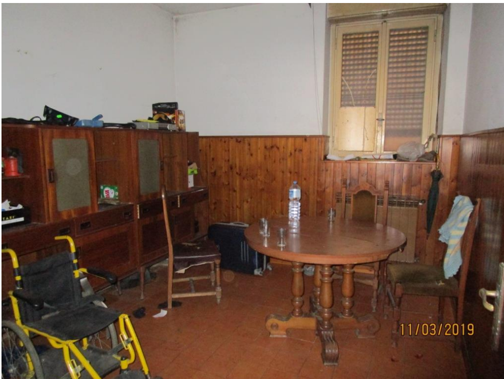
Foto 4 – Accesso all'appartamento e vista della sala da pranzo/soggiorno