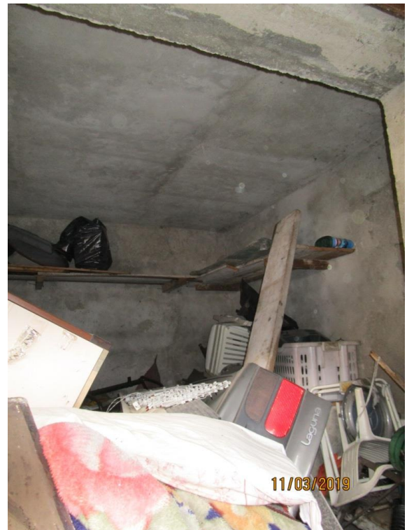
Foto 19/20 – Vista ed inquadramento del box e rustico sub 706 oggetto di pignoramento