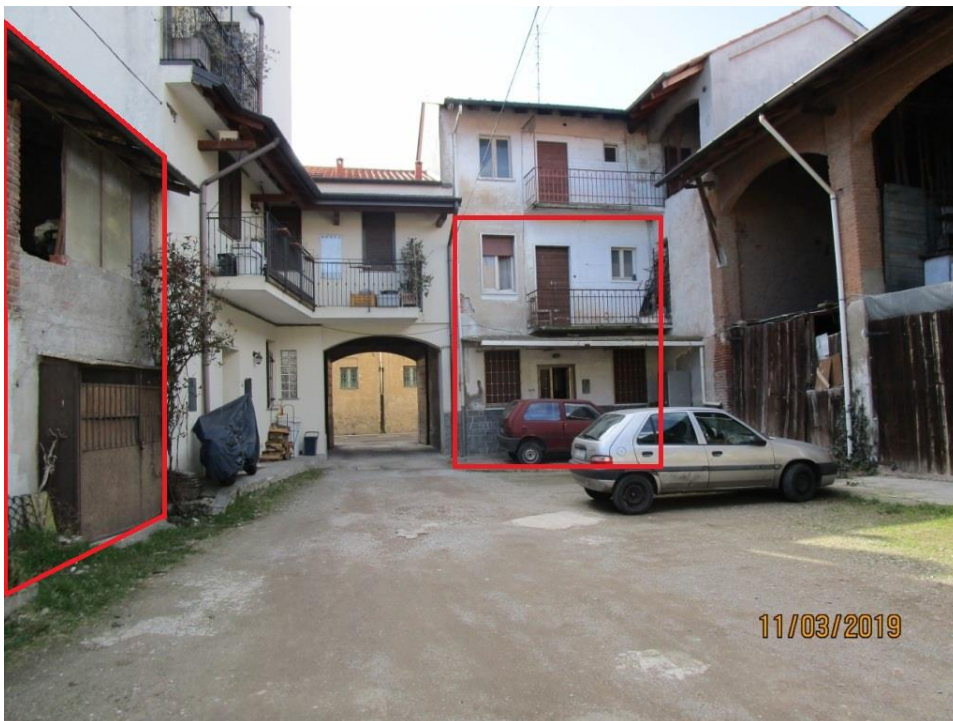
Foto 2 – Vista dalla corte comune. Riquadrate in rosso le unità immobiliari pignorate