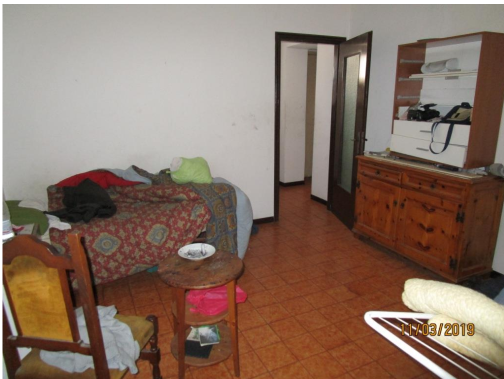
Foto 12 - Vista dalla camera da letto, verso il disimpegno