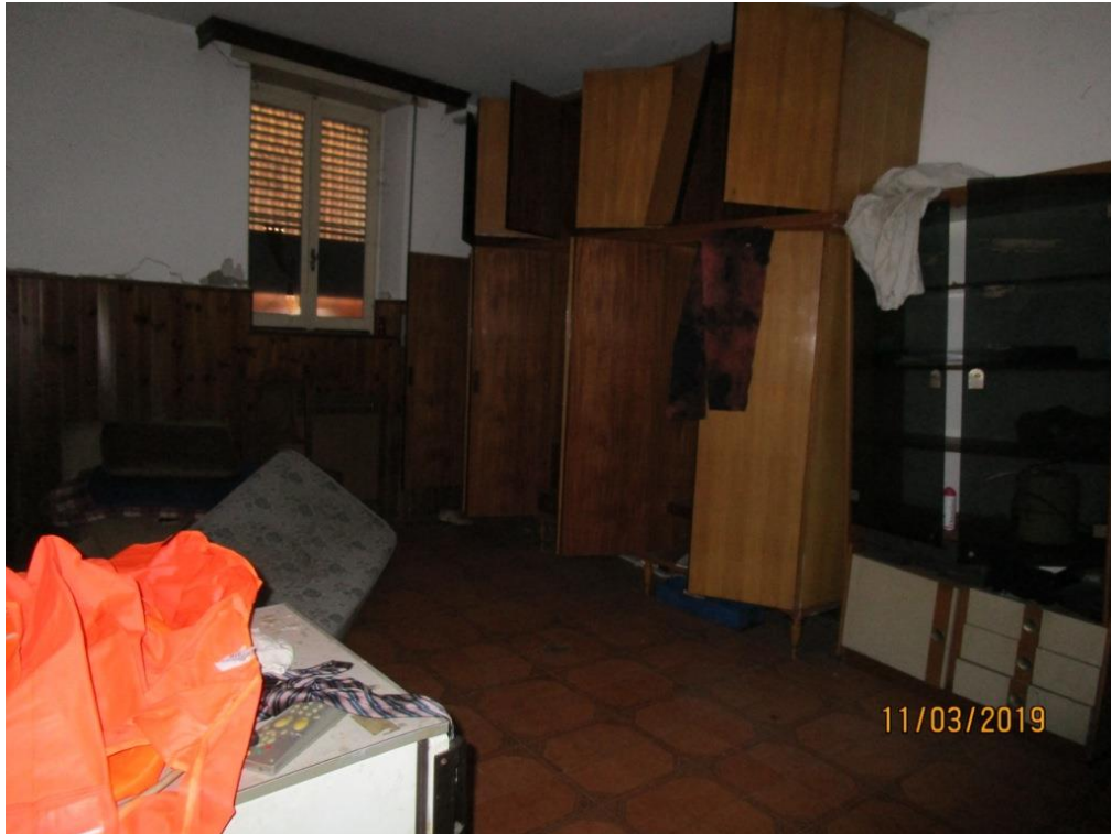
Foto 7 - Camera da letto al piano terra