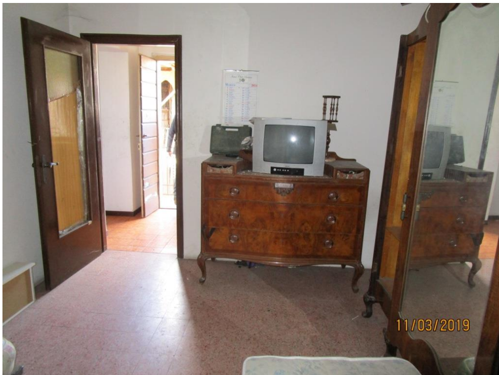
Foto 16 - Vista dalla seconda camera da letto, verso il disimpegno e l'accesso al balcone