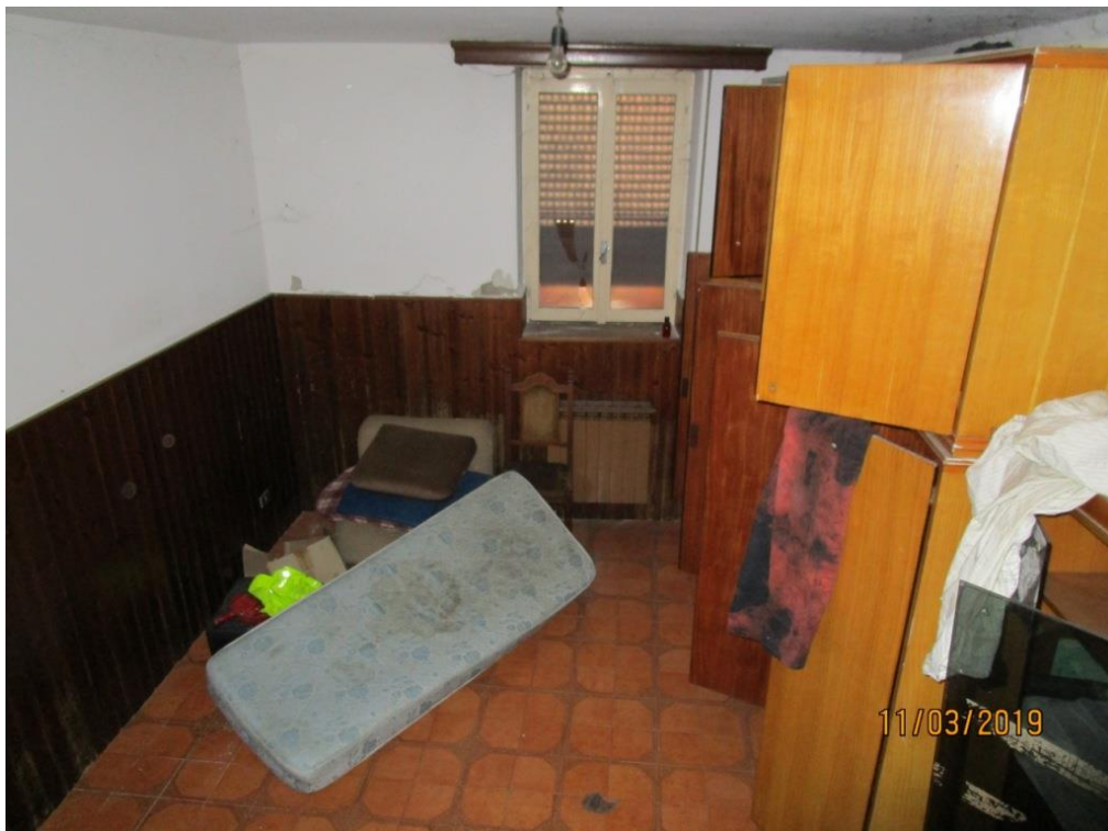
Foto 8 - Camera da letto al piano terra