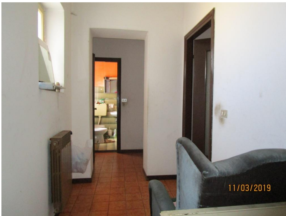
Foto 10 – Vista del piano primo, dal piano di sbarco della scala interna