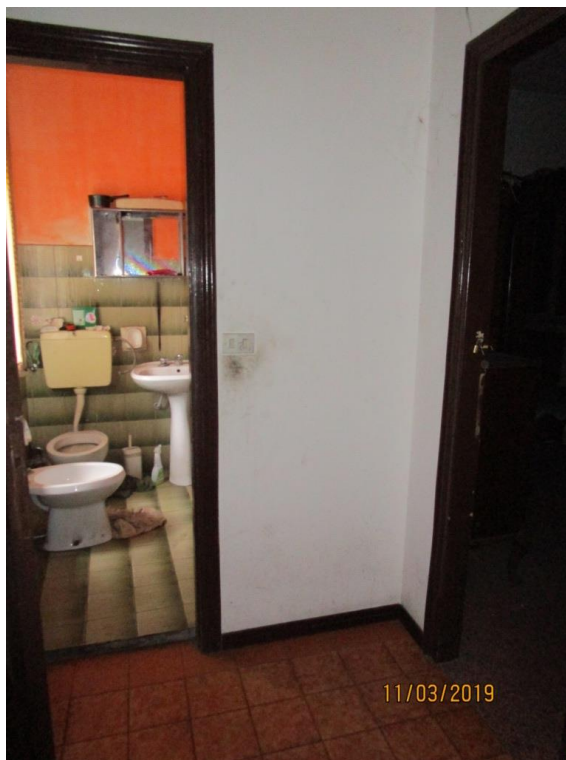
Foto 13 – Disimpegno di accesso alla seconda camera da letto ed al bagno