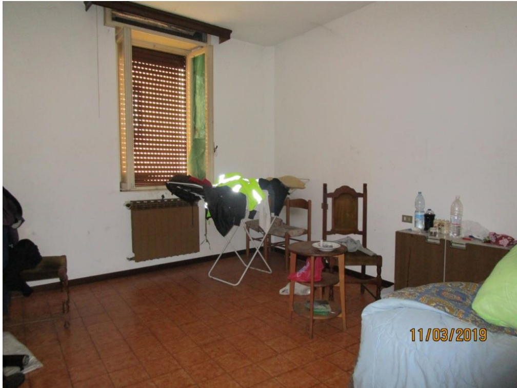
Foto 11 - Camera da letto al piano primo