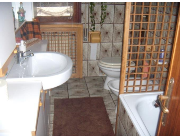
Bagno piano primo