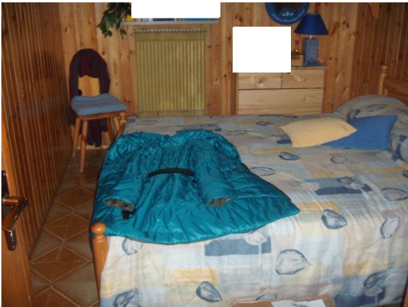
Cantina piano seminterrato