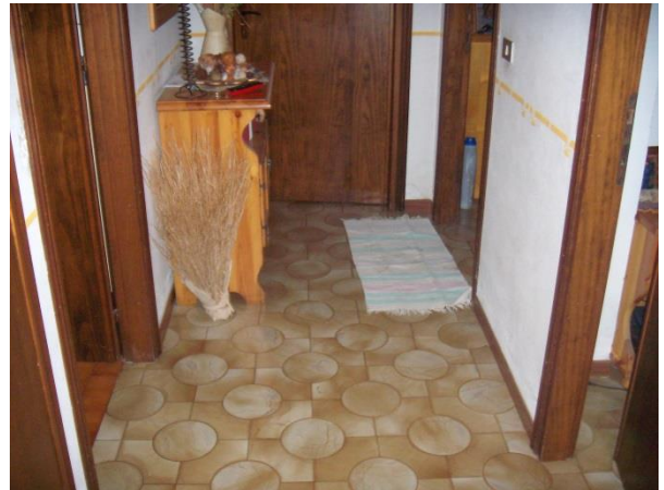
Disimpegno piano interrato