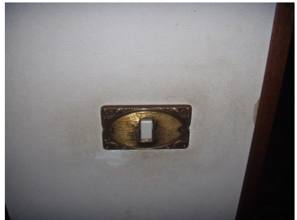
Particolare placche impianto elettrico