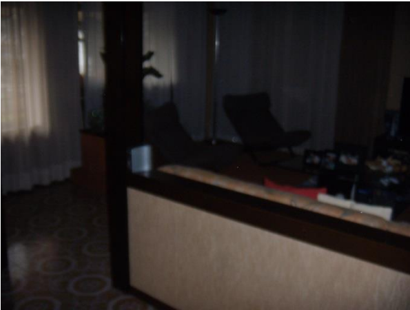
Soggiorno piano primo