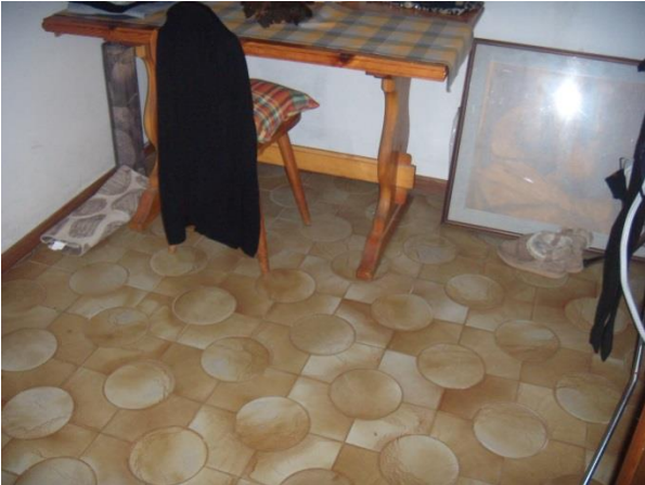
Disbrigo piano interrato