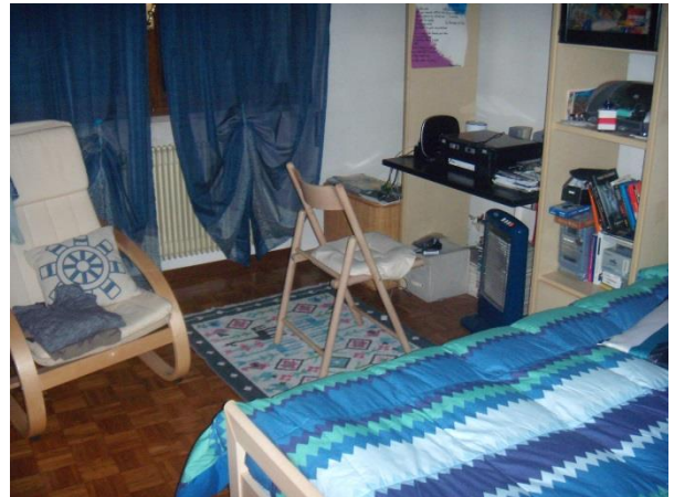
Camera piano primo