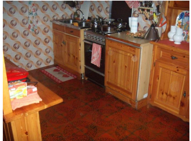
Taverna piano interrato