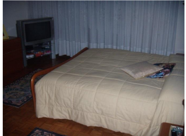
Camera piano primo