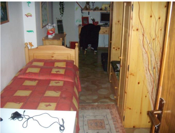
Ripostiglio piano seminterrato