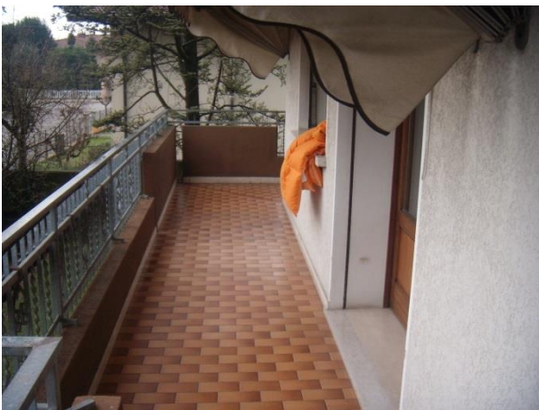
Terrazzo a Sud