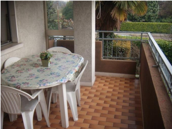
Terrazzo a Sud