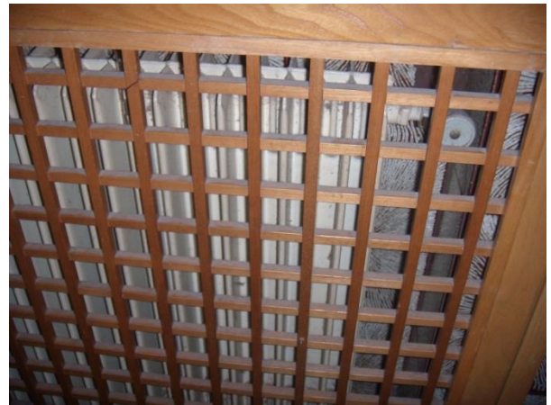
Particolare griglie copritermo