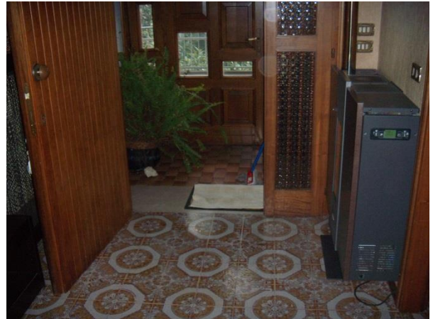
Ingresso piano primo