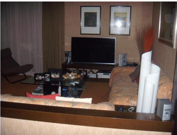
Soggiorno piano primo