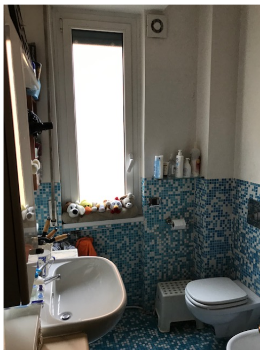
Bagno _ Foto _ 14

Abitazione _ Via Cilea, 6 _ Pioltello (MI)