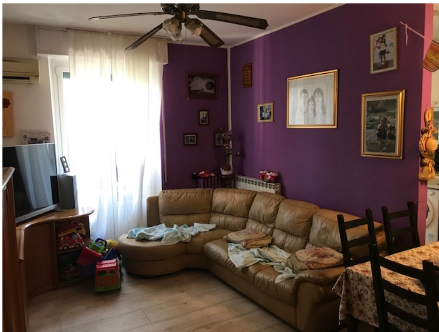
Salone – Soggiorno _ Foto _ 11

Arch. Giuseppe Barone _ Albo CTU n. 15129