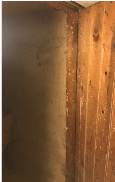
Cantina _ Foto _ 20

Abitazione _ Via Cilea, 6 _ Pioltello (MI)