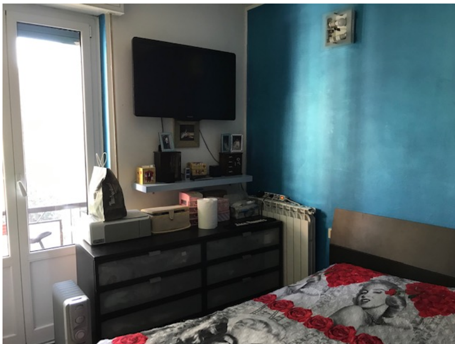
Camera da letto _ Foto _ 15

Arch. Giuseppe Barone _ Albo CTU n. 15129