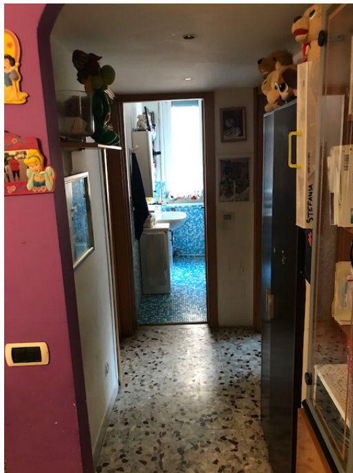
Disimpegno _ Foto _ 13

Arch. Giuseppe Barone _ Albo CTU n. 15129