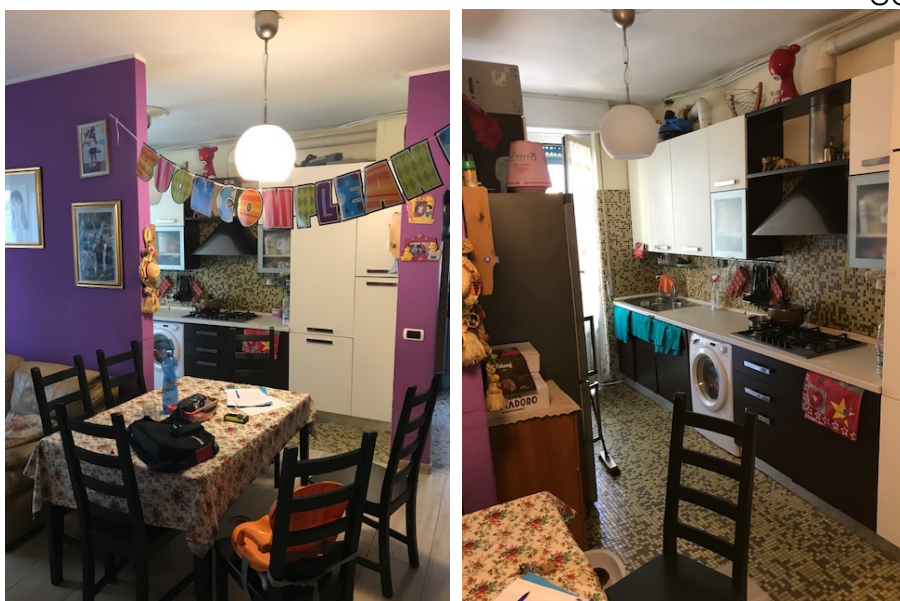
Cucina con affaccio sul soggiorno _ Foto _ 12

Abitazione _ Via Cilea, 6 _ Pioltello (MI)