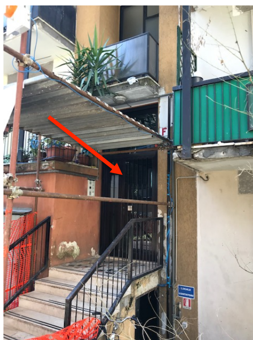
Ingresso Scala F _ Foto _ 6

Abitazione _ Via Cilea, 6 _ Pioltello (MI)