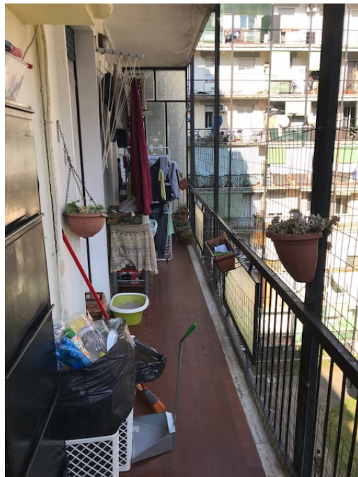
Balcone _ Foto _ 17

Arch. Giuseppe Barone _ Albo CTU n. 15129