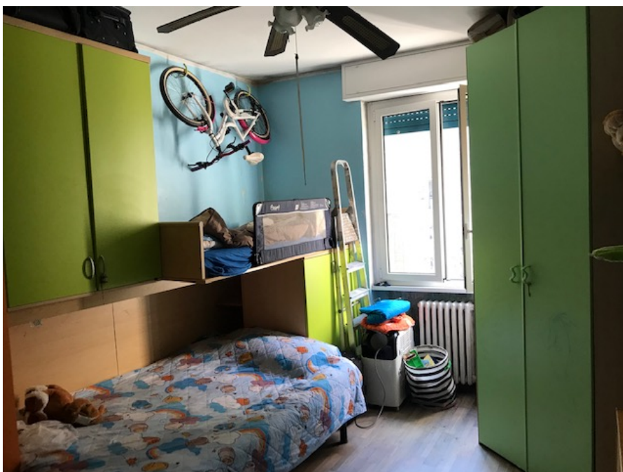
Camera da letto _ Foto _ 16

Abitazione _ Via Cilea, 6 _ Pioltello (MI)