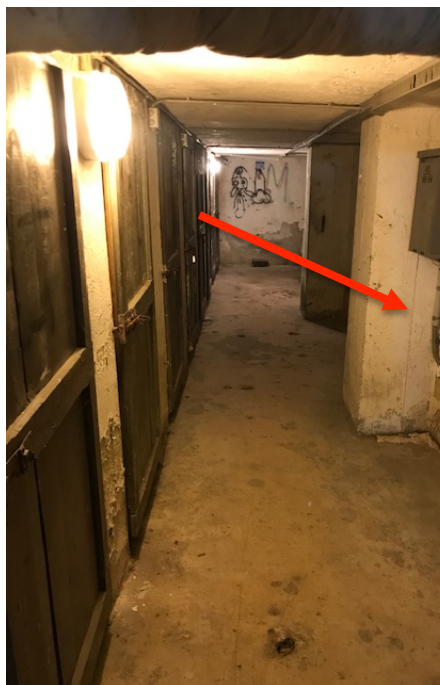
Ingresso S1 Cantina _ Foto _ 19