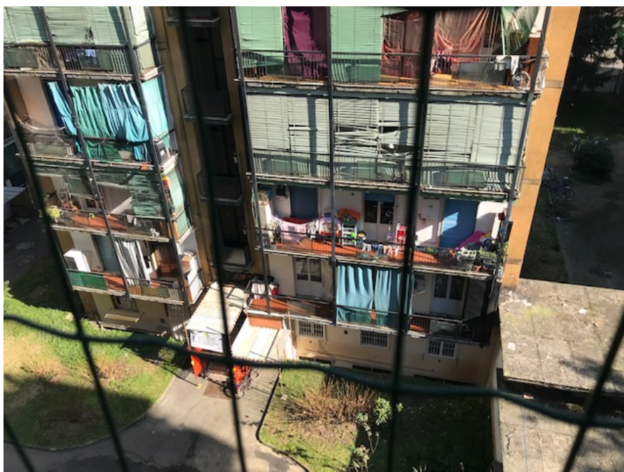
Vista affaccio dal balcone _ Foto _ 18

Abitazione _ Via Cilea, 6 _ Pioltello (MI)