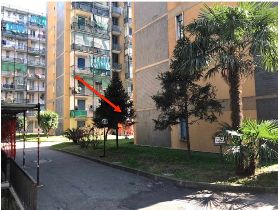
Cortile in comune _ Foto _ 5

Arch. Giuseppe Barone _ Albo CTU n. 15129