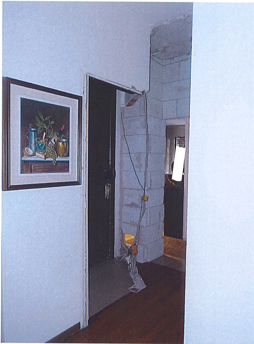
Foto 16 – Altra vista del corridoio con il muro visto in precedenza e la porta d'ingresso di servizio sulla sinistra.