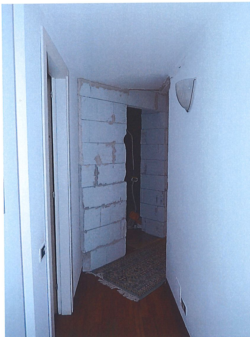
Foto 15 – Il corridoio. Sullo sfondo il muro realizzato per il frazionamento in due unità con il varco di passaggio.