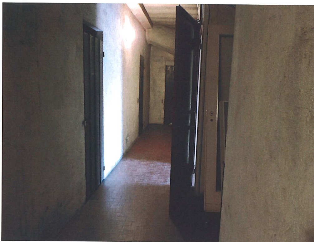
Foto 18 – Il piano sottotetto. Vista d'insieme del corridoio comune.