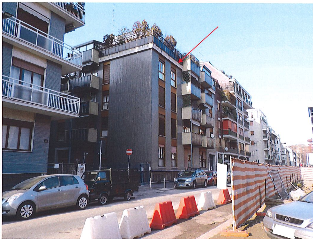
Foto 1 – La via Alberto Mario con il fabbricato in esame indicato dalla freccia.