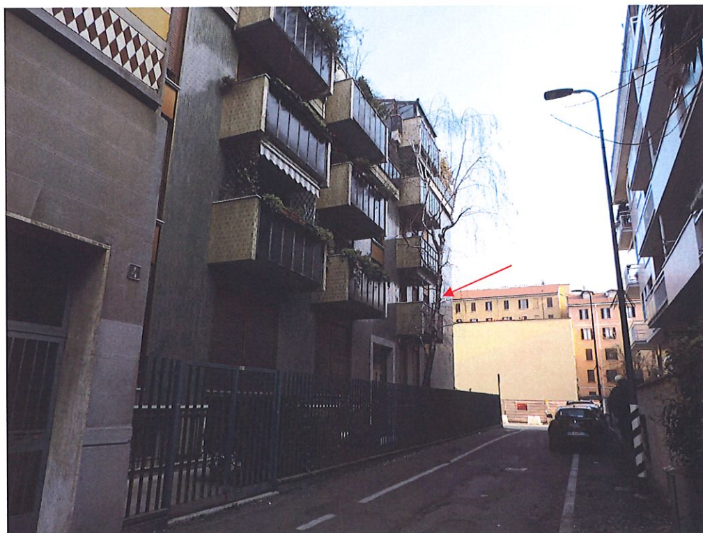
Foto 4 – Le altre finestre dell'unità in esame che si affacciano sulla via Morbelli.