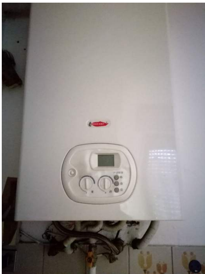
Foto 20 - balcone