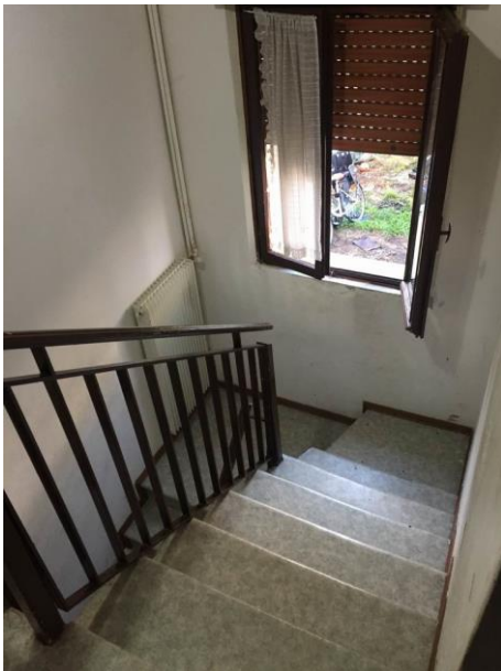
particolare scala interna con rivestimento in linoleum