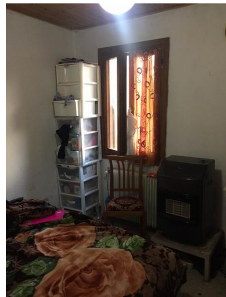
particolare ulteriore camera al primo piano