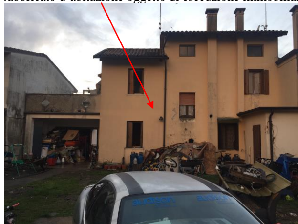
prospetto Est fabbricato

fabbricato d'abitazione oggetto di esecuzione immobiliare