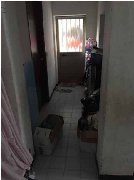
particolare corridoio al piano terra