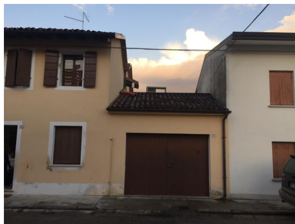
ulteriore particolare prospetto Ovest

fabbricato d'abitazione oggetto di esecuzione immobiliare