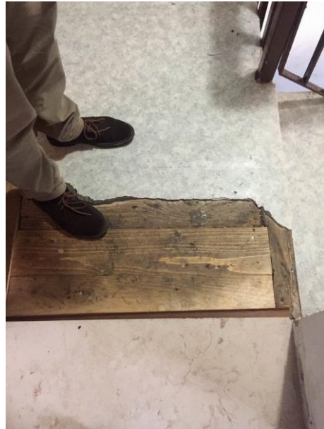
particolare degrado pavimento in linoleum al primo piano