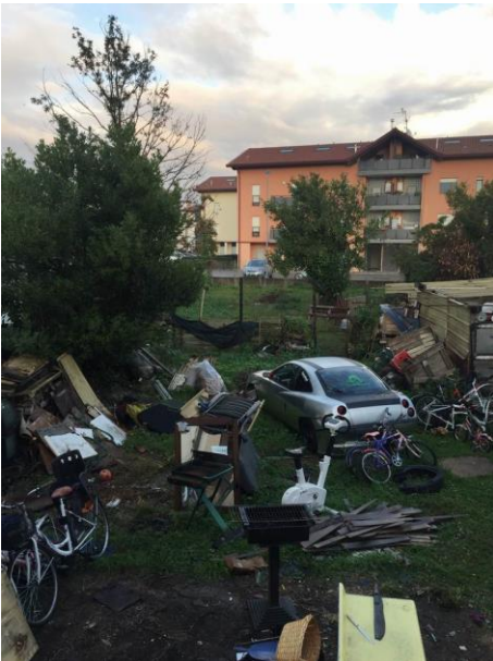
particolare degrado del cortile nel retro del fabbricato