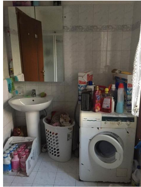
particolare bagno al piano terra