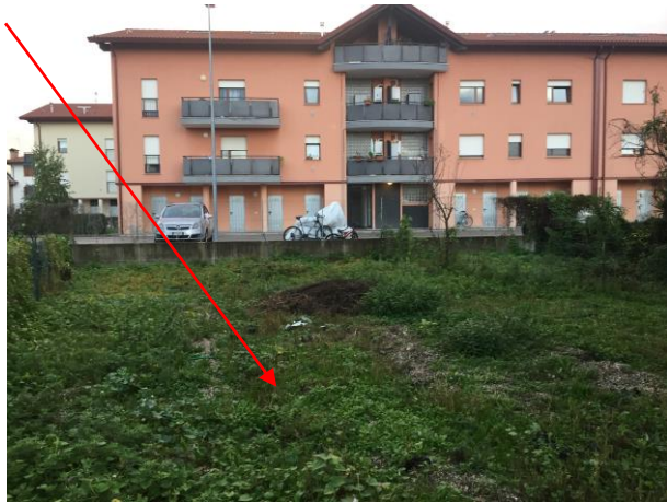
particolare mappale 1455