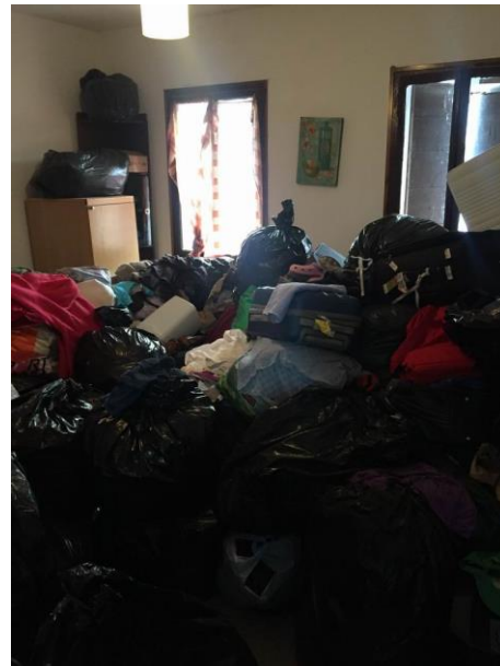
particolare camera al primo piano