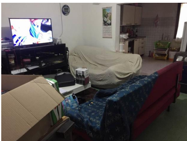
ulteriore particolare soggiorno al piano terra