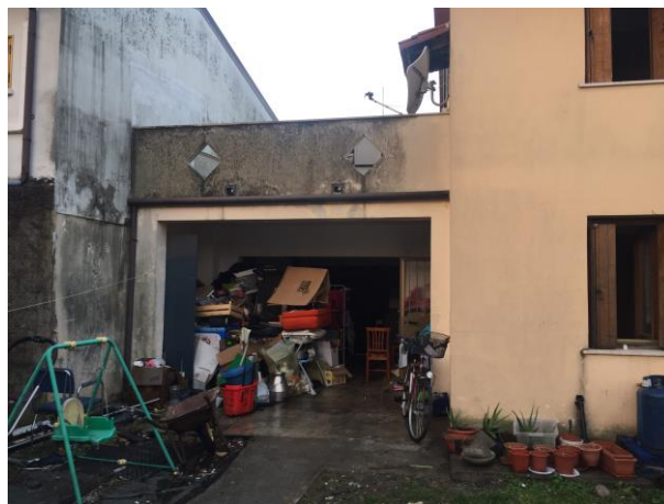
ulteriore particolare prospetto Est fabbricato