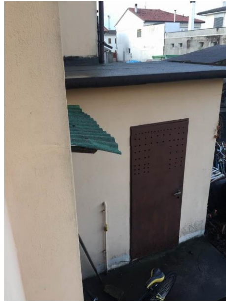
particolare centrale termica