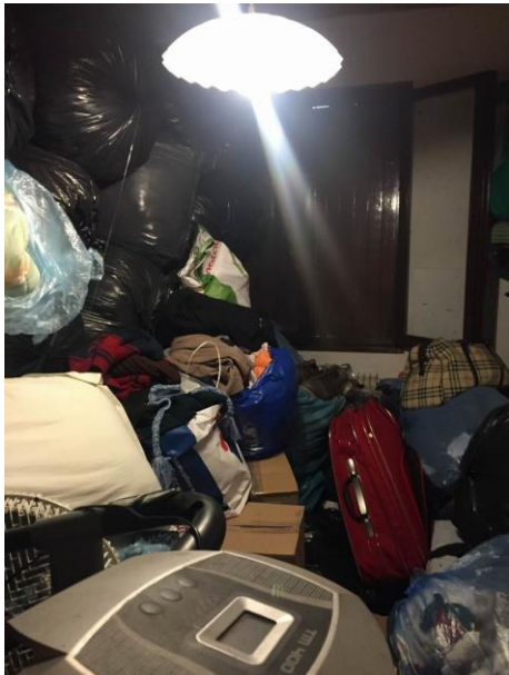
particolare ripostiglio al piano terra