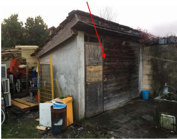
particolare adiacenza esterna ad uso ripostiglio