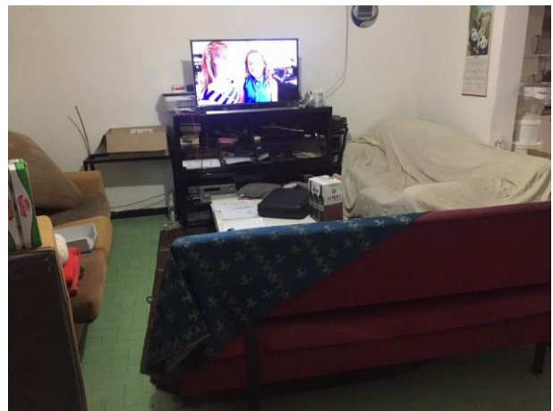
particolare soggiorno al piano terra