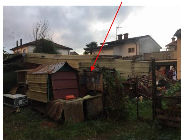
particolare struttura precaria abusiva non sanabile