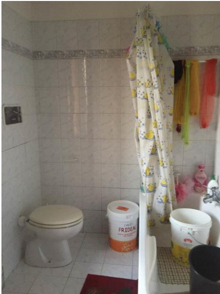
ulteriore particolare bagno al primo piano