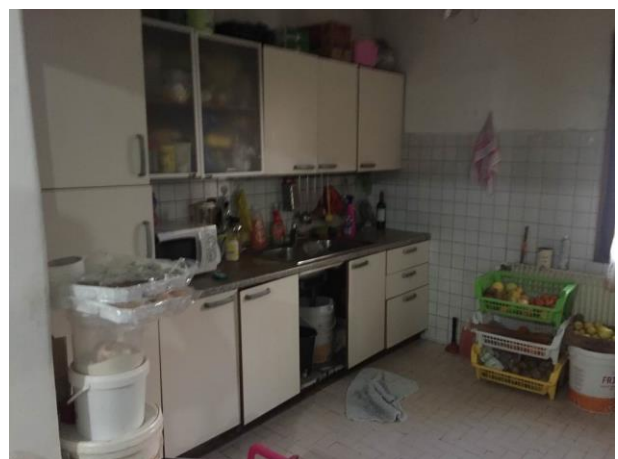
particolare cucina al piano terra