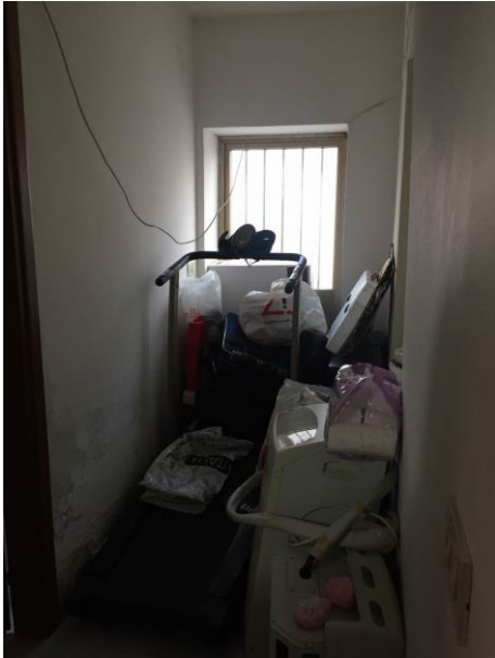
particolare corridoio al primo piano