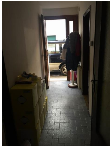
particolare atrio al piano terra