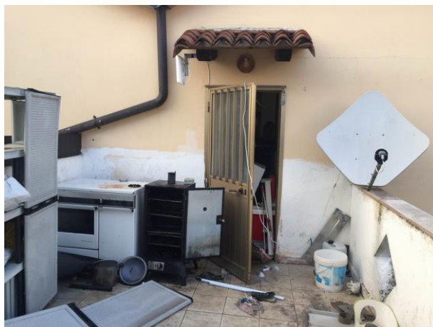
particolare terrazza al primo piano