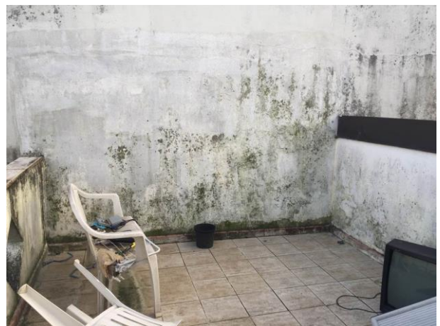
ulteriore particolare terrazza