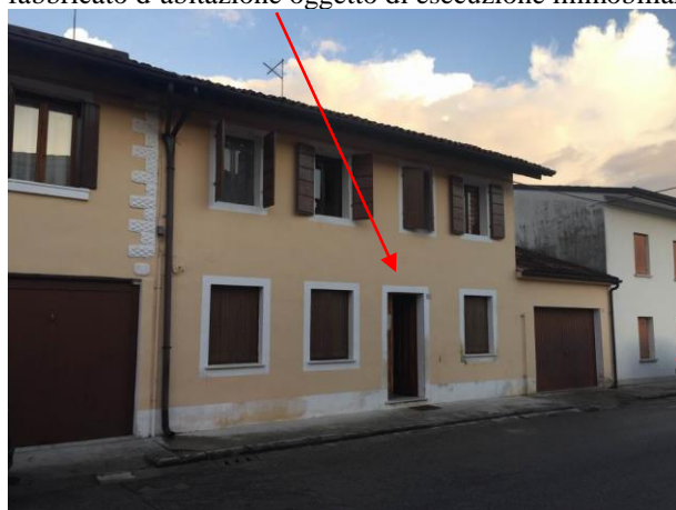
prospetto Ovest fabbricato lato fronte strada

fabbricato d'abitazione oggetto di esecuzione immobiliare