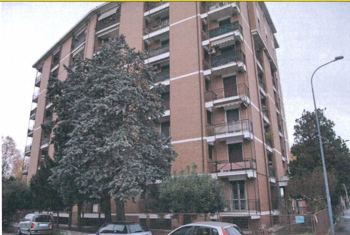
FOTO 2 Ingresso condominiale