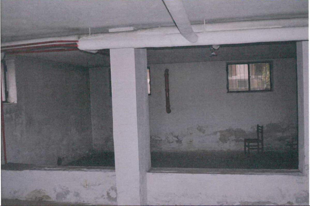
FOTO 10 WC