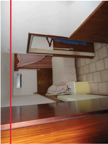
Particolare stufa disimpegno zona notte