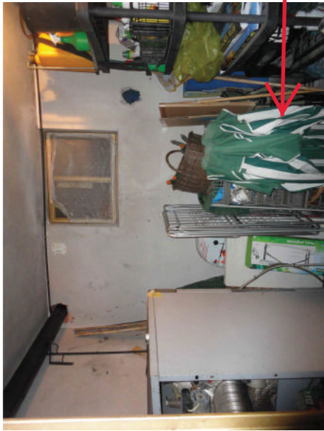
Centrale termica con accesso esterno