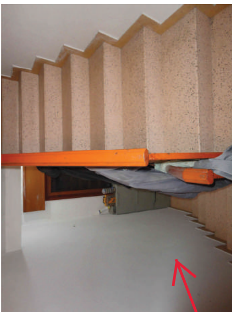
Vano scala p. T