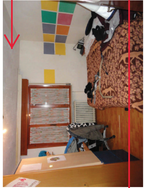
Disimpegno zona notte