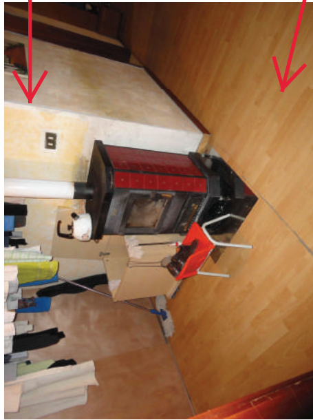
Particolare stufa disimpegno zona notte