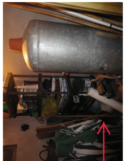
Soffitta p. 2