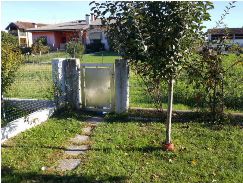
Il cancelletto di “comodo” non costituente diritto