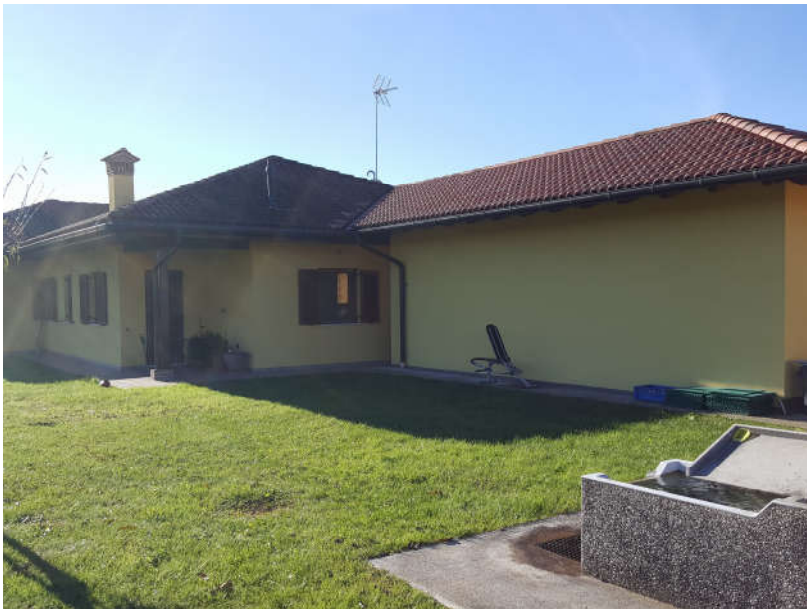
Fronte Nord – Est