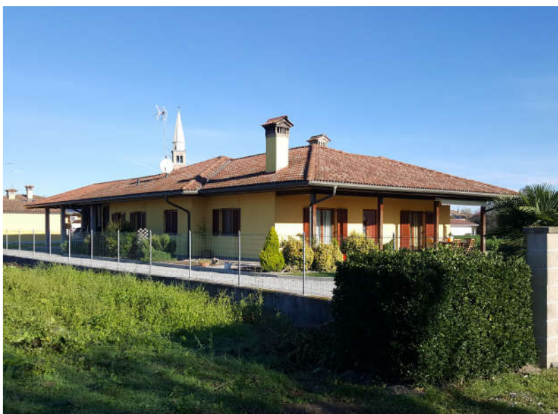
Fronte Sud - Ovest