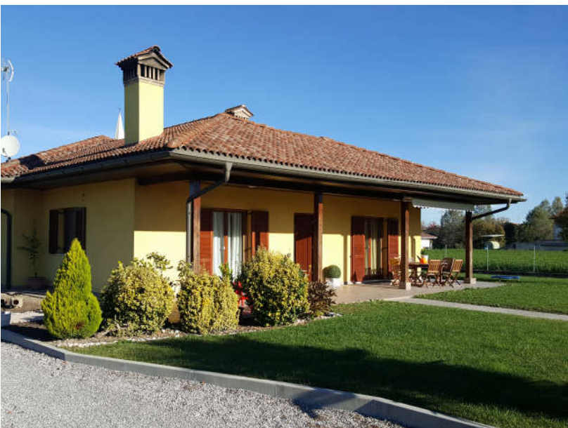
Fronte principale – Sud/Est