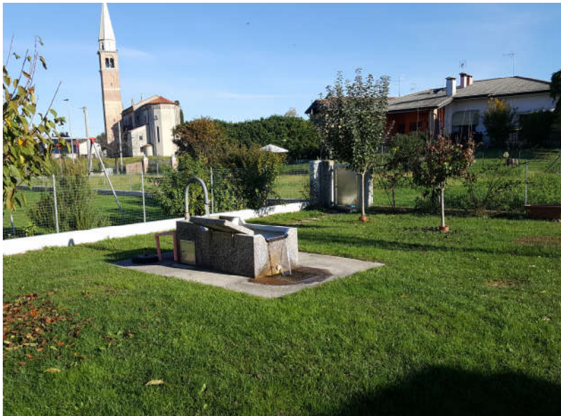
Il pozzo artesiano