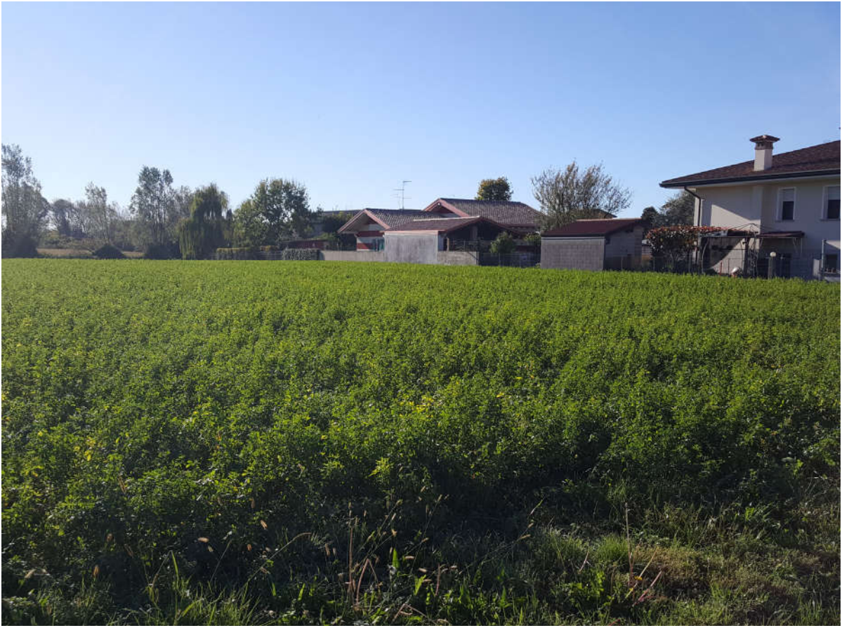
Terreno costituente il lotto 002 - si notano le costruzioni a confine