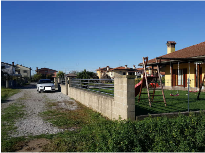
Fronte principale ingresso