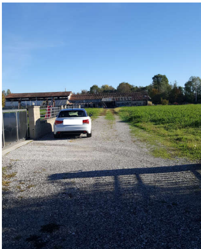
Area da asservire fronte ingresso abitazione