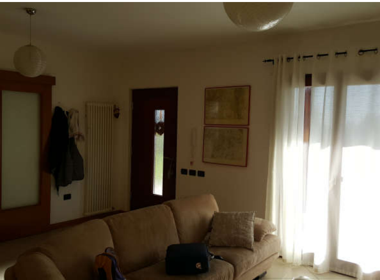
Il soggiorno e l'ingresso