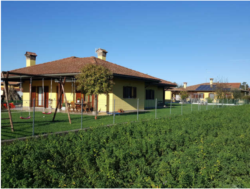
Angolo Est (fronti Nord – Est/Sud – Est)