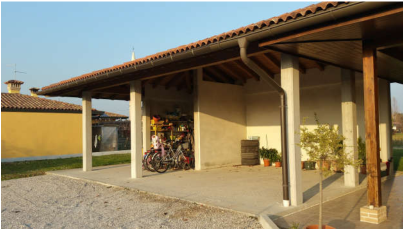
L'accessorio pertinenziale retro