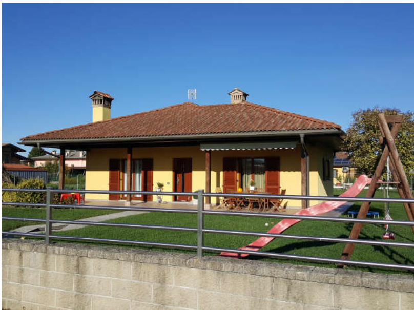
Fronte principale – Sud/Est