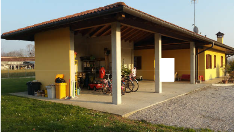
L'accessorio pertinenziale retro