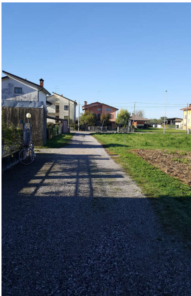
Accesso da via Bagnarola