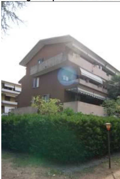
Foto 3: edificio dal giardino interno