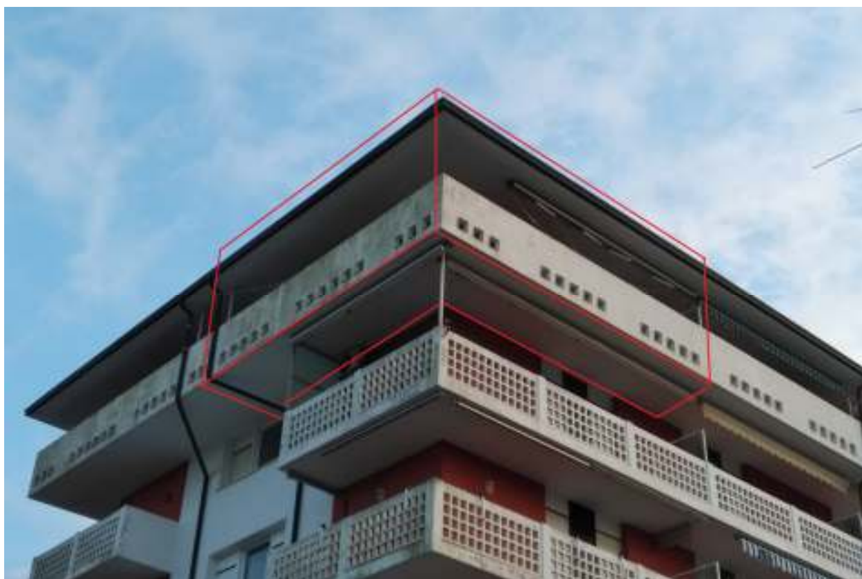
Foto n. 6 – Unità immobiliare oggetto di esecuzione, posta all'ultimo piano del condominio lato nord ovest (tratteggiata in rosso).