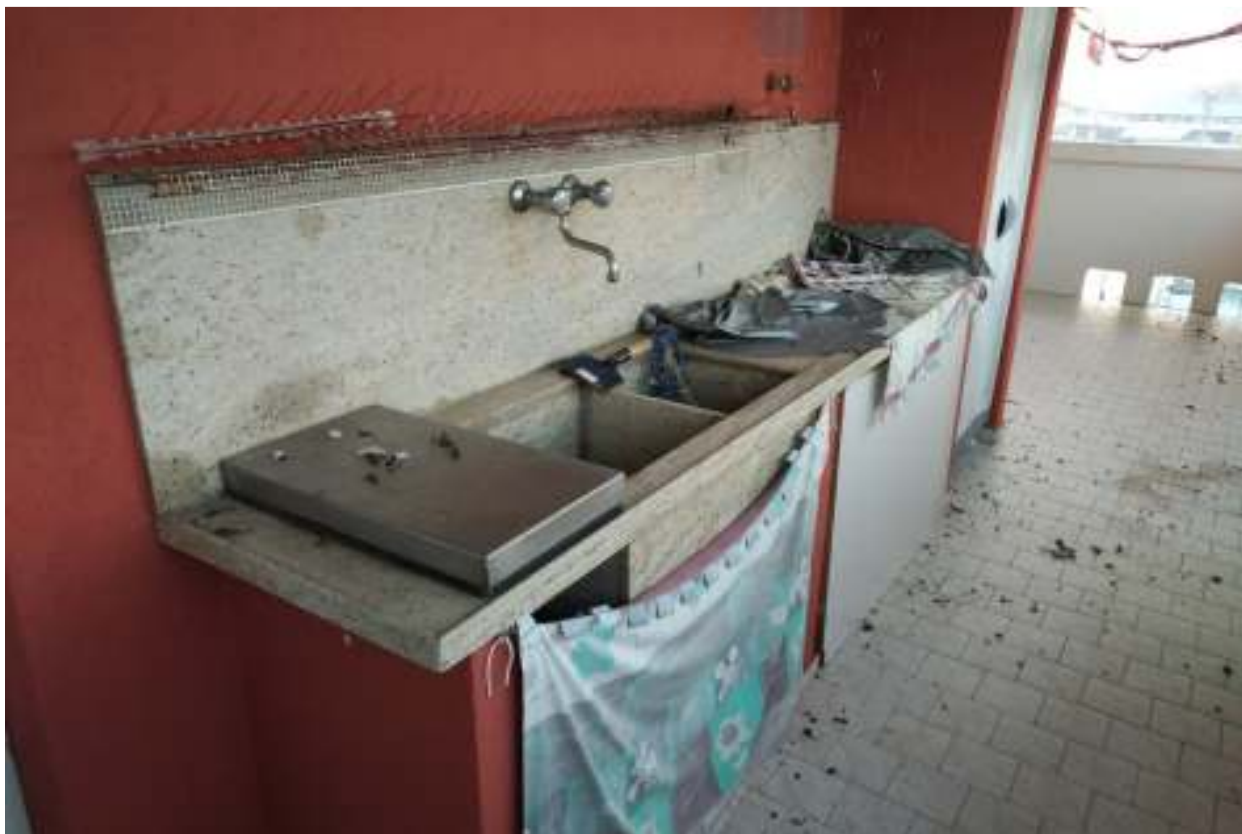
Foto n. 18 – Parete attrezzata del terrazzo nella porzione rivolta a nord.

FOTO – Bene in Caorle – loc. Porto Santa Margherita (VE) – via G. Da Verazzano n 68