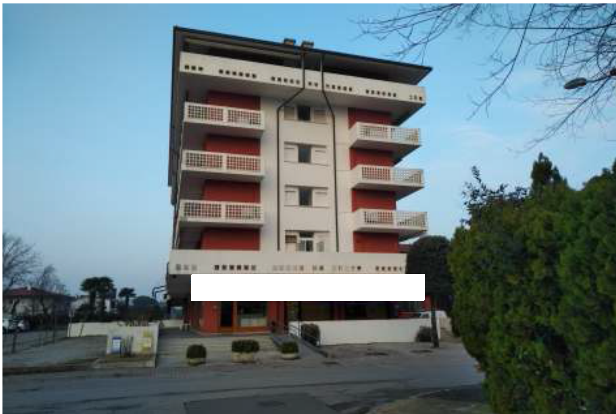
Foto n. 3 – Condominio con vista da via G. De Verazzano Verga (lato sud).

FOTO – Bene in Caorle – loc. Porto Santa Margherita (VE) – via G. Da Verazzano n 68