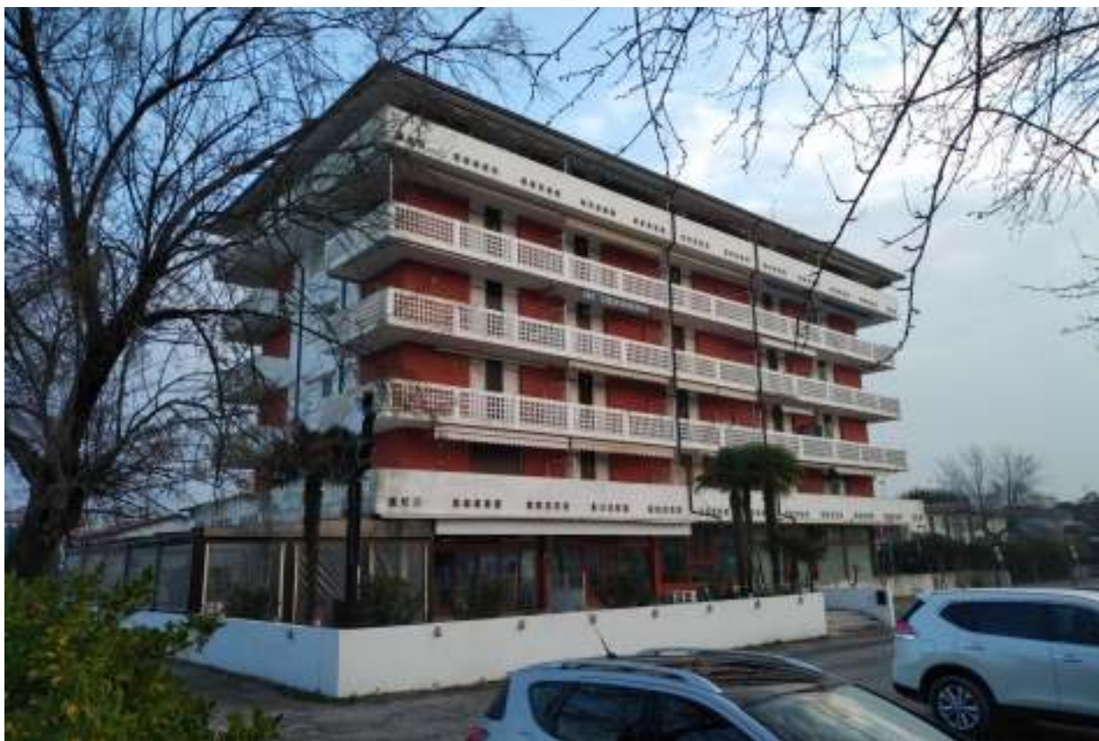
Foto n. 2 – Condominio visto dal parcheggio, con spalle alla darsena (lato Ovest).