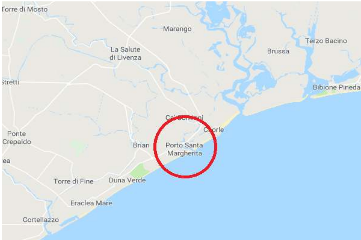
Foto n. I – Il contesto territoriale nel quale è inserito il bene esecutato – cerchiato in rosso e segnato.

FOTO – Bene in Caorle – loc. Porto Santa Margherita (VE) – via G. Da Verazzano n 68