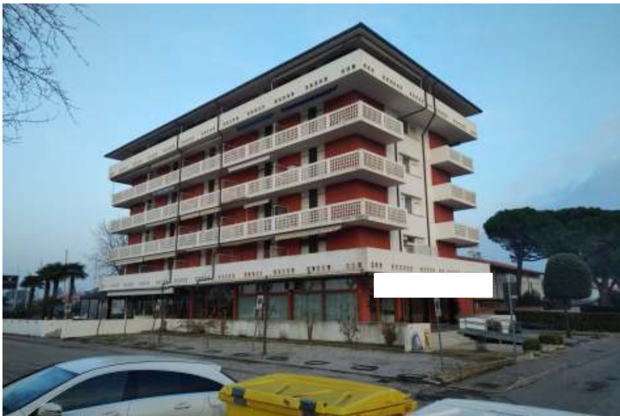
Foto n. 1 – Condominio con vista da via G. De Verazzano (lato Sud - Ovest).

FOTO – Bene in Caorle – loc. Porto Santa Margherita (VE) – via G. Da Verazzano n 68