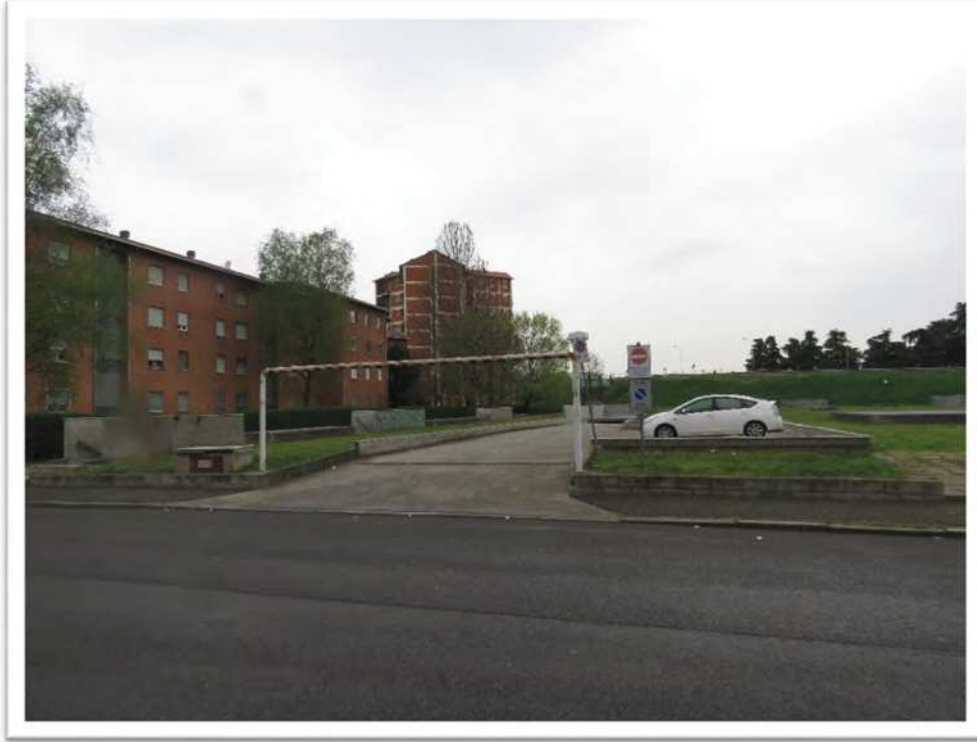
Vista dell'ingresso al complesso.