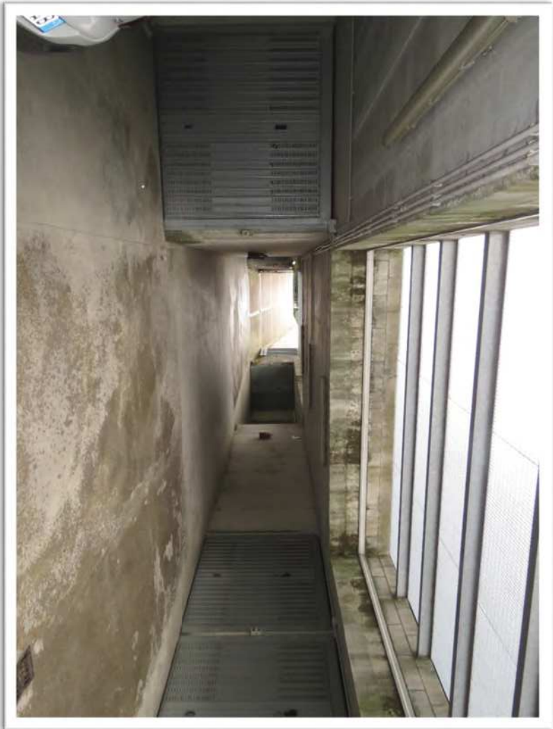
Autorimessa in esame e spazio di manovra antistante.