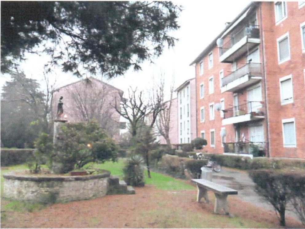
FOTO 1 e 2 – L'edificio, fronte e retro sul giardino condomiiale) di Via Carlo Lorenzini n° 20 in Bollate