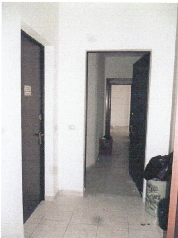
FOTO 3 – Area ante ingresso in condivisione con altro appartamento sub. 25