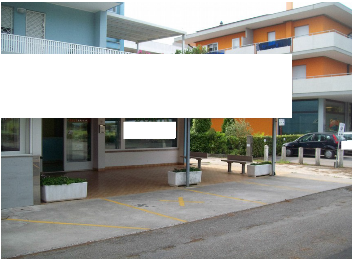
Foto 2: Particolare ingresso agenzia