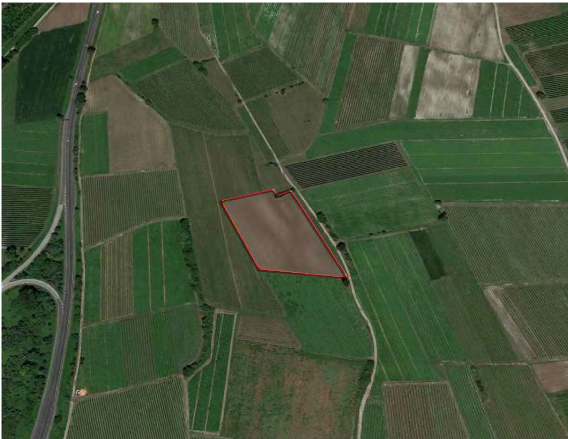
Lotto 1: Terreni in comune di San Giorgio della richinvelda al F. 11 mapp 151 e 152