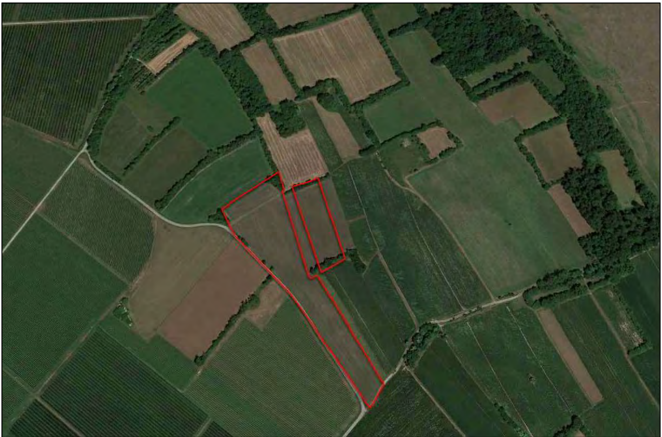
Lotto 1: Terreni in comune di Maniago F. 53 mapp 21-22-23-24-25-28-36

E.I. 140/2018 Allegato 1 Rilievo Fotografico