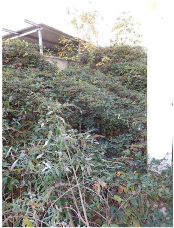
FOTO 15: Interno dell'unità pignorata – Vista di dettaglio del sistema d'apertura dei portoni. FOTO 16: Esterno dell'unità pignorata – Scorcio dell'area scoperta pertinenziale di cui al sub. 209.