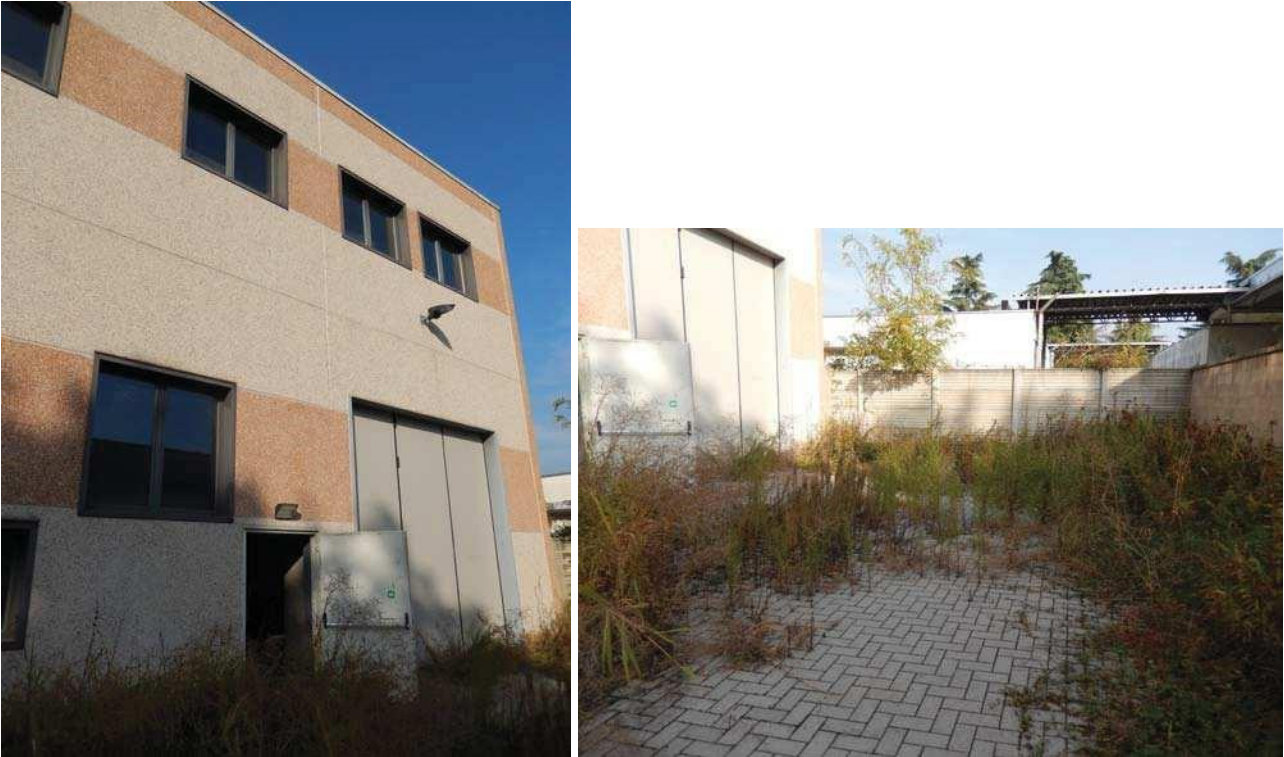
FOTO 6: Ulteriore vista del fronte Sud-Est dell'unità pignorata, dall'area scoperta pertinenziale. FOTO 7: Scorcio dell'area scoperta pertinenziale di cui al mappale 203.