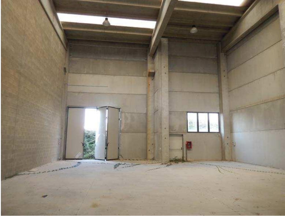
FOTO 9: Interno dell'unità pignorata – Ulteriore vista d'insieme, sempre verso la parete Nord-Ovest.