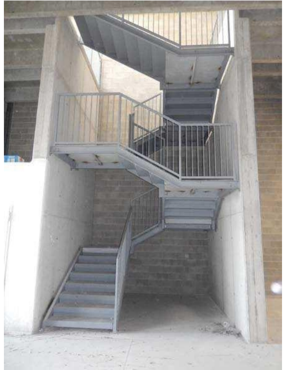
FOTO 11: Interno dell'unità pignorata – Ulteriore scorcio verso le pareti Sud-Est e Sud-Ovest. Su quest'ultima sono attestati i servizi igienici (indicati dalla freccia) e la scala. FOTO 12: Interno dell'unità pignorata – Vista d'insieme della scala metallica di collegamento con la soprastante area sovrapposta.