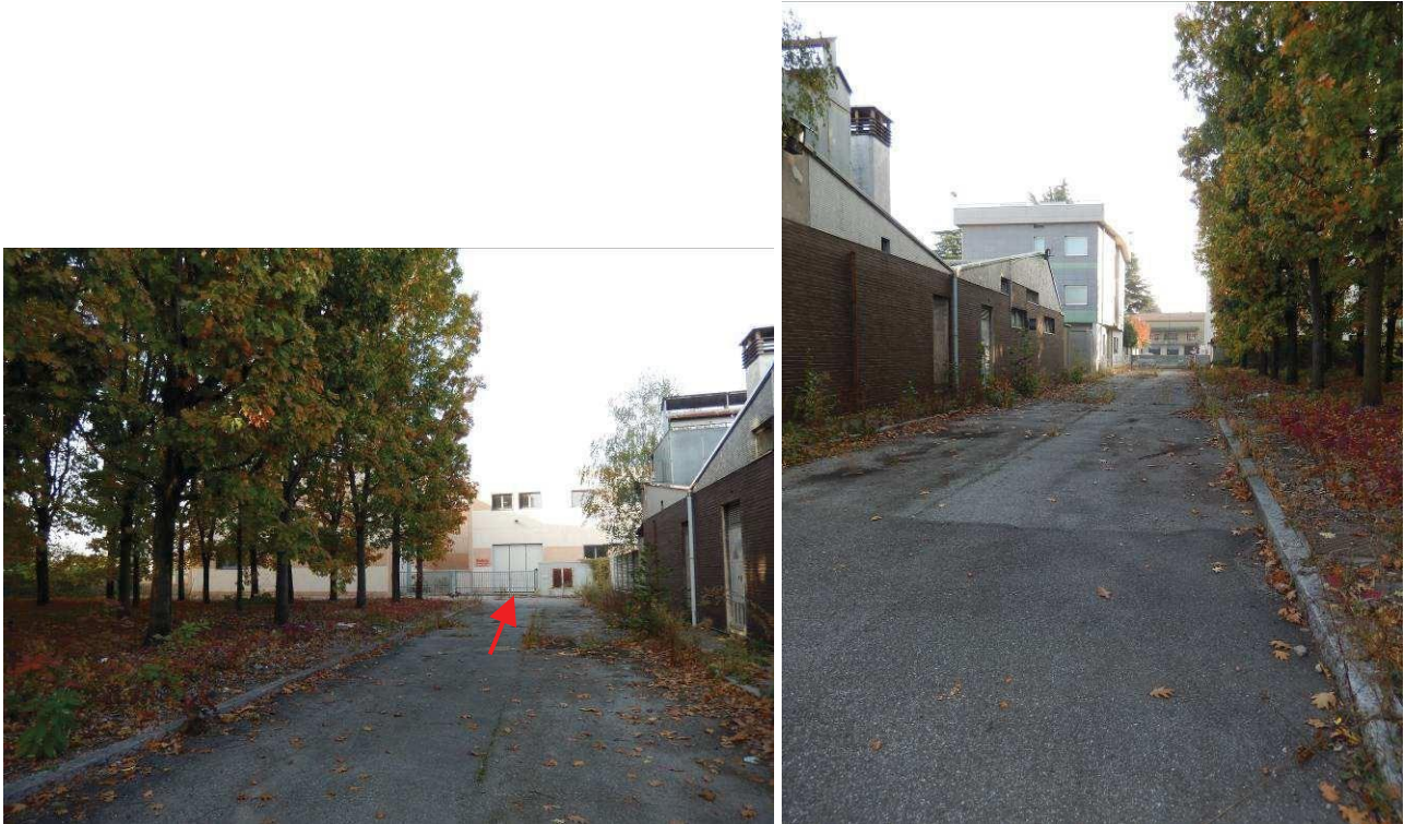
FOTO 2 e 3: Viste della strada interna sulla quale è costituita servitù di passaggio a favore dell'unità pignorata (il cui primo cancello d'ingresso è indicato dalla freccia rossa). L'immagine a destra guarda verso l'ingresso comune di cui alla FOTO 1.