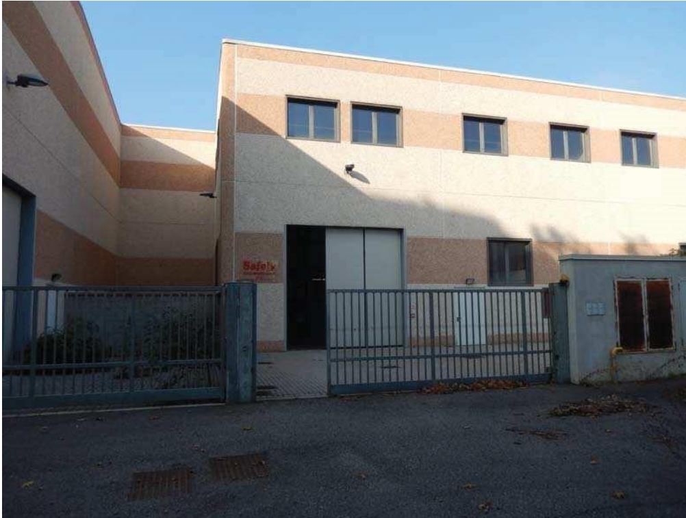
FOTO 4: Vista di maggiore dettaglio del cancello carraio comune che fornisce accesso all'unità pignorata (cancello che si apre su un'area scoperta anch'essa comune con i subb. 3 e 4).