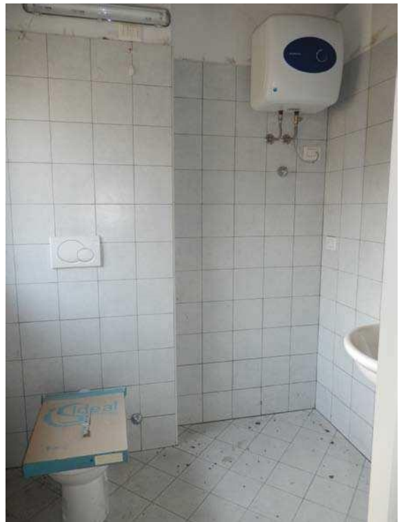
FOTO 13: Interno dell'unità pignorata – Scorcio dell'antibagno. FOTO 14: Interno dell'unità pignorata – Scorcio del servizio igienico accessibile a persone disabili.