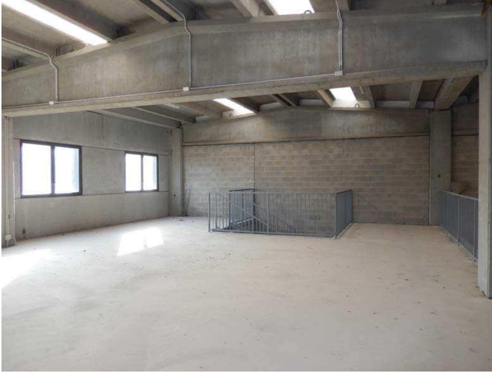
FOTO 18: Interno dell'unità pignorata – Ulteriore scorcio dell'area soppalcata, con vista verso l'arrivo della scala interna.