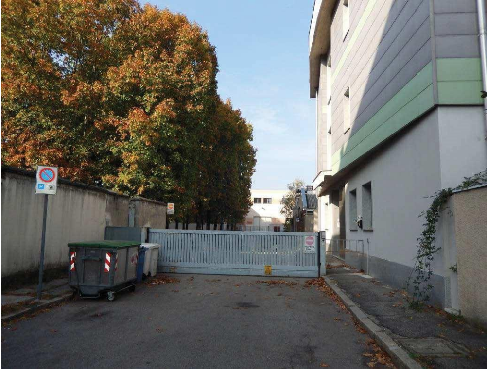
FOTO 1: Vista dalla strada dell'ingresso comune (carraio e pedonale) al compendio immobiliare in cui è sita l'unità pignorata.