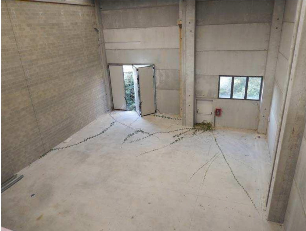
FOTO 19: Interno dell'unità pignorata – Scorcio dell'interno del capannone, dall'area soppalcata, con vista verso la parete Nord-Ovest.