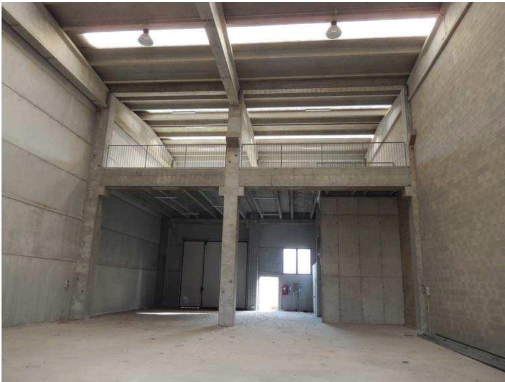
FOTO 10: Interno dell'unità pignorata – Vista d'insieme (verso la parete Sud-Est), con la soprastante area soppalcata.