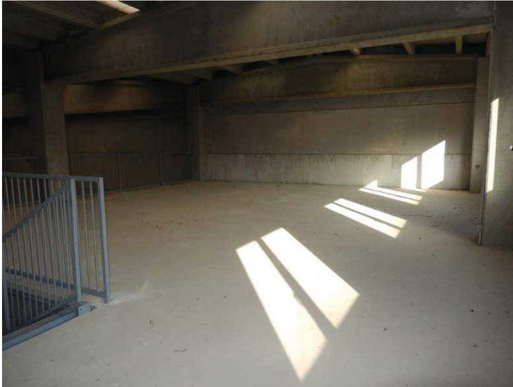
FOTO 17: Interno dell'unità pignorata – Scorcio dell'area soppalcata dalla zona d'arrivo della scala interna.