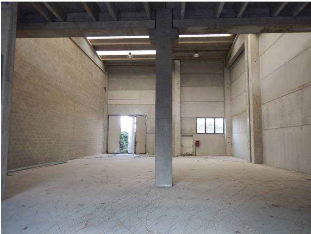
FOTO 8: Interno dell'unità pignorata – Vista d'insieme verso la parete Nord-Ovest (sullo sfondo), laddove è ubicata l'altra area scoperta pertinenziale di cui al mappale 209.