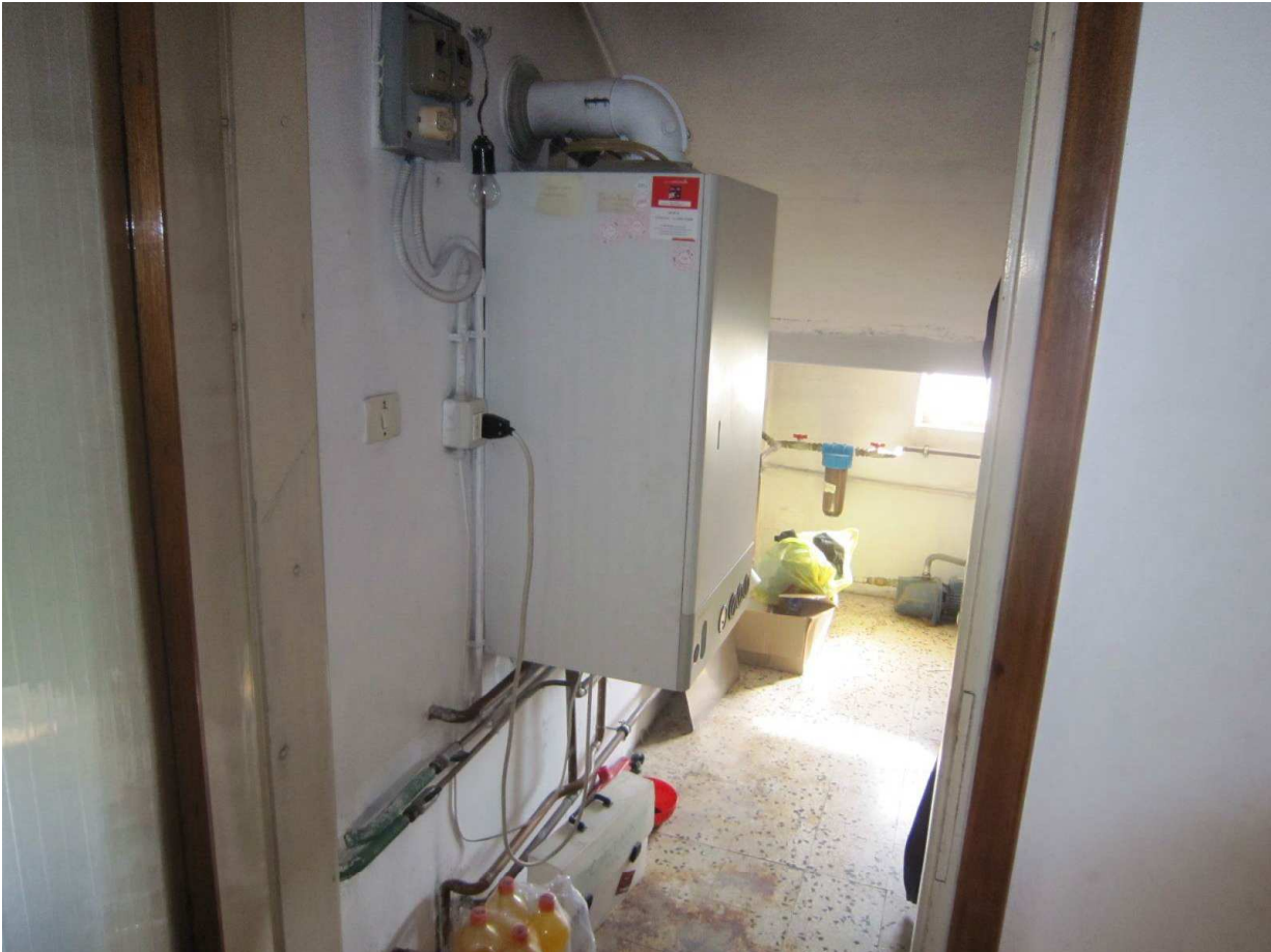
Foto n.10: Ripostiglio con centrale termica al P.T. (Sub.3) oggetto di E.I..