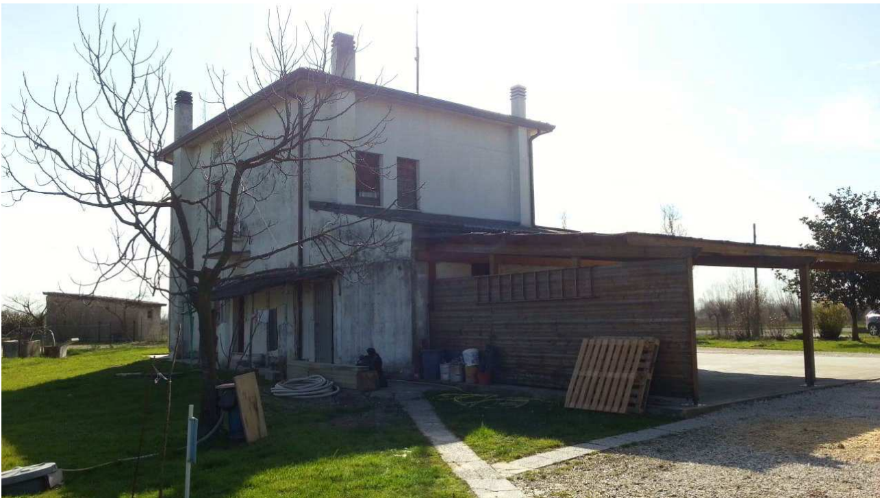
Foto n.6: Prospetto Ovest dell'abitazione (Sub.3) oggetto di E.I.