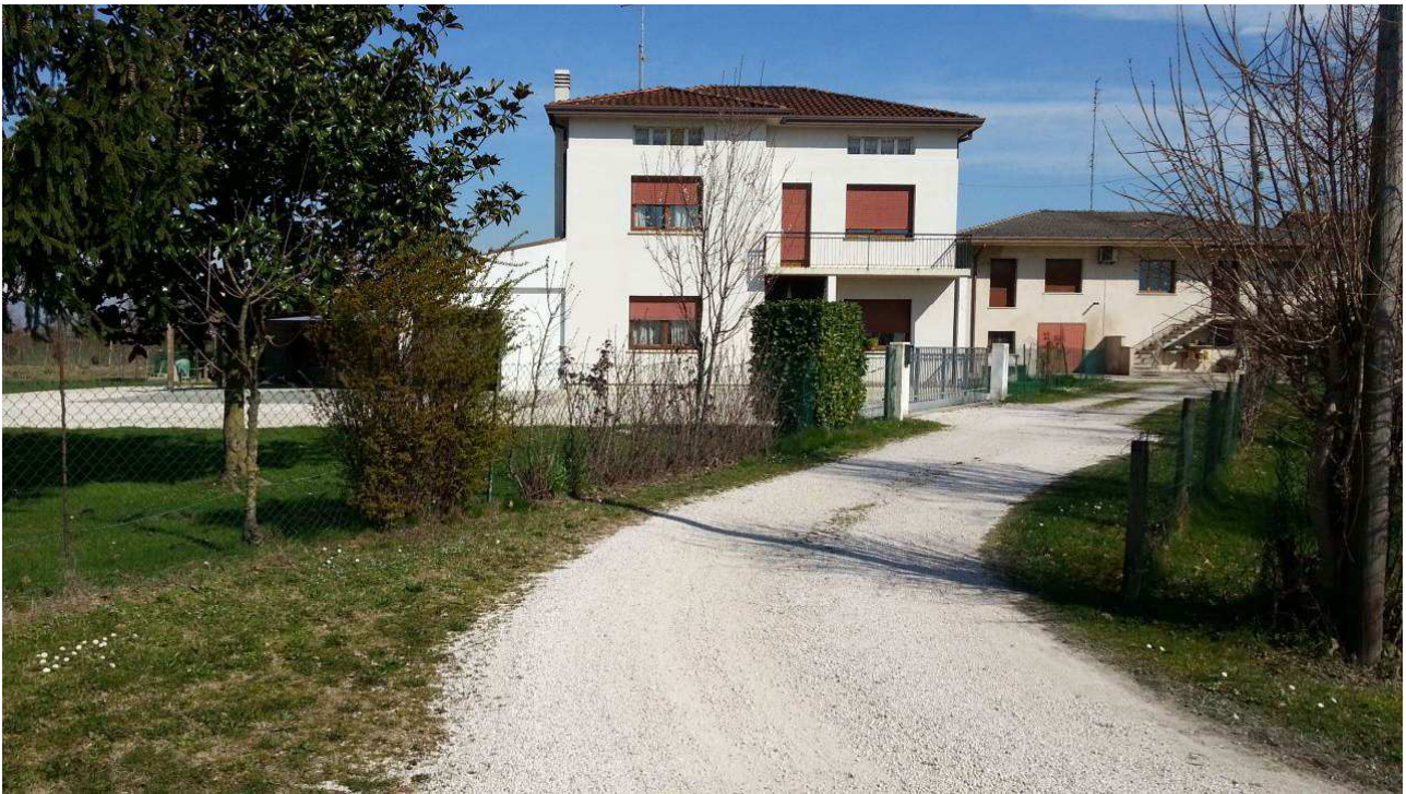
Foto n.1: Vista del compendio immobiliare oggetto di E.I., dalla via pubblica Casali Nogherate, con indicazione dell'accesso ad uso promiscuo a carico del terreno identificato al Mapp.244 ed a favore di altre proprietà.