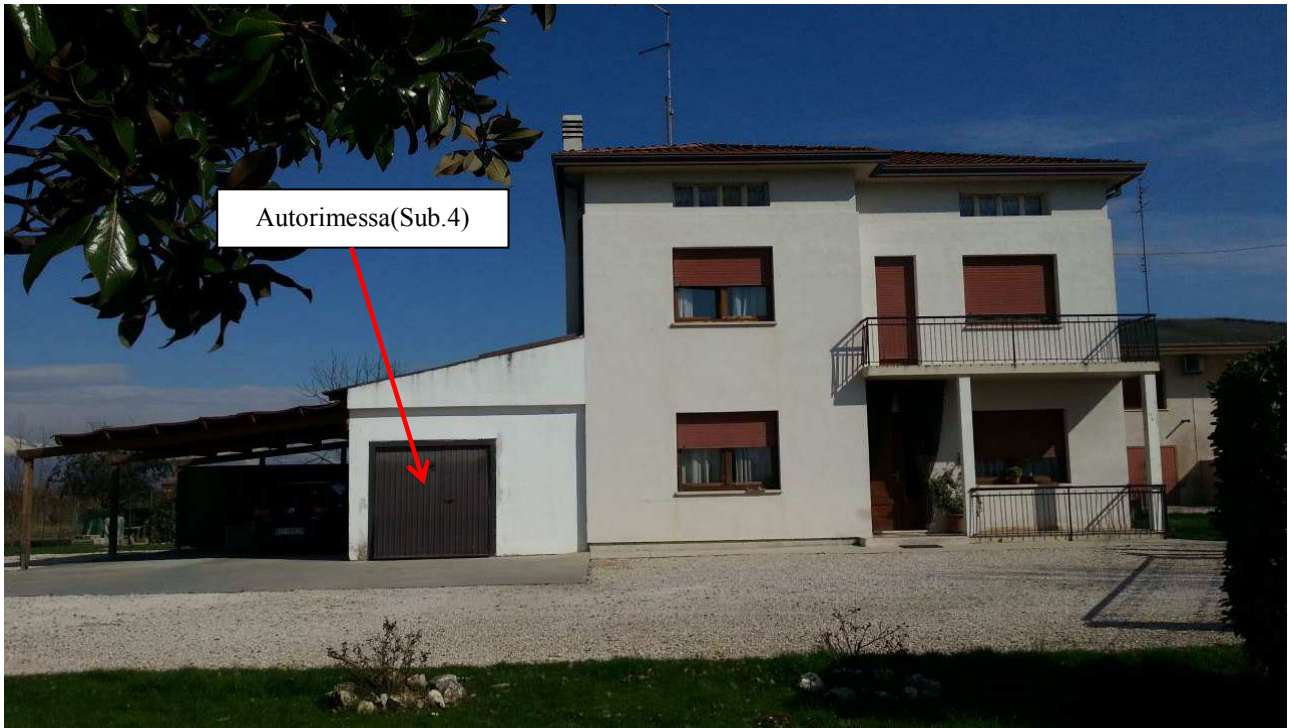
Foto n.3: Prospetto Sud dell'abitazione (Sub.3) e dell'autorimessa (Sub.4) oggetto di E.I.