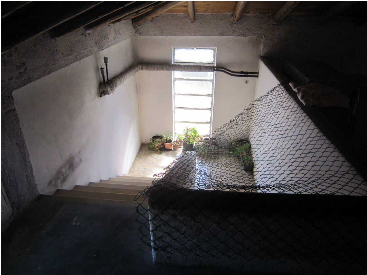
Foto n.15: Scale che portano alla soffitta oggetto di E.I. (Sub.3).