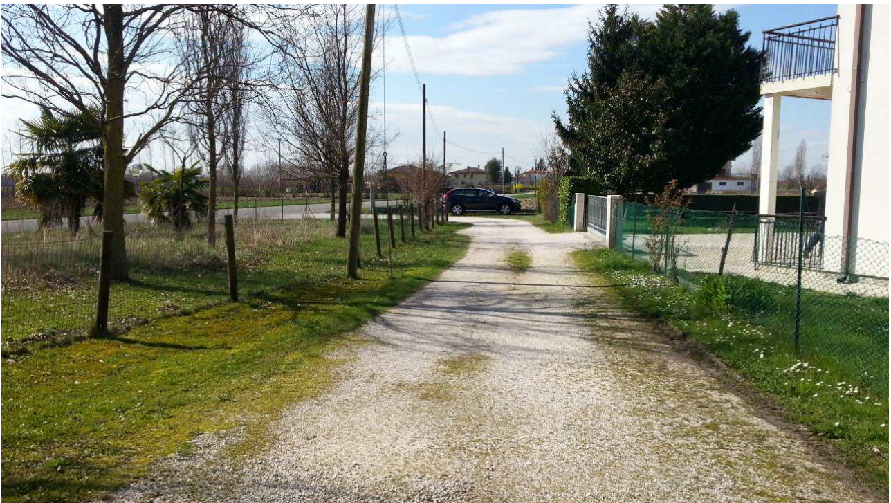
Foto n.2: Vista del viale di accesso agli immobili oggetto di E.I. che costituisce servitù di transito a carico del Mappale 244 ed a favore dei mappali 340-427-428 di altra proprietà.