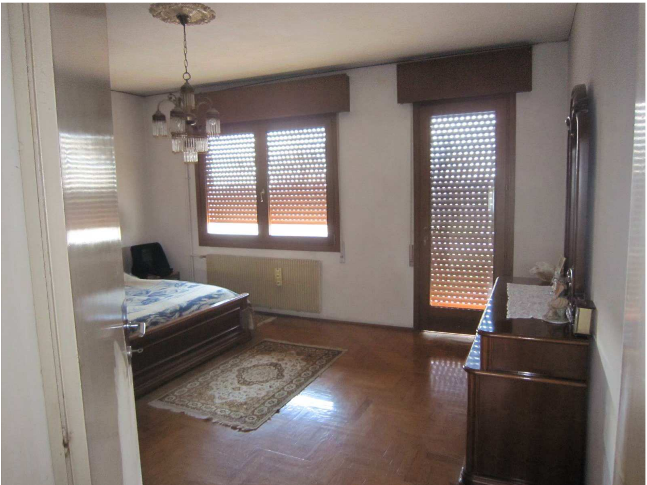
Foto n.12: Camera completa di terrazzo al 1°P. oggetto di E.I. (Sub.3)