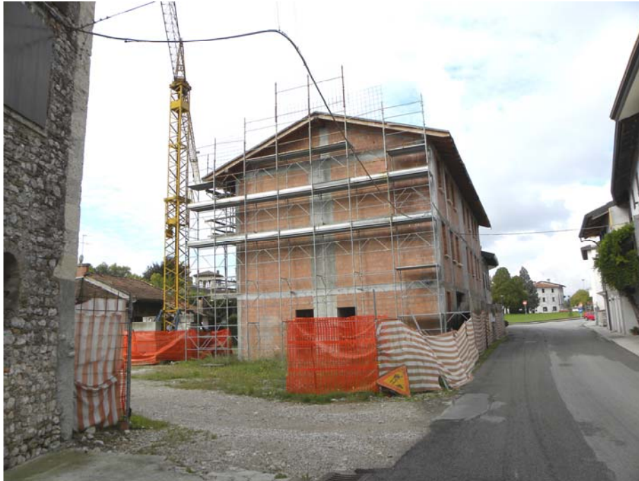
San Giorgio della Richinvelda (PN): attrezzature di cantiere (gru ed impalcature)