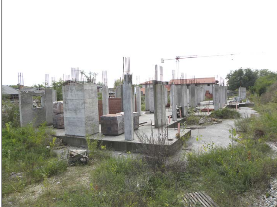
Zugliano di Pozzuolo del Friuli (UD): #05-corpo Ovest di 6 unità (da Nord)