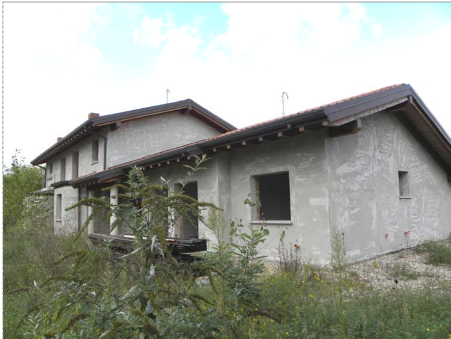
Zugliano di Pozzuolo del Friuli (UD): #02-corpo centrale 3 unità (lati Sud ed Ovest)