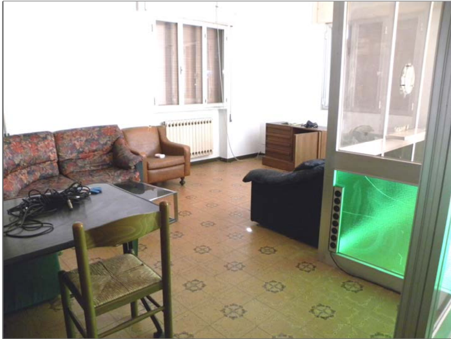
Vangadizza di Legnago (VR): unità sub 1 - primo piano (uffici e abitazione - interno)