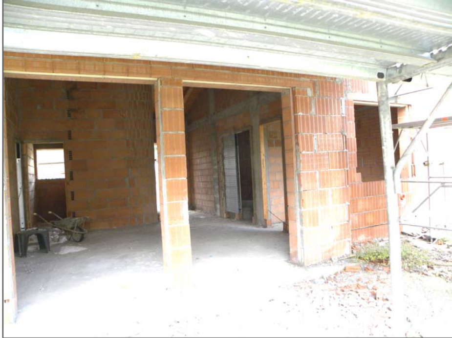
Zugliano di Pozzuolo del Friuli (UD): #03-corpo Est di 4 unità (stato degli interni)