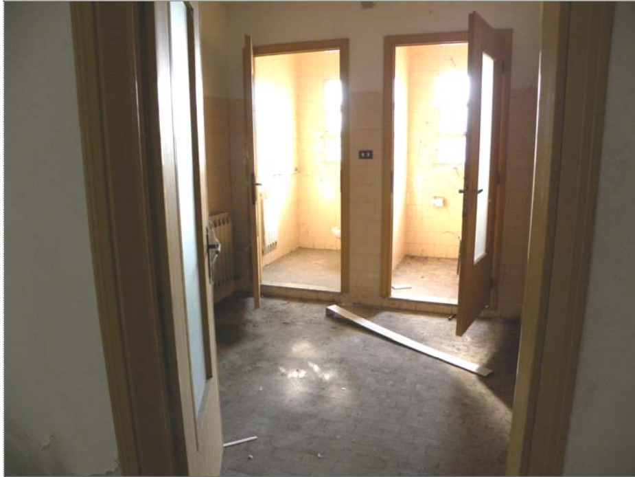
Vangadizza di Legnago (VR): unità sub 1 - piano terra (particolare dell'interno)