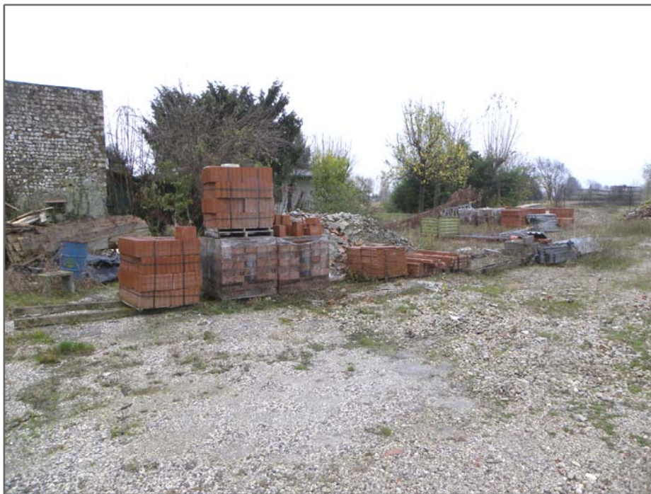
San Giorgio della Richinvelda (PN): materiali da costruzione e vari