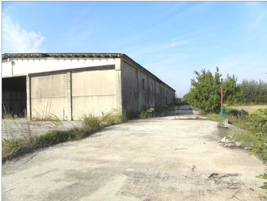
Vangadizza di Legnago (VR): unità sub 4 (lato Est) - unità sub 4 e 3 (lato Nord)