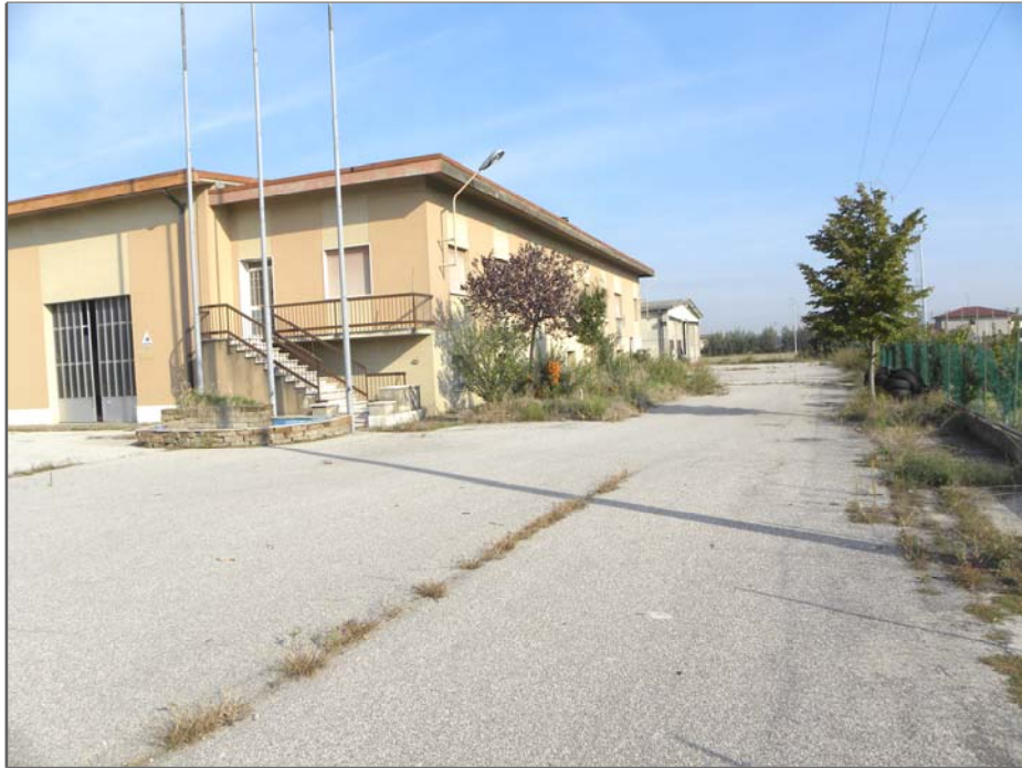
Vangadizza di Legnago (VR): unità sub 1 - uffici (lati Sud ed Est)