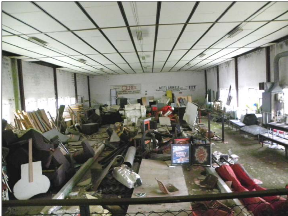
Casa del Diavolo, Perugia (PD): beni vari in ex bocciodromo (arredi e varie non utilizzabili)