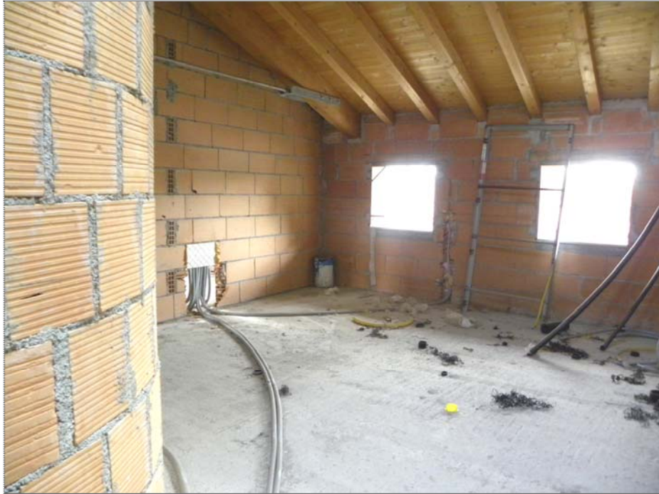
Zugliano di Pozzuolo del Friuli (UD): #01-edificio a corte (situazione degli interni - secondo piano)