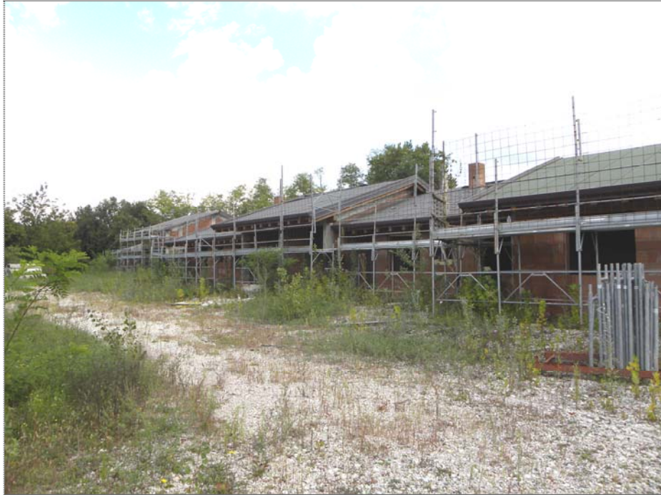
Zugliano di Pozzuolo del Friuli (UD): #03-corpo Est di 4 unità (lato Ovest)