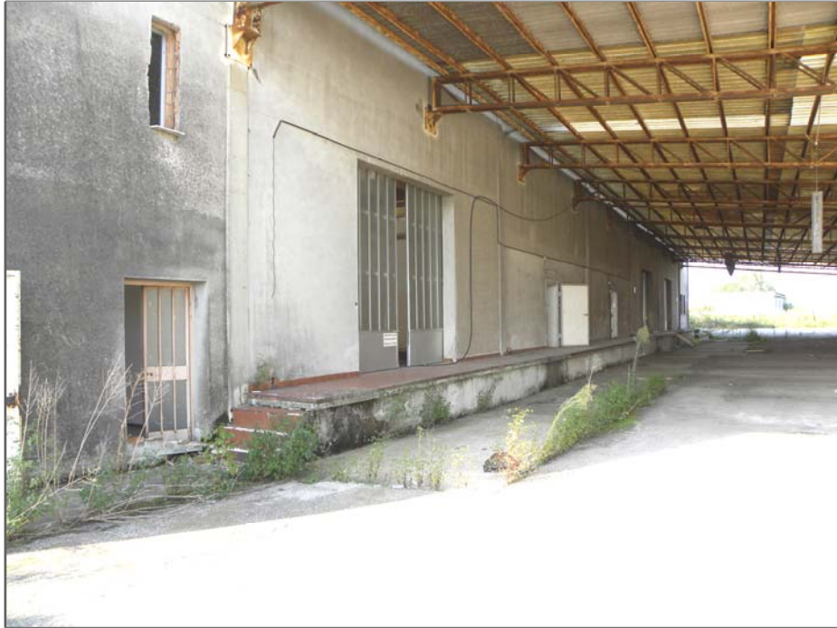
Vangadizza di Legnago (VR): ribalta di carico comune ad unità sub 1 e 2 (lato Nord sotto tettoia)