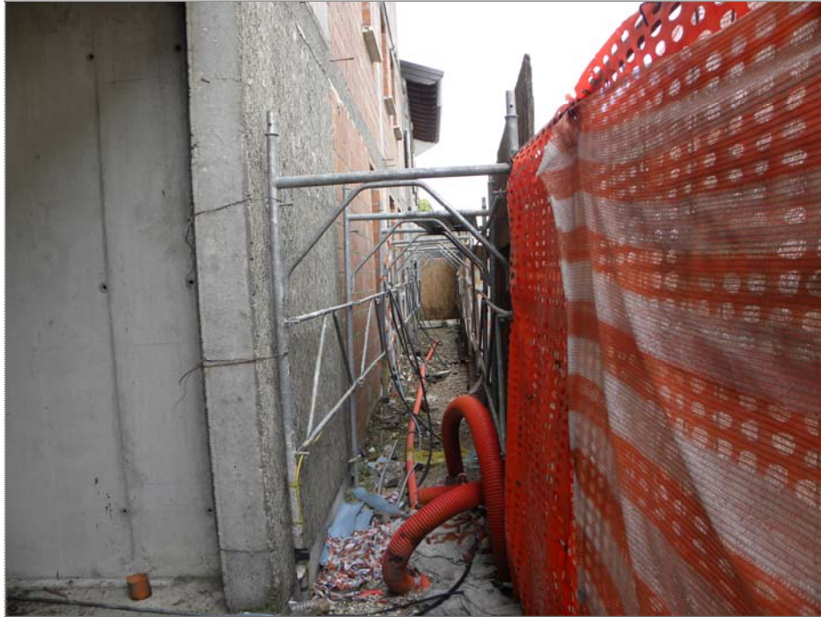
San Giorgio della Richinvelda (PN): parte costruita - stato del fronte su via Luchini