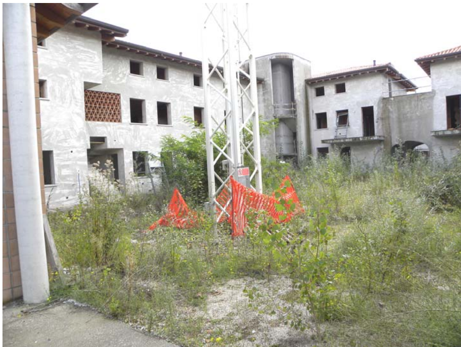
Zugliano di Pozzuolo del Friuli (UD): #01-edificio a corte (la corte)