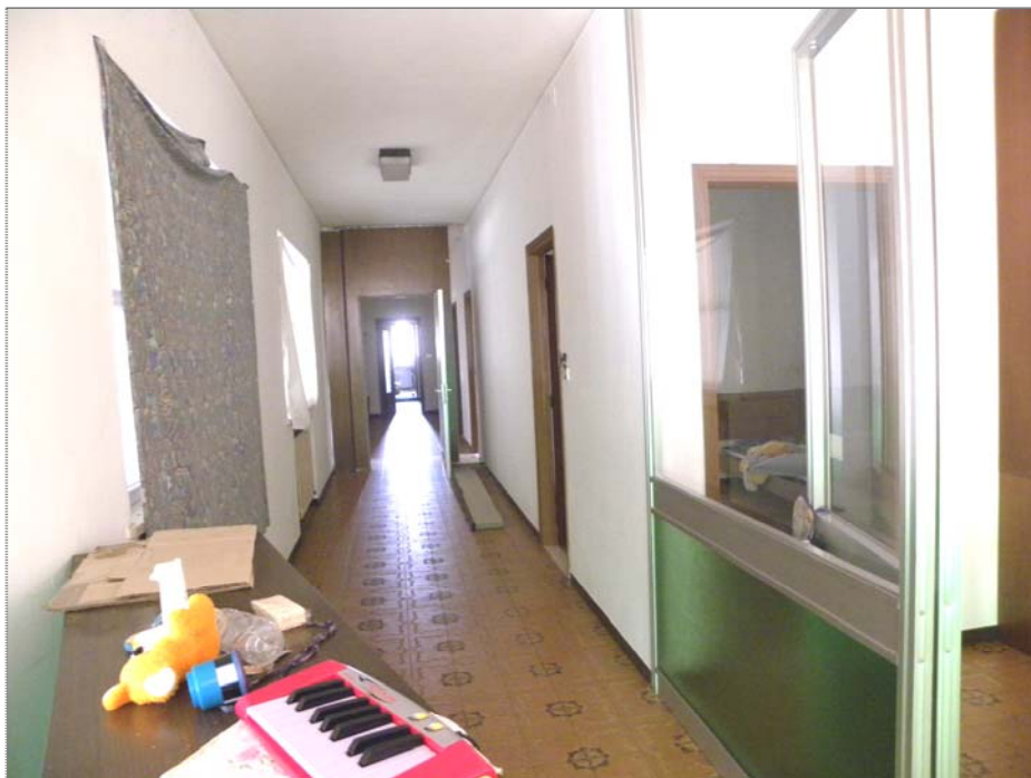
Vangadizza di Legnago (VR): unità sub 1 - primo piano (uffici e abitazione - interno)