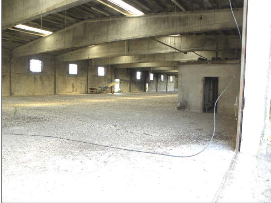
Vangadizza di Legnago (VR): unità sub 3 e 4 - ex lavorazione (non frazionata) [loCALE tecnico di "sub 3" non riportato in planimetria]