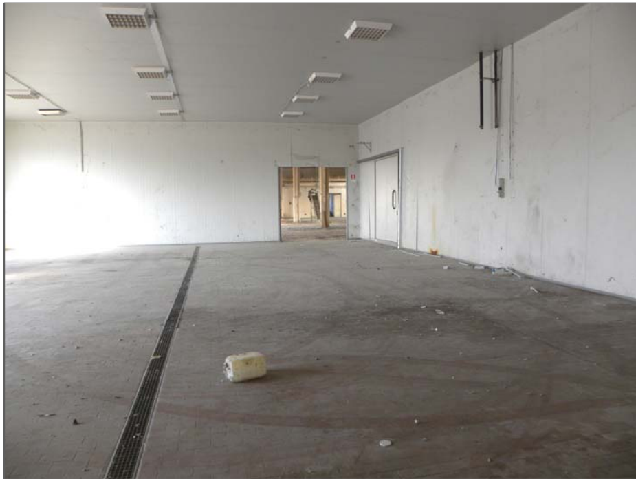
Vangadizza di Legnago (VR): unità sub 1 - ex lavorazione