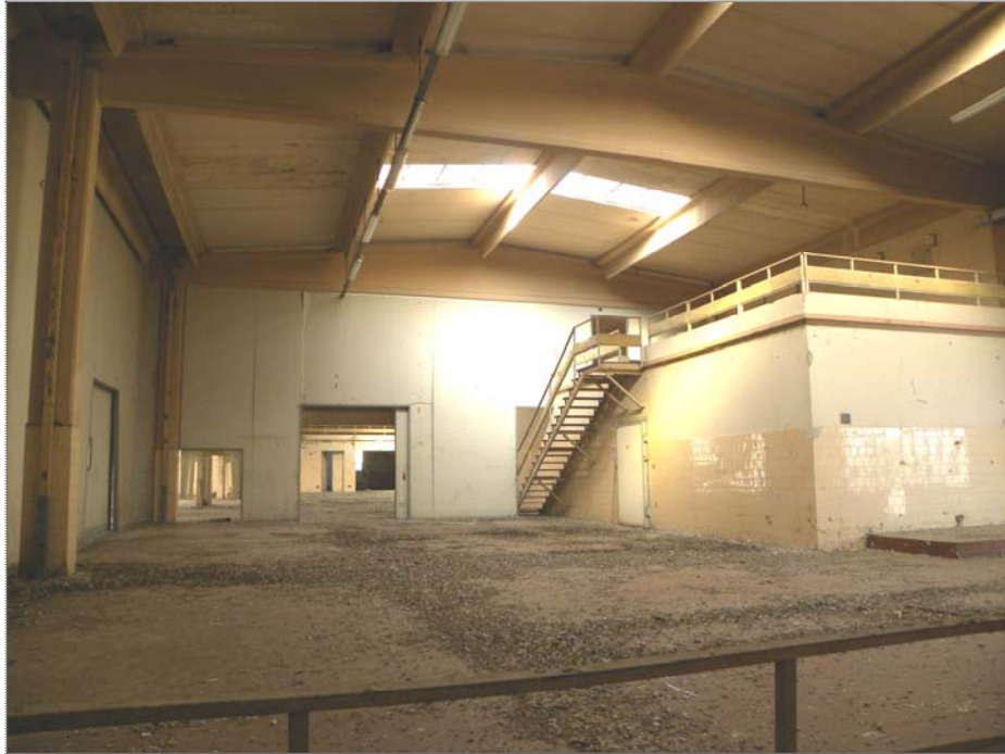
Vangadizza di Legnago (VR): unità sub 1 - ex lavorazione e cella frigorifera