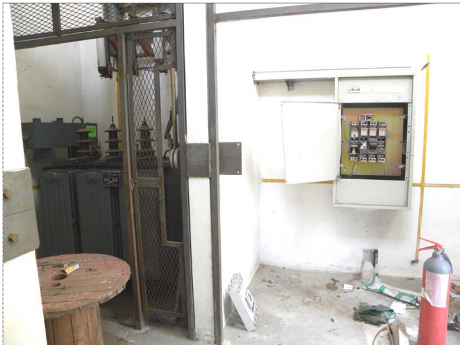
Vangadizza di Legnago (VR): unità sub 1 - piano terra (cabina elettrica)