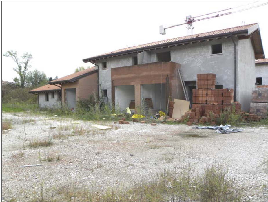
Zugliano di Pozzuolo del Friuli (UD): #02-corpo centrale 3 unità (lato Nord)