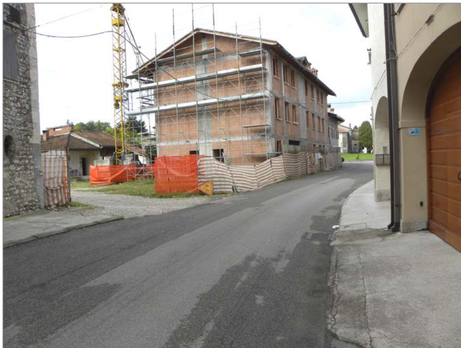
San Giorgio della Richinvelda (PN): parte costruita - fronte su via Luchini e lato Est