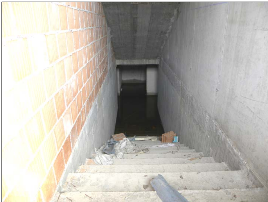
San Giorgio della Richinvelda (PN): parte costruita - ingresso cantine (allegate)