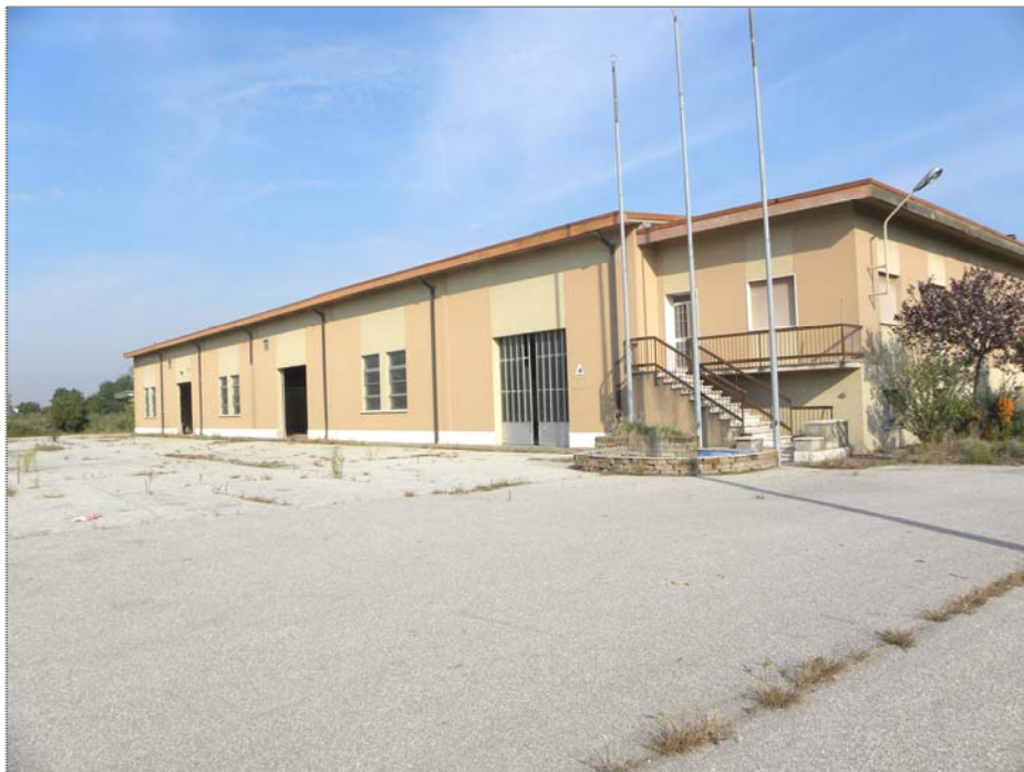
Vangadizza di Legnago (VR): fronte unità sub 1 e 2 (lato Sud)