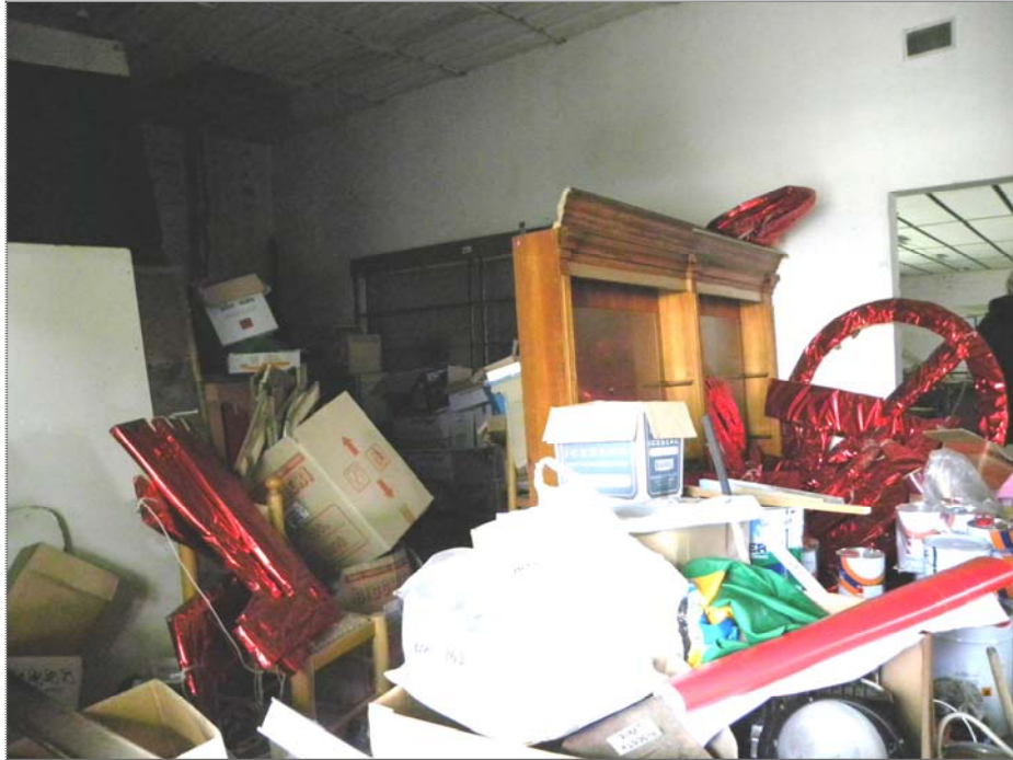
Casa del Diavolo, Perugia (PD): beni vari in ex bocciodromo (arredi e varie non utilizzabili)