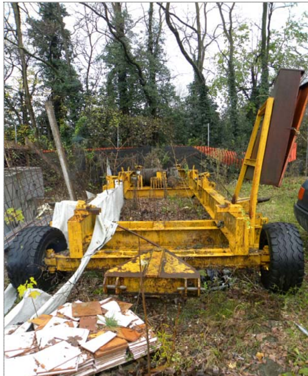
Zugliano di Pozzuolo del Friuli (UD): carro per gru a torre (fuori servizio)