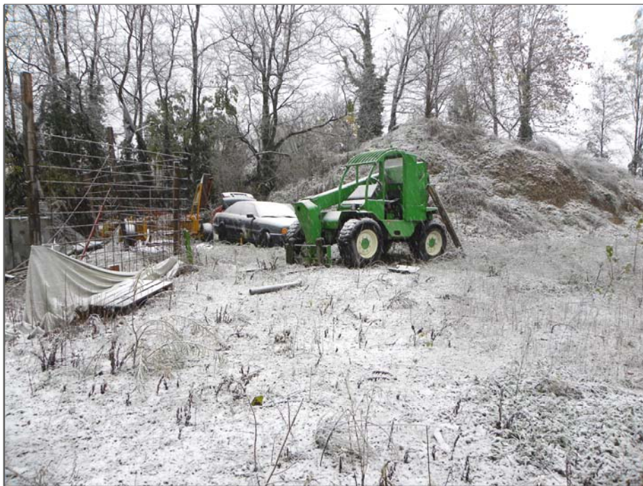
Zugliano di Pozzuolo del Friuli (UD): gru gommata ed autovettura (fuori servizio)