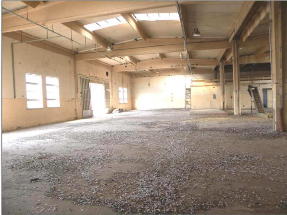
Vangadizza di Legnago (VR): unità sub 2 - ex lavorazione