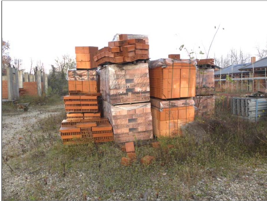
Zugliano di Pozzuolo del Friuli (UD): materiali da costruzione e varie