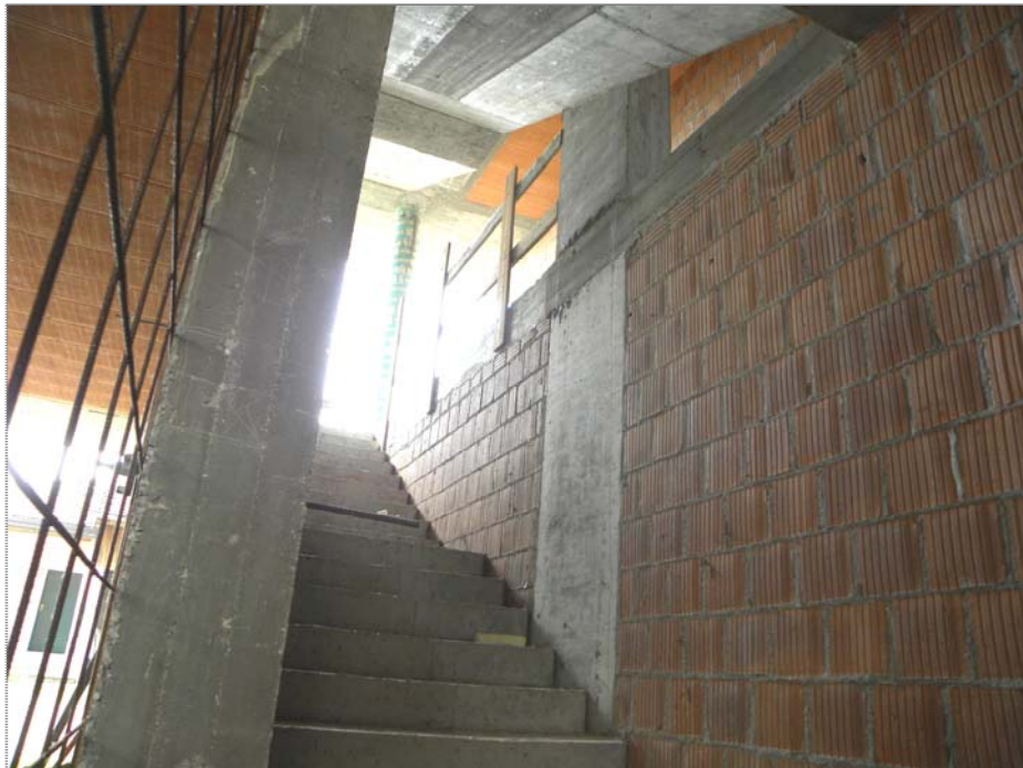
San Giorgio della Richinvelda (PN): parte costruita - stato degli interni