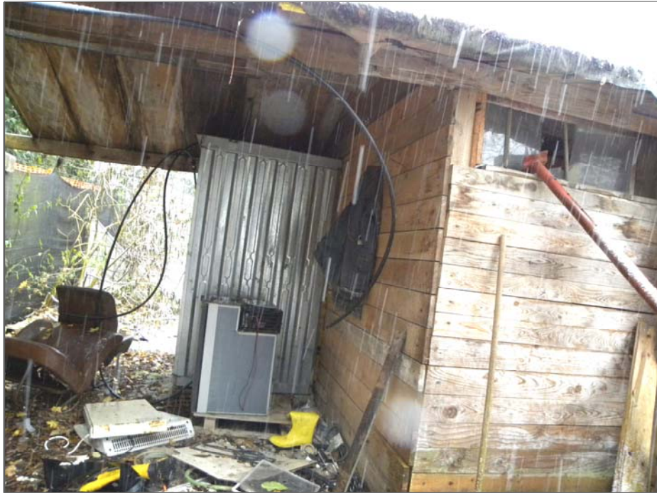
Zugliano di Pozzuolo del Friuli (UD): attrezzature di cantiere (baraccamento e WC)