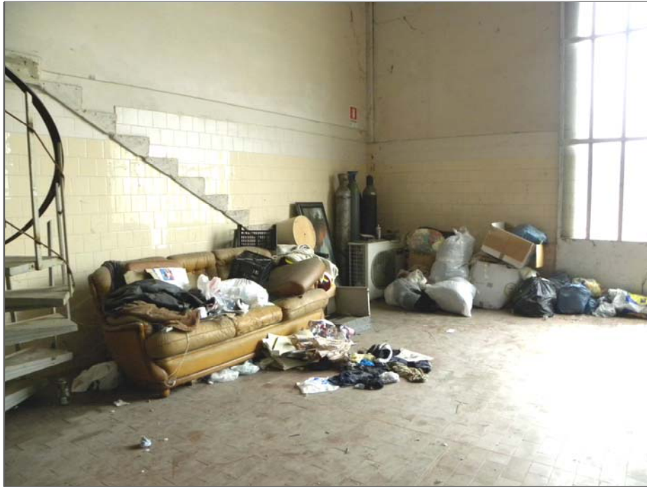
Vangadizza di Legnago (VR): beni vari (arredi ed attrezzature inutilizzabili)