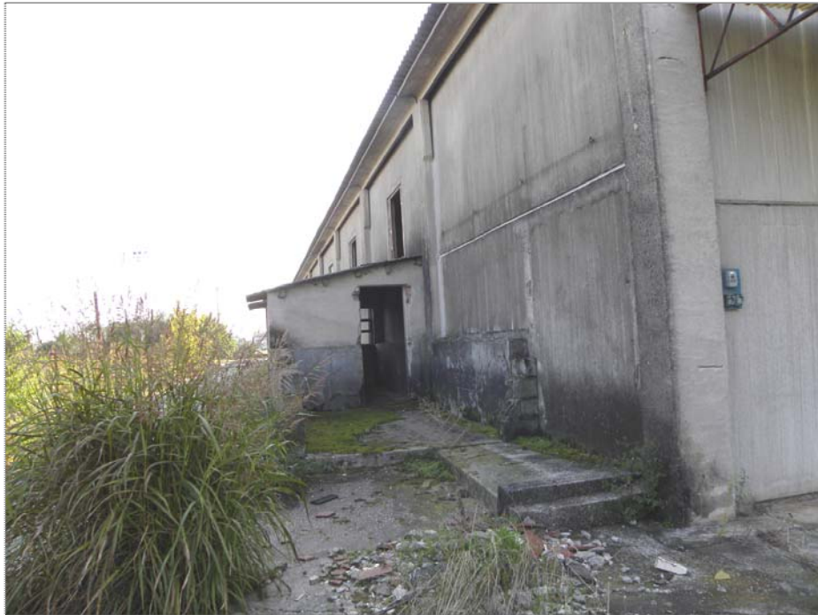
Vangadizza di Legnago (VR): unità sub 3 - vano accessorio