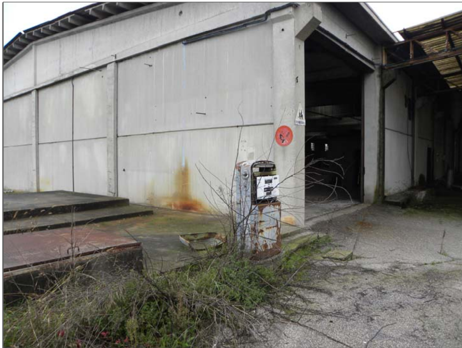
Vangadizza di Legnago (VR): beni vari (distributore carburante - non funzionante)