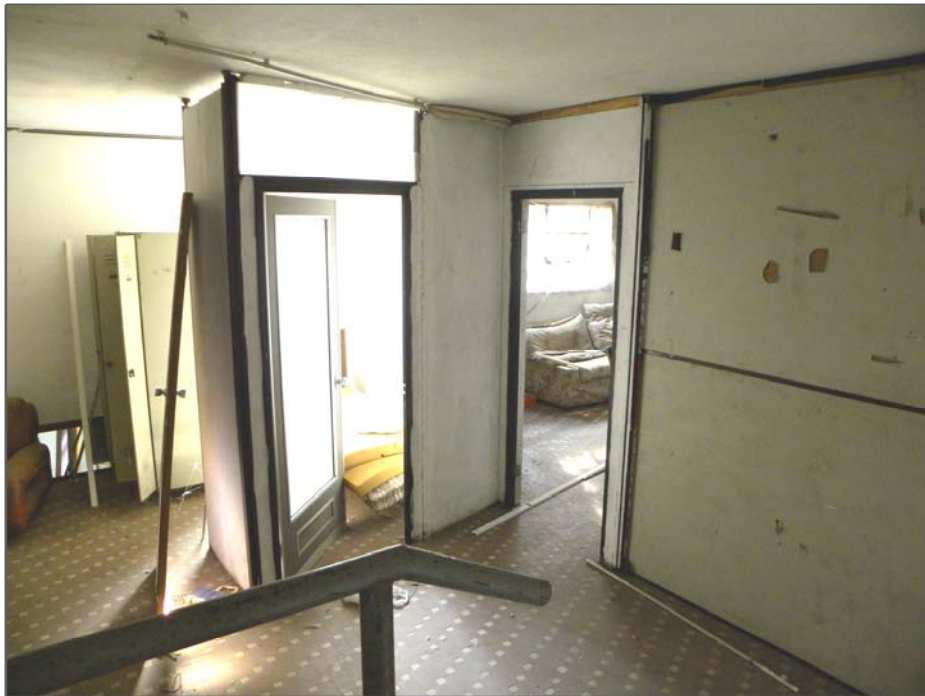
Vangadizza di Legnago (VR): unità sub 1 - piano terra (particolare dell'interno)