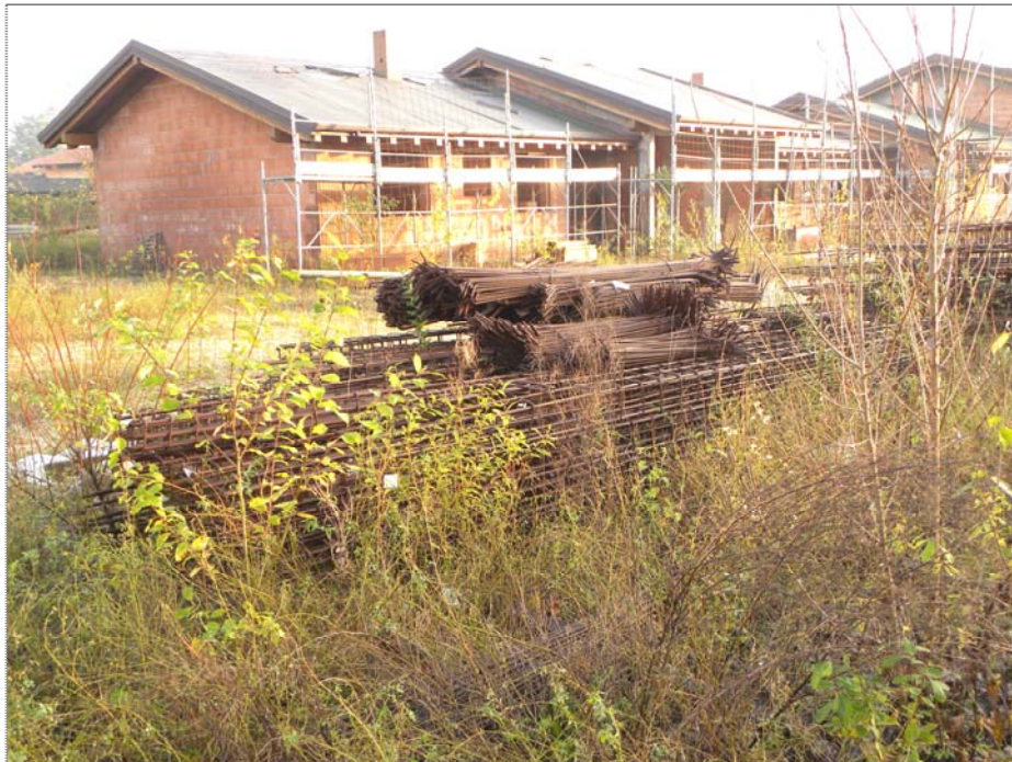
Zugliano di Pozzuolo del Friuli (UD): materiali da costruzione e varie (ferri di armatura)