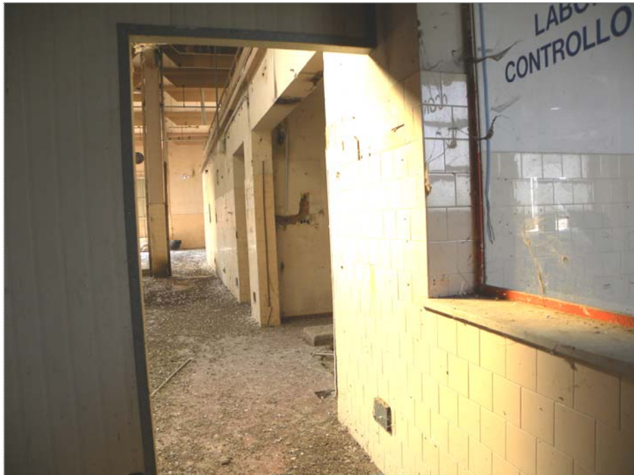
Vangadizza di Legnago (VR): unità sub 2 - ex lavorazione (vani di servizio-laboratorio)