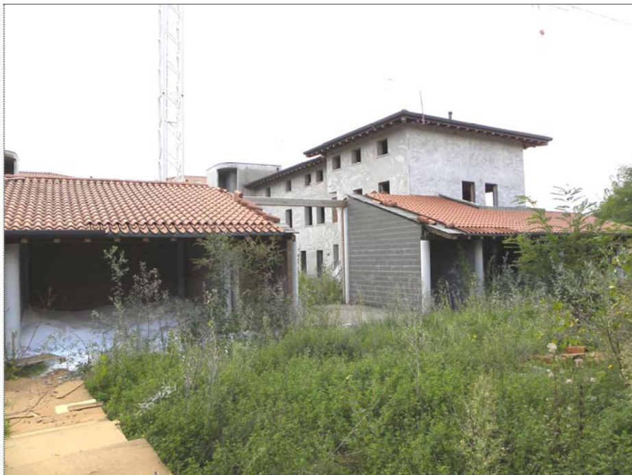
Zugliano di Pozzuolo del Friuli (UD): #01-edificio a corte (corpo autorimesse lato Nord)