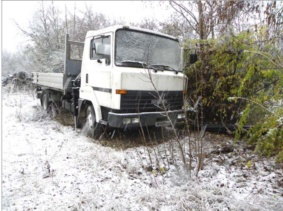
Zugliano di Pozzuolo del Friuli (UD): autocarro (fuori servizio)