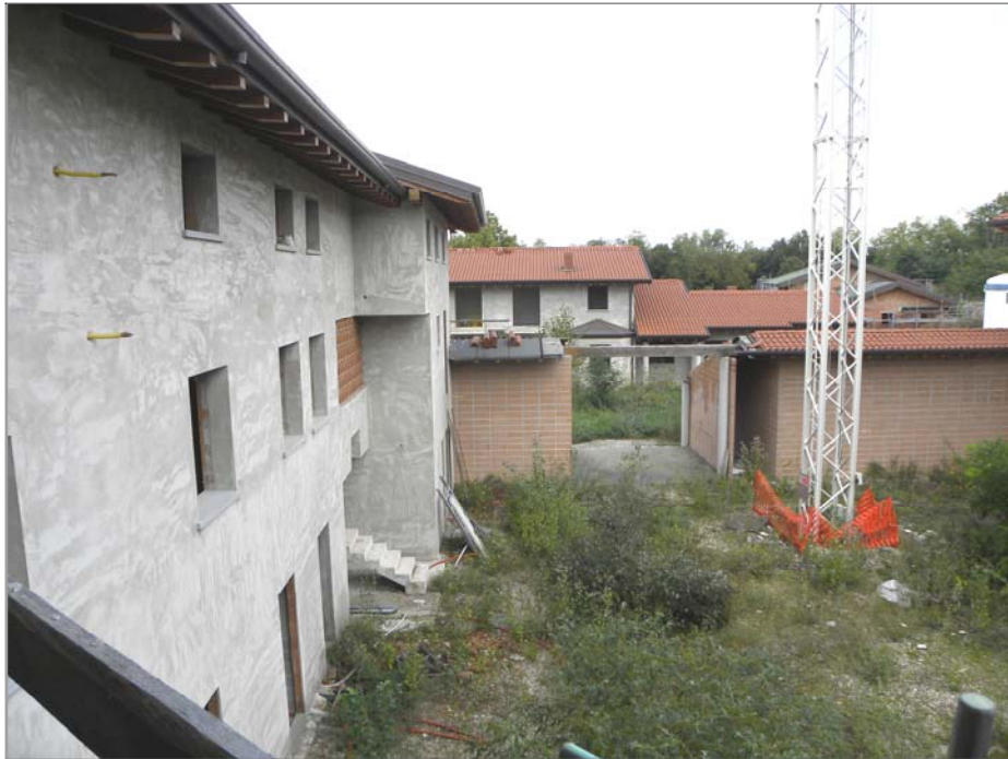
Zugliano di Pozzuolo del Friuli (UD): #01-edificio a corte (la corte e corpo autorimesse)