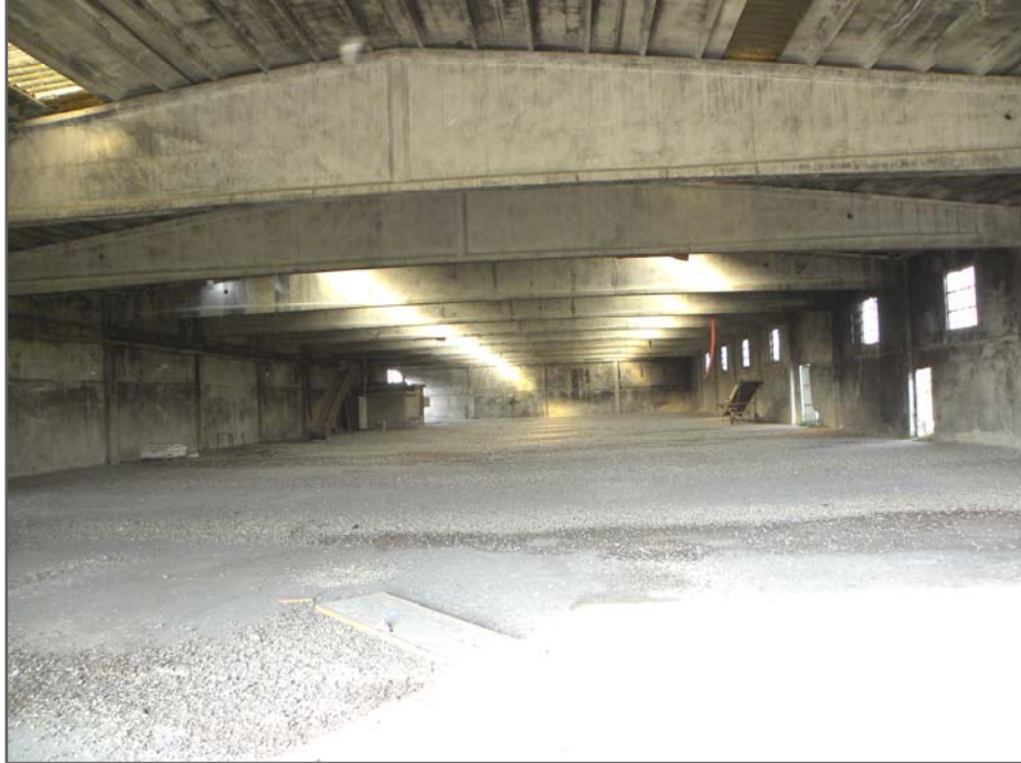
Vangadizza di Legnago (VR): unità sub 4 e 3 - ex lavorazione (non frazionata)