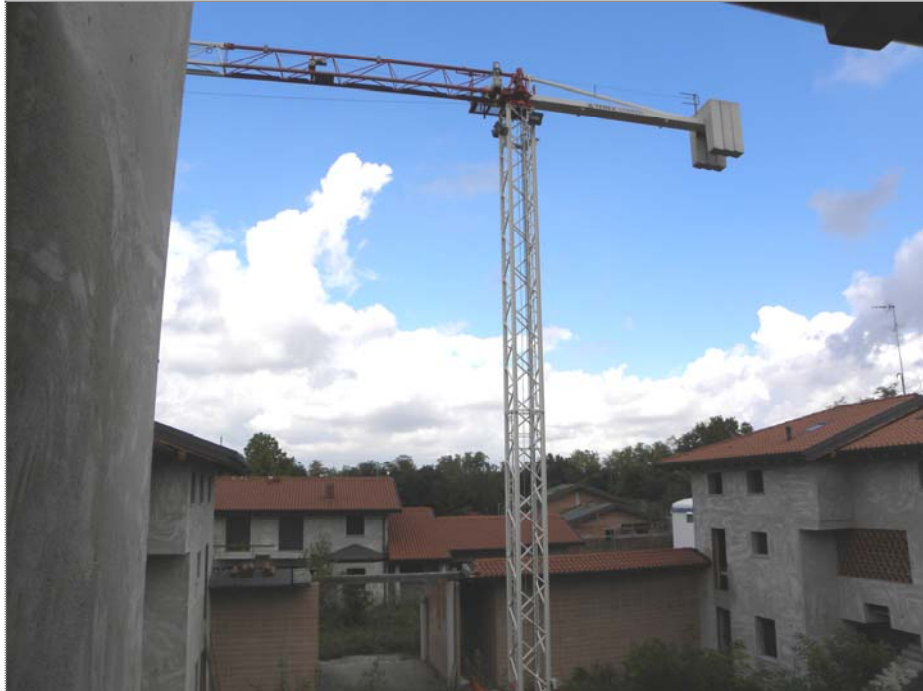
Zugliano di Pozzuolo del Friuli (UD): attrezzature di cantiere (gru a torre)