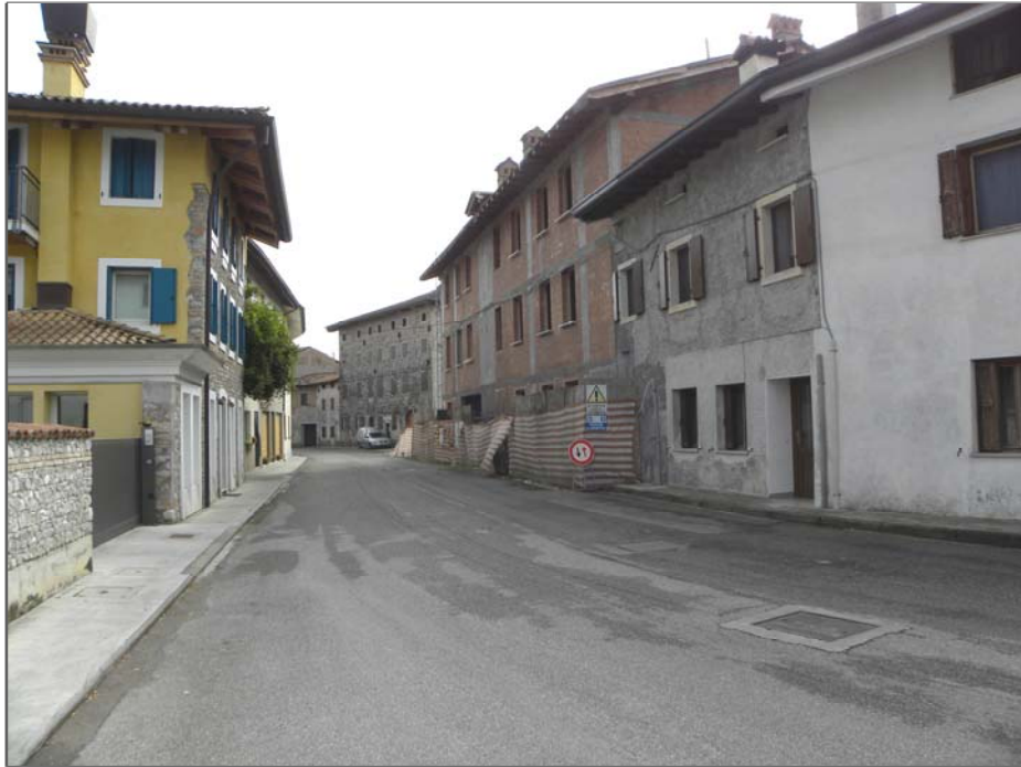
San Giorgio della Richinvelda (PN): fronte su via Luchini (da Ovest)