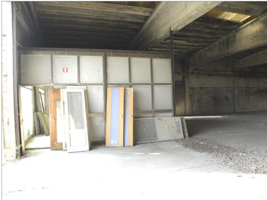
Vangadizza di Legnago (VR): unità sub 4 - ex lavorazione (locale già spaccio aziendale)