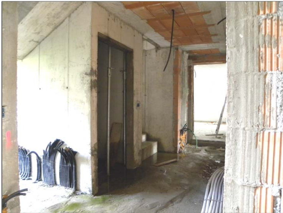
Zugliano di Pozzuolo del Friuli (UD): #01-edificio a corte (situazione degli interni)