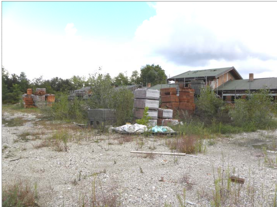
Zugliano di Pozzuolo del Friuli (UD): area scoperta di cantiere