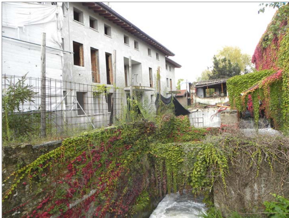
Zugliano di Pozzuolo del Friuli (UD): #01-edificio a corte (lato Est su derivazione torrente Cormor)