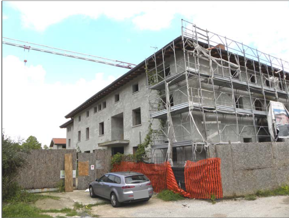
Zugliano di Pozzuolo del Friuli (UD): #01-edificio a corte (lato Ovest)