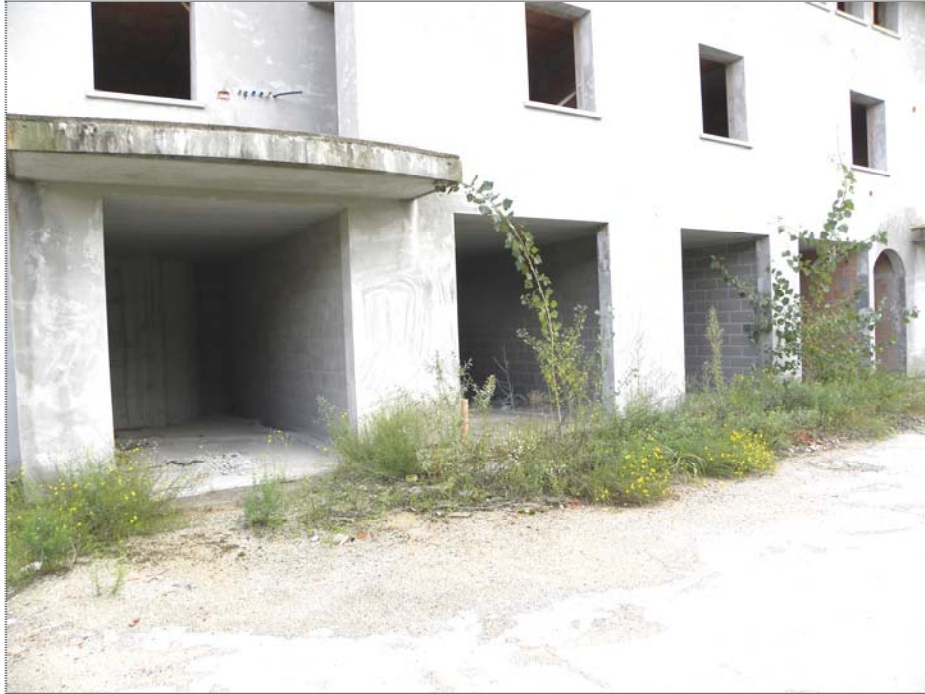
Zugliano di Pozzuolo del Friuli (UD): #01-edificio a corte (autorimesse lato Est)