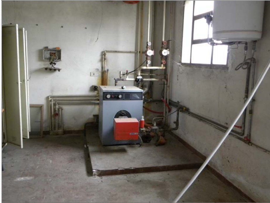
Vangadizza di Legnago (VR): beni vari (centrale termica uffici - non funzionante)