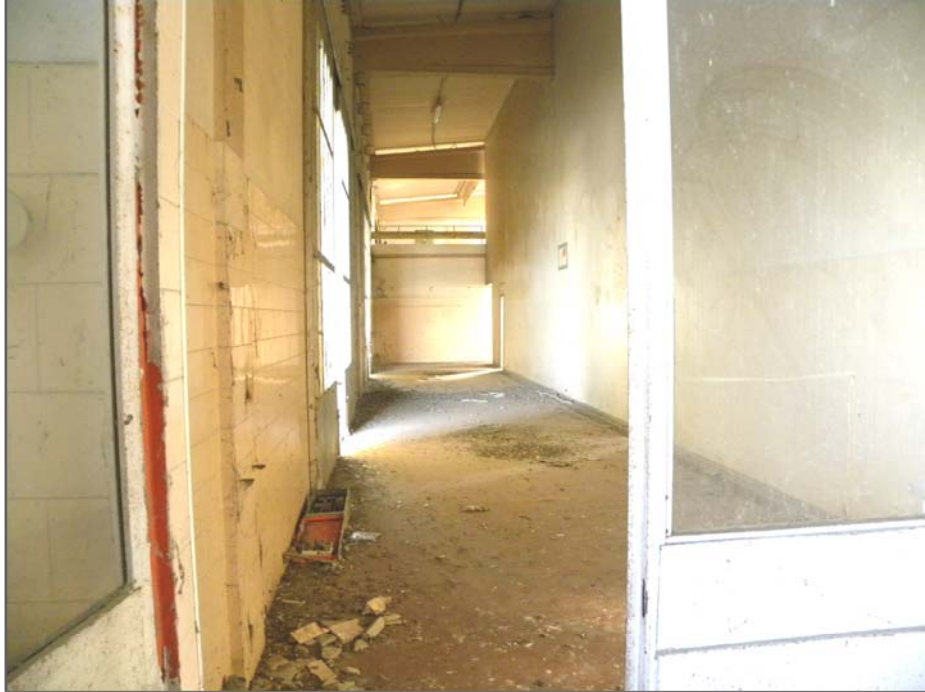
Vangadizza di Legnago (VR): unità sub 2 - ex lavorazione (passaggio lato Nord)