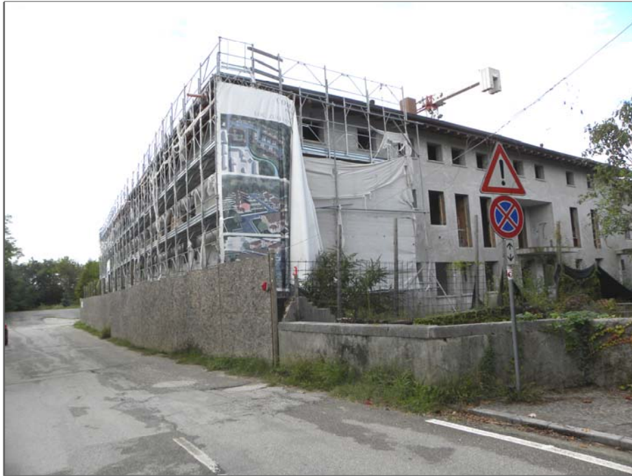
Zugliano di Pozzuolo del Friuli (UD): #01-edificio a corte (fronte su via Failutti - da Est)