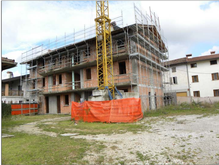
San Giorgio della Richinvelda (PN): parte costruita - retro (da Sud-Est)