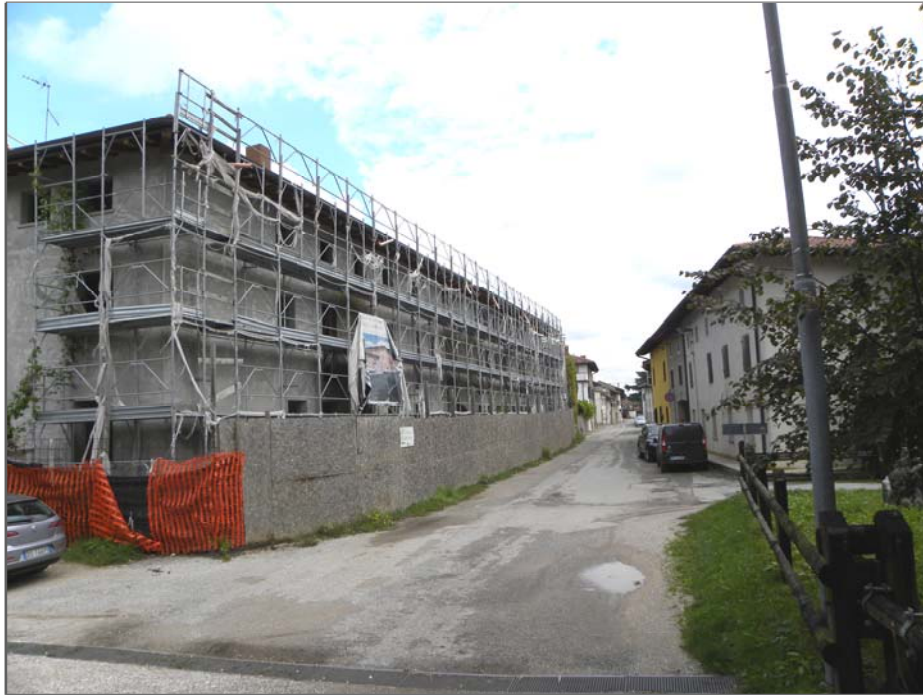
Zugliano di Pozzuolo del Friuli (UD): attrezzature di cantiere (impalcature)