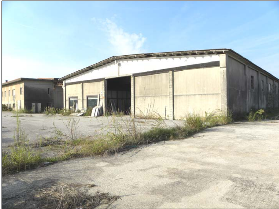
Vangadizza di Legnago (VR): unità sub 4 (lato Est)