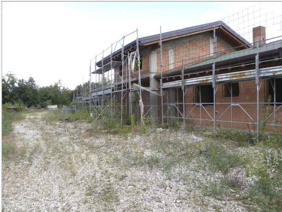
Zugliano di Pozzuolo del Friuli (UD): attrezzature di cantiere (impalcature)