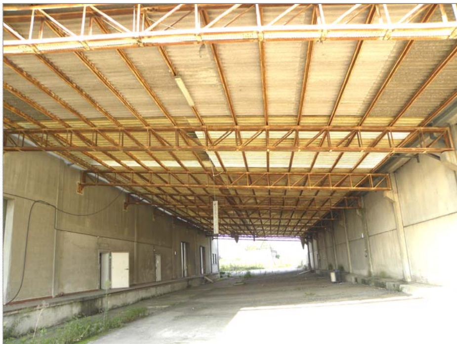
Vangadizza di Legnago (VR): tettoia delle unità sub 4 e 3 (tra corpi Sud e Nord)