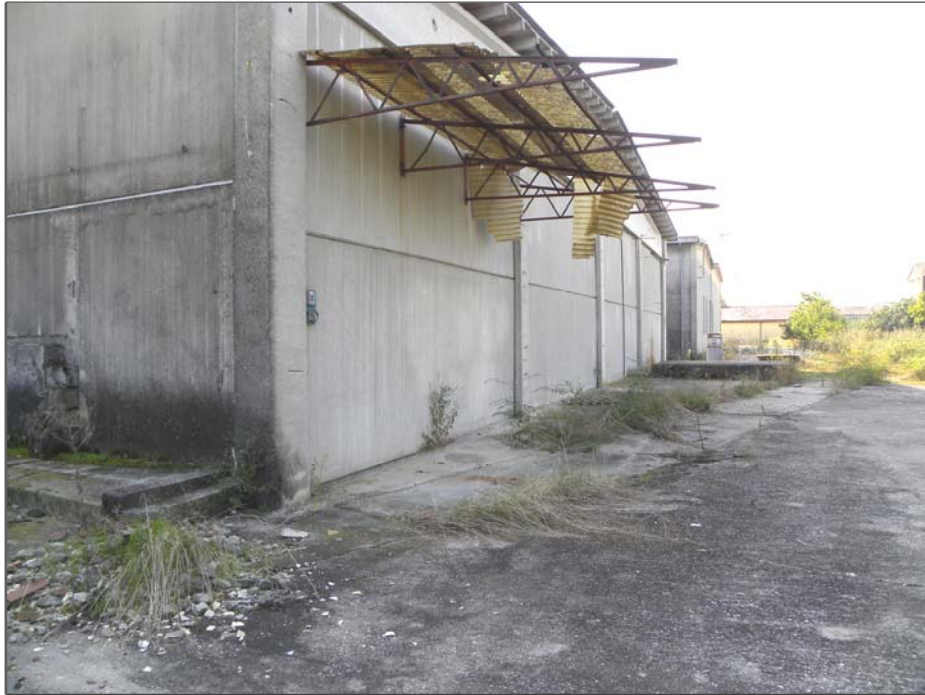
Vangadizza di Legnago (VR): unità sub 3 e 2 (lato Ovest)