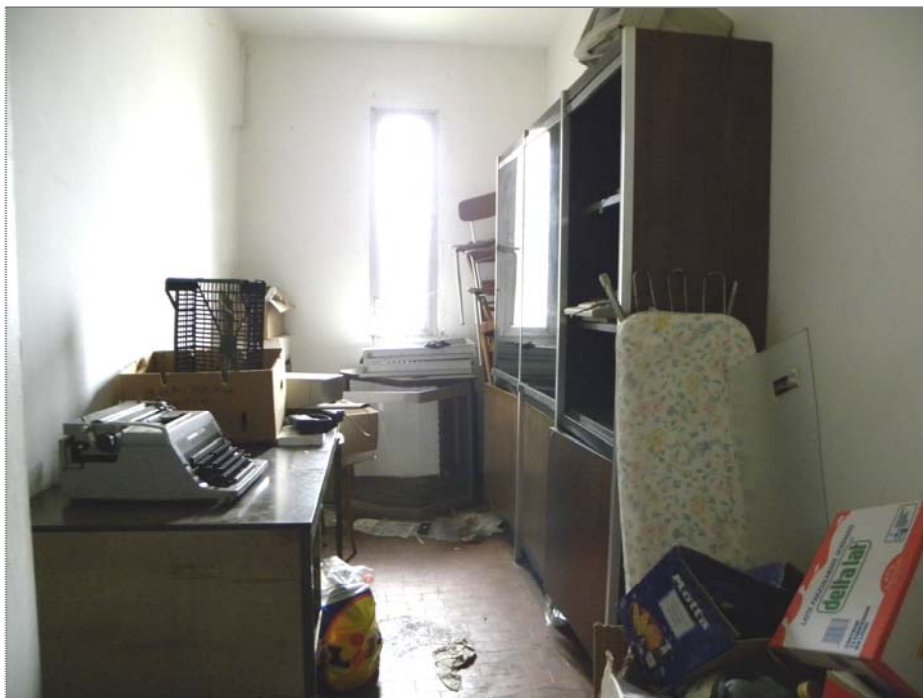
Vangadizza di Legnago (VR): beni vari (mobili e macchine per ufficio inutilizzabili)