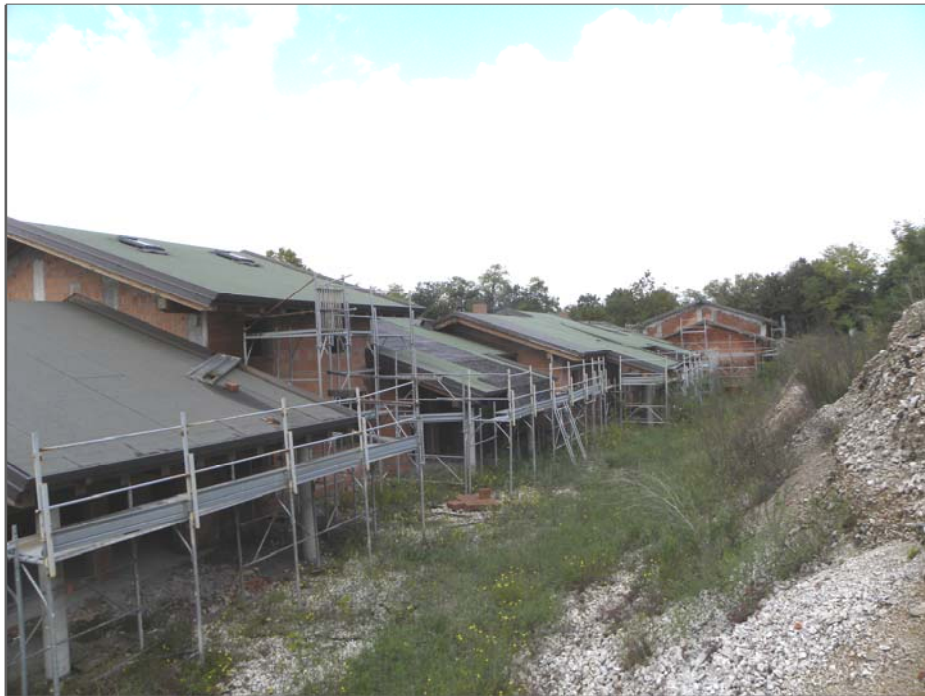
Zugliano di Pozzuolo del Friuli (UD): #03-corpo Est di 4 unità (lato Est)