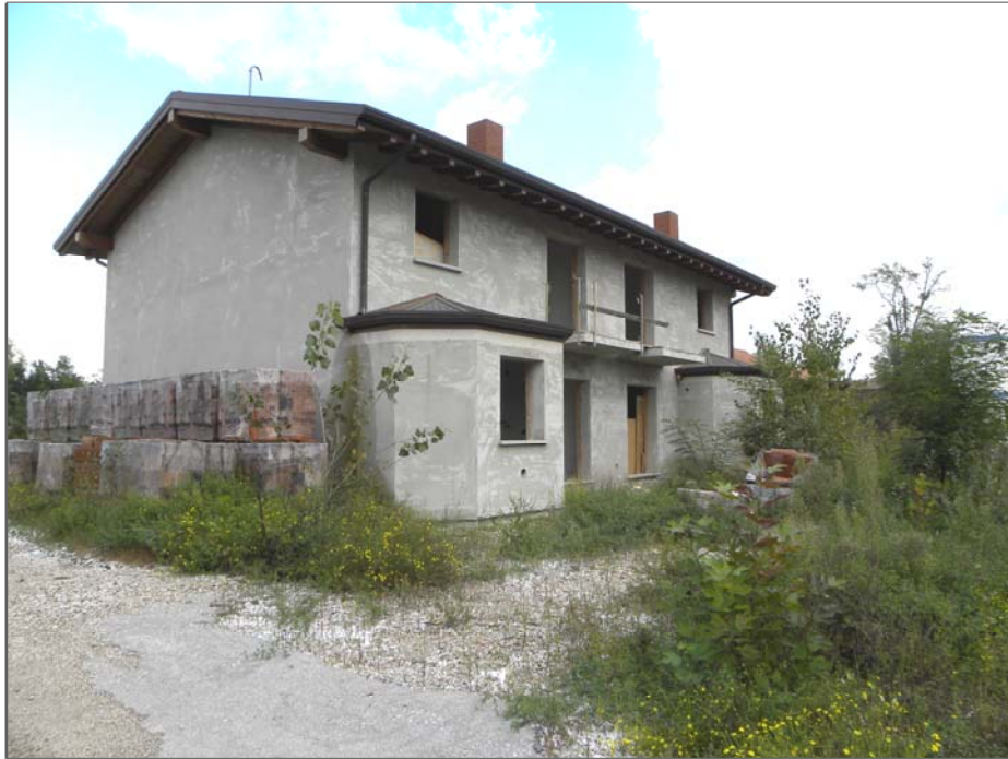
Zugliano di Pozzuolo del Friuli (UD): #02-corpo centrale 3 unità (lati Sud ed Est)