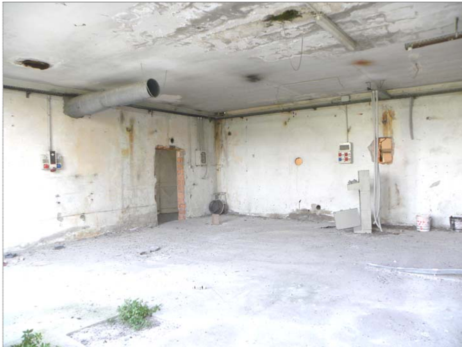
Vangadizza di Legnago (VR): unità sub 2 - ex lavorazione (locale compartimentato)