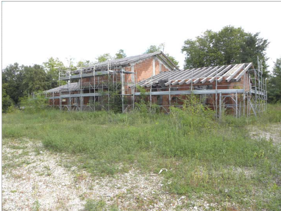
Zugliano di Pozzuolo del Friuli (UD): #04-corpo Est di 2 unità (lato Ovest)