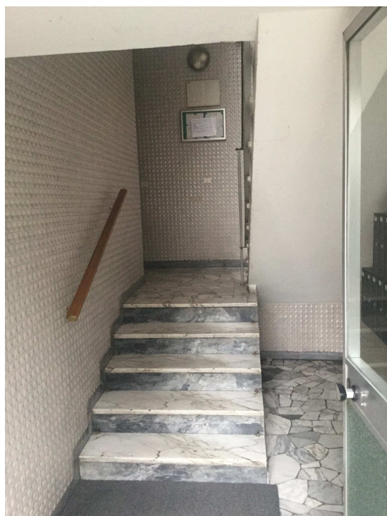
Fig.11: ingresso scala B.