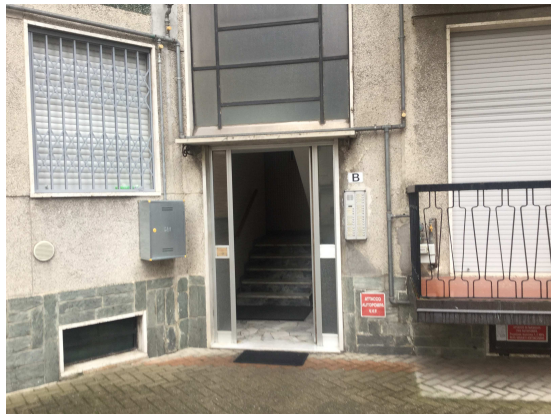
Fig.10: ingresso scala B.