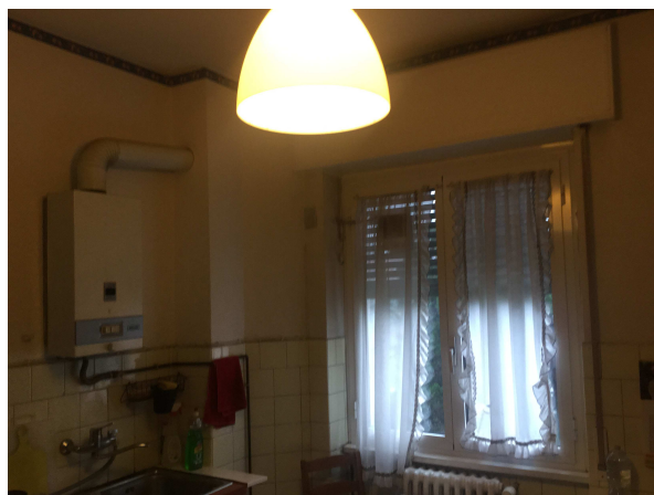
Fig.15-16: viste cucina