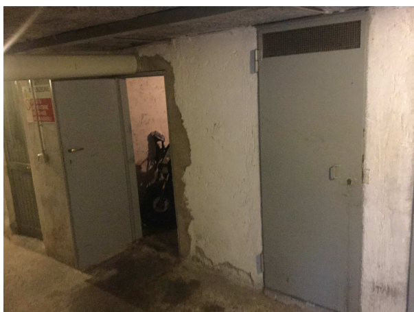
Fig.7: cantine adiacenti oggetto di probabile scambio.