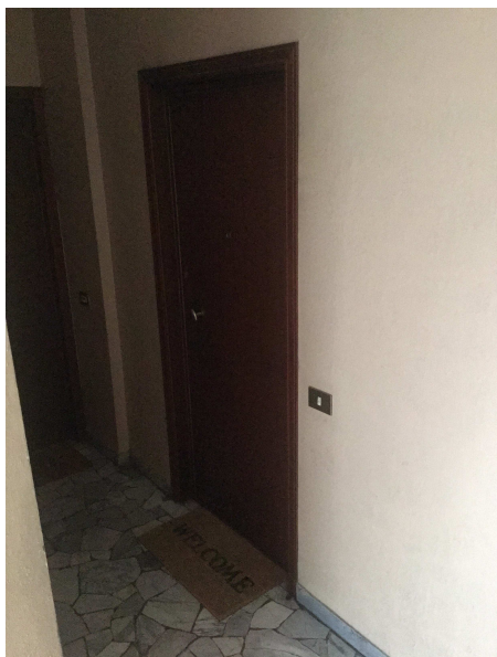
Fig.13: ingresso unità da scale.

Iscritto all'Albo dei Consulenti Tecnici del Tribunale di Milano al n°12247