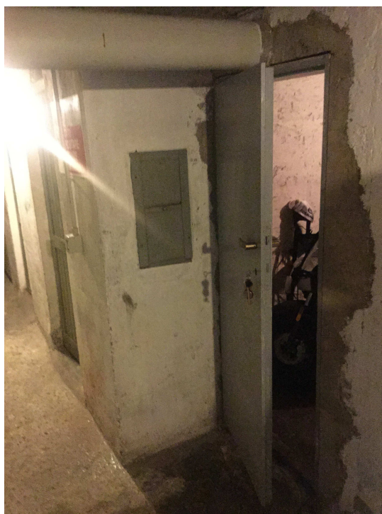
Fig.8: cantina esaminata.