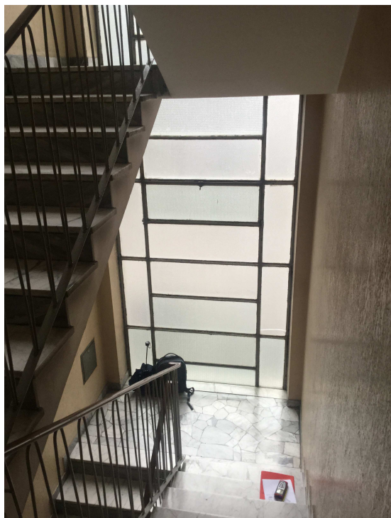
Fig.12: corpo scale.