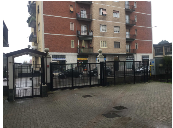
Fig.1-2: vista ingresso condominio dalla strada e dal cortile interno.