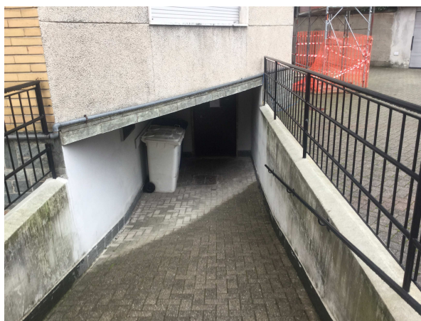
Fig.6: ingresso cantine da cortile.