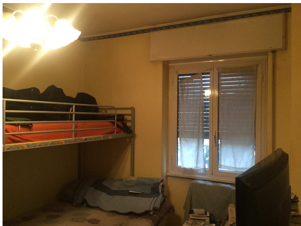
Fig.17: vista camera.

Iscritto all'Albo dei Consulenti Tecnici del Tribunale di Milano al n°12247