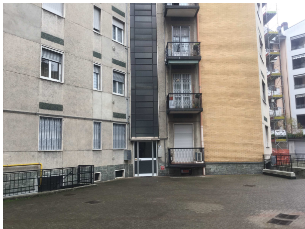
Fig.5: vista cortile.

Iscritto all'Albo dei Consulenti Tecnici del Tribunale di Milano al n°12247