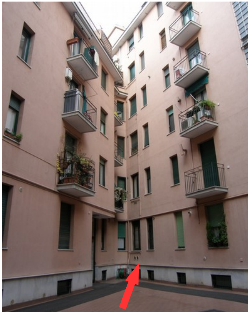
Vista edificio dal cortile interno