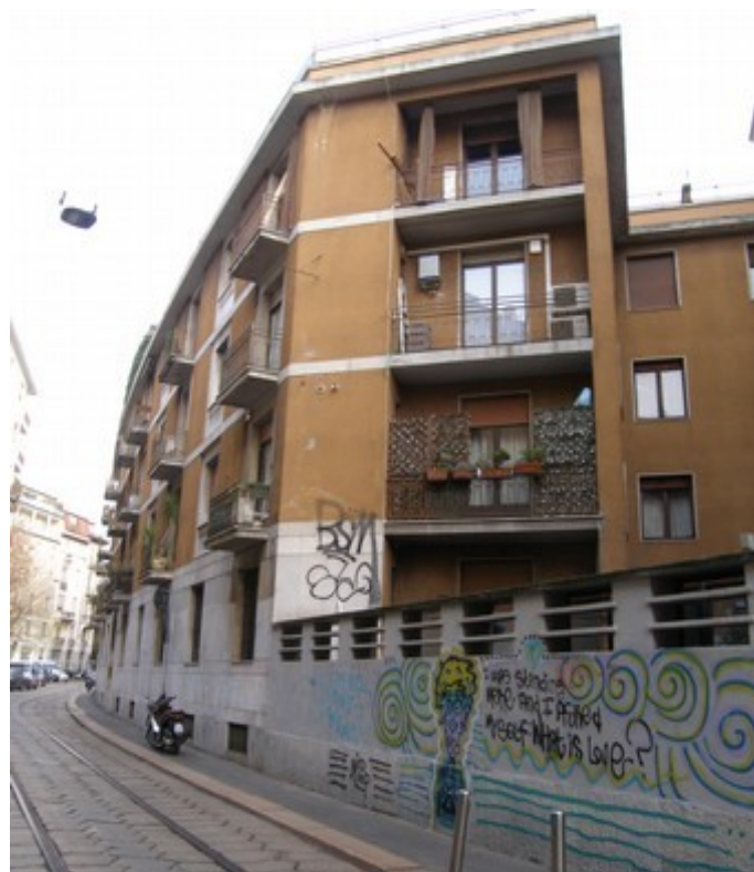
Vista edificio su via Lesmi