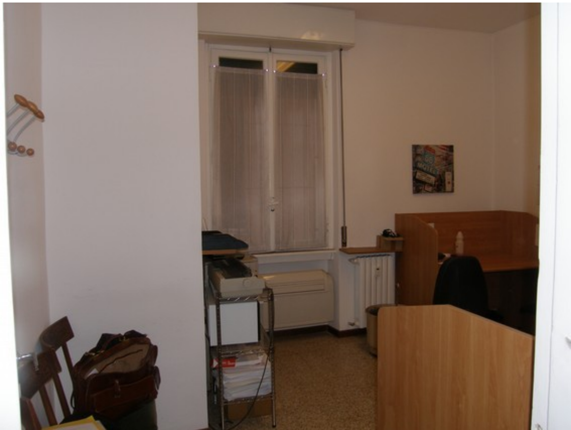
Studio 1 (verso cortile interno)