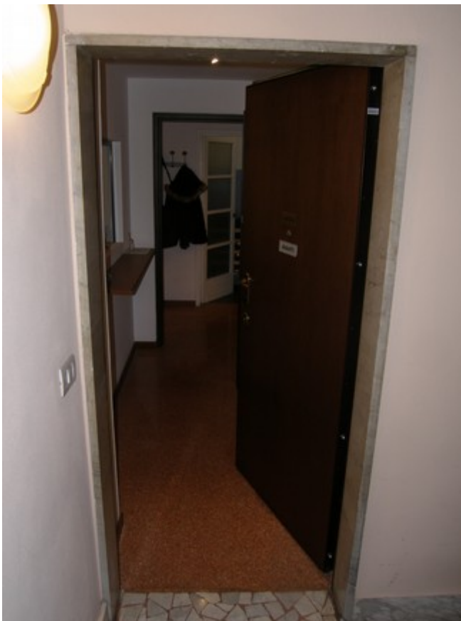
Vista ingress da pianerottolo