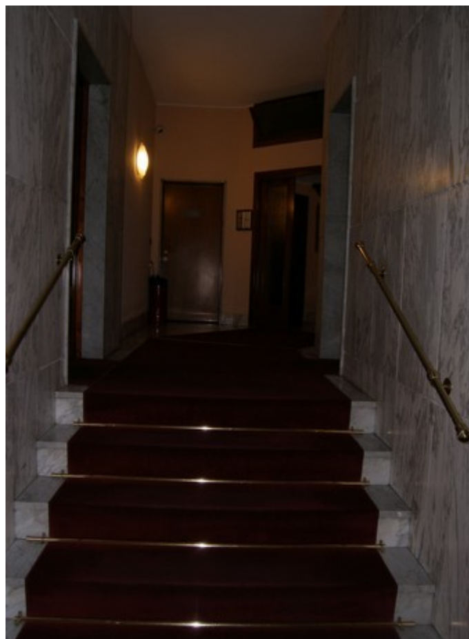
Androne di ingresso su via Lesmi