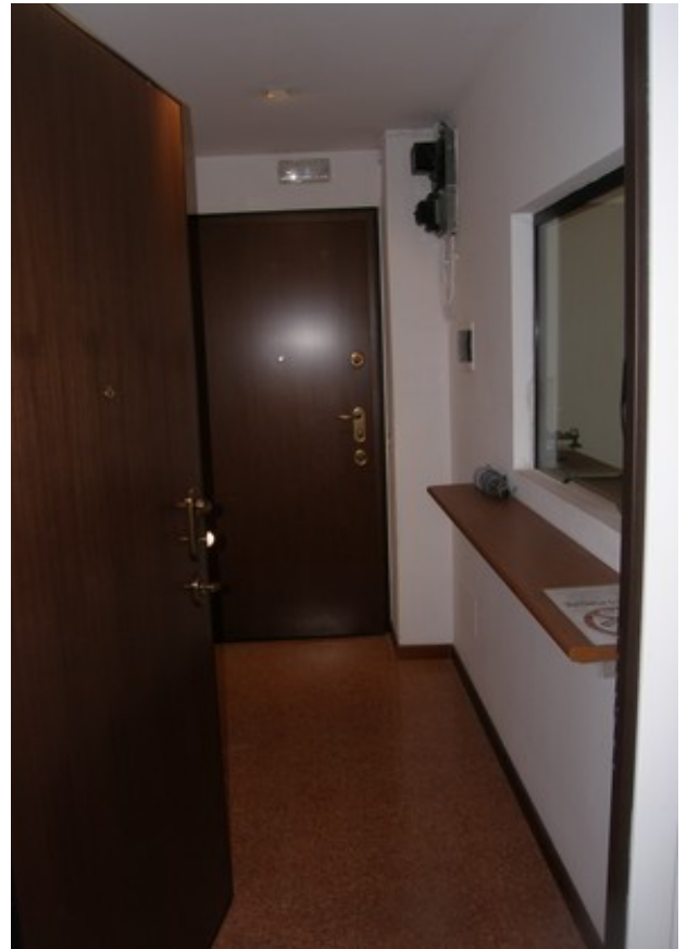
Vista ingresso dall'interno