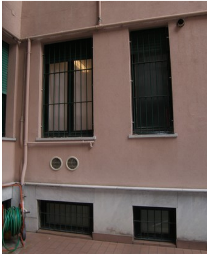
Particolare finestre studio 1 e bagno su fronte cortile