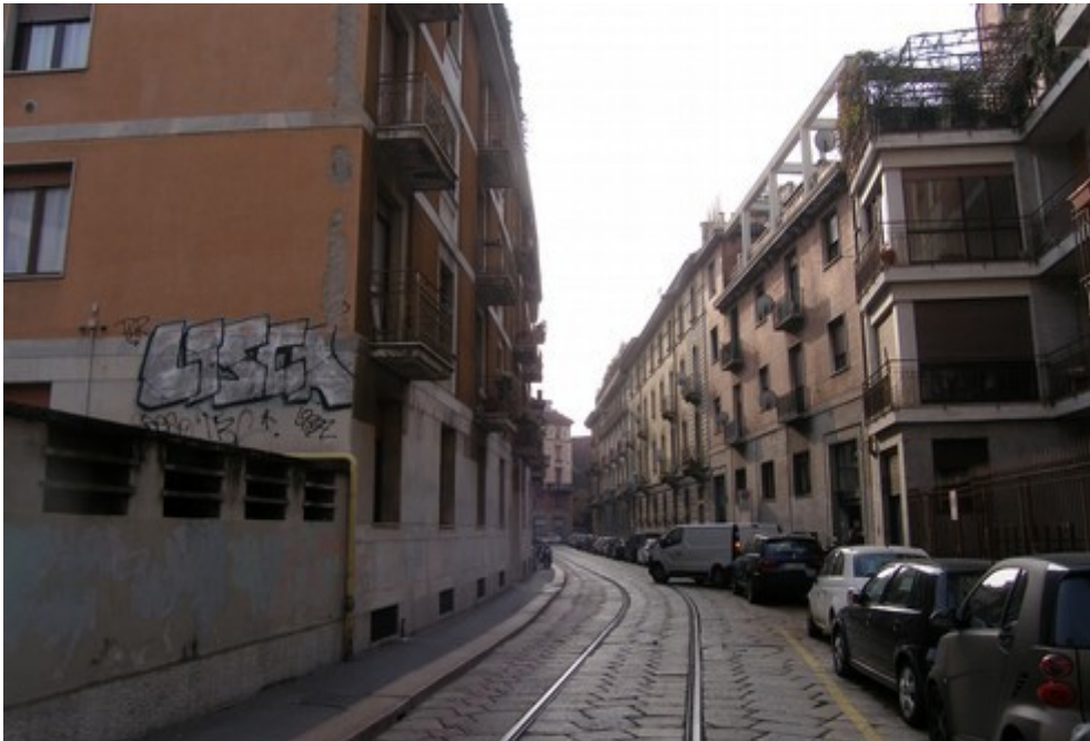
Vista edificio su via Lesmi