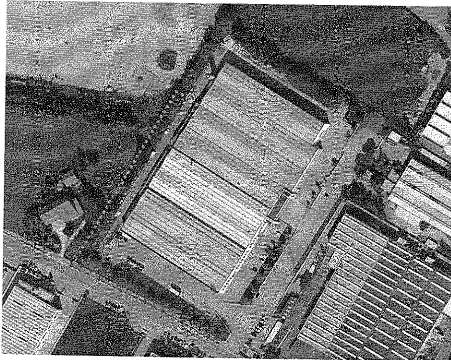
2. Ortofoto: localizzazione dello stabilimento