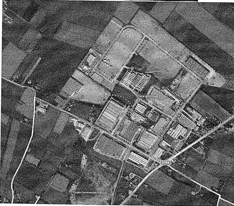
1. Ortofoto: localizzazione dello stabilimento rispetto alla Z.I.

I beni che costituiscono quanto oggetto di perizia sono localizzati presso la sede della [REDACTED]