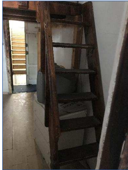
Foto 12 - scala soppalco