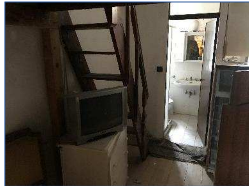
Foto 8 - monolocale