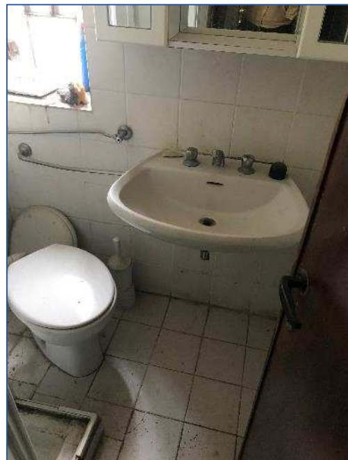
Foto 10 - bagno