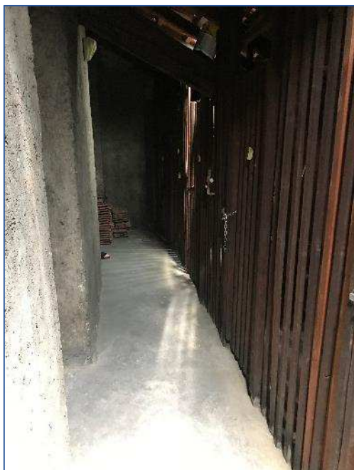
Foto 19 - disimpegno comune sottotetto