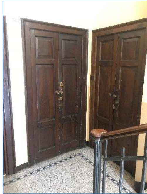
Foto 6 - ingresso all'appartamento