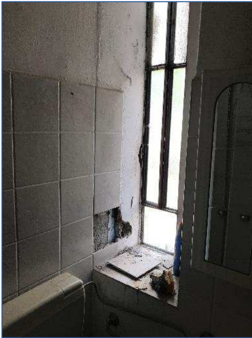
Foto 11 - dettaglio bagno