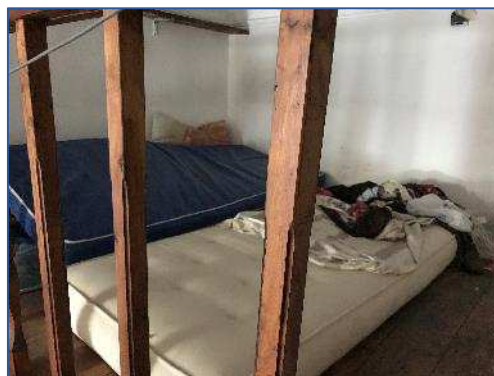
Foto 18 - zona notte su soppalco