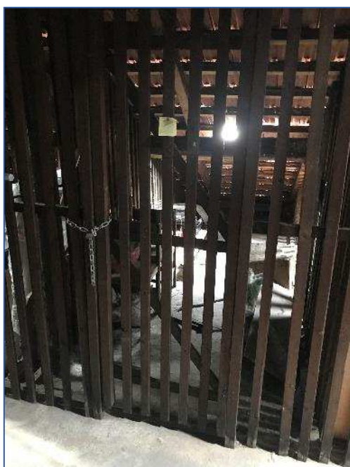
Foto 21 - solaio