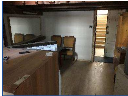
Foto 14 - monolocale