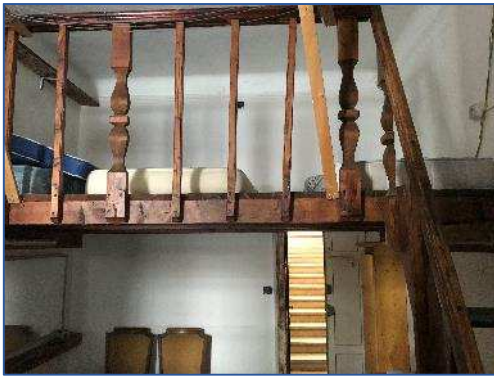
Foto 13 - soppalco ligneo