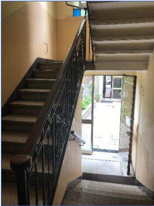
Foto 5 - vano scala corpo interno