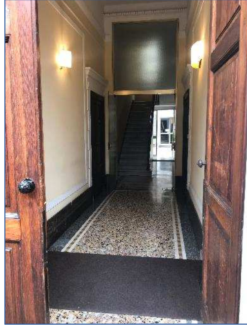
Foto 2 - ingresso al complesso