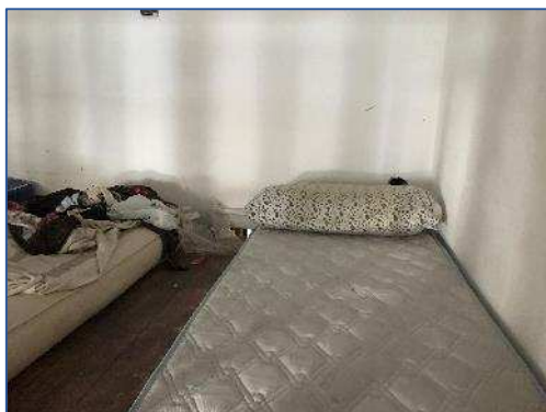
Foto 17 - zona notte su soppalco