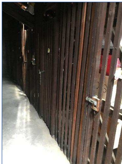
Foto 20 - disimpegno comune sottotetto