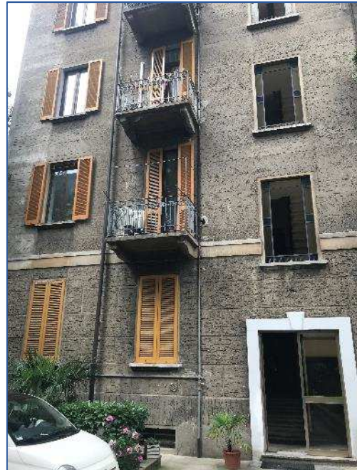
Foto 4 - copro di fabbrica interno