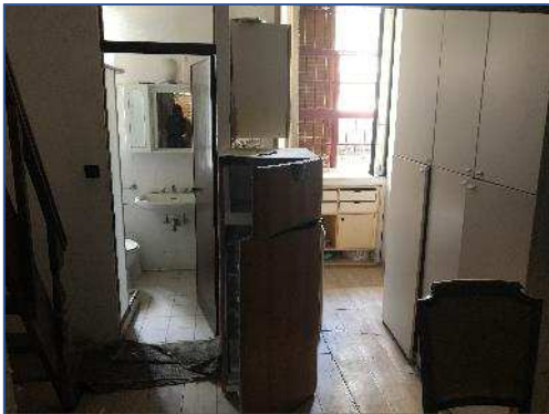
Foto 7 - monolocale