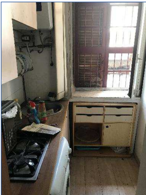
Foto 9 - angolo cottura