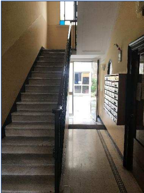
Foto 3 - vano scala comune primo fabbricato