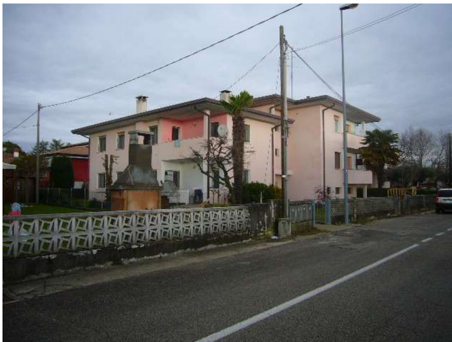
PROSPETTO LATO SUD