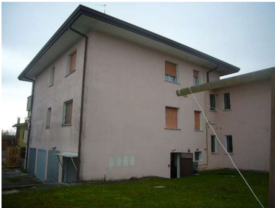
PROSPETTO LATO NORD