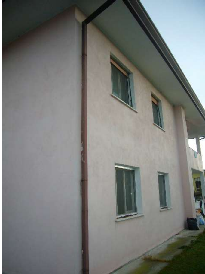
PROSPETTO LATO OVEST