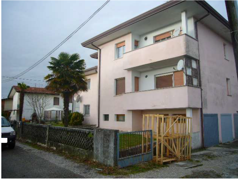
PROSPETTO LATO EST