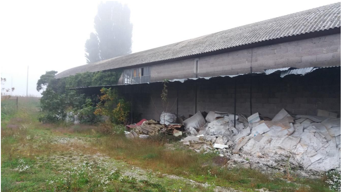
34 – TETTOIA IN LAMIERA DA DEMOLIRE