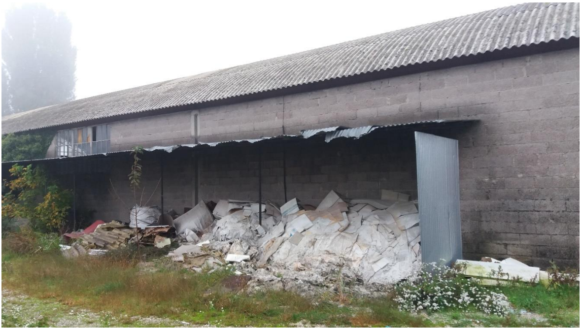
33 – TETTOIA IN LAMIERA DA DEMOLIRE