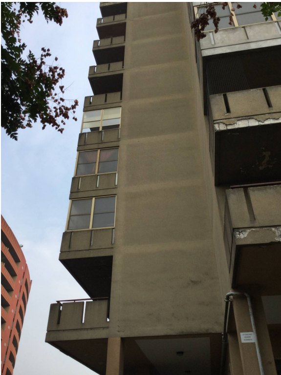
Fig.6: particolare della facciata.