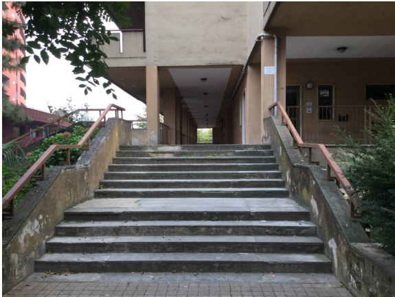
Fig.4: vista rampa di scale accesso edificio.

Iscritto all'Albo dei Consulenti Tecnici del Tribunale di Milano al n°12247