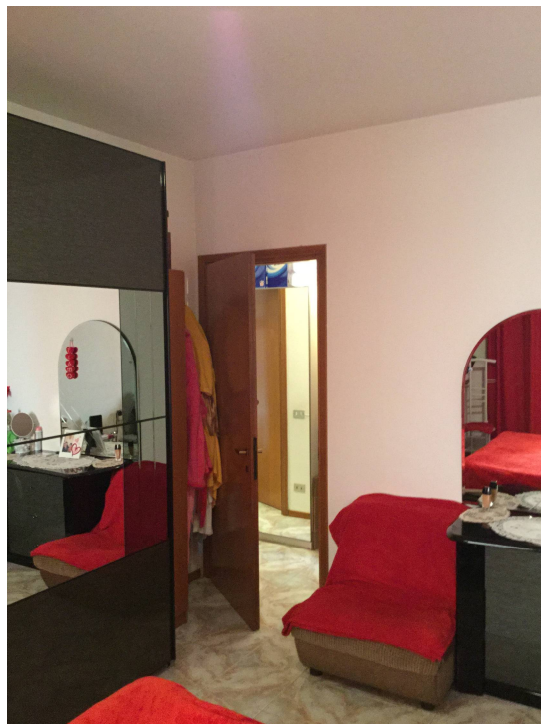
Fig.18-19: viste camera matrimoniale.