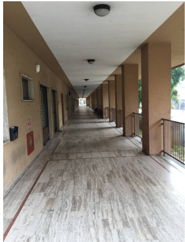
Fig.7: vista porticato edificio lato Viale dei Pini.