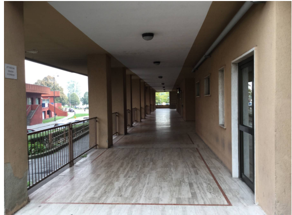
Fig.5: porticato di accesso alla scala "M".