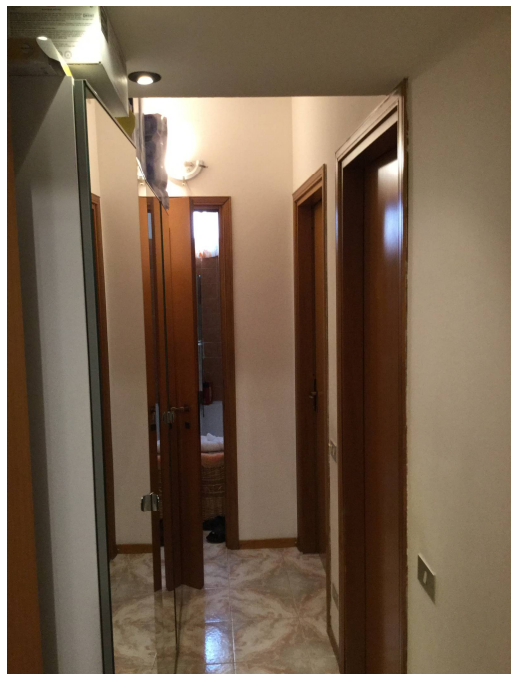
Fig.15: vista del disimpegno.

Iscritto all'Albo dei Consulenti Tecnici del Tribunale di Milano al n°12247