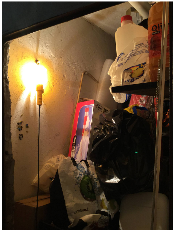
Fig.11: interno cantina.

Iscritto all'Albo dei Consulenti Tecnici del Tribunale di Milano al n°12247