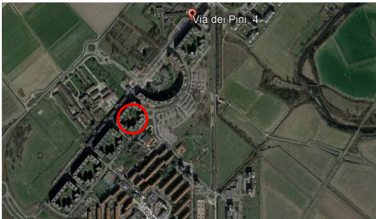
Fig.1: vista aerea dell'edificio oggetto di trattazione.