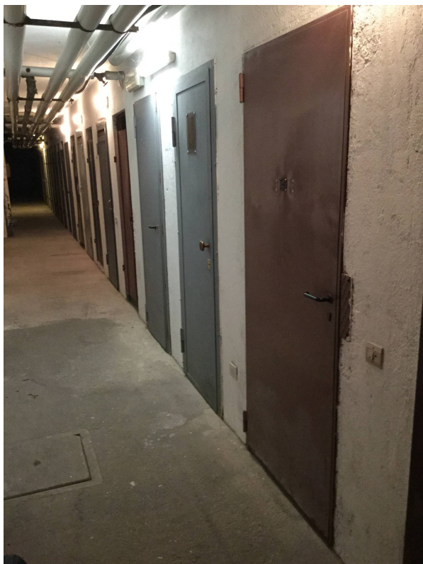
Fig.10: vista porta di ingresso cantina.