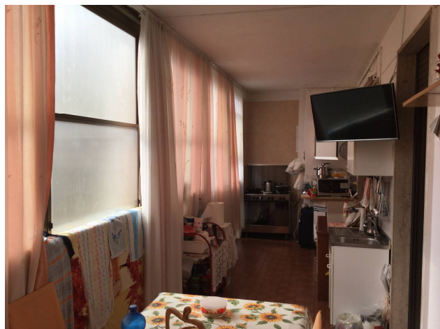
Fig.22: vista balcone.

Iscritto all'Albo dei Consulenti Tecnici del Tribunale di Milano al n°12247