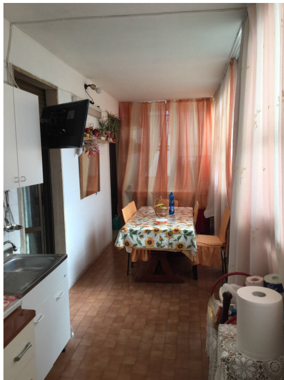
Fig. 23: vista balcone.