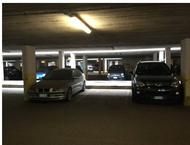
Fig.12: vista posto auto.