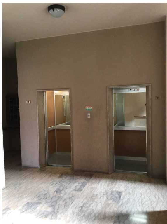
Fig.9: vista area ascensori.