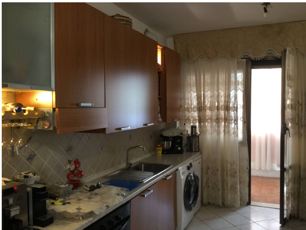
Fig.27: viste parete attrezzata cucina.