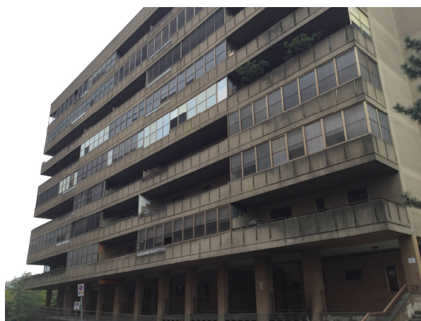
Fig.3: vista dell'edificio da Via degli Olmi.