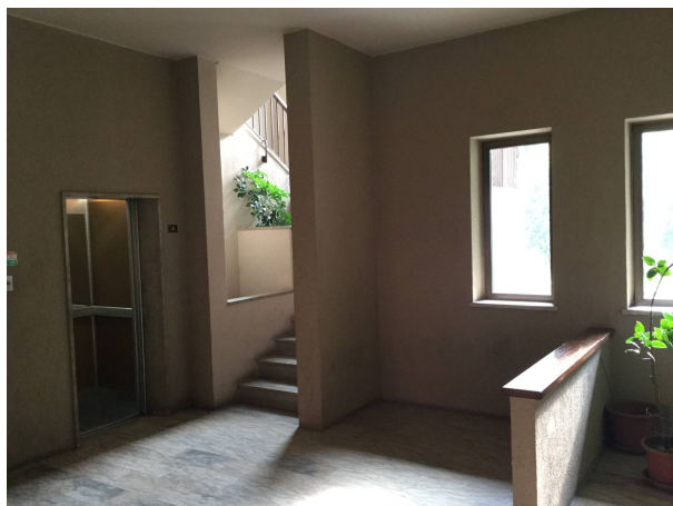
Fig.8: vista atrio di ingresso edificio.

Iscritto all'Albo dei Consulenti Tecnici del Tribunale di Milano al n°12247