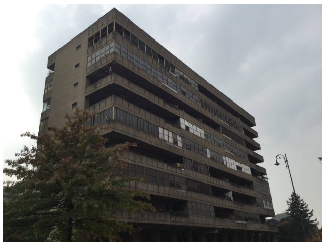
Fig.2: vista dell'edificio da Viale dei Pini.