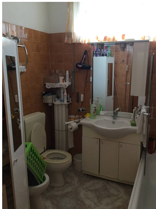
Fig.16: servizio igienico.