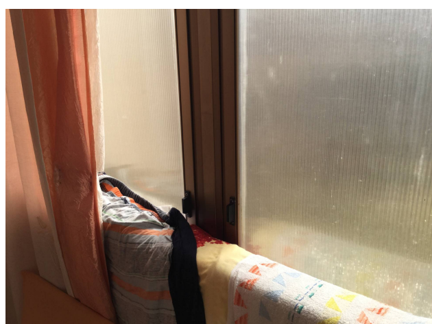
Fig.24: particolare serramento di chiusura balcone.