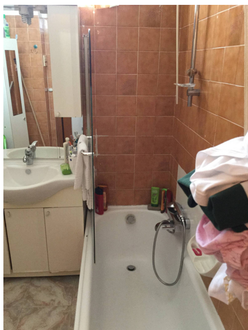
Fig.17: vista del servizio igienico.