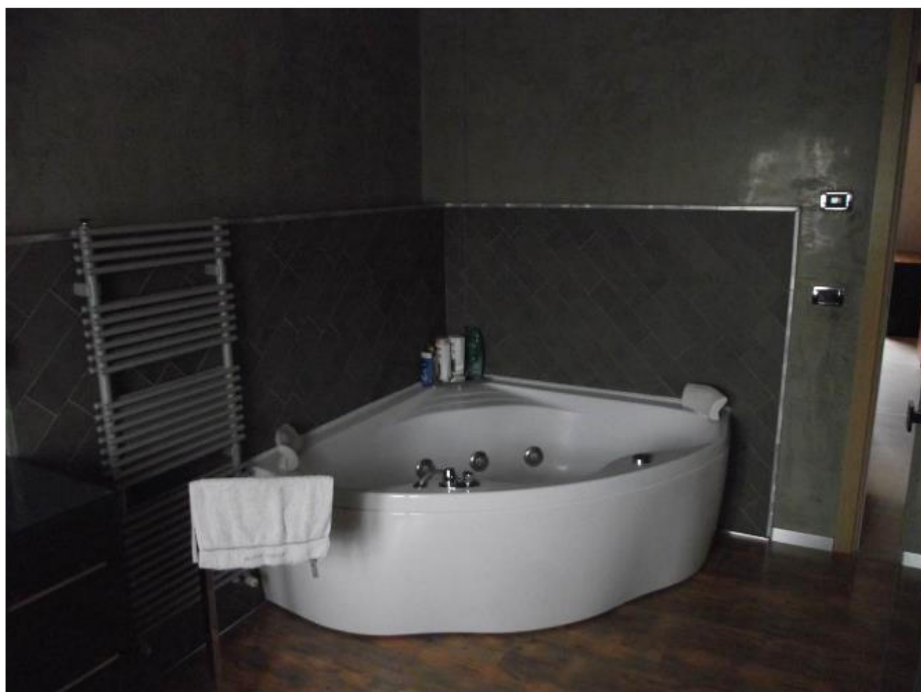
Foto 22 - bagno