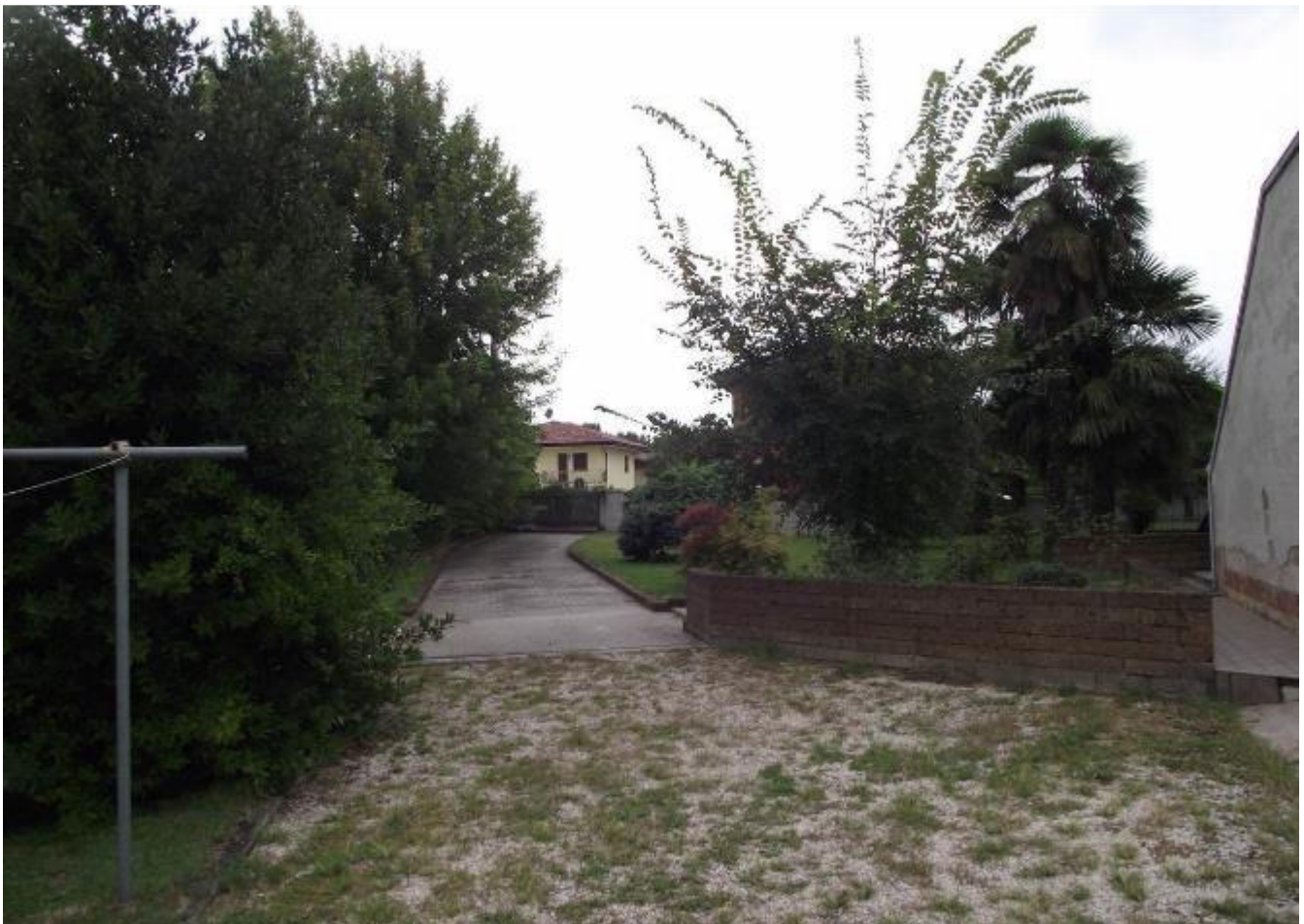
Foto 8 – vialetto di accesso unità abitativa stimata – gravato da servitù di passaggio a favore del Consorzio di Bonifica e del Demanio