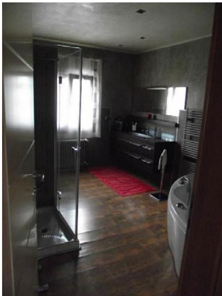
Foto 21 - bagno