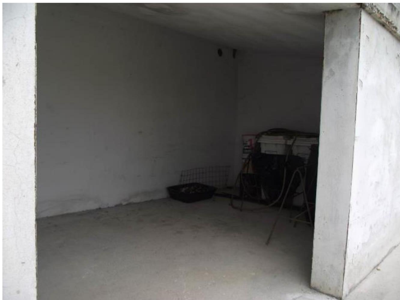
Foto 14 - ripostiglio verso area verde retrostante