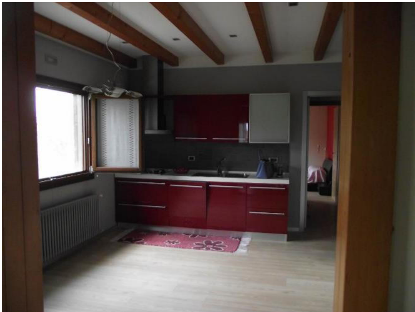
Foto 17 - cucina