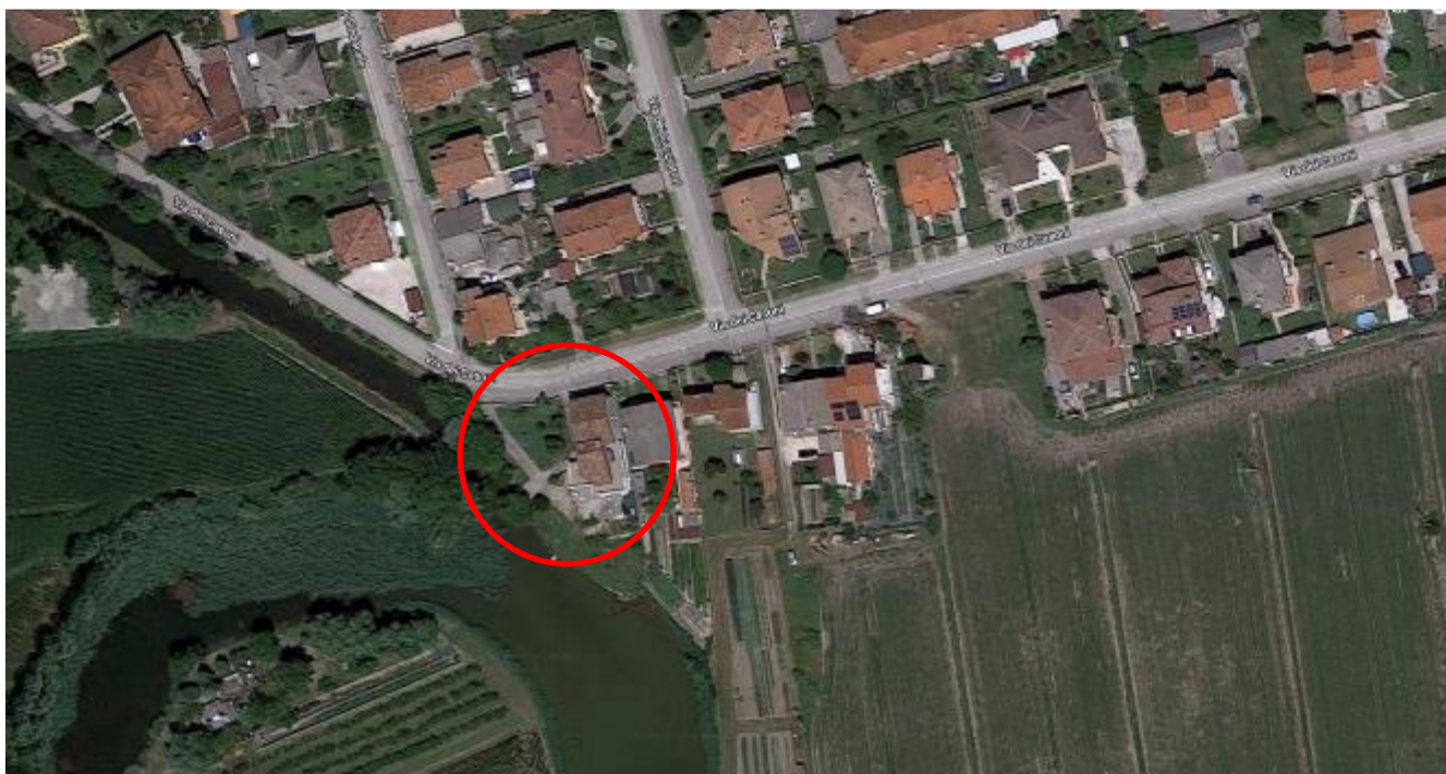
Foto 1 - Vista aerea