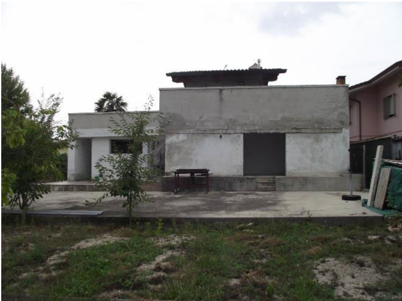
Foto 6 vista posteriore zona autorimessa e terrazza