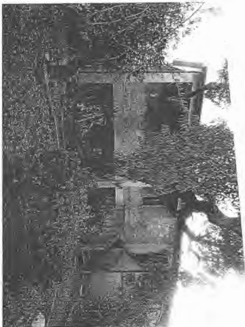
Fronte nord – Ingresso (foto n.2)

A handwritten signature in cursive script, written in dark ink. The signature is stylized and appears to be the name of the person who signed the document.