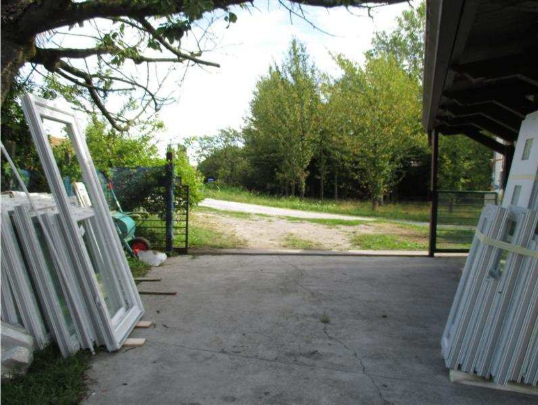
17) Veduta dell'ingresso e della strada di accesso