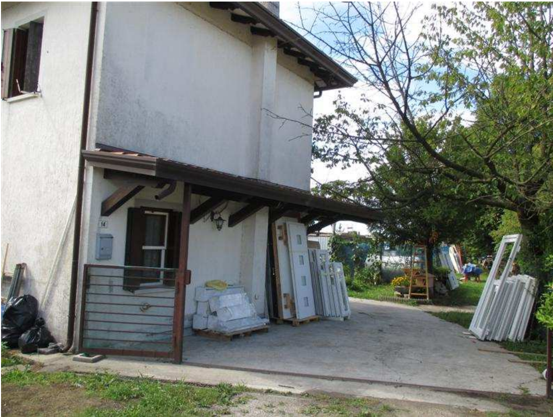
11) Prospetto nord-ovest