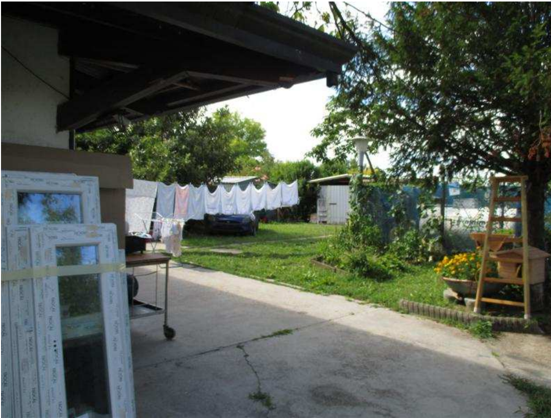
15) Vedute dell'area scoperta pertinenziale dall'ingresso