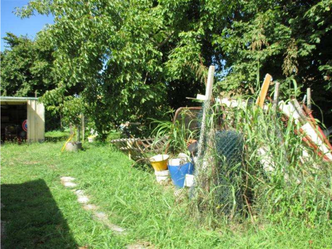
43) Vedute di baracca non assentita