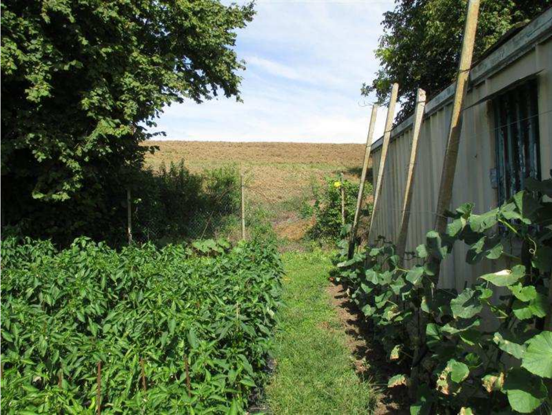
47) Veduta dell'argine; a destra, baracca non assentita