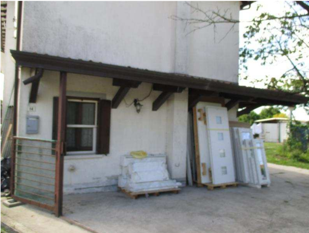
13) Prospetto nord-ovest