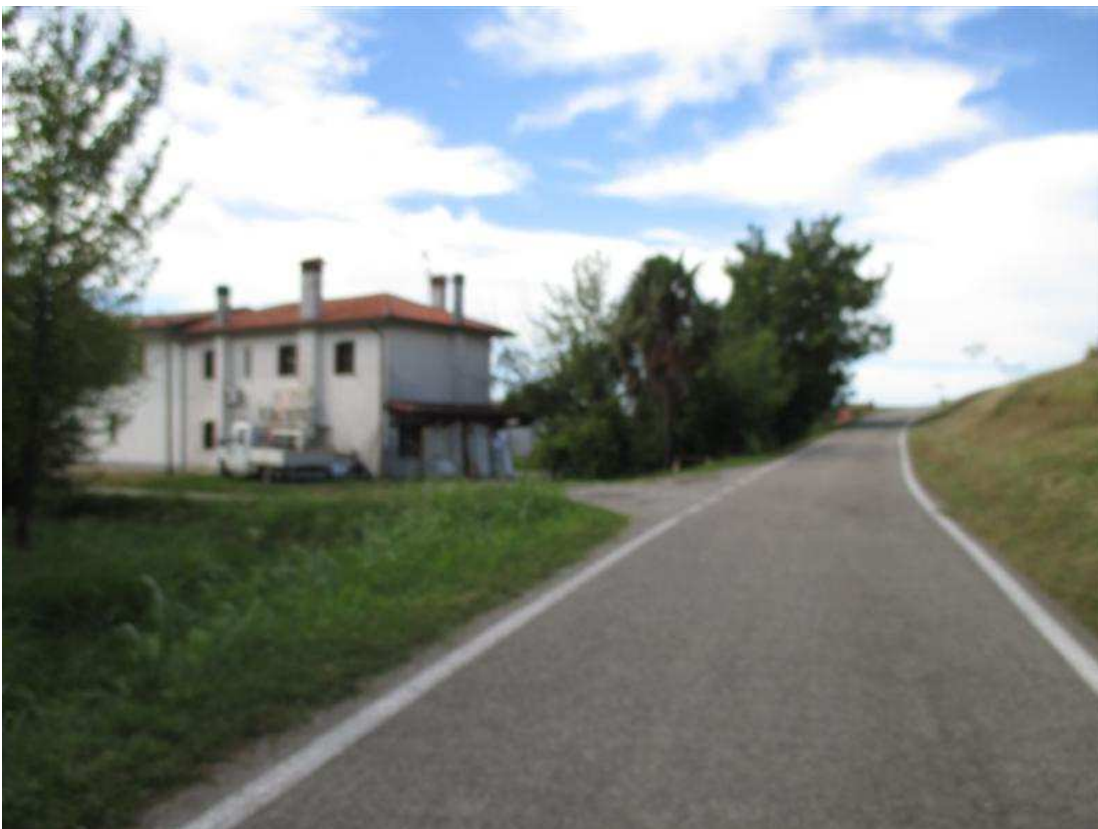
2) Via Cava