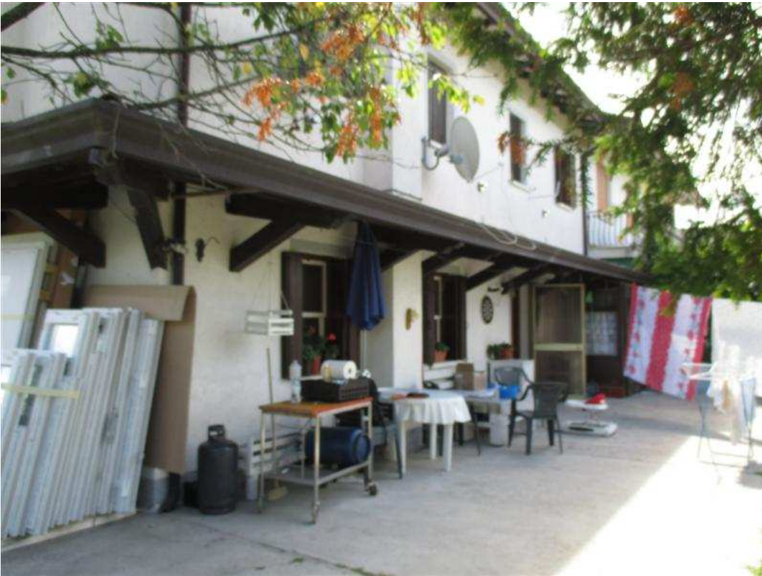
21) Prospetto sud-ovest