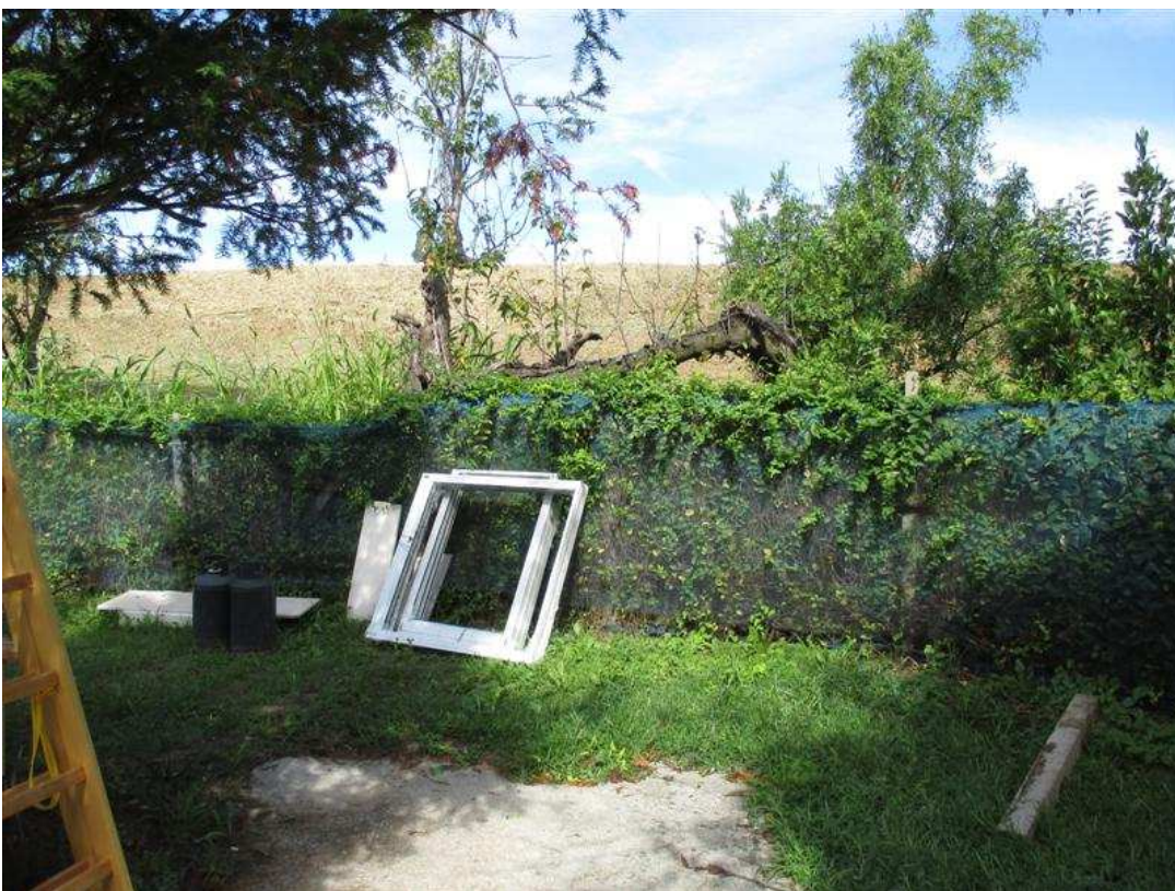
34) Confine dell'area lungo piede argine