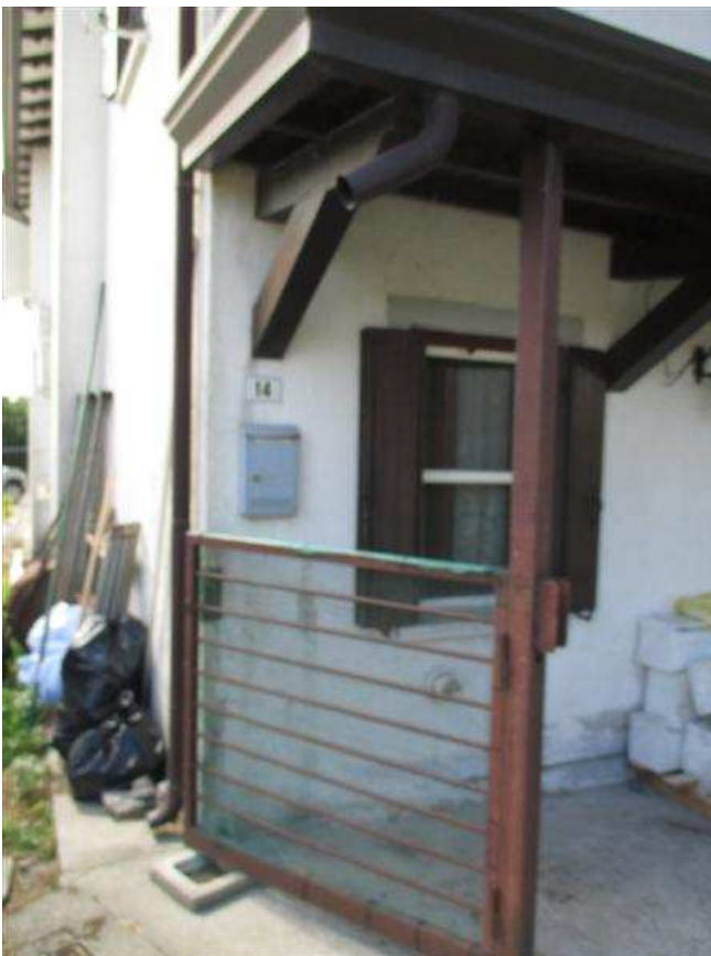
12) Ingresso al civico n. 14 di via Cava