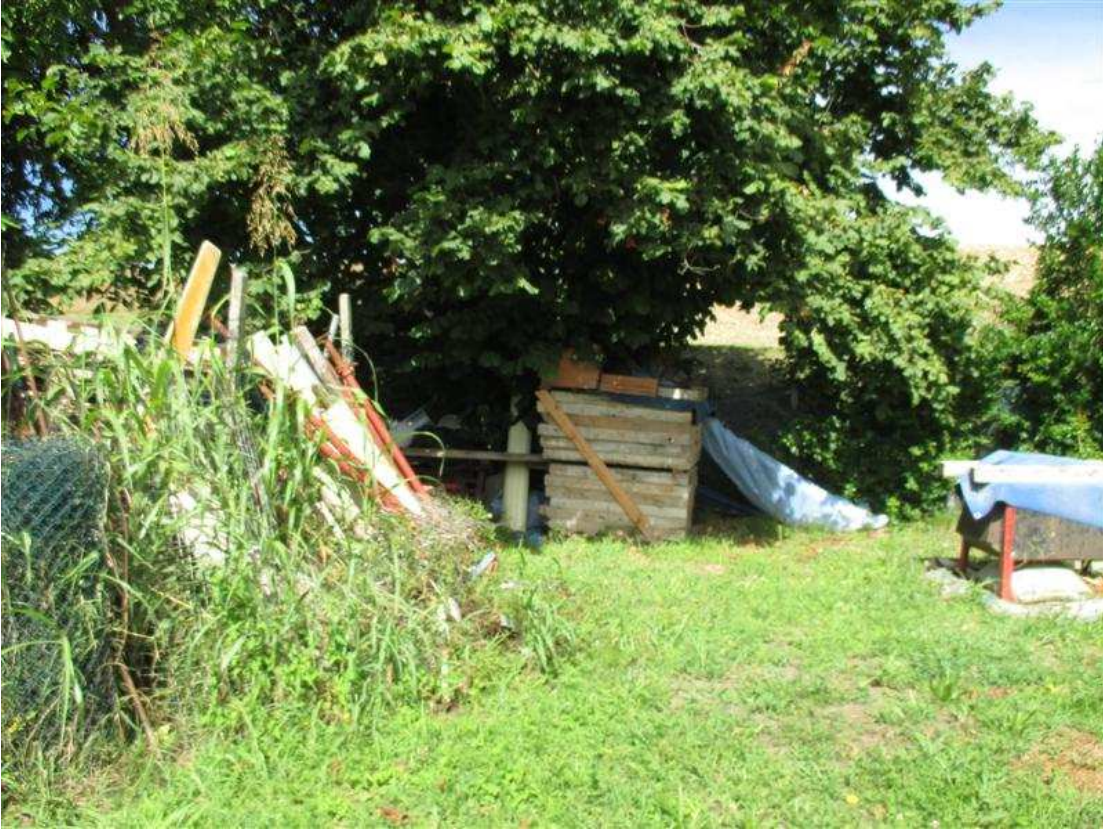
37) Confine dell'area lungo piede argine