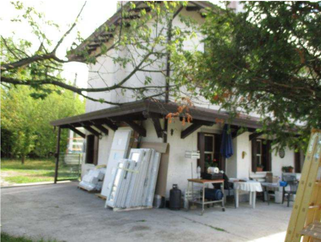
19) Prospetti nord-ovest e sud-ovest