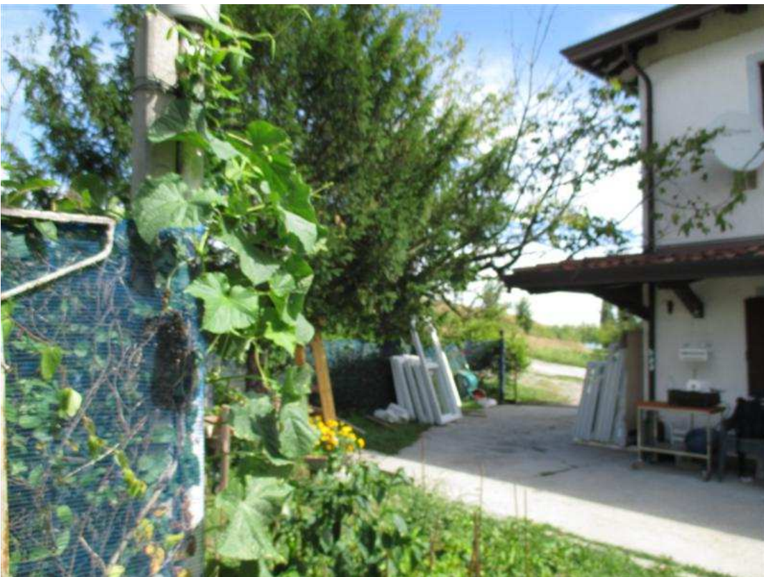
18) Angolo ovest del fabbricato