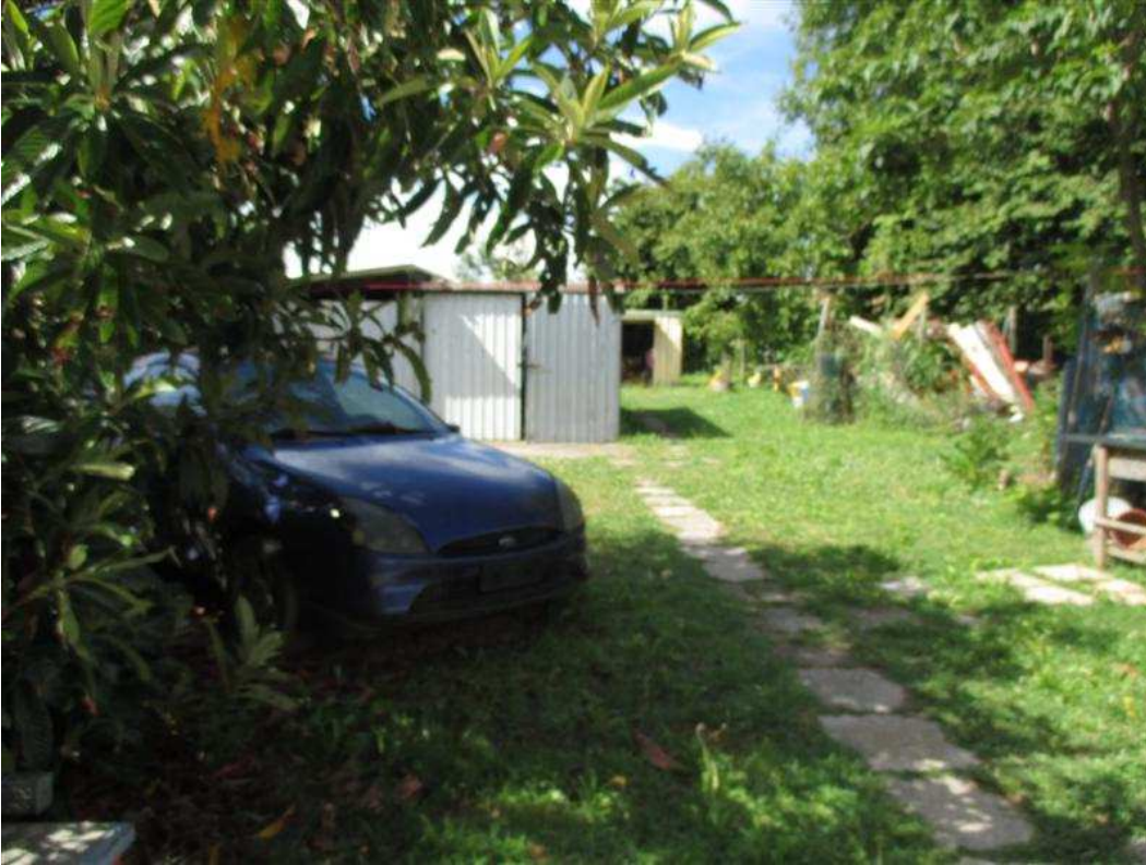
39) Veduta degli accessori garage