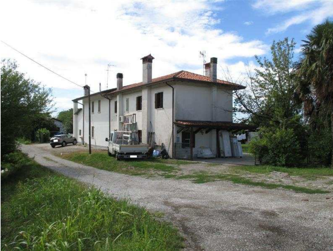
1) Veduta d'insieme del fabbricato da via Cava