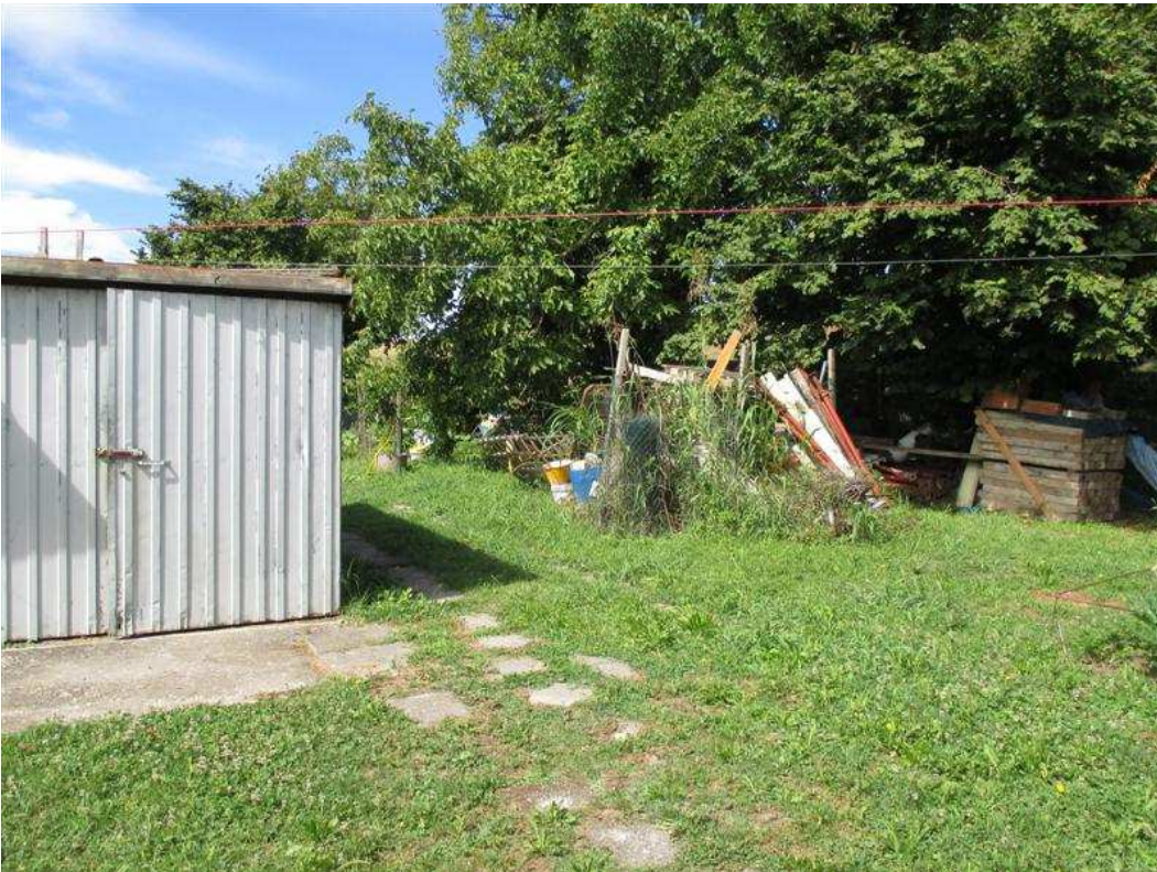
40) Accessorio garage