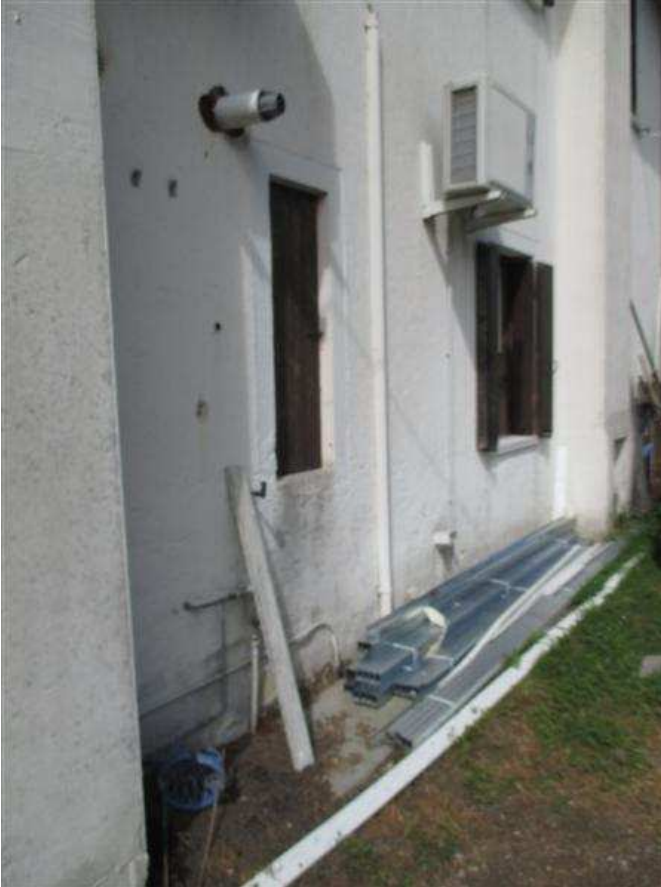
7) Particolari del prospetto nord-est