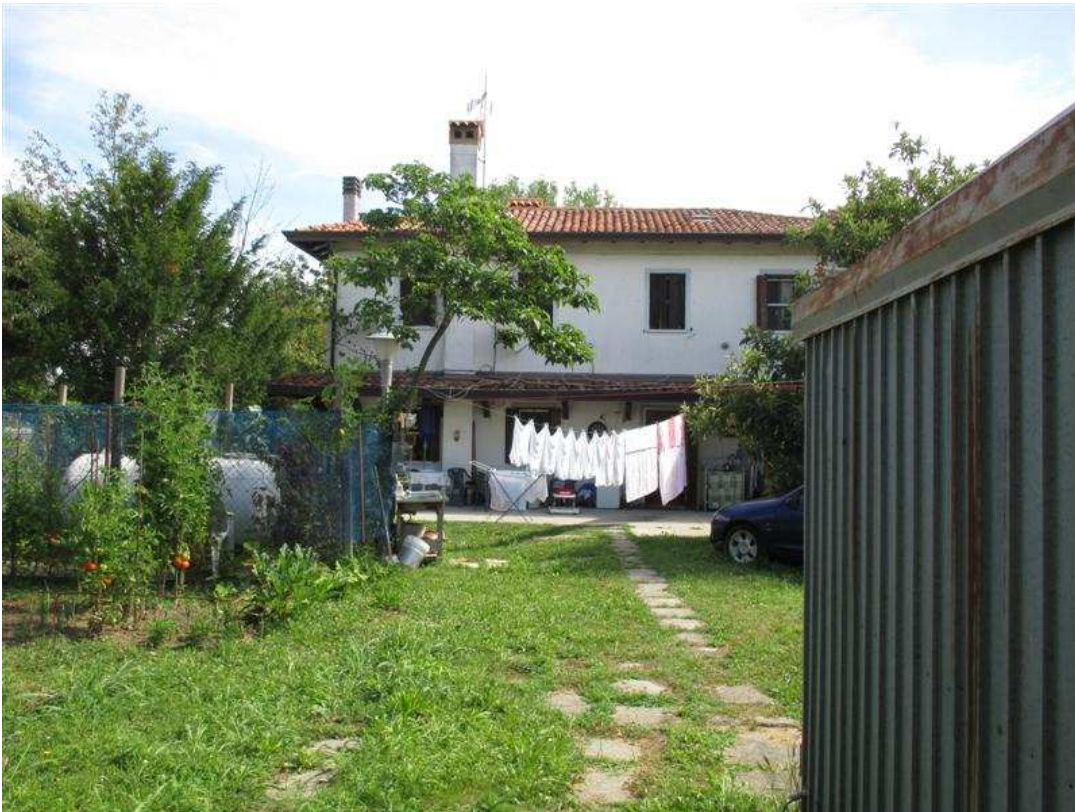
29) Area scoperta antistante il prospetto sud-ovest