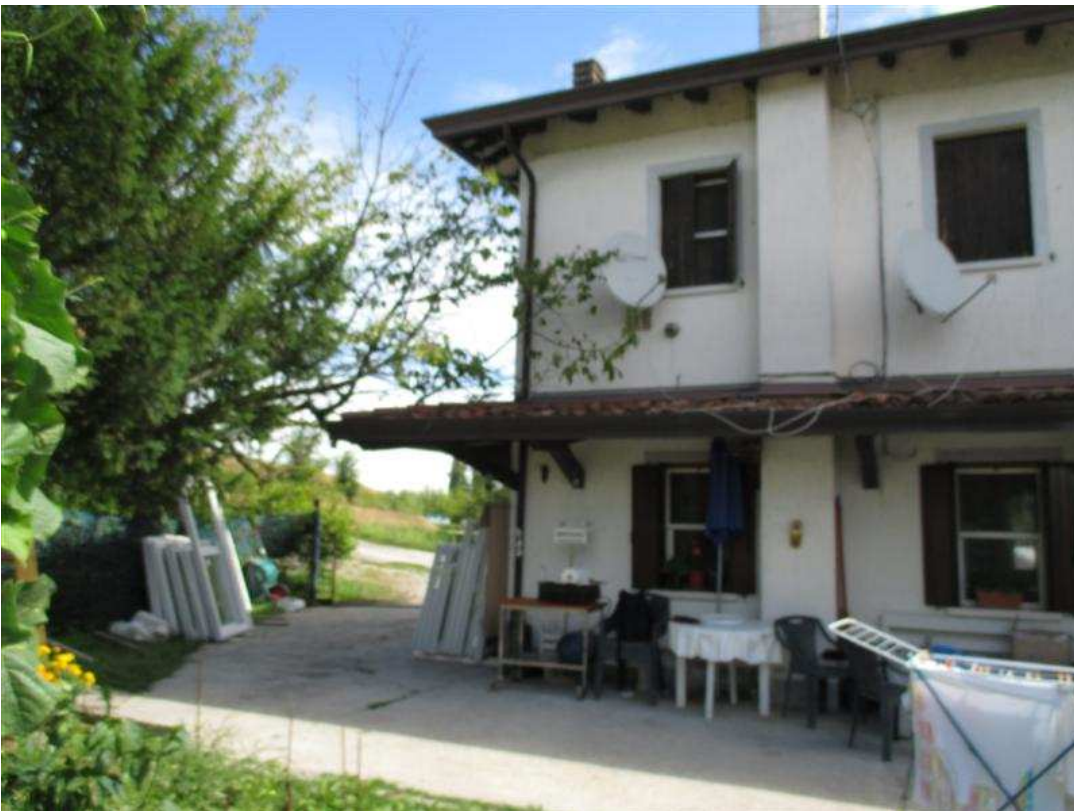
20) Prospetto sud-ovest