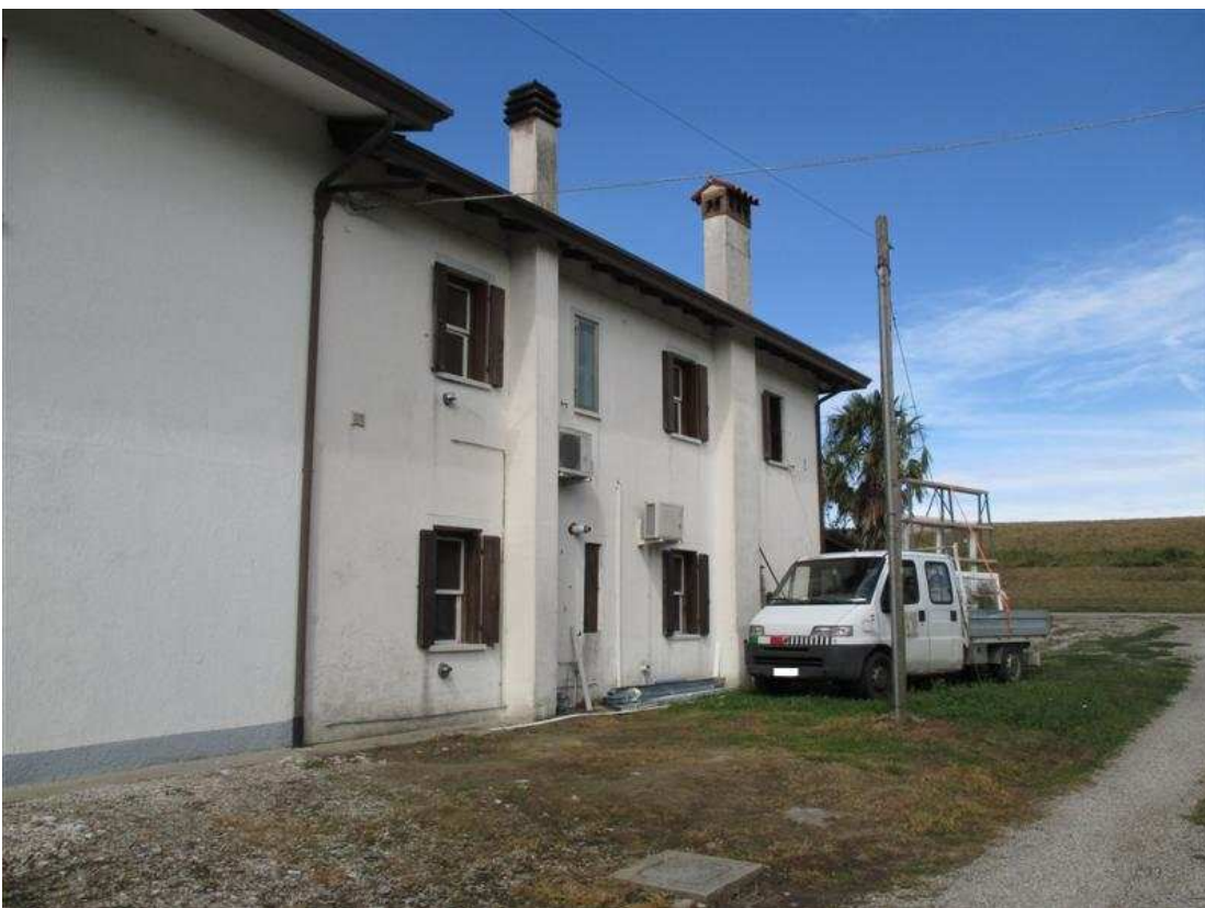
4) Prospetto nord-est