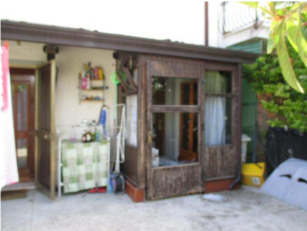
24) Veranda non assentita sotto portico su prospetto sud-ovest