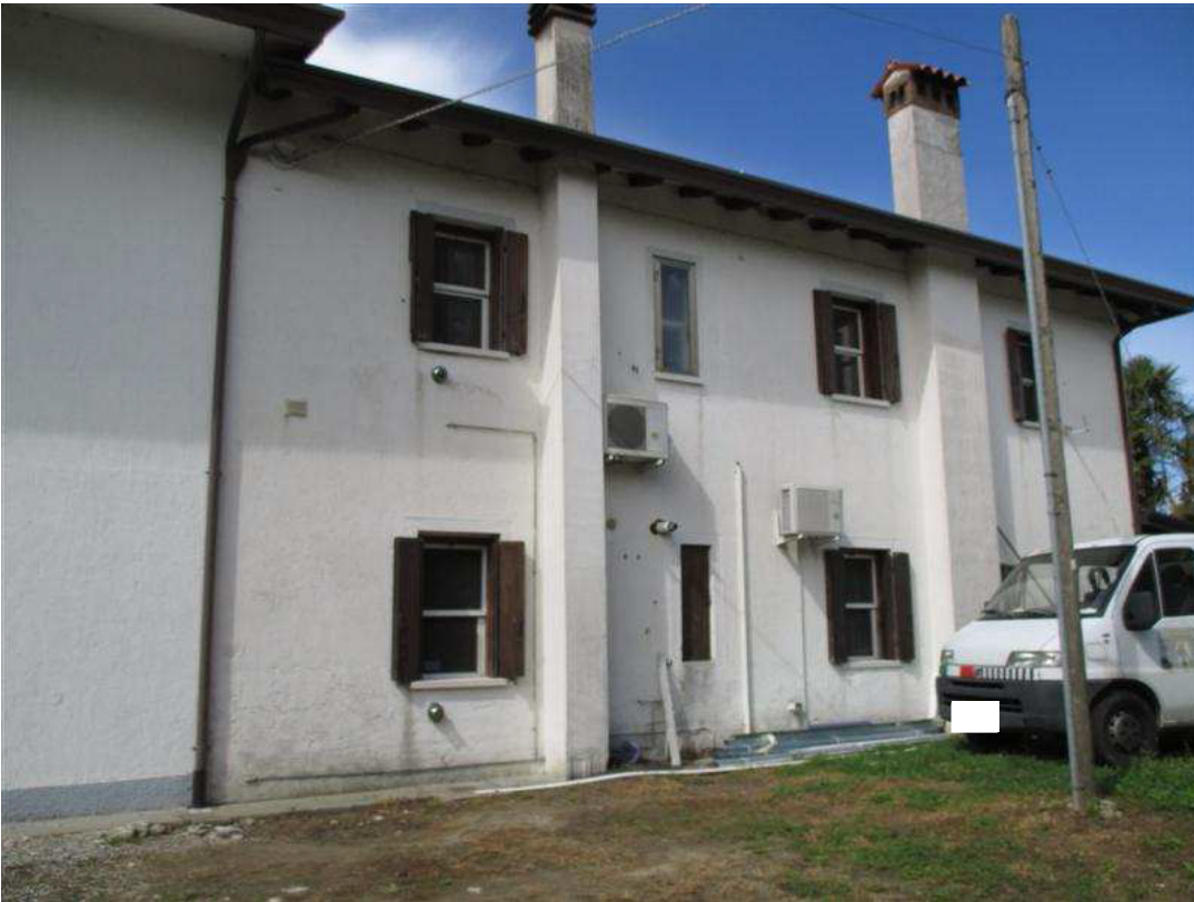
5) Prospetto nord-est