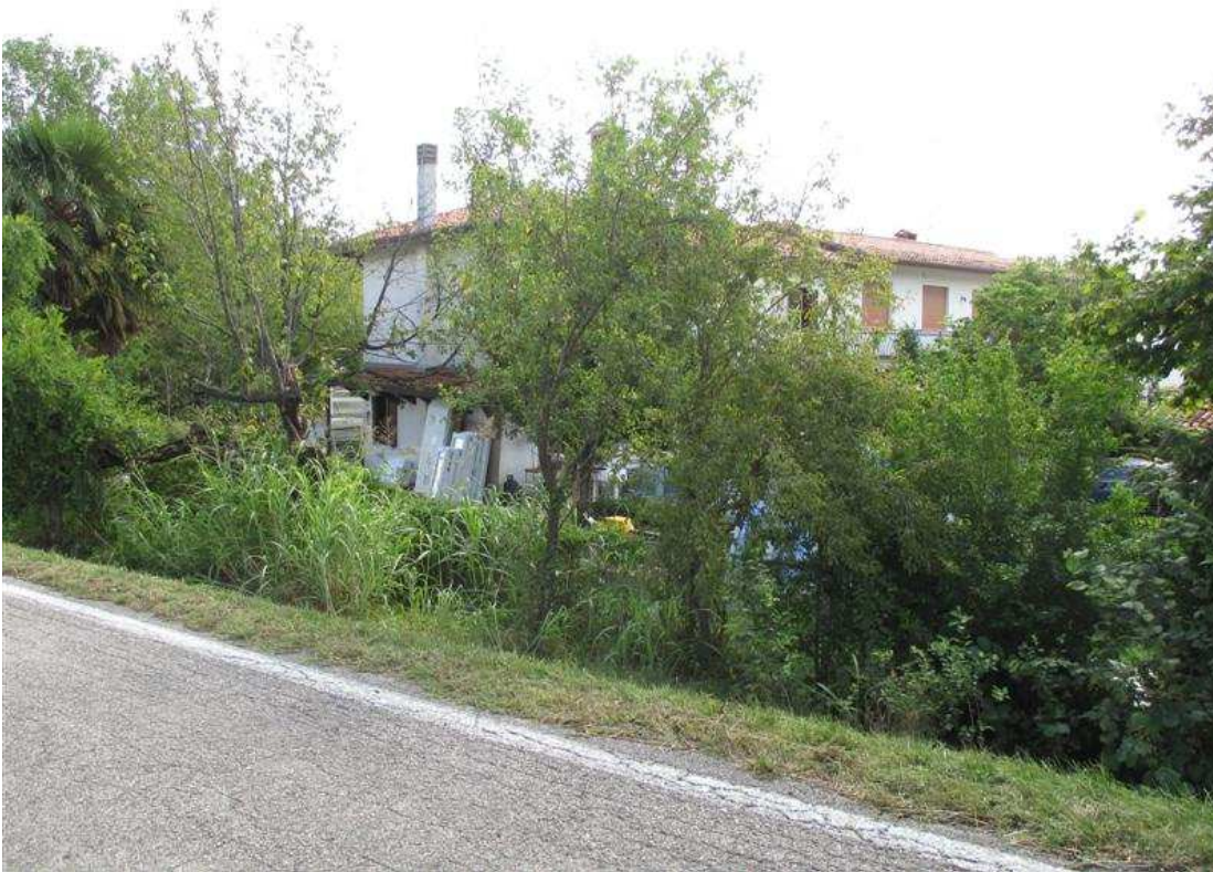
3) Veduta del fabbricato dalla strada