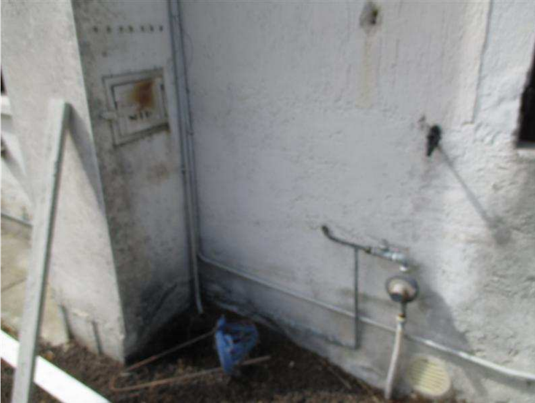
9) Particolare di canna fumaria sul prospetto nord-est