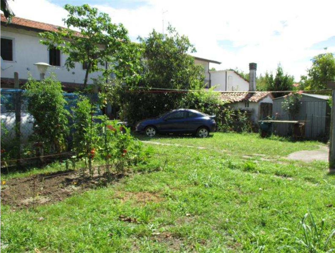
27) Area scoperta antistante il prospetto sud-ovest