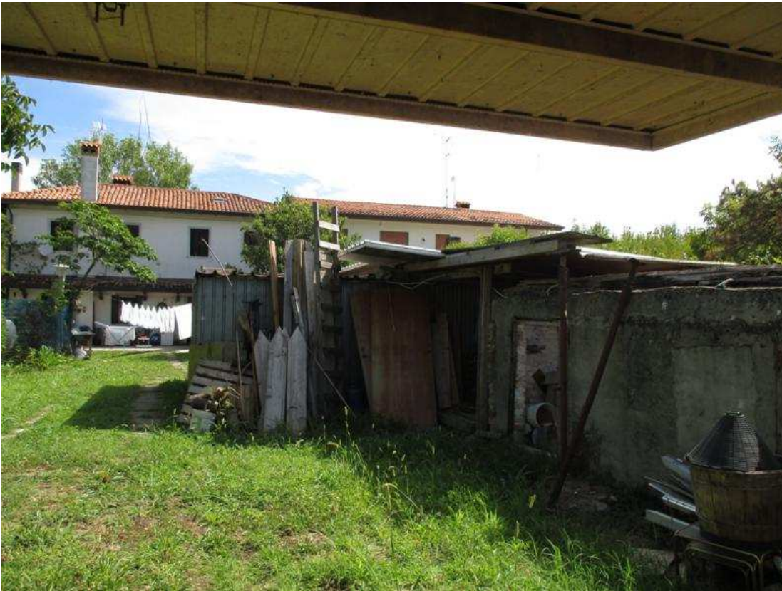
41) Accessorio lungo confine est: ex pollaio e tettoia non assentita