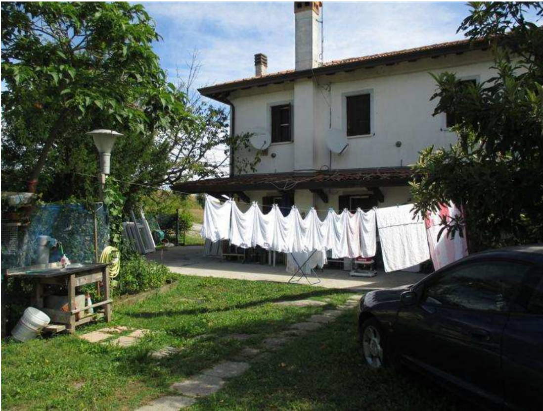
25) Area scoperta antistante il prospetto sud-ovest