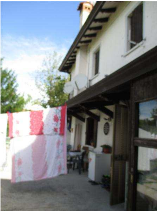
23) Prospetto sud-ovest