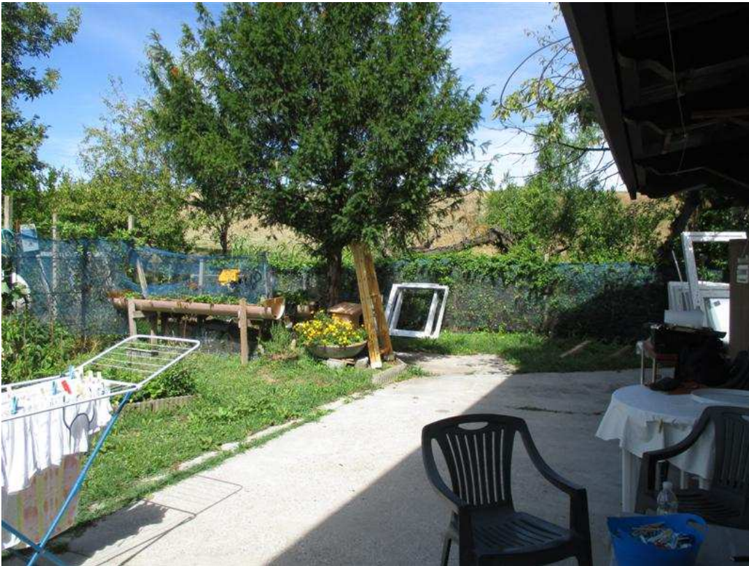
33) Portico ed area scoperta antistante il prospetto sud-ovest