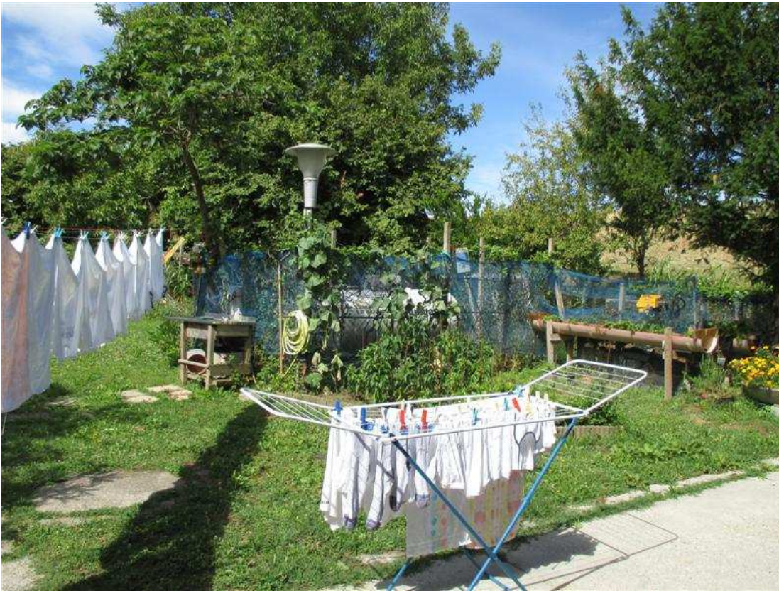
31) Vedute dell'area scoperta antistante il prospetto sud-ovest