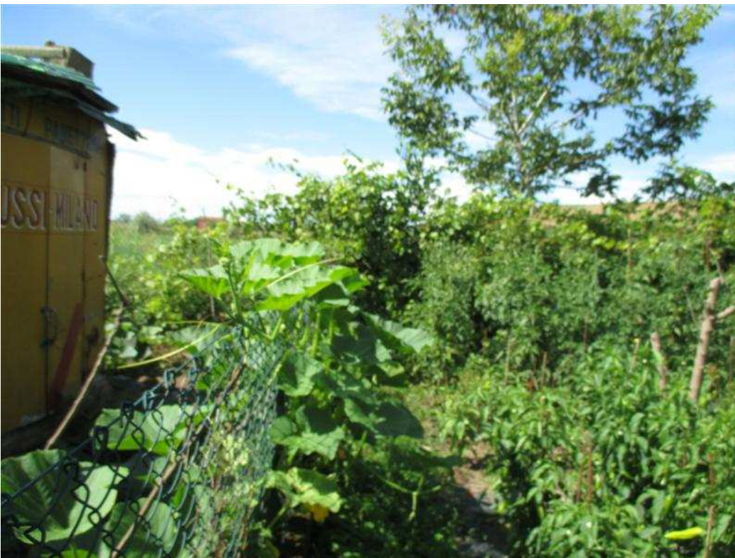
46) Veduta del confine sud; a sinistra confine con proprietà aliena