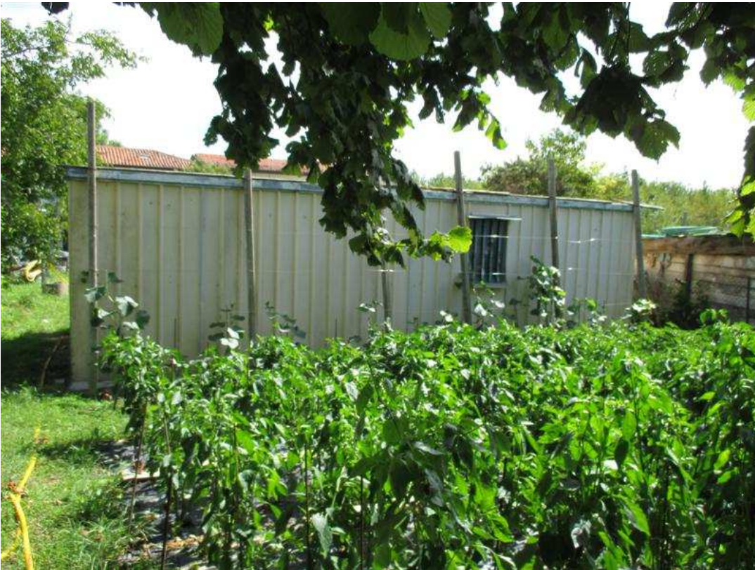
45) Baracca non assentita ed orto antistante