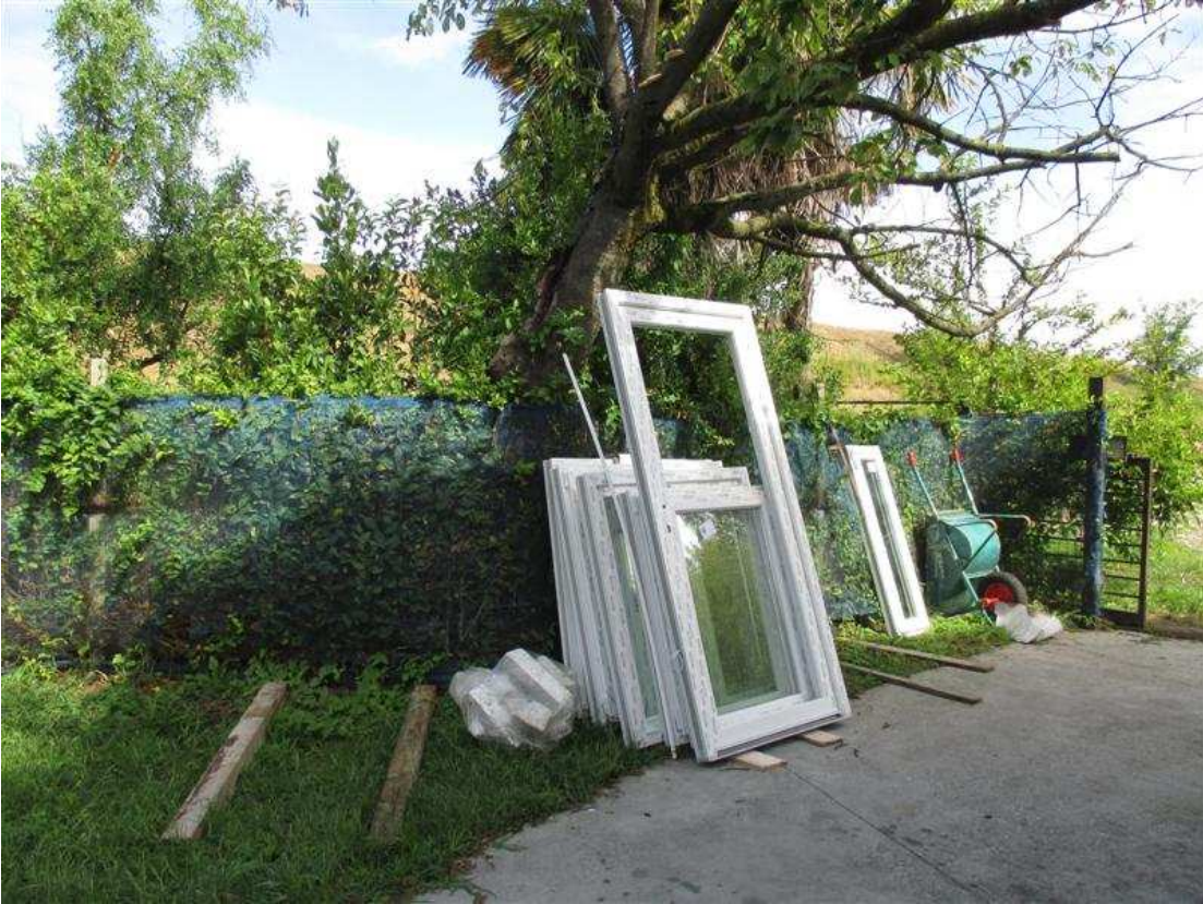
35) Confine dell'area in prossimità dell'ingresso dalla strada