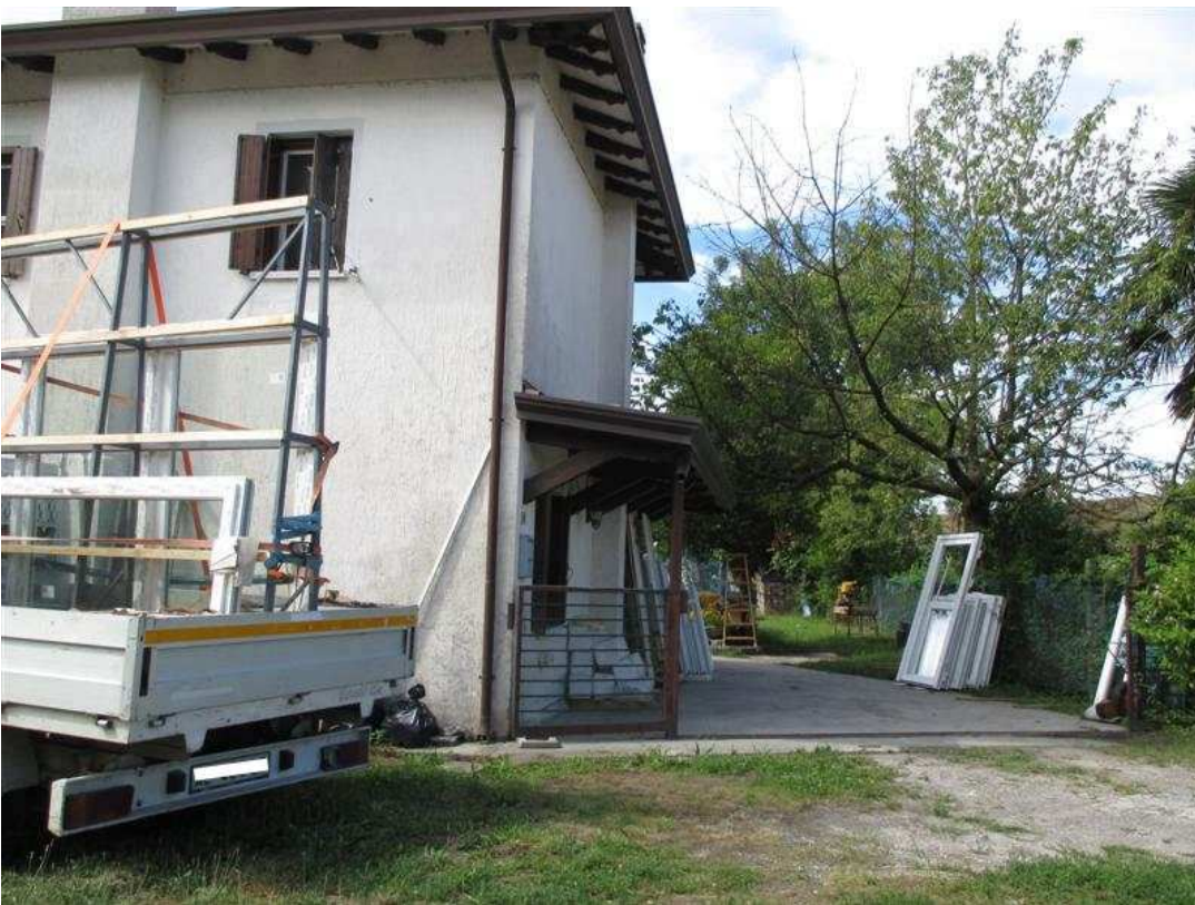
10) Angolo nord del fabbricato