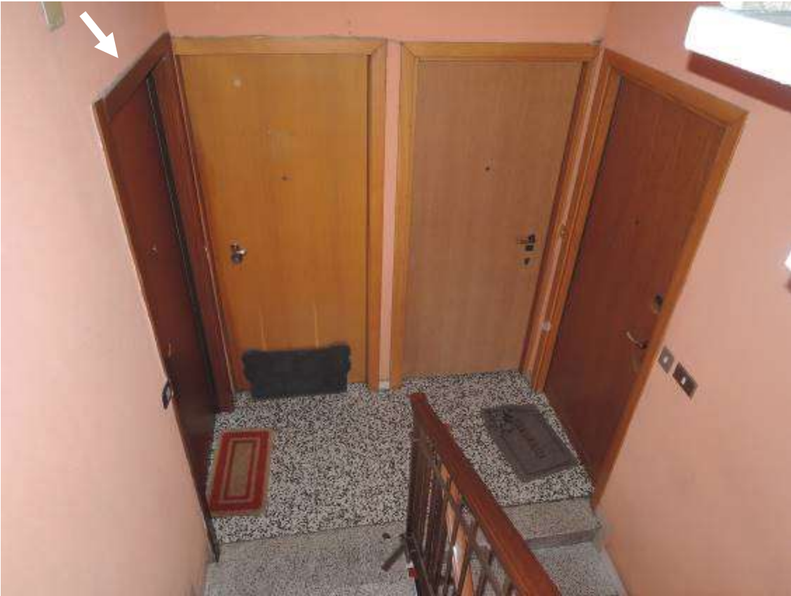
Pianerottolo al piano 4° - individuazione dell'unità