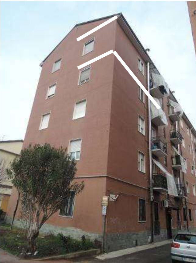
Fabbricato condominiale - individuazione dell'unità