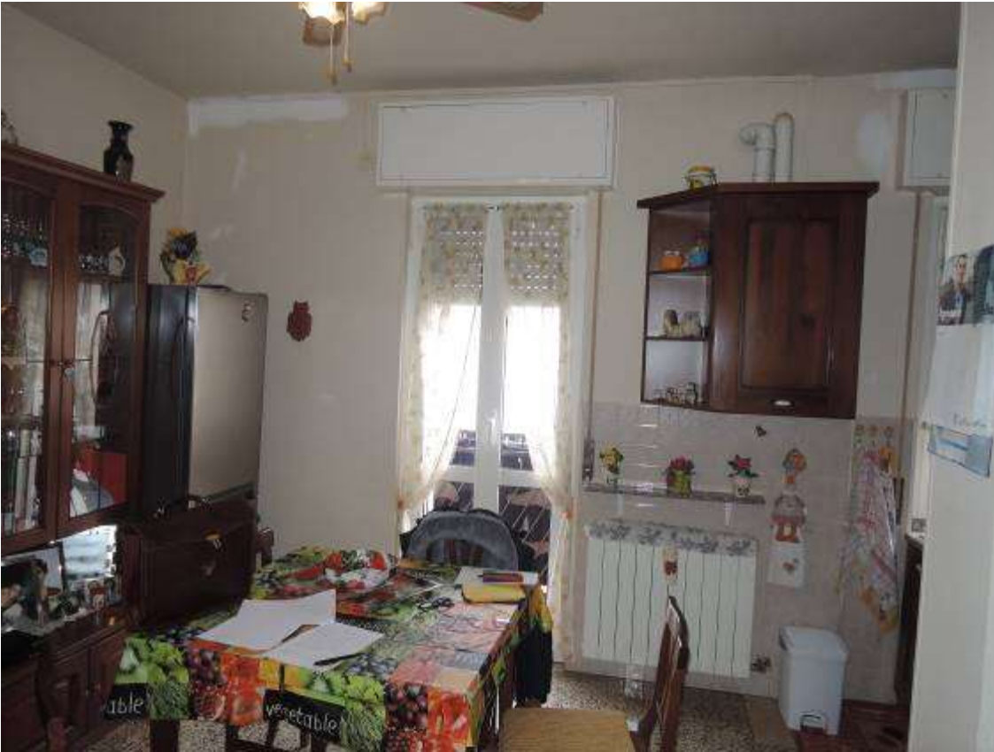
Soggiorno con angolo cottura