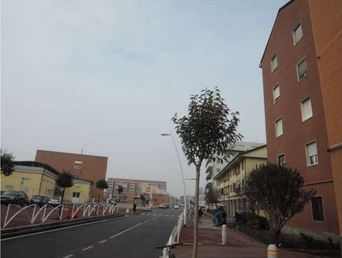
Pioltello Via alla Stazione n°14