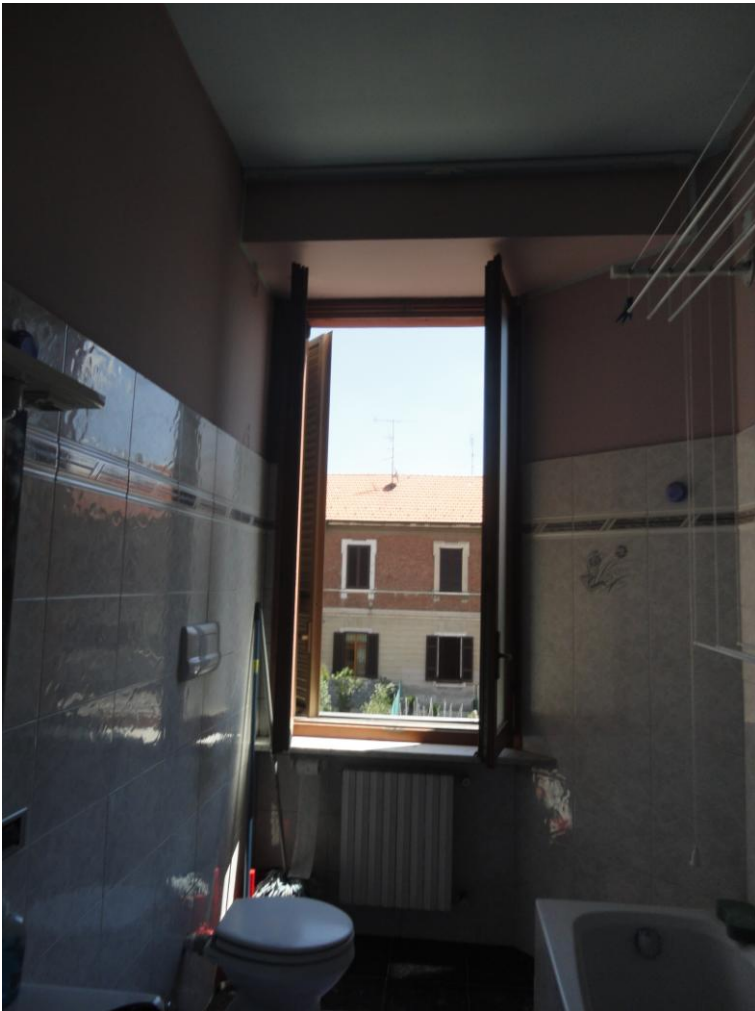
Figura 9 e 10 Servizio igienico e caldaia posta nel locale cucina