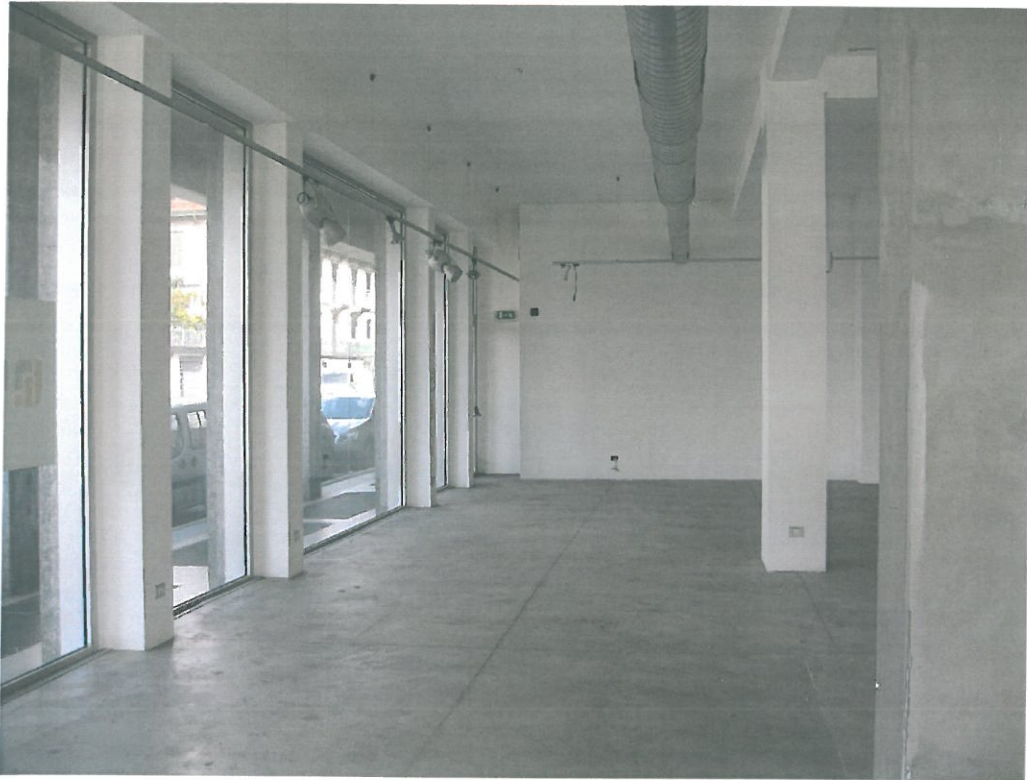
Vista interna con scala di accesso al piano S1