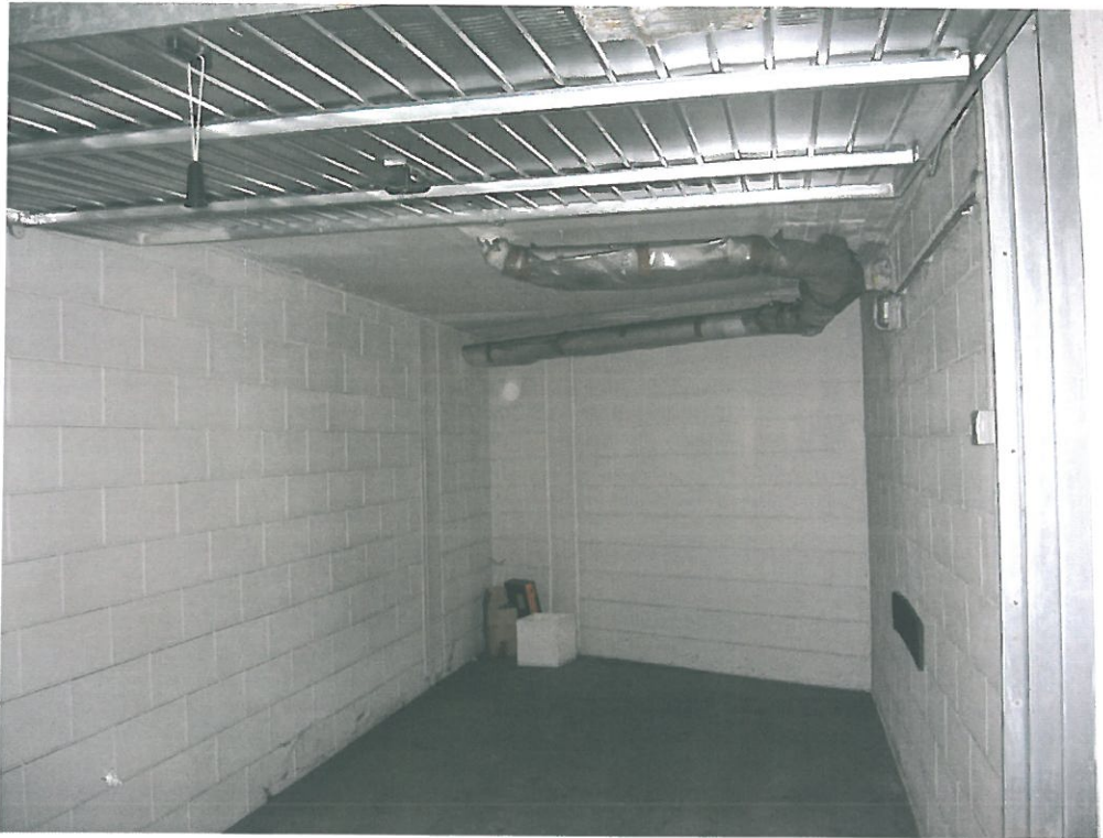
Vista interna autorimessa (sub. 43 P. 2° interrato)