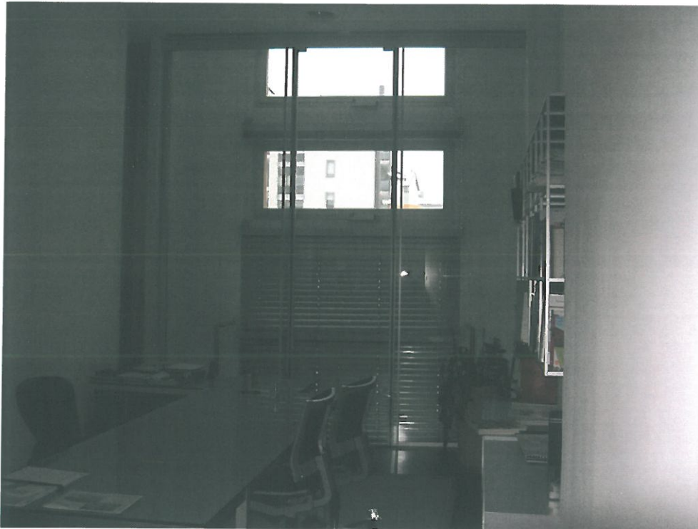
Vista Interna uffici