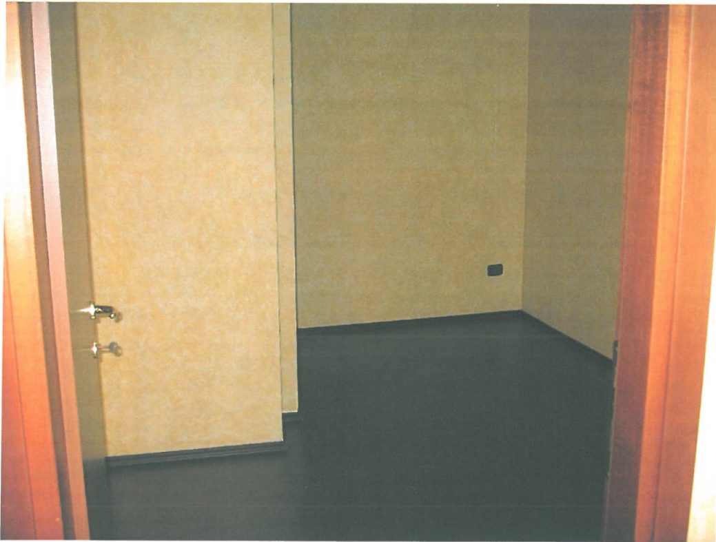
Vista interna W.C.