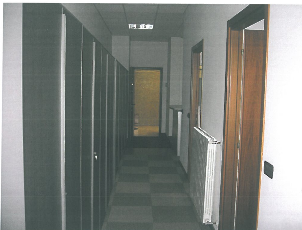
Vista secondo corridoio (trasversale al 1°)