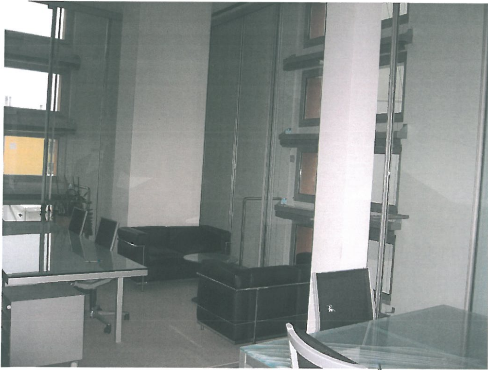
Vista interna V.C.