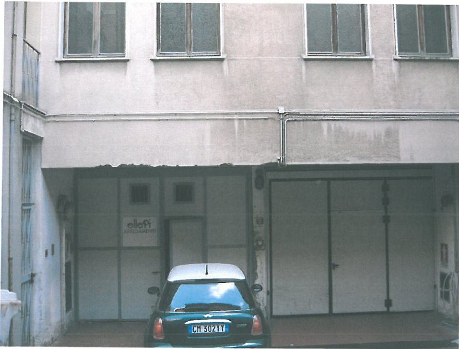
Vista interna (angolo via Carcano)