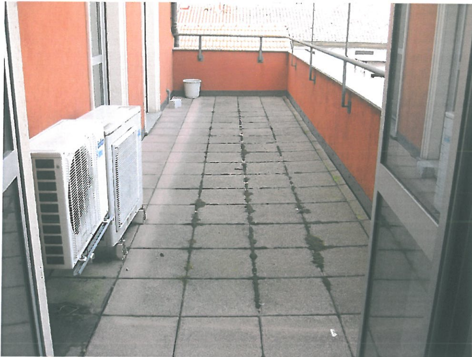
Vista su "Teatro di Varese" - Via Bizzozero