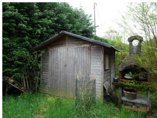
Vista esterna casetta in legno da giardino abusiva-non sanabile