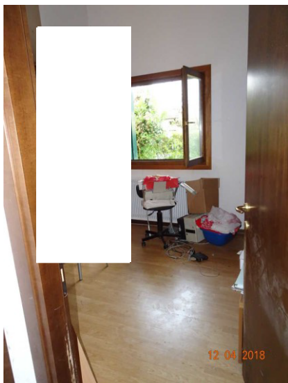
Particolare vista interna della prima camera