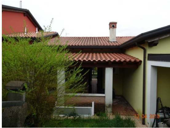
Ulteriore particolare abitazione lato Est