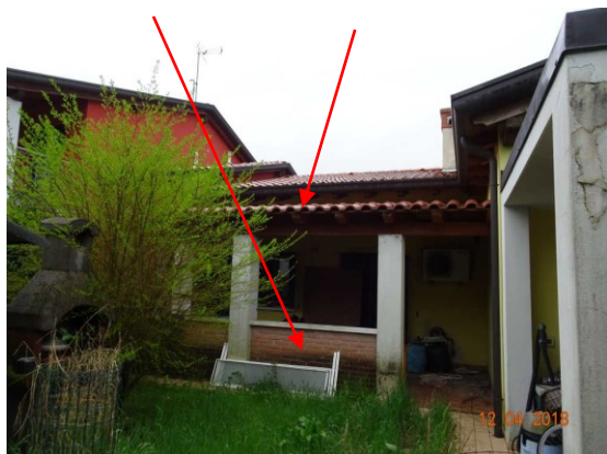
Vista esterna copertura abusiva sopra il portico-non sanabile e parapetto in muratura faccia a vista con altezza di ml 0.93 sanabile