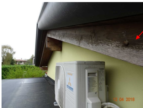
Vista degrado esterno della sporgenza del tetto in legno