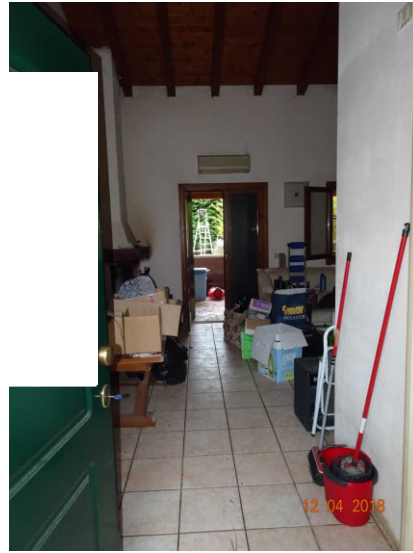
Particolare vista interna della zona ingresso