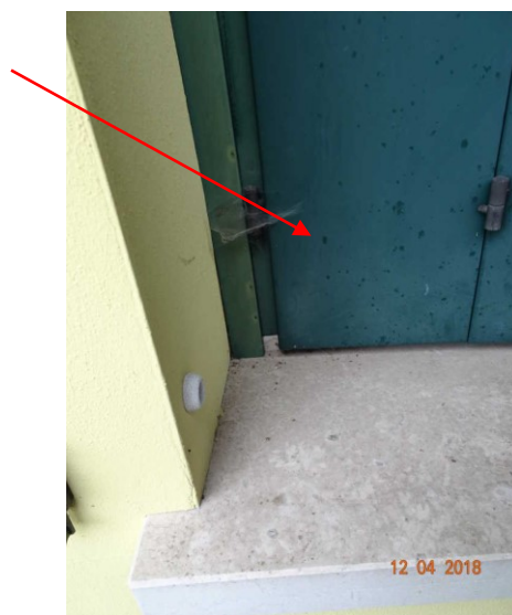
Vista degrado esterno dei balconi