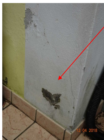
Vista degrado esterno base della muratura