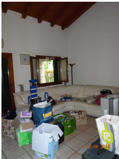
Particolare vista interna della zona soggiorno