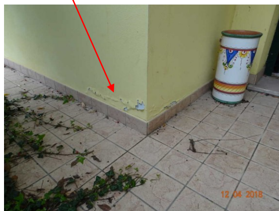
Ulteriore vista degrado esterno base della muratura