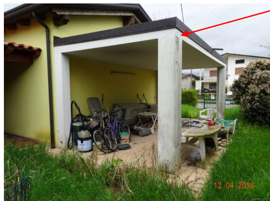
Vista degrado esterno dell'intonaco nella zona autorimessa aperta