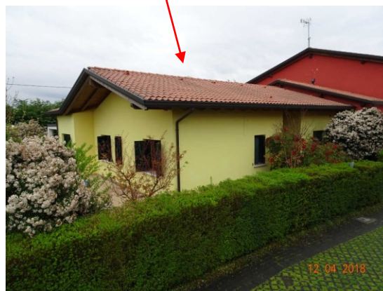
Particolare ingresso abitazione lato Nord-Ovest