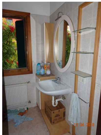
Particolare vista interna di un bagno