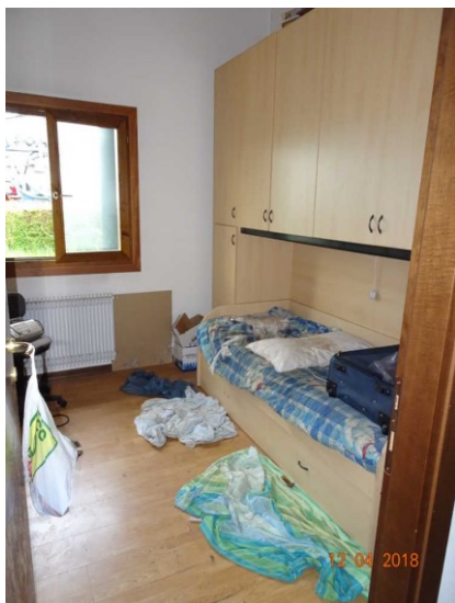
Particolare vista interna della seconda camera