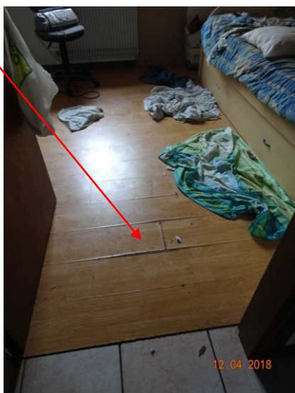
Vista degrado interno del pavimento di una cameretta