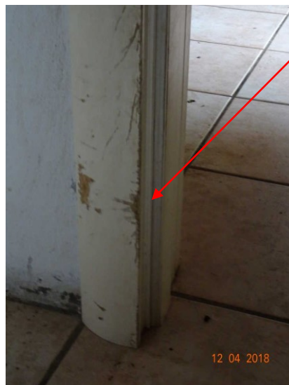
Ulteriore vista del degrado delle porte interne