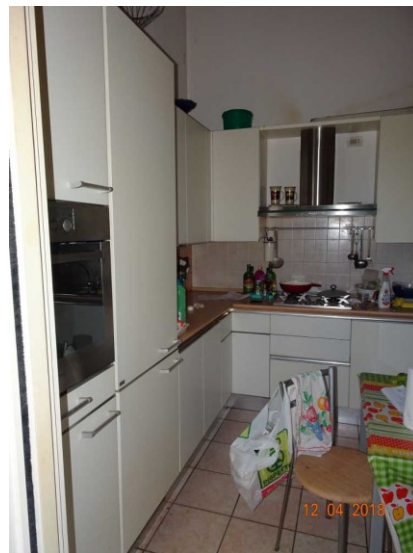
Particolare vista interna della cucina