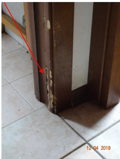
Vista del degrado delle porte interne