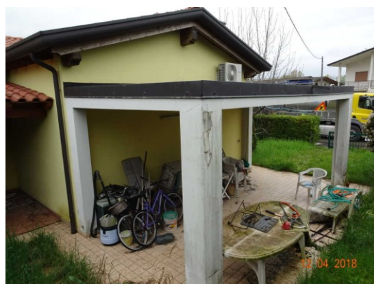
Particolare ingresso abitazione lato Est