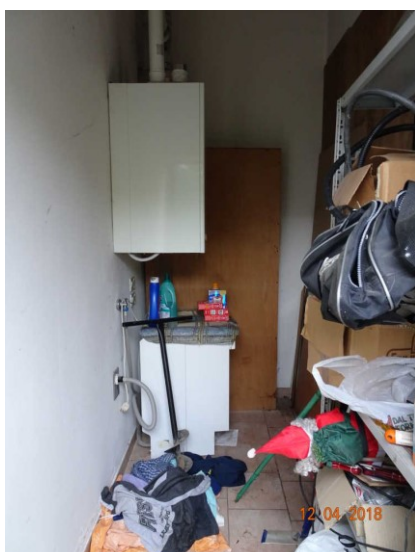
Particolare vista interna della c.t. - lavanderia