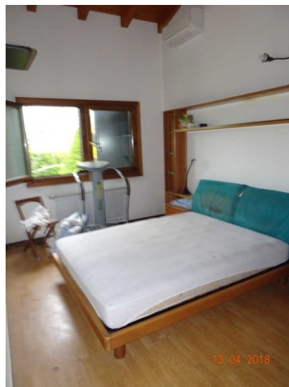
Particolare vista interna della terza camera