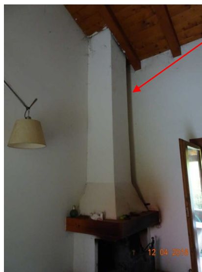
Vista interna della canna fumaria da sanare