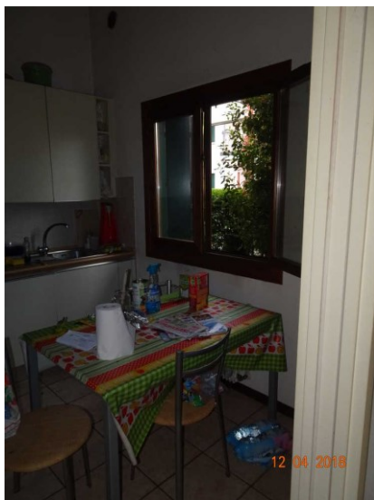
Ulteriore particolare vista interna della cucina