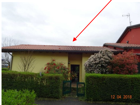
Particolare ingresso abitazione lato Ovest

fabbricato oggetto di esecuzione immobiliare