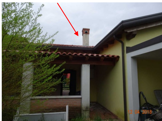
Vista esterna della torretta da sanare