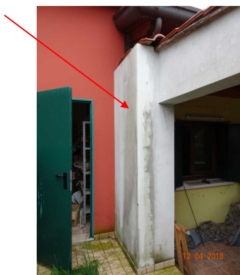
Vista esterna di una muratura sanabile nella zona portico