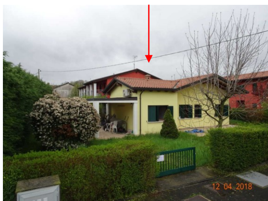
Particolare ingresso abitazione lato Nord