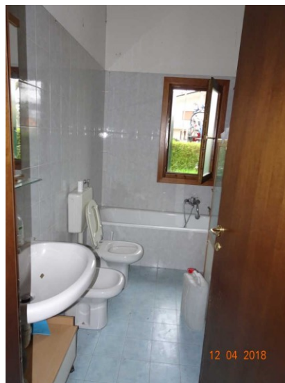
Particolare vista interna di un altro bagno