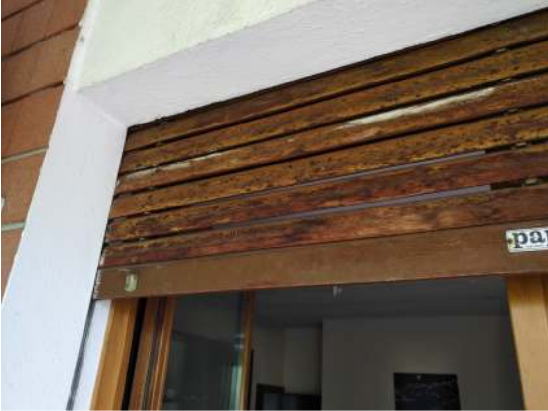
Foto n. 31– Esempi di carente manutenzione: tapparella del finello.

DOC. FOTOGRAFICA – Pordenone (PN) – via Revedole n. 13A – Lotto: 001 Appartamento.