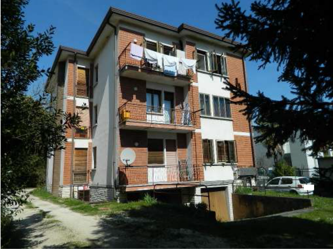
Foto n. 1– Condominio Quaglia con vista dalla carraia privata d'accesso (lato sud-est).

DOC. FOTOGRAFICA – Pordenone (PN) – via Revedole n. 13A – Lotto: 001 Appartamento.