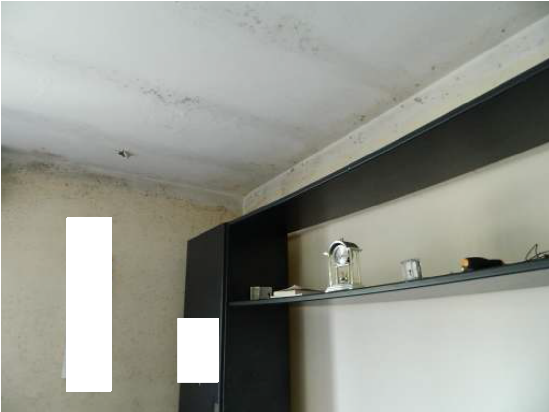
Foto n. 34 – Problematichite relative ad umidità e sviluppo di muffe.