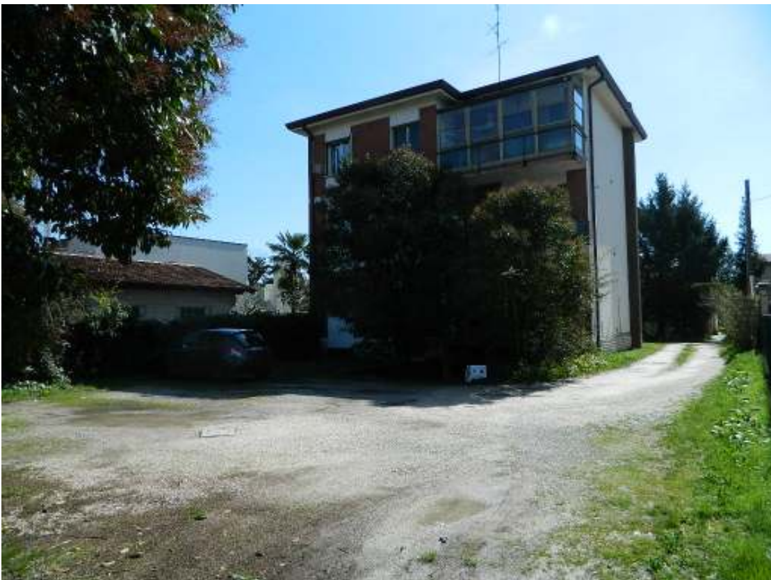
Foto n. 4 – Appartamento al piano secondo, oggetto di esecuzione.