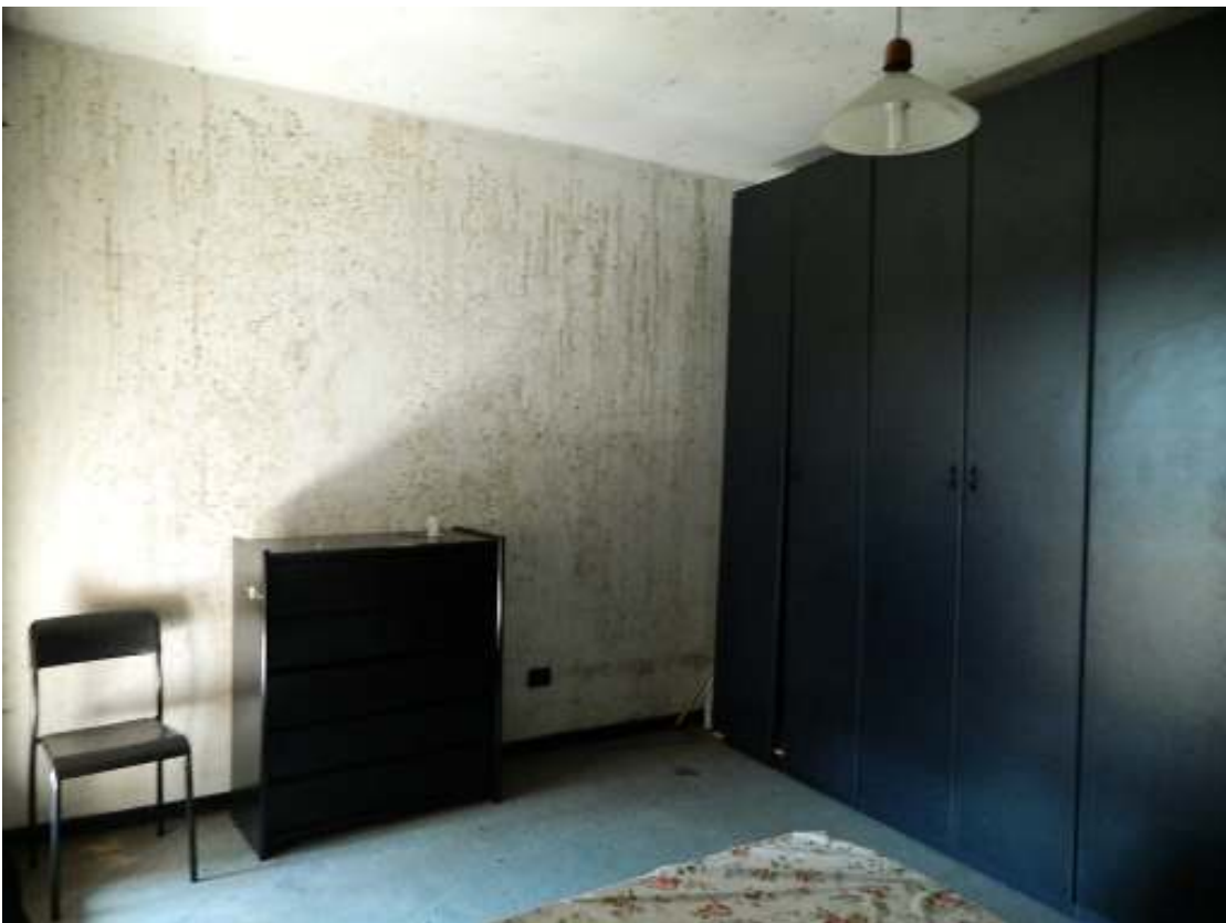
Foto n. 18 – Camera, con in evidenza problemi di umidità a soffitti e pareti.