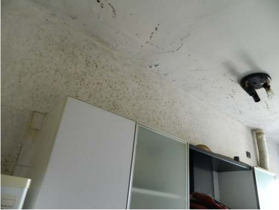
Foto n. 33 – Problematichite relative ad umidità e sviluppo di muffe.

DOC. FOTOGRAFICA – Pordenone (PN) – via Revedole n. 13A – Lotto: 001 Appartamento.