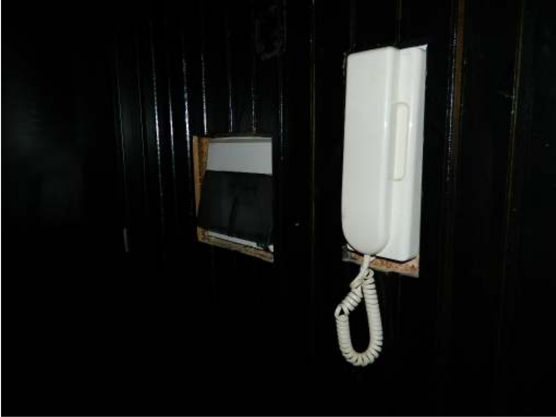
Foto n. 27 – Dettaglio posto interno citofono e quadro elettrico.

DOC. FOTOGRAFICA – Pordenone (PN) – via Revedole n. 13A – Lotto: 001 Appartamento.