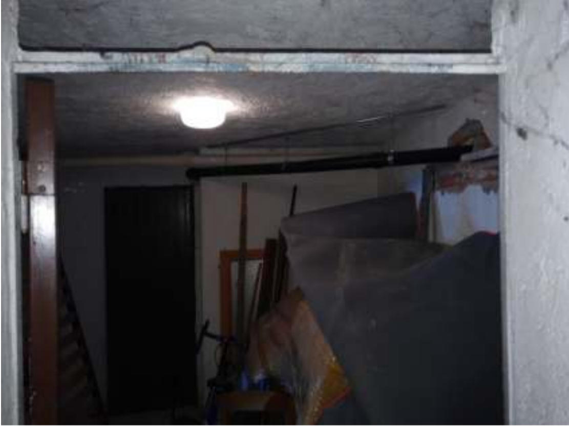
Foto n.29 – Disimpegno comune nell'interrato, con accesso alla cantina di pertinenza all'unità.

DOC. FOTOGRAFICA – Pordenone (PN) – via Revedole n. 13A – Lotto: 001 Appartamento.