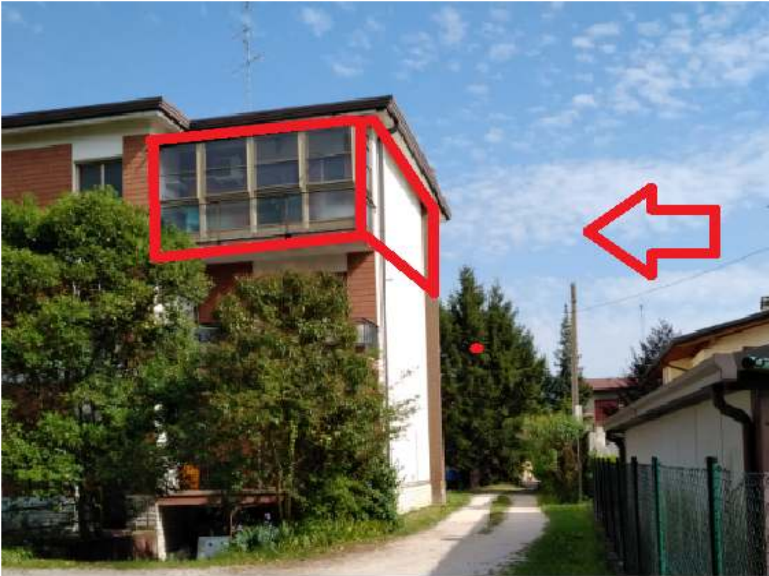
Foto n. 5 – Il Appartamento al piano secondo, oggetto di esecuzione.

DOC. FOTOGRAFICA – Pordenone (PN) – via Revedole n. 13A – Lotto: 001 Appartamento.