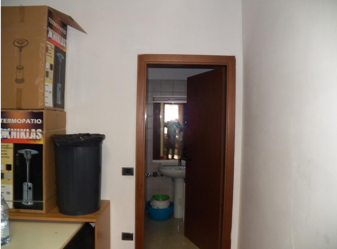
PIANO PRIMO “Locale di culto”