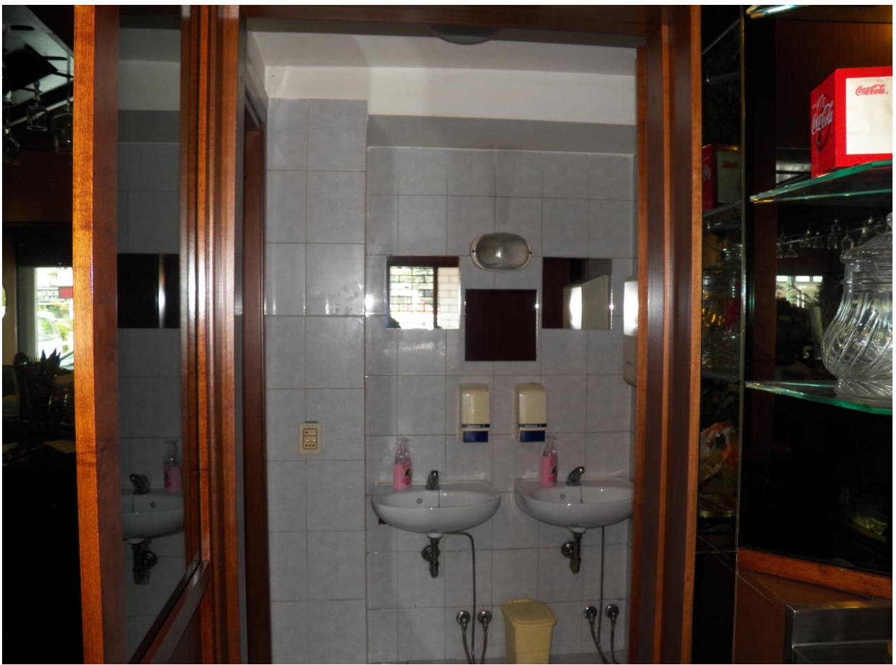
BAGNO AMERICAN BAR