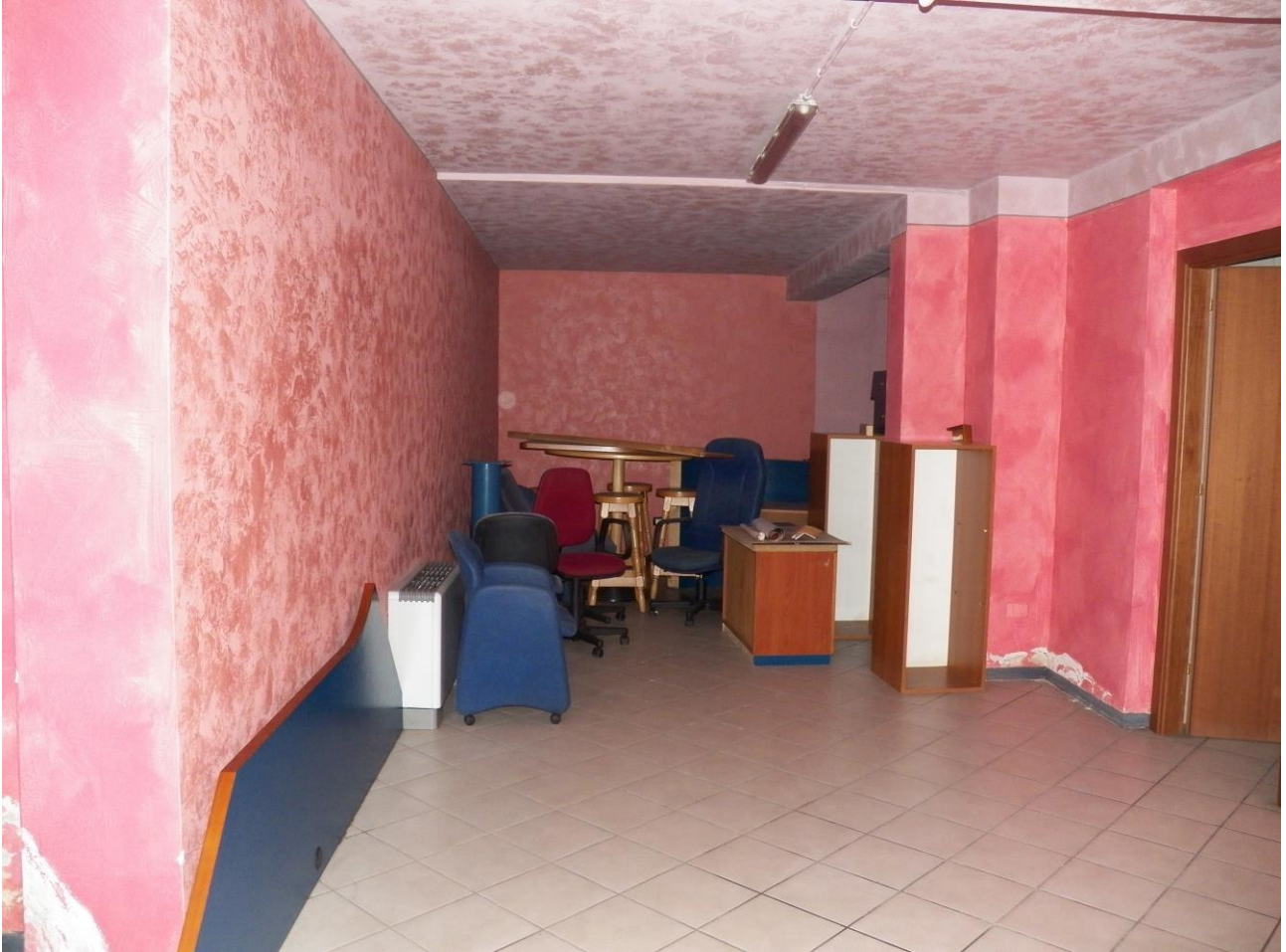
INTERNOPIANO S 1 GALAX BAR