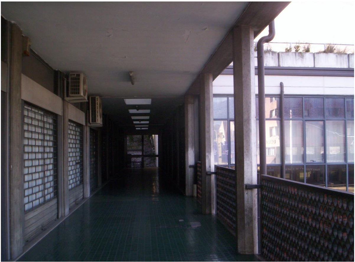
UFFICI SOTTO I PORTICI PIANO 1°