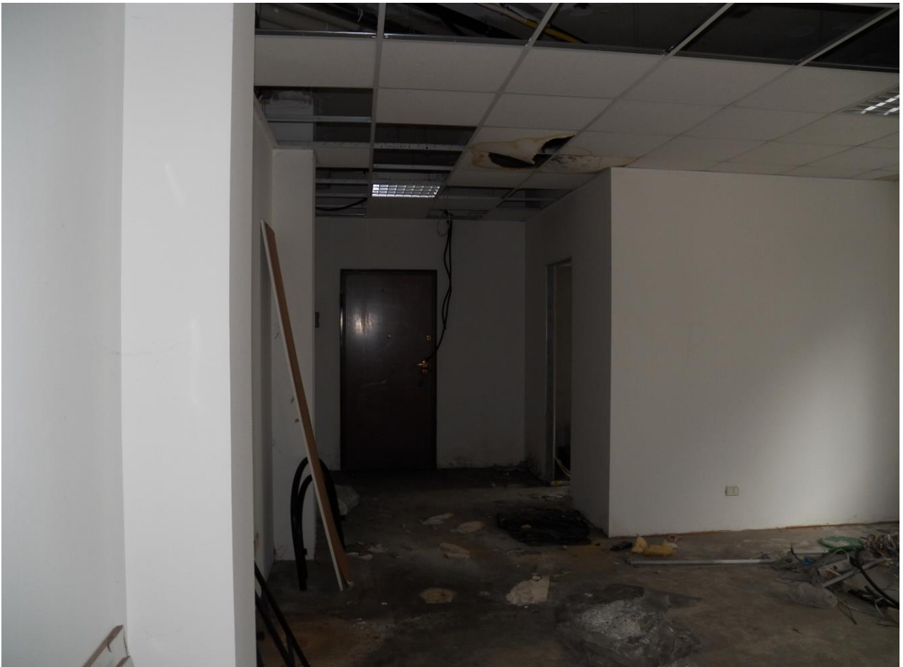
INGRESSO SUB 13 "EX RISTORANTE"