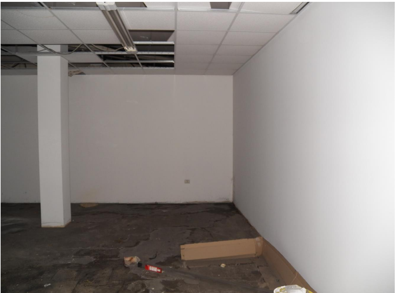
SUB 13 "EX RISTORANTE"