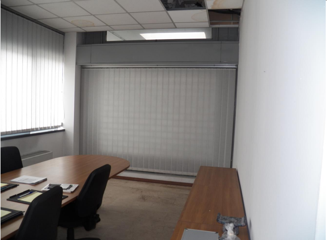
UFFICI PIANO PRIMO