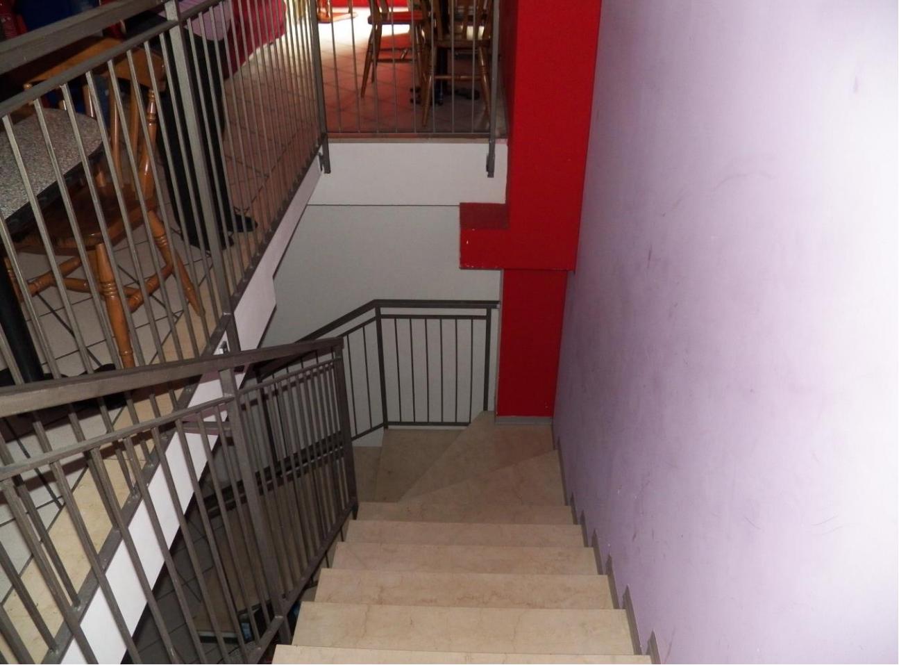
INTERNO GALAX BAR