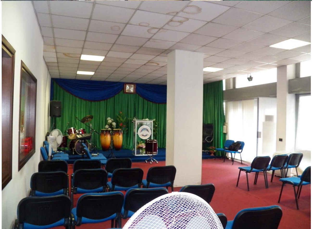
PIANO PRIMO "Locale di culto"