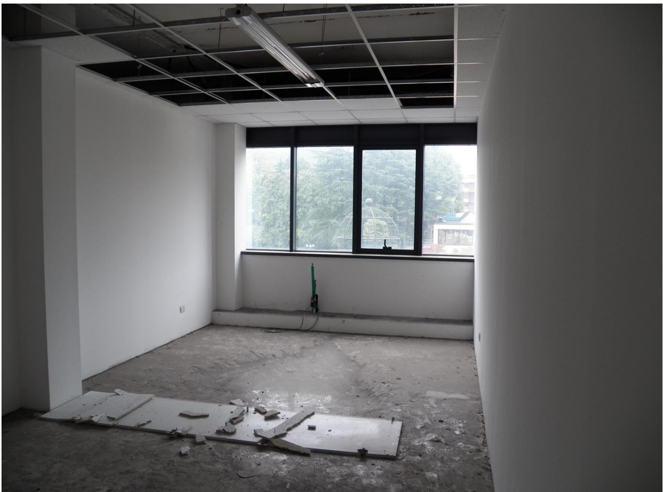
SUB 13 "EX RISTORANTE"