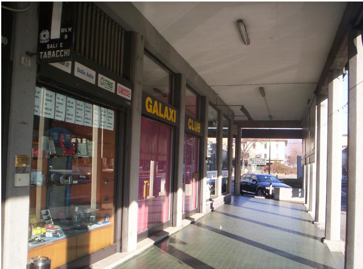
PIANO TERRA GALAXI CLUB