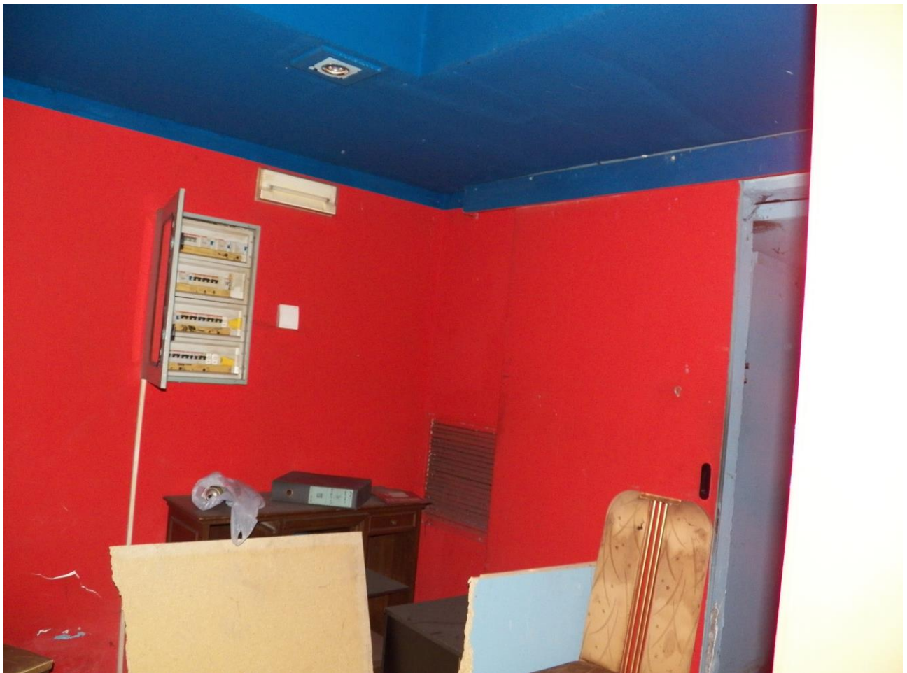
“ EX TAVERNA ”