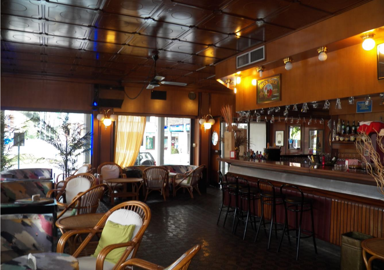
AMERICA BAR PIANO TERRA