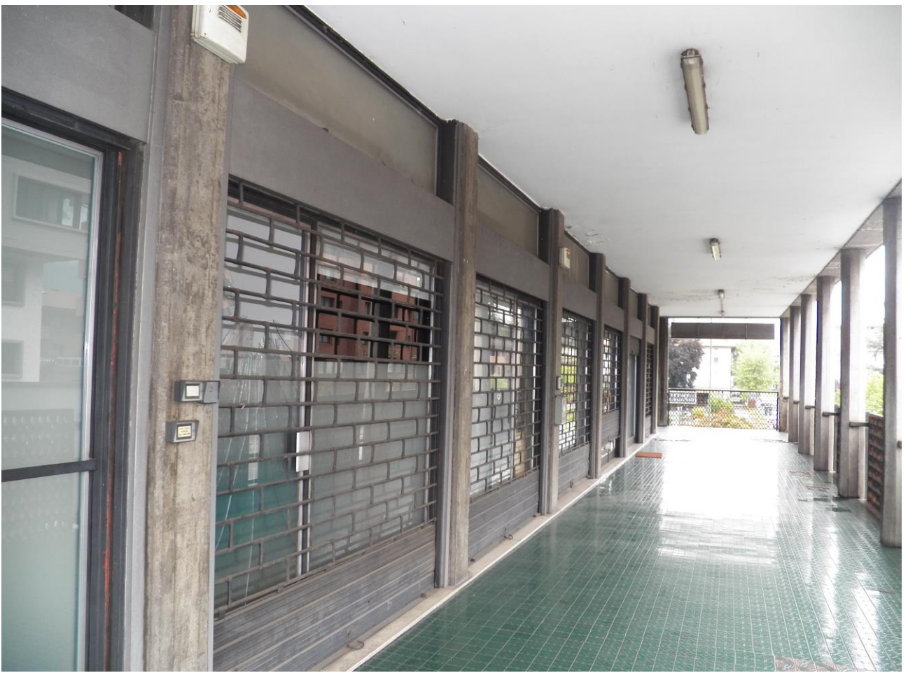
ESTERNO PRIMO PIANO