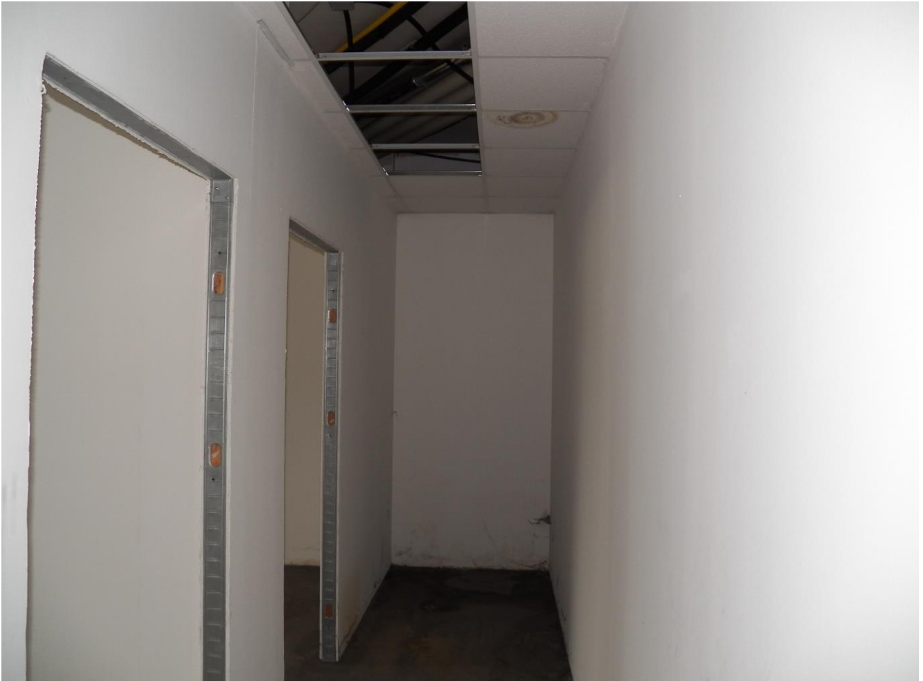
SUB 13 "EX RISTORANTE"