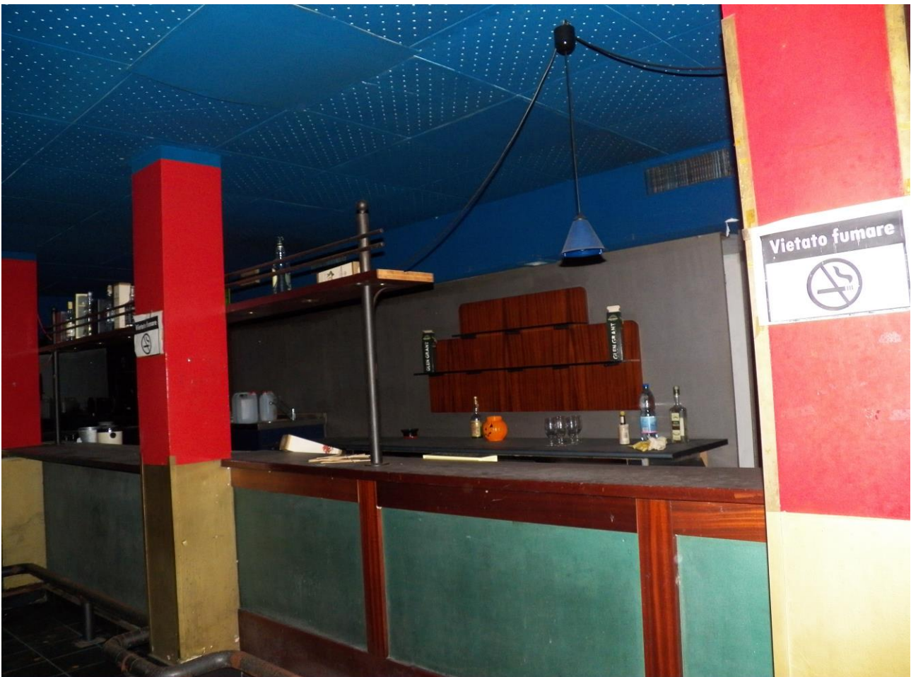
“ EX TAVERNA ”