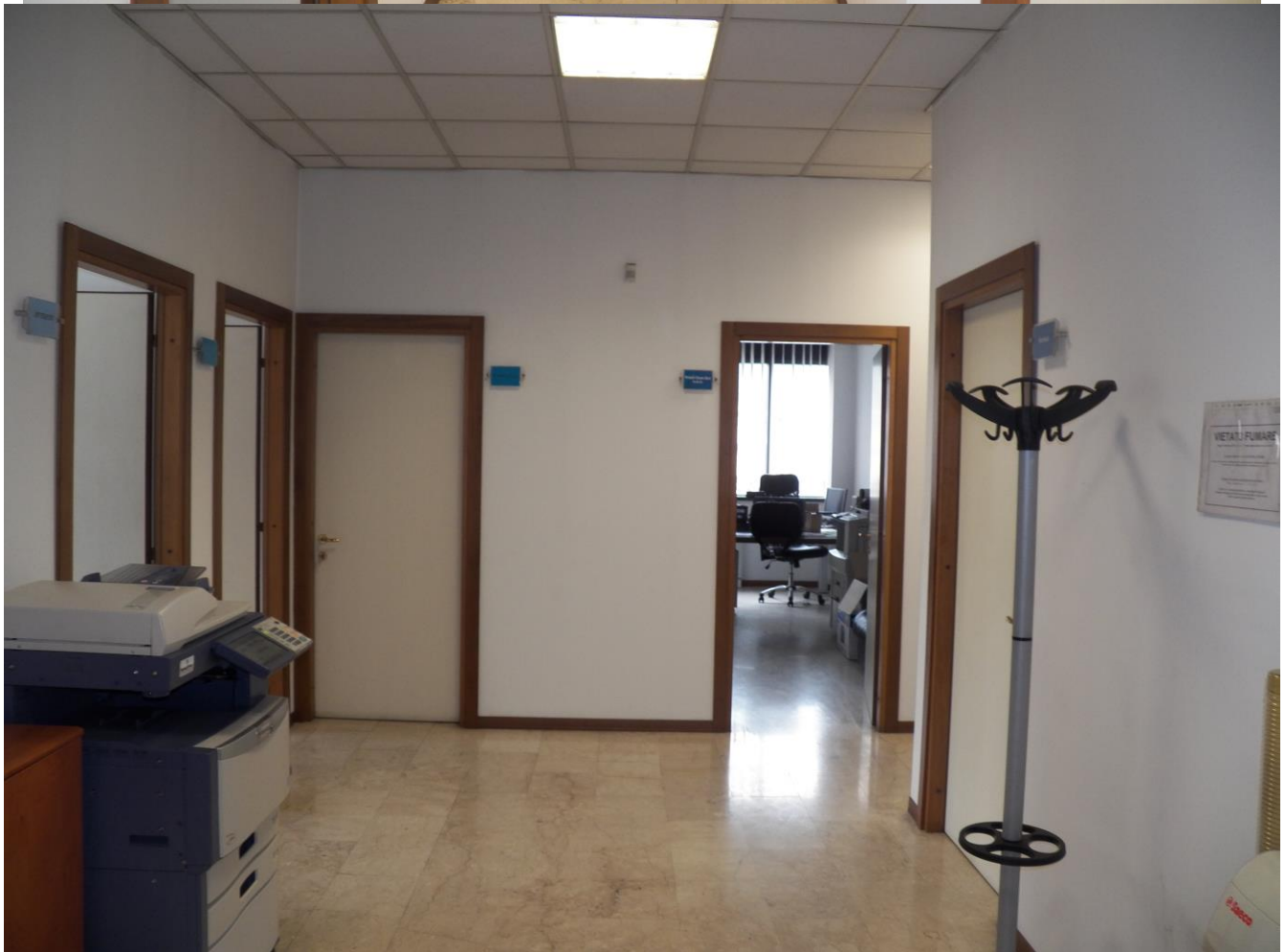
UFFICI PIANO PRIMO