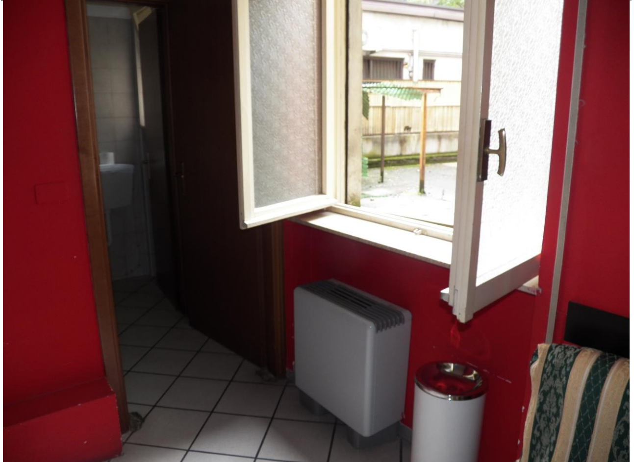
INTERNO GALAX BAR