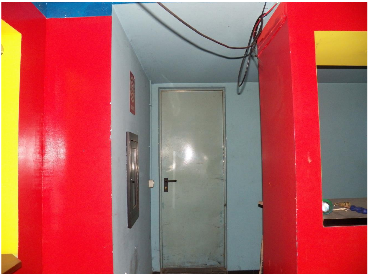
“ EX TAVERNA ”