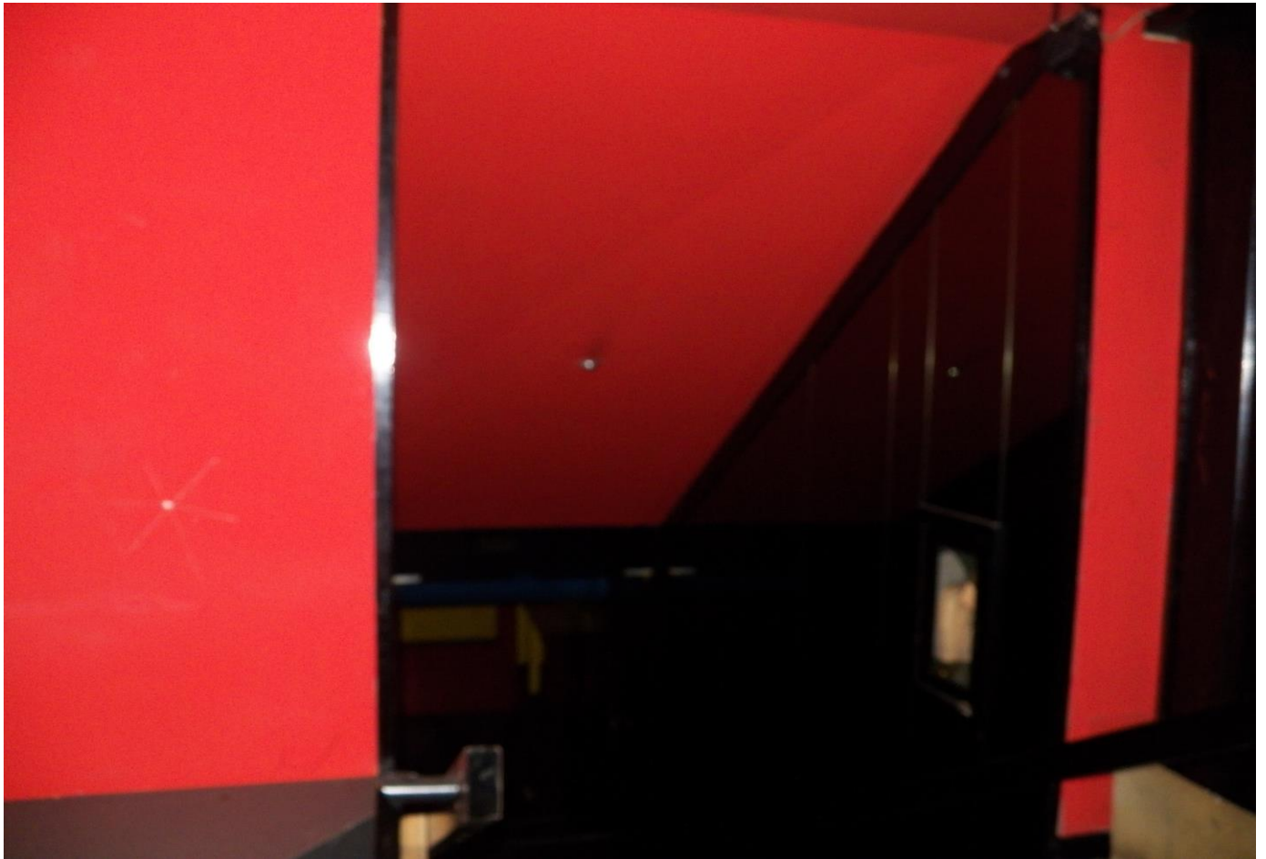
INGRESSO "EX TAVERNA"