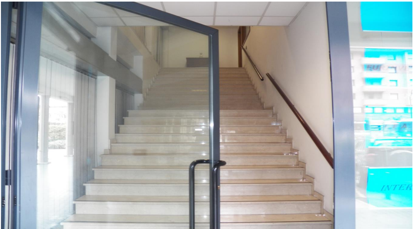
ESTERNO PARTE COMMERCIALE