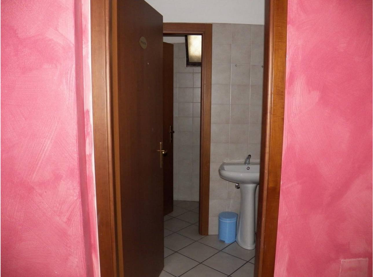
INTERNO PIANO S1 GALAX BAR