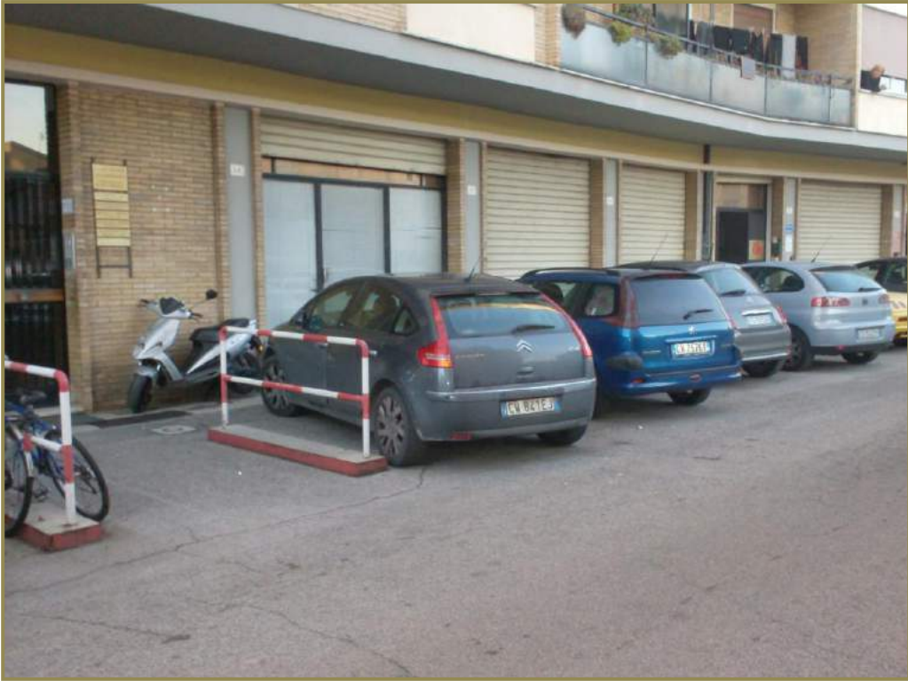
3-vista delle vetrine del locale da via Pola