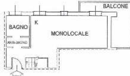
PIANTA PIANO PRIMO H.=2,70 m.