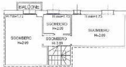
PIANTA PIANO SECONDO SOTTOTETTO H. MEDIA = 2,07 m.