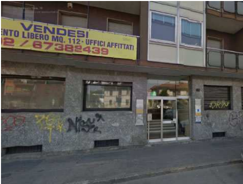
Foto satellitare. Ingresso palazzina condominiale

L'edificio condominiale, presenta struttura portante di pilastri e travi in c.a. e solai in latero - cemento; le murature di tompagno sono a cassetta dello spessore di 40 cm ed i tramezzi interni sono realizzati in forati dello spessore di 10 cm. I corpi scala condominiali presentano, anch'essi, struttura portante in c.a., così come i gradini ed i ballatoi di arrivo e di riposo; di pianta rettangolare, presentano rampe di 80 cm di larghezza; le alzate e le pedate, compreso i pianerottoli, sono rivestiti in marmo; le pareti dei corpi scala, compresi i solai, sono rifinite ad intonaco civile liscio e tinteggiati con idropittura di colore bianco; la ringhiera del corpo scala, è in ferro. L'atrio condominiale, presenta pavimentazione e pareti rivestiti in marmo, mentre il soffitto, risulta rifinito ad intonaco civile liscio e tinteggiato con idropittura di colore bianco. Sul lato portineria, la parete è rivestita con pannelli in legno. Il portone di ingresso dell'edificio, è formato da struttura in alluminio e vetro normale. I prospetti esterni del fabbricato condominiale, si presentano in discrete condizioni di conservazione e manutenzione, e risultano caratterizzati da un piano terra rivestito in marmo, mentre i piani superiori sono rifiniti ad intonaco ed idropittura per esterni intervallati da pannellatura in alluminio e vetro; le ringhiere dei balconi sono in ferro e vetro satinato.