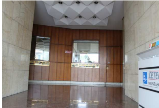
Foto n. 2. Atrio condominiale

L'immobile oggetto di valutazione, è costituito da un appartamento al piano nono e relativo terrazzo di pertinenza al piano decimo, facente parte del fabbricato condominiale sopra descritto, e con accesso di fronte per chi sale la scala condominiale. L'abitazione, allo stato attuale, è composto dal soggiorno, dalla cucina, dal vano ad uso lavanderia, dal ripostiglio, dal disimpegno, da tre bagni e da tre camere da letto, oltre ad un balcone e al terrazzo al piano superiore. E più precisamente, l'abitazione risulta così distribuita: dall'ingresso, si accede direttamente nel soggiorno, caratterizzato da un unico grande ambiente, mentre proseguendo a sinistra, si trova la camera da letto 1, il bagno 1 e la cucina (collegata a sua volta con il vano lavanderia). Tornando all'ingresso e continuando a destra, ci si immette nella zona notte, formata dalle camere da letto 2 e 3, dai bagni 2 e 3 e da un piccolo disimpegno. Attiguo all'ingresso, si trova il ripostiglio. Il soggiorno e le camere da letto 1 e 2, presentano un unico balcone, con affaccio su Via Melchiorre. L'appartamento, è collegato alle superfici terrazzate di pertinenza al piano decimo, mediante due scale