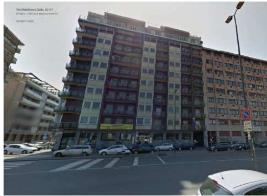
Foto satellitari. Fabbricato condominiale alla Via Melchiorre Gioia n. 72

L'edificio condominiale, presenta struttura portante di pilastri e travi in c.a. e solai in latero - cemento; le murature di tompagno sono a cassetta dello spessore di 40 cm ed i tramezzi interni sono realizzati in forati dello spessore di 10 cm. I corpi scala condominiali presentano, anch'essi, struttura portante in c.a., così come i gradini ed i ballatoi di arrivo e di riposo; di pianta rettangolare, presentano rampe di 80 cm di larghezza; le alzate e le pedate, compreso i pianerottoli, sono rivestiti in marmo; le pareti dei corpi scala, compresi i solai, sono rifinite ad intonaco civile liscio e tinteggiati con idropittura di colore bianco; la ringhiera del corpo scala, è in ferro. L'atrio condominiale, presenta pavimentazione e pareti rivestiti in marmo, mentre il soffitto, risulta rifinito ad intonaco civile liscio e tinteggiato con idropittura di colore bianco. Sul lato portineria, la parete è rivestita con pannelli in legno. Il portone di ingresso dell'edificio, è formato da struttura in alluminio e vetro normale. I prospetti esterni del fabbricato condominiale, si presentano in discrete condizioni di conservazione e manutenzione, e risultano caratterizzati da un piano terra rivestito in marmo, mentre i piani superiori sono rifiniti ad intonaco ed idropittura per esterni intervallati da pannellatura in alluminio e vetro; le ringhiere dei balconi sono in ferro e vetro satinato.