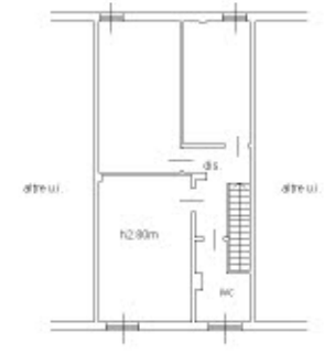
PIANTA PIANO TERZO